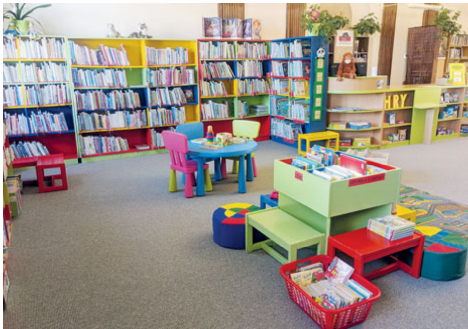
Oddělení lákající dětské čtenáře.

Na jaře tohoto roku připravila Knihovna Jana Drdy Příbram anonymní dotazníkové šetření, jehož cílem bylo zjistit, jak vnímají čtenáři a návštěvníci činnost a služby knihovny. Průzkum Knihovny Jana Drdy trval od 27. března do 31. května letošního roku a zúčastnilo se ho 657 osob různého věku, pohlaví nebo vzdělání. Dotazník byl koncipován tak, aby se o svůj názor mohli podělit registrovaní i neregistrovaní uživatelé, dospělí i čtenáři do 15 let.