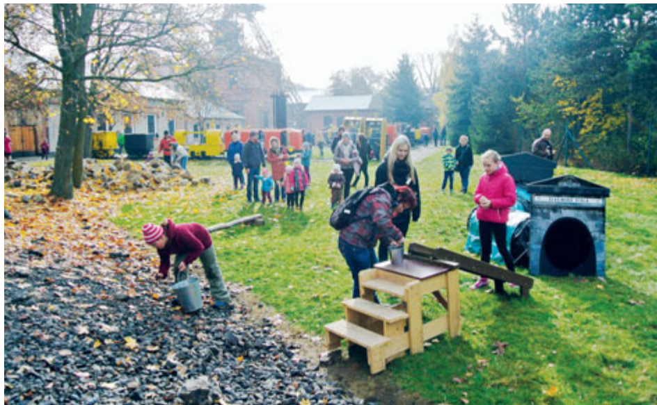
Z loňského Havířského šprýmování.

Hornické muzeum Příbram připravilo na říjen pestrý program, ve kterém si každý najde to své. Těšit se můžete na hornické pohádky v tajuplném podzemí, archeologický workshop, přednášku nebo celodenní zábavný program s hrami pro děti.