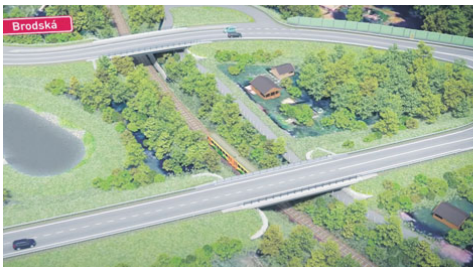
Vizualizace vedení cyklistické stezky z oblasti Nový rybník k Brodu.