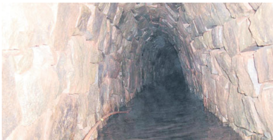
Florentinská štola ve Zdobůři.