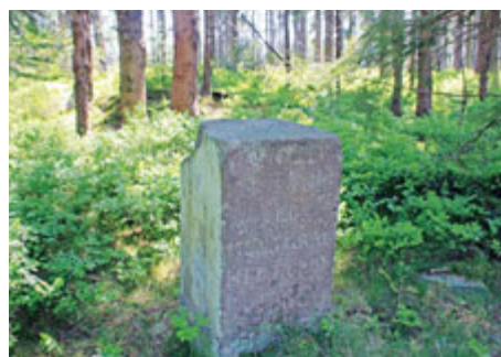
Malý Tok, vrchol - kamenný sloupek s datem 1862

Popisovaný horský hřeben patří k nejzajímavějším částem středních Brd, od jihu je přitom poměrně snadno přístupný. Vrchol Malého Toku, ač se jedná o třetí nejvyšší brdskou osmistovku, působí dosti nenápadně. Najdeme jej asi 100 m severně od rozcestí lesní cesty Tocké s další lesní cestou, vedoucí odtud k severu k lokalitě Na Pateráku a dále k vrcholu Na Koší. Jedná se o zalesněnou náhorní rovinu, kde najdeme jen triangulační tyč, kamenný sloupek s patrně latinským nápisem a datování 1862