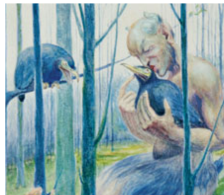
Alois Boháč, Ráno, akvarel, papír, kolem 1918.