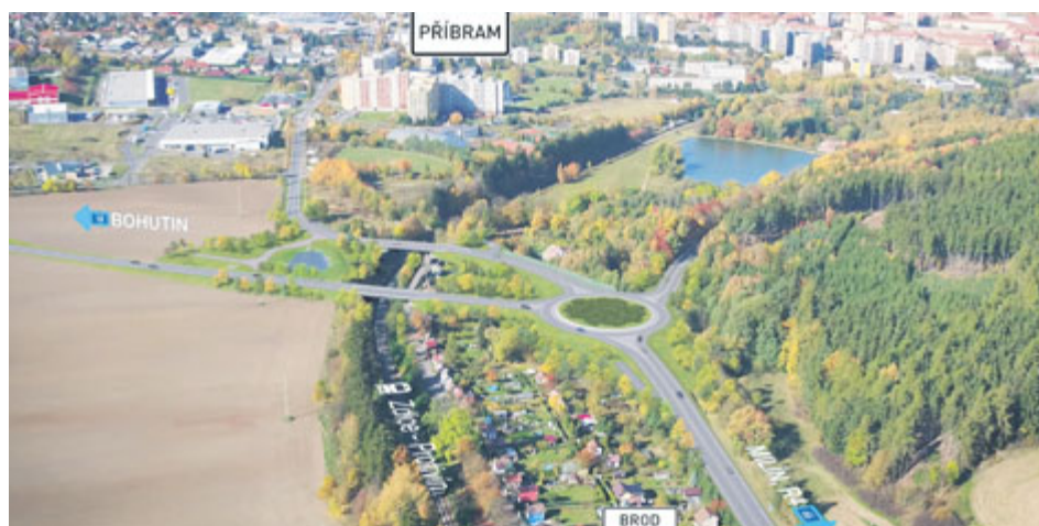
Vizualizace kruhového křížení v blízkosti Brodu.

Jihovýchodní obchvat města Příbram se posouvá k realizaci. Redakce Kahanu položila Ředitelství silnic a dálnic ČR, které je investorem, několik otázek. Odpovědi v rámci rubriky Rozhovor nejsou tentokrát personalizovány. Byly sestaveny „přípravným a realizačním týmem stavby ŘSD ČR“ za koordinace tiskového oddělení.