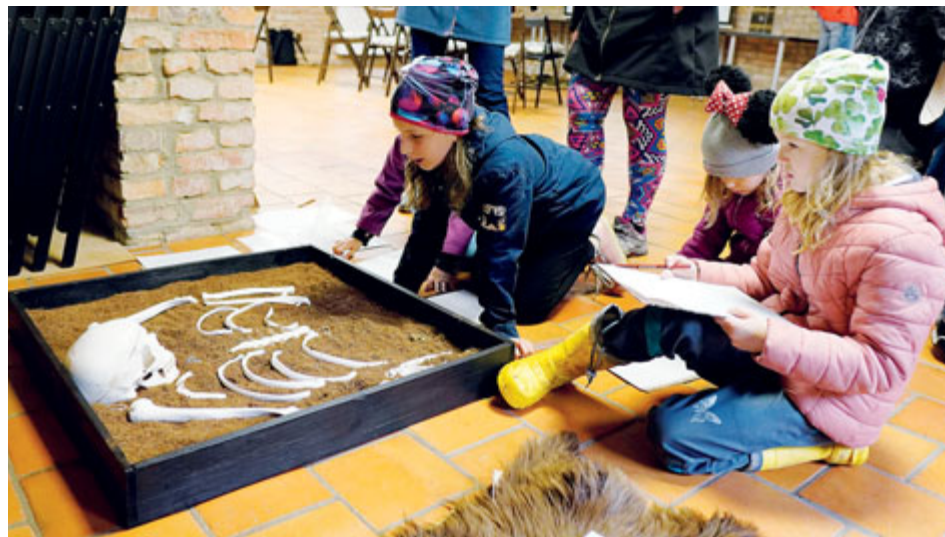
Na děti čeká dobrodružná archeologická výprava.

V neděli 22. října se v okolí Památníku Vojna, pobočky Hornického muzea Příbram, koná Běh