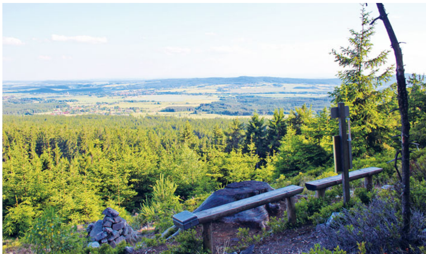
Vyhlička Malý Tok.

Nad obcí Nepomuk se prudce zvedá jeden z hlavních, zdaleka viditelných brdských hřebenů, od západu se vypínající mezi vrcholy Praha (862 m), Malý Tok (844 m) a stáječící se na sever k Hradišti (841 m), Brdcům (839 m) a končící v oblasti Boru. Severně za tímto hřebenem pramení řada vodotečí, například Voložný či Hradišský potok.