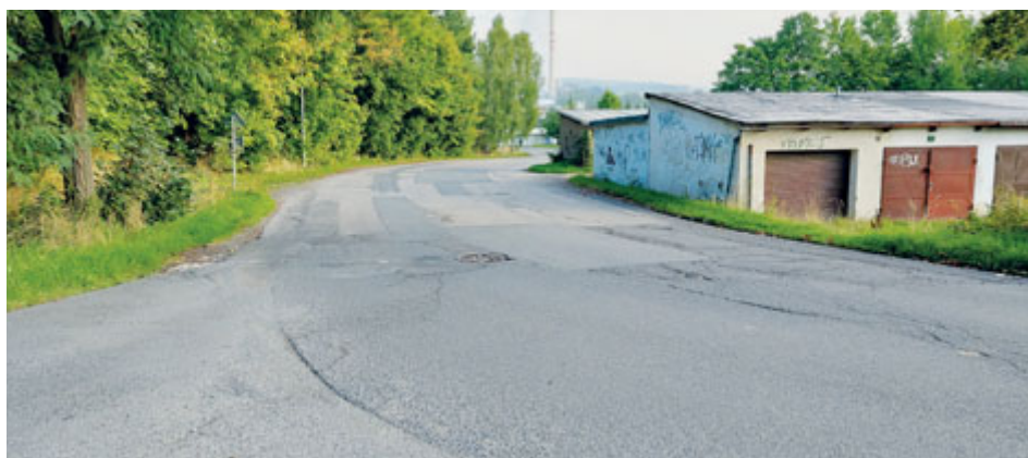
Nejčastěji se v Anenské chodilo po okraji silnice, od listopadu zde bude chodník.

Práce na komunikaci spojené s výstavbou nového chodníku v Anenské ulici si vyžádají dvouměsíční uzavírku této komunikace. Omezení se týká i autobusové dopravy.