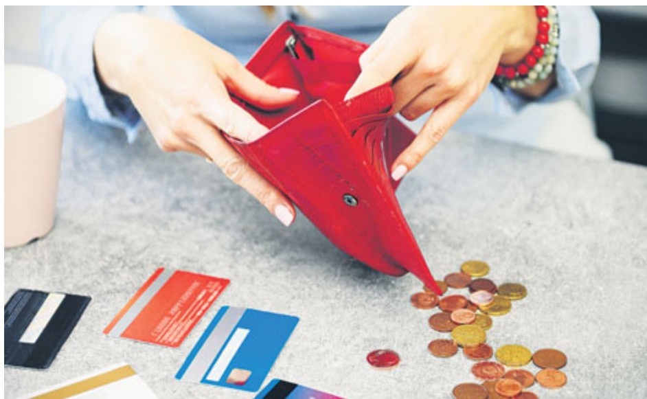
Novela insolvenčního zákona bude pro dlužníky zřejmě znamenat zkrácení délky oddlužení ze současných pěti let na tři roky.

Do konce listopadu letošního roku mohou lidé využít institut takzvaného Milostivého léta a zbavit se části dluhů. V této souvislosti jsme požádali o komentář dluhovou poradnu Člověk v tísni, která působí také v Příbrami.