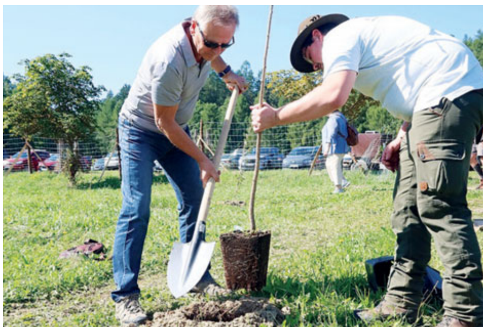
Brdské stromsázení je určeno pro širokou veřejnost, letos se zapojilo 6000 dobrovolníků.

Přes 6000 dobrovolníků dorazilo v sobotu 9. září do Jinců, aby se zapojilo do proměny lokality po zaniklé brdské obci Velcí. Na výzvu Vojenských lesů a statků na druhém ročníku akce Brdské stromsázení vysázeli na 2500 třešní, hrušní a jabloní.