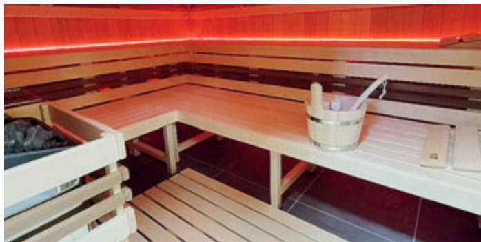
Pohled do prostoru sauny a odpočívárny.

Sauna v areálu Nový rybník, která vznikla v budově bývalé plavčíkárny, najela na běžný provoz. V týdnu slouží pro širokou veřejnost a o víkendech pro privátní nájem.