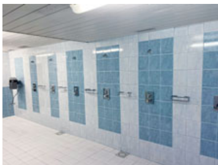
Součástí letních oprav byla také modernizace sprch.

Viditelné změny proběhly také v samotné bazénové hale, kde bylo odstraněno nefunkční dětské brouzdaliště a na jeho místě jsou nově