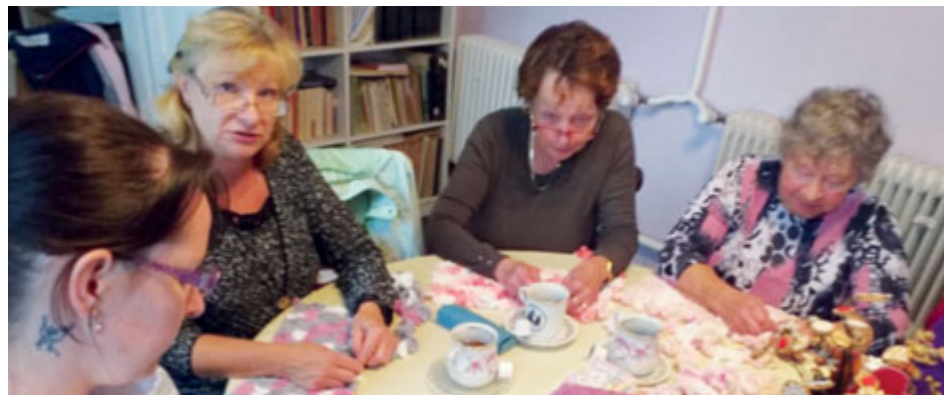
V Příbrami se zformovala skupina žen, neorganizovaný spolek pletářek, které baví ruční práce, a to nejen pletení, háčkování, ale i jiné tvořivé práce.