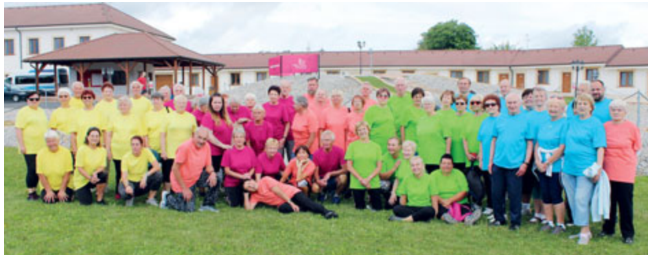
Olympiáda slouží k vytváření a podpoře komunity aktivních seniorů a budování pozitivní atmosféry pro navazování vzájemných kontaktů.

Od pátku 1. září do neděle 3. září se uskutečnil šestý ročník Olympiády pro seniory, kterou se příbramští senioři vydali strávit v Nesuchyni u Rakovníka.