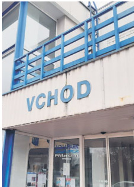
Jaké je východisko ze současné situace ohledně aquaparku?

Záříjové zastupitelstvo mělo na programu bod, který se týkal aquaparku. V současné fázi se řeší možnost vybudovat menší aquapark na místě současného venkovního bazénu (tzv. varianta G, o dalších variantách rekonstrukce psal Kahan 5/2023). Zastupitelé se většinou přiklonili k návrhu, aby k této variantě byla zpracována komplexní studie proveditelnosti. Všechny zastupitelské kluby jsme požádali o komentář. Uvádíme odpovědi klubů, které na otázku zareagovaly, a to v abecedním pořadí od A k Z.