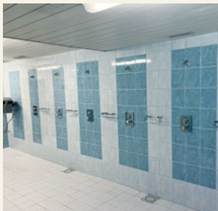
Letos se otevřel park Valle di Ledro, začala stavba parkovacího domu či rekonstrukce lávek přes Příbramský potok. Byla provedena také modernizace části interiéru aquaparku, který ale na svou kompletní přestavbu stále čeká.