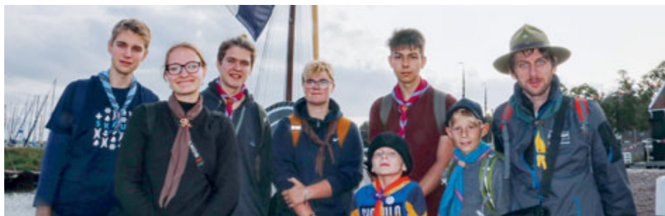
Příbramští skauti se vydali za svými kolegy do partnerského města Hoorn.

Skautský výlet do Nizozemí? Ano, čtete správně! My, parta pěti roverů, jsme se v září pod dohledem zkušeného vedoucího vydali do partnerského města Příbrami, nizozemského Hoornu. Angličtinou nejistí jsme vyrazili objevovat krásy nové země.