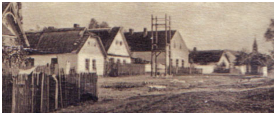
Náves v Brodě s kaplí v pravé části fotografie. Nedatováno.

V letošním roce si obyvatelé Brodu, který náleží k městu Příbram, připomínají 100 let od vysvěcení kaple. Hlavní část oslav se uskuteční v neděli 3. prosince.