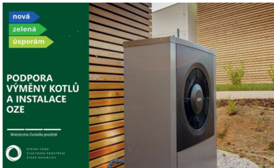
Vizuály kampaní v rámci programů Nová zelená úsporám.

Kotlíkové dotace, Nová zelená úsporám, Nová zelená úsporám Light či Oprav dům po babičce. To jsou hlavní možnosti veřejné podpory pro domácnosti, které chtějí uspořit na účtech za energie a současně svou měrou přispět k ochraně životního prostředí.