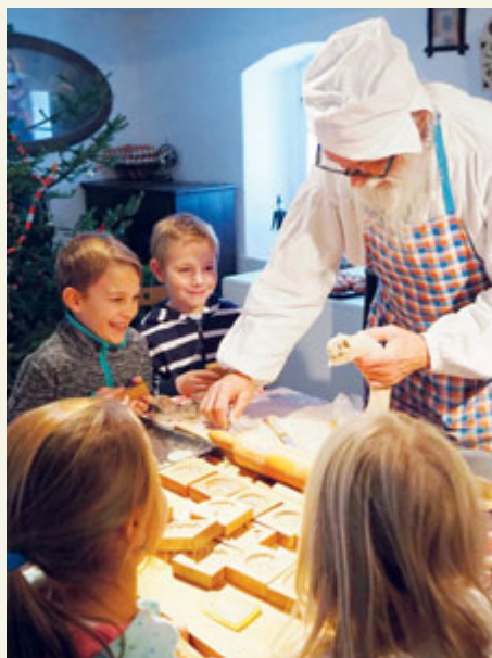
Vánoce v hornickém domku.

V závěru letošního roku čeká návštěvníky Hornického muzea Příbram bohatý program s vánoční tematikou. A to nejen v samotné Příbrami, ale také ve Skanzenu Vysoký Chlumeck, který je pobočkou zdejšího muzea.