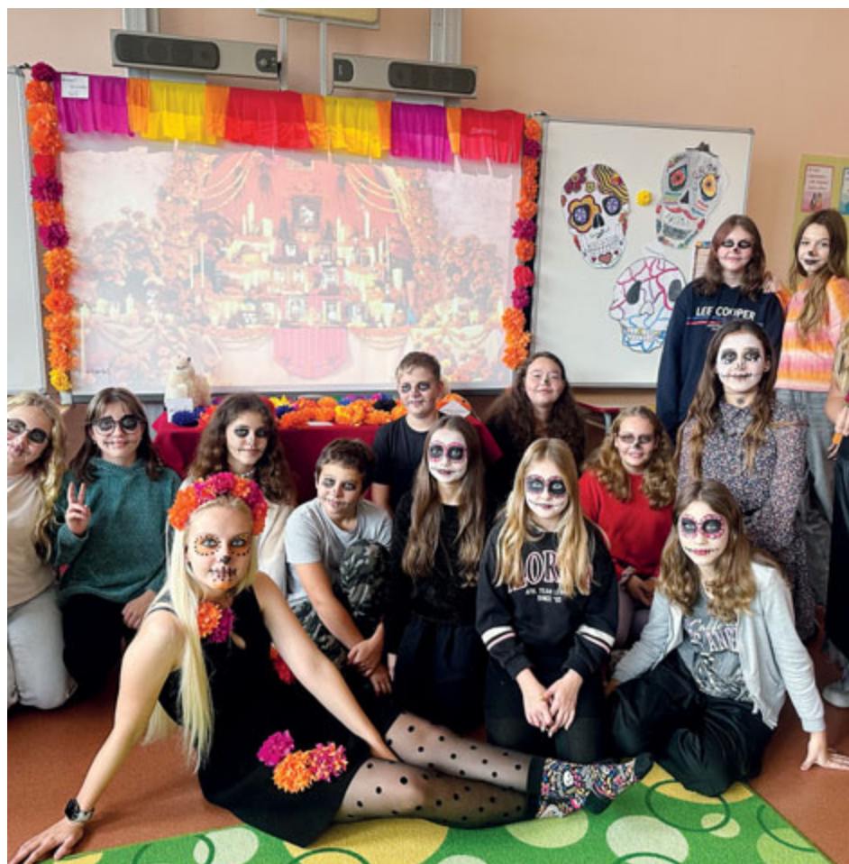
Na začátku listopadu se jazyková učebna na ZŠ pod Svatou Horou proměnila v mexické „cementerio“ (hřbitov) a ožila tradiční mexickou výzdobou.

Přelom října a listopadu se po celém světě nese v duchu vzpomínání na zesnulé blízké. V Čechách tento den známe jako Památku zesnulých neboli Dušičky, kdy v tichosti vzpomínáme, zapalujeme svíčky a pokládáme květiny na hroby těch, kteří už nejsou mezi námi. V anglosaském světě se tento svátek nazývá Halloween. Děti se oblékají do strašidelných kostýmů, chodí od domu k domu a koledují sladkosti. Vyřezávají se dýně a zapalují svíčky. Typické jsou také čarodějnice, pavučiny, pavouci, černé kočky, strašidla a duchové. V současnosti spousta českých rodin tuto tradici převzala, a znaky Halloweenu jsou k vidění i v našem okolí. Co u nás ale už tolik rozšířené není, jsou oslavy ve stylu Día de Muertos.