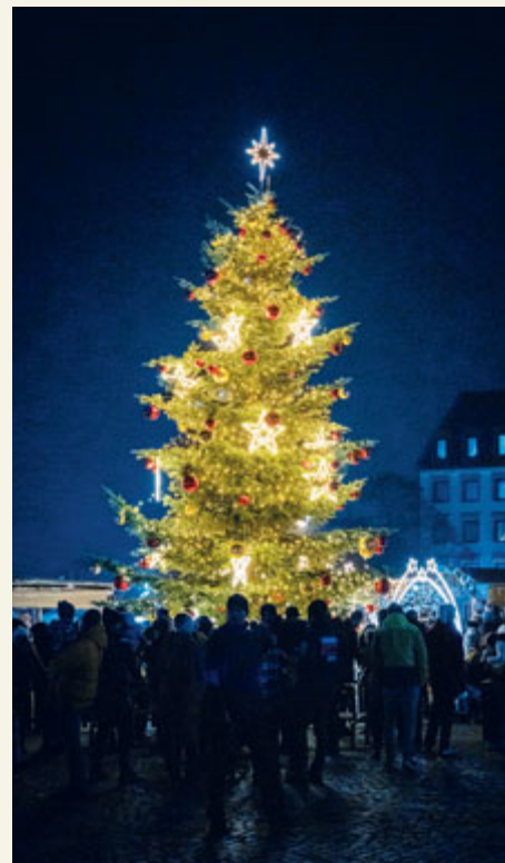
I letos začíná advent na náměstí T. G. Masaryka.

Od pondělí 18. prosince do pátku bude na náměstí 17. listopadu kromě stabilních stánků připraveno také vánoční pódium. Každý den