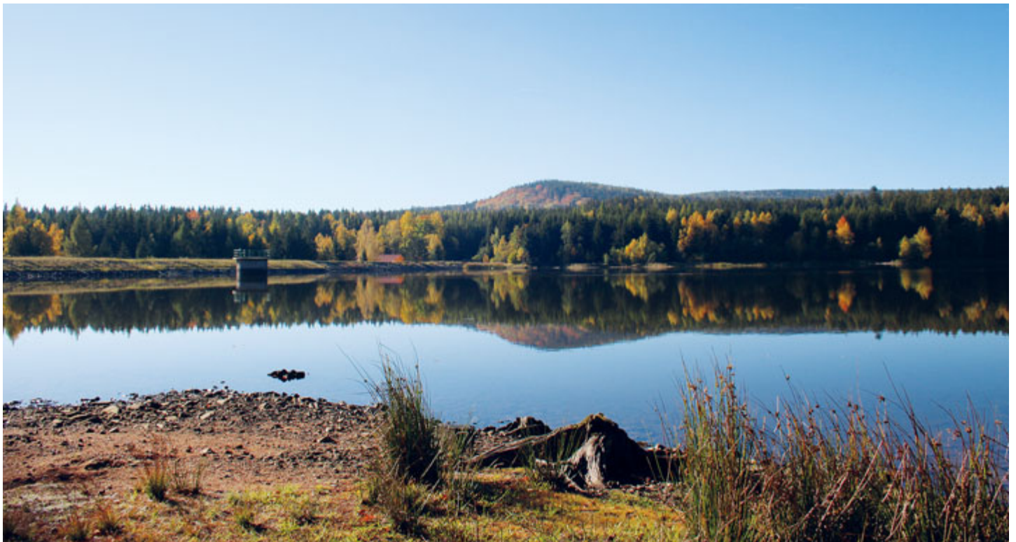
Podzimní Octárna, v pozadí vrchol Kloboučku.

Ze zalesněných svahů nejvyšší hory Brd Toku (865 m) a sousedního Houpáku (794 m) sbírá sílu Obecnický potok (dříve zvaný Čepkovský). Nejprve protéká malým umělým rybníčkem (Nádržka pod Tokem), ležícím při historické transbrdské stezce zvané Aliance, mohutní četnými přítoky, aby pak dospěl do jedné z velkých brdských vodních ploch – obecnické Octárny. Pod hrází rybníka kdysi stávala továrnička na výrobu octa, odtud původní název.