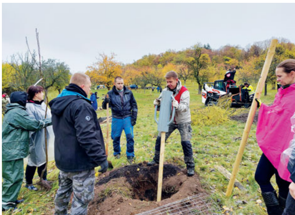
Na začátku listopadu zaměstnanci Městského úřadu Příbram a společností Drupol, 1. SčV a Tesco pod vedením spolku Svatohorské sady Příbram a Sázíme stromy obnovili další část svatohorského sadu u Svatohorské aleje.

Do péče o sad je možné se zapojit také individuálně. Na jaře byl spuštěn projekt #Adoptuj-