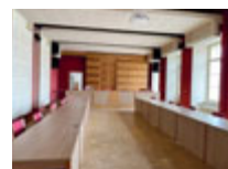
korun. Ceny jsou včetně DPH;