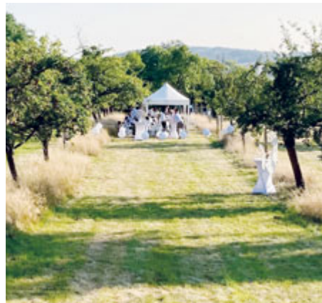
Svatba ve Svatohorském sadu.

Díky grantovému programu Škoda stromky společnosti Škoda Auto bylo letos vysazeno několik desítek nových stromků. Společnost