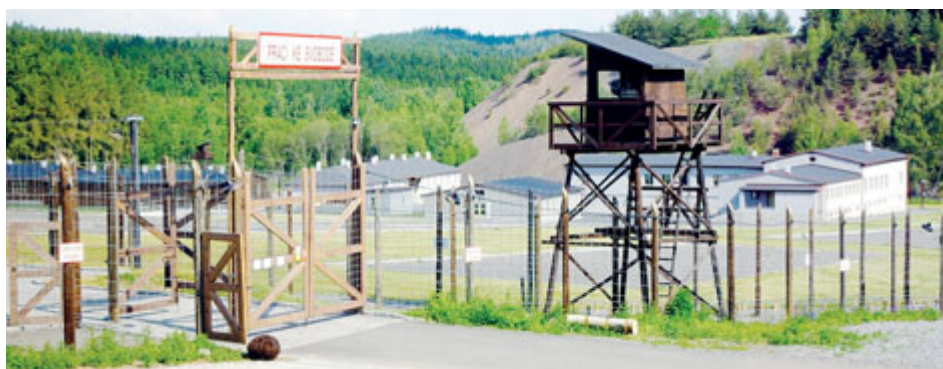
Vstupní brána do Památníku Vojna.

Hornické muzeum Příbram již také chystá předvánoční program, který potěší děti i dospělé. V pobočce Muzeum zlata Nový Knín bude