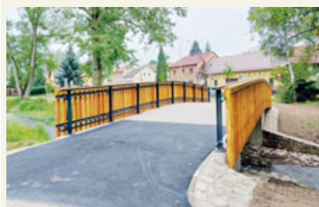
Lávka u Čekalíkovského rybníka a nového Parku Valdi Ledro.