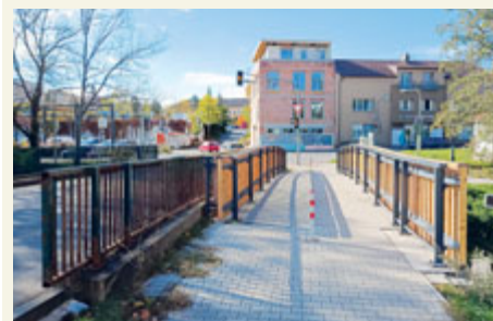
Lávka ve Špitálské byla již v havarijním stavu, a tedy uzavřena pro veřejnost.

byl po více odkladech termínu dokončení zprovozněn v roce 2023.