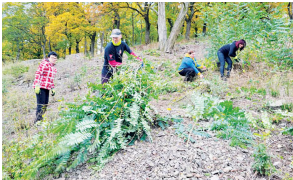
Obnova sadů stojí na práci dobrovolníků a pomoci firem a města.

Proměna Svatohorských sadů pokračuje i letos. Díky dotacím, práci dobrovolníků, spolku Svatohorské sady Příbram, podpoře města Příbram a spolupráci se soukromými firmami se do sadu postupně vrací život.