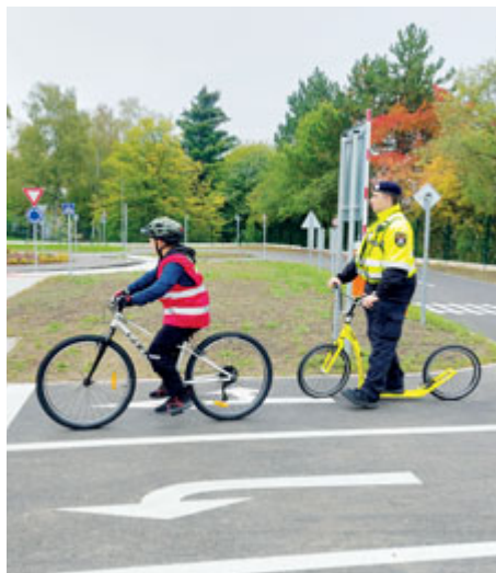
Výuka na novém dětském hřišti.

Městská policie Příbram ve spolupráci s organizací Besip letos zahájila rozsáhlý program dopravní výchovy pro příbramské žáky. Kromě teoretické výuky o pravidlech silničního provozu se děti měly možnost učit i prakticky na nově zrekonstruovaném dětském dopravním hřišti.