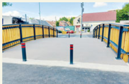
V červnu 2024 byla předána do užívání lávka pro pěší na Rynečku.