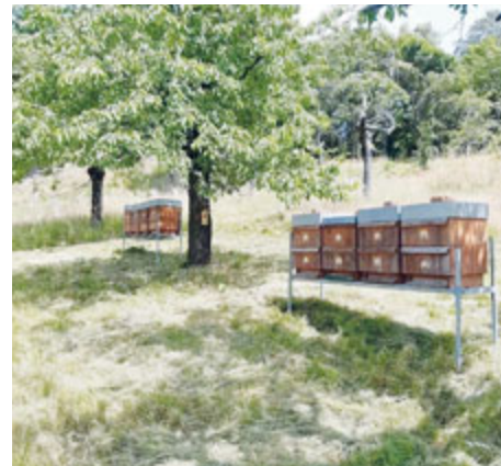
Novinkou jsou včelí úly.

V příštím roce by se spolek chtěl zaměřit na postupnou obnovu a zabezpečení místního