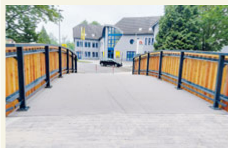
Můstek pro pěší na Flusárně byl mnoho měsíců zavřený.