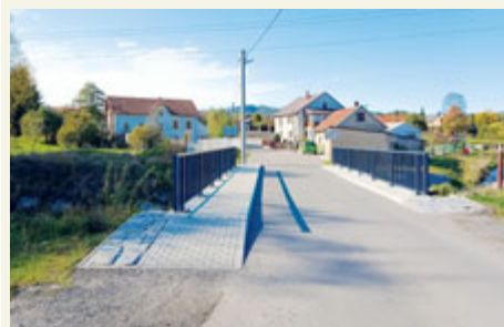
Nový most spojuje Březové Hory a Staré Podlesí.