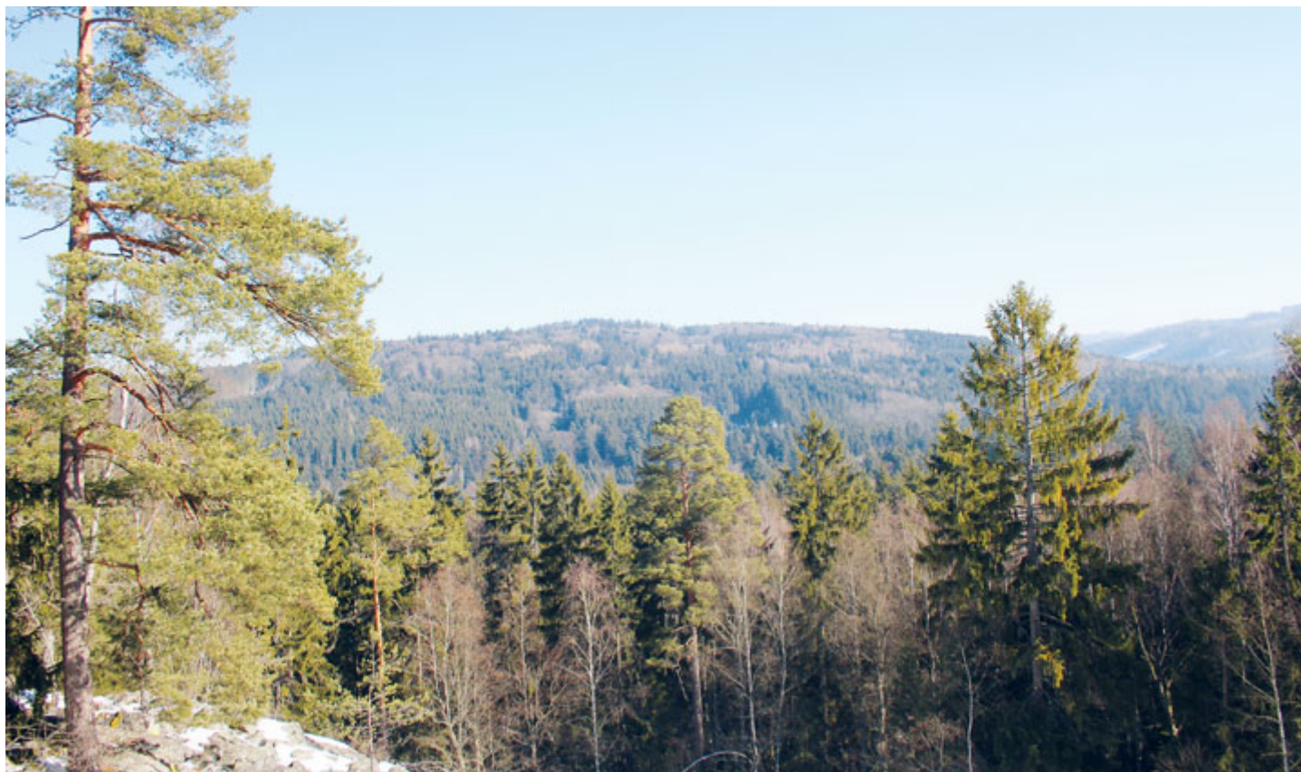
Pohled z Třítrubecké vyhlídky.

Jihozápadně od brdského loveckého zámečku Tři Trubky, něco přes 400 m vzdušnou čarou, se svažuje rozsáhlé a strmé kamenné pole. Na jeho vrcholu najdeme místo s opravdu pěkným rozhledem, nazývá se Třítrubecká vyhlídka (599 m).