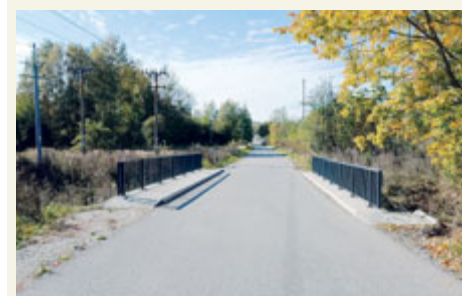
Nosnost mostu v Plynárenské se zvýšila na 32 tun.