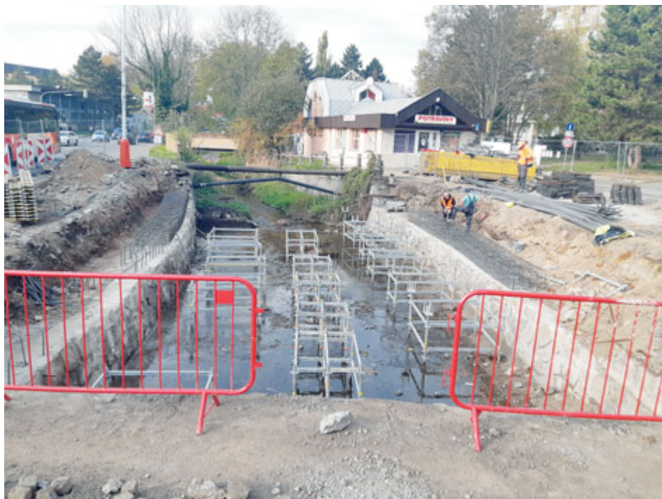
Aktuálně probíhá velká rekonstrukce mostu v Březnické ulici.

Rekonstrukce mostů a lávek v Příbrami nabraly na intenzitě od roku 2020, kdy město obdrželo nepříznivé výsledky mostních prohlídek. Po více než čtyřech letech se blíží závěr obnovy nejkritičtějších mostů, včetně nejfrekventovanějšího mostu na Rynečku.