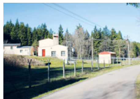
Cesta kolem vojenského areálu Amerika

je instalován Dům přírody Brd. Těsně před ním odbočkou vpravo po žluté pěšky (nevhodné pro cyklisty) vystoupáme k rozcestníku, který nás odbočkou ze žluté dovede k vyhlídce. Třítrubecká vyhlídka se nám za tu trochu námahy rozhodně dokáže bohatě odměnit.