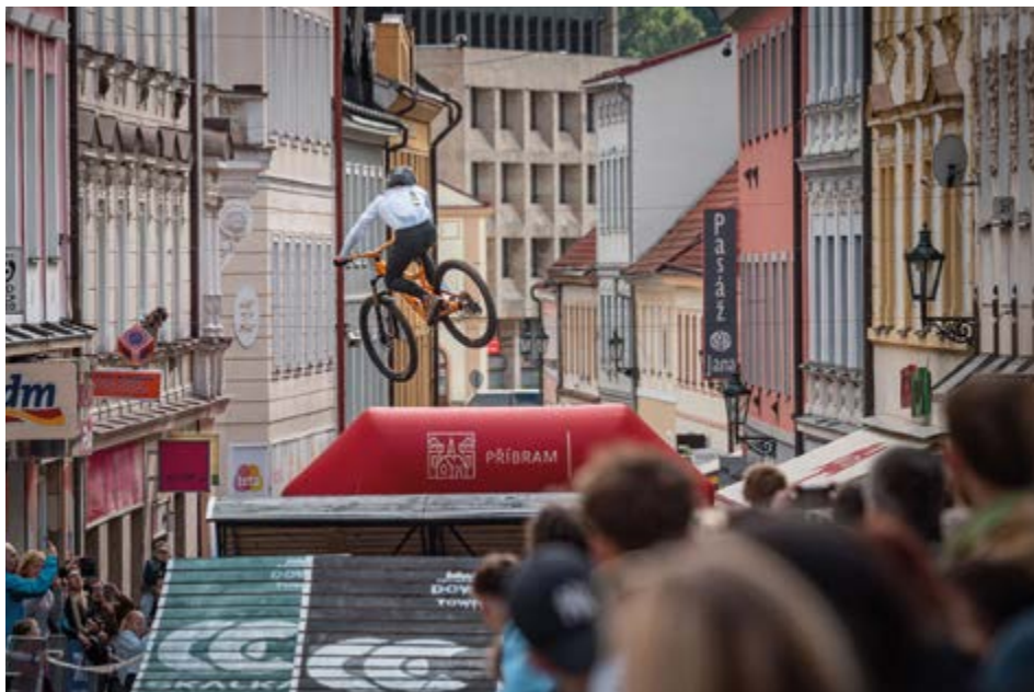
Závodníci sjíždějí ze Svaté Hory až do centra Příbrami.

Historické centrum Příbram se v sobotu 23. května 2026 opět promění v dějiště extrémní cyklistiky. Jubilejní desátý ročník závodu Svatohorský Downtown ponese podtitul Dekáda rychlosti. Podle organizátorů nabídne nejen sportovní výkony, ale i rozsáhlou městskou show pro širokou veřejnost.