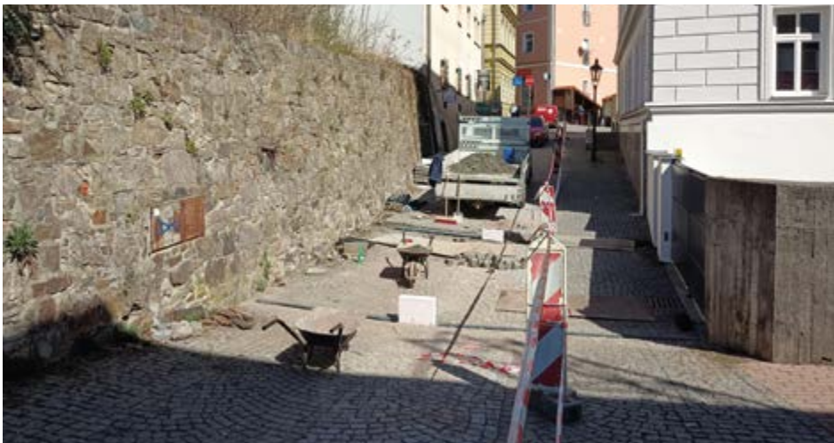
Rekonstrukce povrchu v Potoční ulici.

Na začátku dubna byla zahájena rekonstrukce chodníků v ulicích Pražská, Zahradnická a Potoční. V druhé polovině dubna začaly práce na opravě povrchů na Březových Horách, zejména pak na nádvoří Msgre. Korejse.