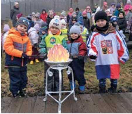
Úvodní ceremonie se zapálením olympijského ohně.

Na začátku byl nápad – co kdybychom při seznamování dětí se zimními sporty využili atmosféry olympijských her? Děti si vyzkoušely tradiční zimní sporty, nechyběly slavnostní zahajovací a závěrečný ceremoniál s předáním medailí a diplomů. U vchodu do MŠ jsme vytvořili fotokoutek, kde si rodiče s dětmi pořídili fotografie.