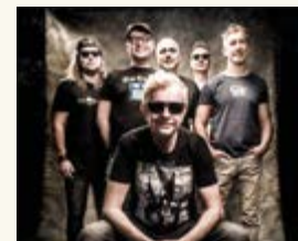
Mňága a Žďorp