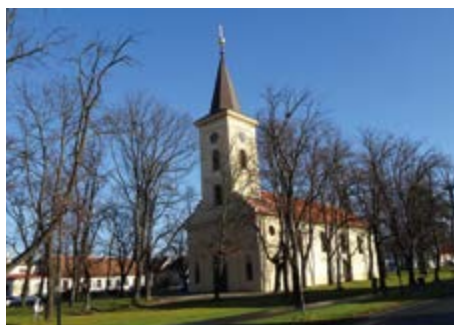
Kostel Nastolení sv. Petra v Antiochii

Svoji pouť můžeme zahájit na obdélníkovém hostomickém Tyršově náměstí. Zde nám patrně neujde Mariánský sloup, socha sv. Jana Nepomuckého a zejména nápadný barokní kostel, v ČR ojedinělého zasvěcení: Nastolení sv. Petra v Antiochii (připomínající působení apoštola Petra jako prvního biskupa v Antiochii). Stojí v západní části náměstí, na místě staršího gotického kostela (doloženého od 14. století), přestavěného v letech 1743–1762. V současnosti se jedná se o opravenou jednodlnou obdélnou stavbu s věží přibližně čtvercového půdorysu s hodinami, ukončenou polokruhovou apsi-