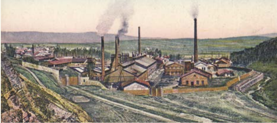
Příbramská Stříbrná huť kolem roku 1900.

V souvislosti s červnovými připomínkami hornické historie a tradic se nabízejí úvahy, zda a jak se promítá i do současného dění ve městě. Oslovili jsme osobnosti a subjekty, které se starají o odkaz hornictví a hutnictví v Příbrami, a přinášíme jejich pohled a odpověď na otázku: Co znamenalo hornictví pro Příbram v minulosti a jaký význam má dnes?