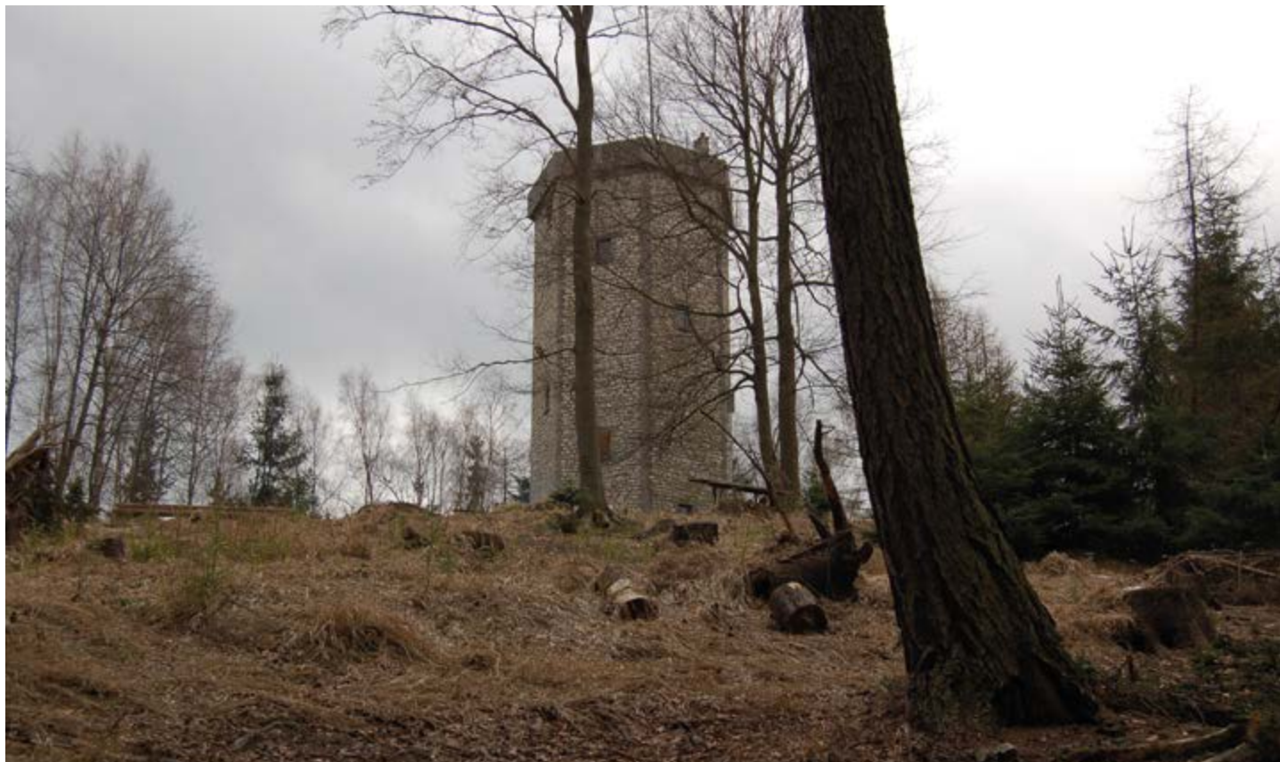
Studený vrch s rozhlednou.

Středočeské městečko Hostomice (má asi 1600 obyvatel, okres Beroun), ležící při severní hranici Přírodního parku Hřebený, je vhodnou startovací základnou pro řadu výletů. Zejména se odtud nabízejí vrcholy Plešivec (654 m), Písek (691 m), Velká Baba (615 m), Kuchyňka (636 m) nebo Hradec (628 m). My si tentokrát vybereme trasu, vedoucí k poměrně známému vrcholu a zároveň rozhledně Studený vrch (690 m).