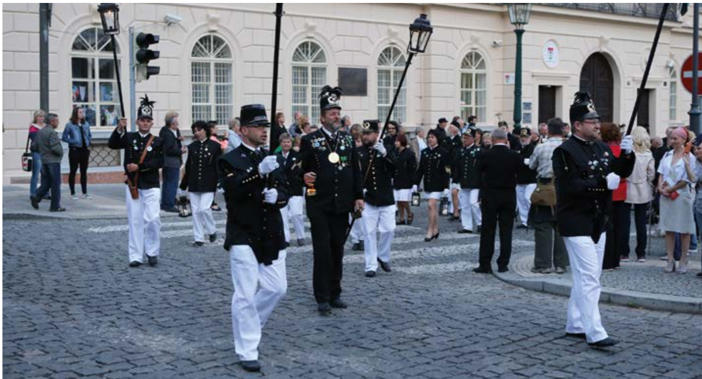
Snímky připomínají 20. Setkání hornických měst a obcí České republiky, které se před deseti lety konalo v Příbrami.

V druhém červnovém víkendu Příbram ožije oslavami hornictví. Jubilejní Setkání hornických měst a obcí České republiky a Evropský den horníků a hutníků jsou příležitostí nejen si připomenout význam hornictví pro náš region, ale také ukázat, že jeho tradice zůstává stále živá.