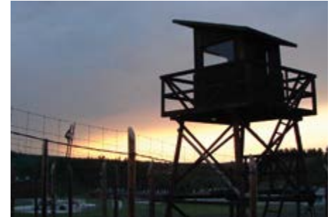
Muzejní noc v Památníku Vojna.

Květnový program vyvrcholí představením numismatické vzácnosti. Od 26. května bude na dole Vojtěch k vidění krátkodobá výstava Poklad z Hrachova. Tato expozice představí výběr několika desítek nejzajímavějších kusů z unikátního nálezů téměř tisícovky mincí. Soubor pocházející převážně z počátku 17. století je fascinujícím do-