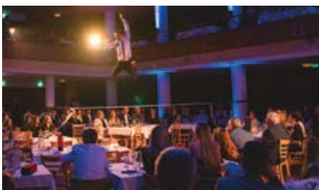
Slackline Show na letošním galavečeru.

Ve čtvrtek 19. března se Estrádní sál Kulturního domu v Příbrami zaplnil do posledního místa. Tradiční galavečer Sportovec Příbramska přinesl slavnostní ocenění těch nejlepších sportovců, trenérů i sportovních osobností regionu za uplynulý rok. Atmosféra večera se nesla v duchu radosti, uznání a inspirace.