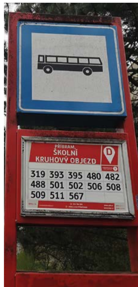
Jízdní řády musí - i vizuálně - zapadat do systému PID.

V souvislosti s integrací MHD do tarifního systému PID vznikl před dvěma lety Plán dopravní obslužnosti pro Příbram na období 2024 až