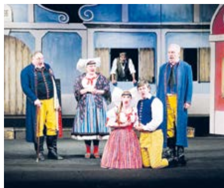
Prodaná nevěsta ve zkrácené a upravené podobě pod názvem Prodáváme nevěstu.

Děti budou moci nejen sledovat příběh, ale také se aktivně zapojit prostřednictvím doprovodné výtvarné soutěže. Tento kreativní projekt, určený žákům prvního stupně ZŠ, dětem umožní vyjádřit svůj dojem z opery vlastními kresbami a malbami. Pro ty, kterým kapacita divadla nebo mimopříbramské bydliště neumožní vidět operní představení, je připraveno doplňkové téma, kterým jsou hudební nástroje. Soutěž si již vydobyla ce-