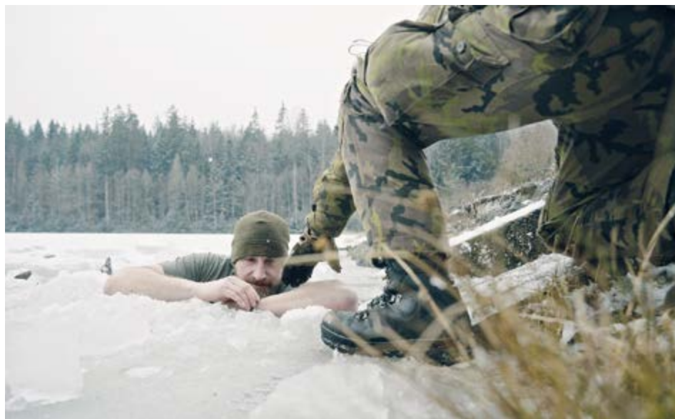
Záchrana podchlazeného, který se propadl ledem.

Téměř dva týdny v únorových mrazech, v zasněžených brdských lesích a jen s minimem vybavení a oblečení. Tak vypadal zdokonalovací kurz přežití pro vojáky 13. dělostřeleckého pluku. Jinecká jednotka patří v této oblasti ke špičce a stále posouvá hranice toho, co může člověk v extrémních podmínkách ještě zvládnout.