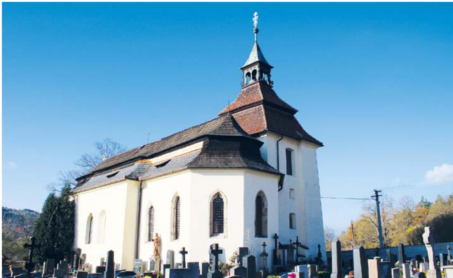
Kostel Narození Panny Marie v Mrtníku.

Kostel Narození Panny Marie v Mrtníku, což je malá, původně hornická, hutnická a uhlířská osada (místní část obce Hvozdec) nedaleko Komárova, je opravdu pozoruhodný. Stojí ve svahu Chlumu (536 m) a patří mezi nejstarší sakrální stavby hořovického regionu. Dříve hornická kaple byla později rozšířena a barokně upravena do dnešní malebně působící podoby.