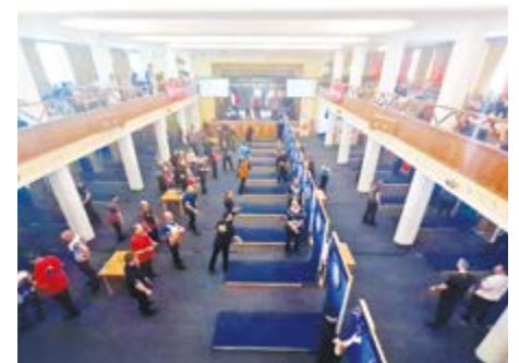
Záběr z loňského ročníku šipkařského mistrovství.