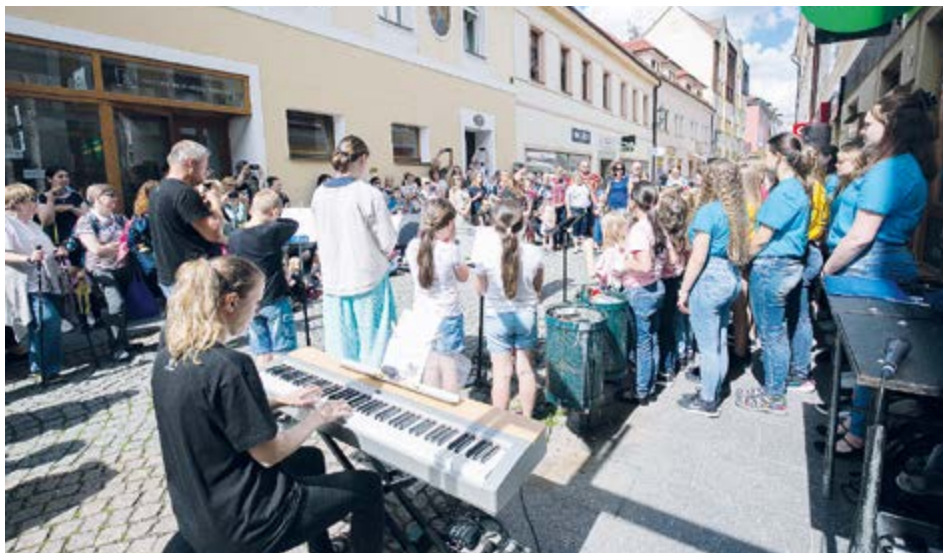
Pro širokou veřejnost budou odehrány dva open air koncerty, na kterých se představí jak profesionální umělci, tak studenti ZUŠ příbramského regionu.

Hudební festival Antonína Dvořáka Příbram je událost, která si za své dlouhé trvání vydobyla prestižní místo mezi kulturními akcemi v České republice. Letošní, již 56. ročník, nabídne kromě mistrovských koncertů a inspirativních vystoupení i program, který si užijí nejen dospělí, ale také děti. Pokud hledáte skvělou příležitost, jak se svými ratolestmi strávit nezapomenutelné chvíle, přečtěte si, co vás letos v Příbrami čeká.