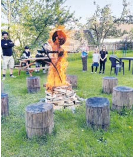
Pálení čarodějnic v Kozičíně.

Kahan zavádí novou rubriku, která se bude více věnovat osadním výborům. Redakce vybídla zástupce zřízených výborů, aby průběžně informovali o dění, novinkách či problémech v místech, kde působí. Pro toto vydání přinášíme novinky z Kozičina a Zdaboře.