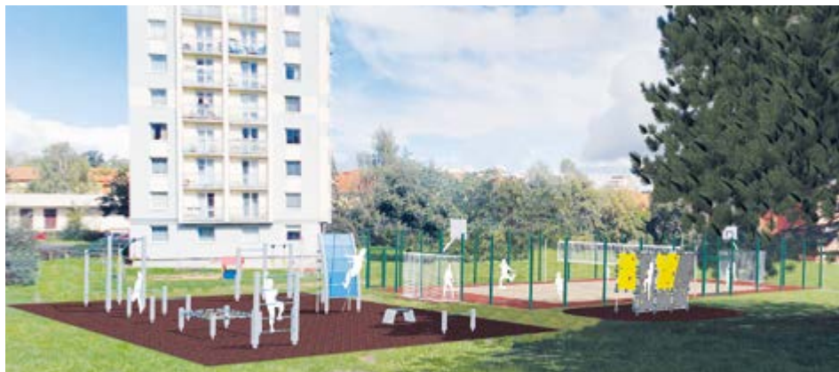
Vizualizace nového hřiště v ulici Jana Drdy.

Město Příbram se v posledních letech věnuje také obnově sportovních plácků a hřišť. V letošním roce se nového multifunkčního volnočasového hřiště dočkáme ve vnitrobloku v ulici Jana Drdy.