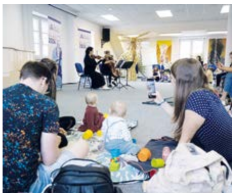
Filharmoniště je speciálně určené pro rodiny s malými dětmi.

Opera není jen pro dospělé! Operní představení pro děti ze základních škol jsou již tradiční