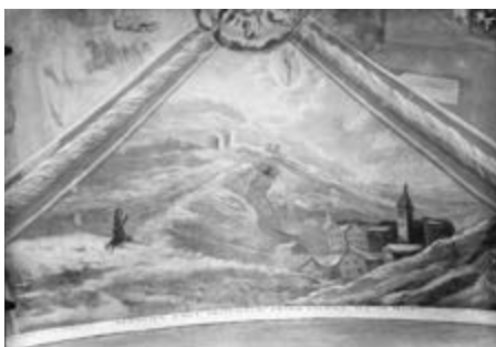
Klečící horní mistr a primátor Pusch se modlí za záchranu topičích se vnuka.

Horní mistr a primátor Jiří Tomáš Pusch zemřel ve svém příbramském domě 6. prosince 1734 ve věku 72 let. O tři dny později byl pohřben do krypty v kostele sv. Jakuba. Kromě svého dvora