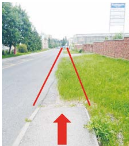
Požadovaný chodník ve Zdaboři.

V polovině letošního ledna se uskutečnilo jednání mezi osadními výbory v Příbrami a radnicí. Zástupce OV Zdaboř, jmenovitě Martin Sochor, připomněl důležitost investice do místní infrastruktury. Hlavními tématy jednání byly dlouhodobě neřešené projekty chodníku podél ulice Zdabořská a osvětlení přechodu u Pletánek.