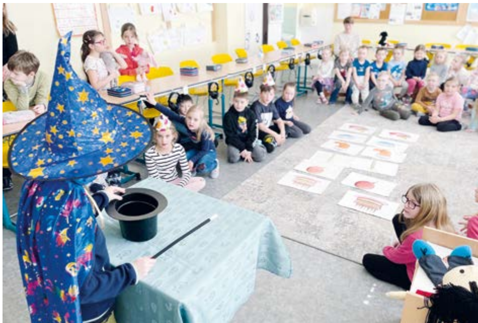
Hlavní téma hodiny znělo Narozeninová oslava a kouzelnické představení.