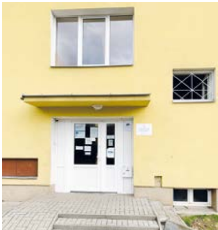
Vchod do příbramského azylového domu v ulici Na Vyhliídce.

Azylové domy v České republice představují klíčovou složku systému sociální pomoci pro osoby, které se ocitly v krizové životní situaci, zejména pro ty, kteří se dostali do stavu bezdomovectví. Azylový dům v Příbrami je jedním z těchto zařízení, které nabízí bezpečné a stabilní prostředí pro jednotlivce i rodiny v těžkých obdobích jejich života. Cílem azylového domu není pouze poskytnout přechodné přístřeší, ale i podporu na cestě k samostatnosti a znovuzískání nezávislosti.