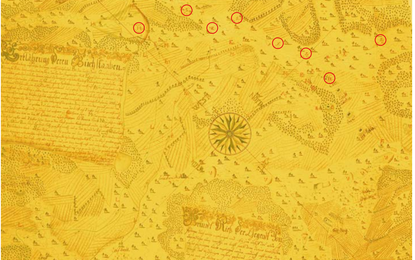
Artnerova mapa s Janskou strouhou, vodní štolou a dalšími vodotečemi z roku 1750. Pod písmenem (písmena jsou na mapě zleva doprava; redakce doplnila kroužky) H je nový ochranný rybník (Vokačovský). Vysokopectký rybník se nahoru na mapu nevešel, ale S jsou mlýny pod ním na Litavce. U prvního E shora je Angelovský mlýn, u něhož se voda z obou struh spojila a byla sváděna do vodní štolý D.

V roce 1730 postupovala ražba Karolinské (dnešní Karlo-Boromejské) štolý dál na jih. Proutkař našel na Prokopské žíle bohaté zásoby rudy. Těžba na dole sv. Jana Nepomuckého a novém prvotním dole sv. Prokopa (to byl důl dnes nazývaný Staroprokopský na nejvyšším místě Březového vrchu, který není totožný se současným dolem Prokop) však nemohla pokračovat.