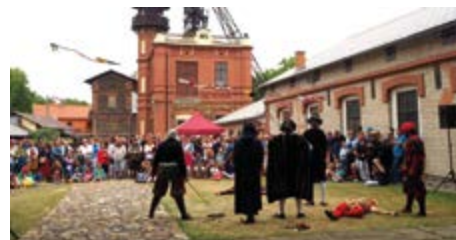
Prokopská pouť bude mít program také na nádvoří Ševčinského dolu.

Od poloviny května si mohou návštěvníci dolu Vojtěch projít venkovní expozici Geopark Brd a Podbrdská spolu s mobilní aplikací, která zpestří a obohatí jejich zážitky. Aplikace nabízí dva režimy a přibližuje jak geologický vývoj, tak