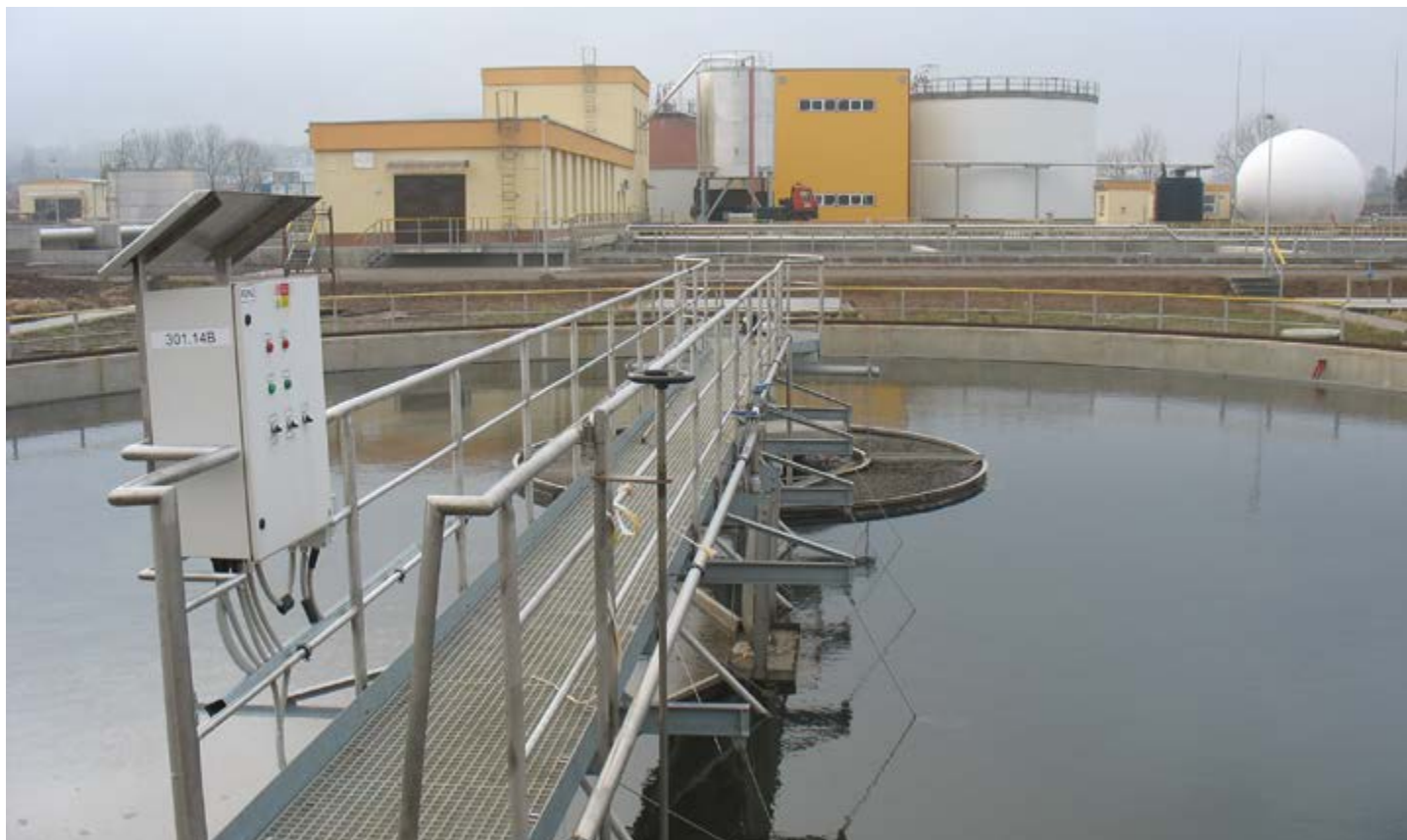
Příbramskou čistírnu odpadních vod čeká rozsáhlá modernizace za stovky milionů korun.