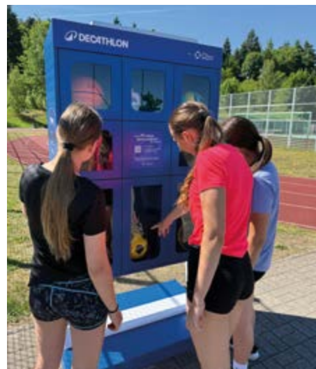
Vypůjčka na prvních 90 minut je zdarma.