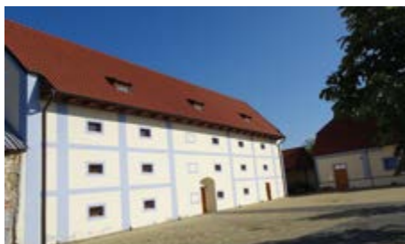
Všeradice, zámek, galerie

Základ současné podoby zdejšího zámku (nemovitá kulturní památka) vznikl patrně v období vlastnictví Vratislavů z Mitrovic, pozdějšími úpravami však byly původní barokní prvky areálu potlačeny. V severním traktu v budově špýcharu zde můžeme navštívit Galerii a muzeum M. D. Rettigové (1785-1845), známé české kuchařky, vlastenky, povídkářky a básničky, zdejší rodačky. Ve východním křídle je pivovar Dvůr Všerad s připojenou stylovou restaurací.