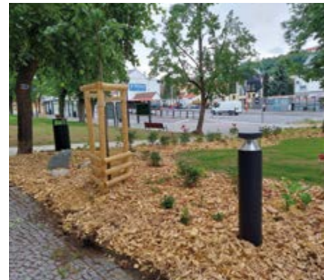
Rekonstrukce části Jiráskových sadů přinesla i nové prvky jako pítka, osvětlení či místa pro posezení.