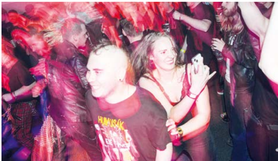
Z koncertu kapely E!E v Junior klubu.

Proč se v Příbrami dlouhodobě nedaří rozvíjet klubovou kulturu? S otázkou, kterou si mohou klást pamětníci zdejší pestré klubové scény, se Kahan obrátil na provozovatele klubů a pořadatele „alternativních“ hudebních akcí. Co by podle nich pomohlo k udržení menších scén, a tím pádem rozmanitější programové nabídce?