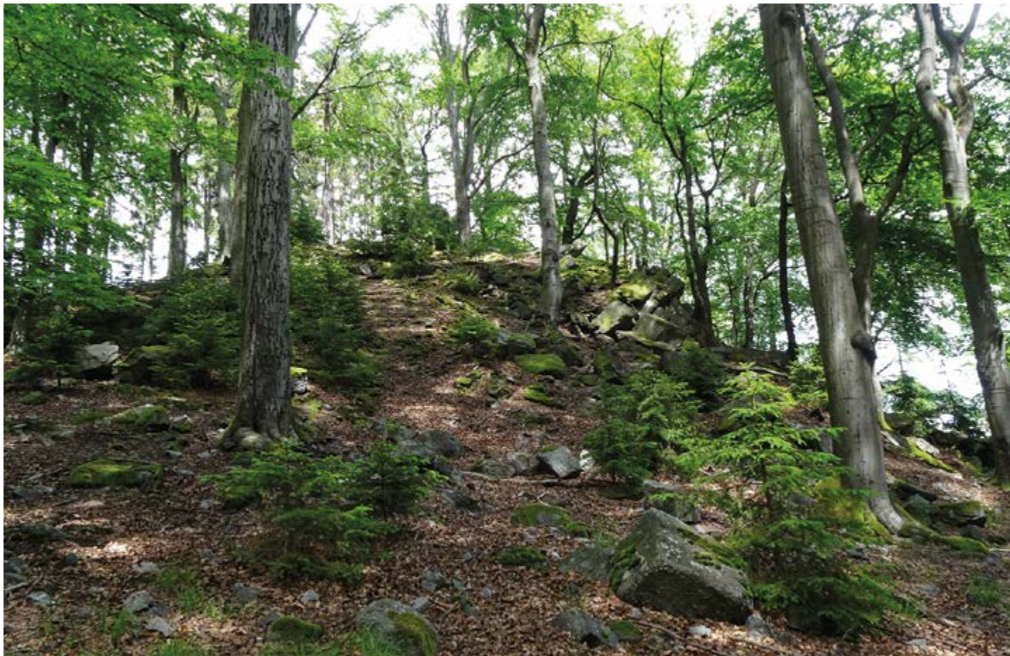
Stožec, vrcholová partie.

Obec Všeradice (okres Beroun) se nachází asi 2 km vzdušnou čarou od hranice Přírodního parku Hřebený. Vzhledem k němu je obec v mírném protisvahu, takže nás překvapí panoramatický pohled na jeho nejvyšší vrcholy. Navíc, obec je příhodně umístěna nedaleko Přírodního parku Housina, který spolu s dále pokračujícím zalesněným pásmem tvoří středním Brdům a Hřebenům jakousi protiváhu. Pěkné inspirativní místo. V obci je zámek, dva kostely, žije tu trvale asi 500 obyvatel, rekreační potenciál je evidentní.