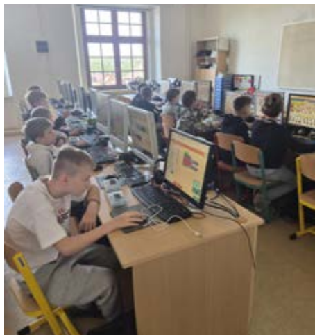
Žáci se učili programovat, vytvářeli dráhy pro Ozoboty nebo testovali virtuální realitu.

V úterý 20. května se učebny prvního stupně proměnily v technologické laboratoře. Žáci 8.A a 9.A, kteří navštěvují předmět volitelná informatika, si totiž vyzkoušeli netradiční roli – stali se na jeden den učiteli svých mladších spolužáků. A vedli si naprosto skvěle.