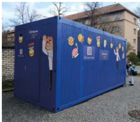
EUtejnér neslouží veřejnosti, ale výhradně žákům školy.

Před budovou ZŠ 28. října se 16. dubna objevil EUtejnér – speciální vzdělávací prostor zaměřený na výuku o Evropské unii. Naše škola se tak stala vůbec první v Příbrami, která tuto výukovou pomůcku získala.