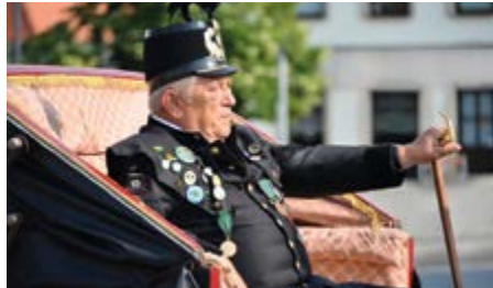
Ze setkání hornických měst v Příbrami v roce 2016.

Víkend 20.-21. června bude patřit oblíbené akci Hornické pohádky, odehrávající se v ta-