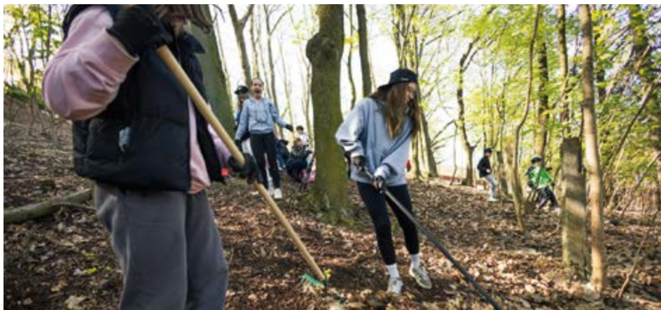
Do akce se zapojilo více než 450 žáků z příbramských škol.

Ve Svatohorských sadech v Příbrami se uskutečnil čtvrtý ročník Bobcat Biodiverzitního dne, který propojil místní školy, dobrovolníky, neziskové organizace a město. Akci uspořádala společnost Doosan Bobcat u příležitosti mezinárodního Dne Země. Zapojilo se do ní více než 500 účastníků, z toho přes 450 žáků z osmi základních a dvou středních škol z Příbramska.