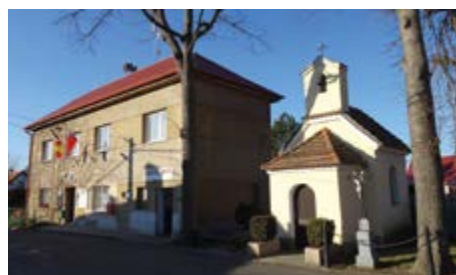
Malý Chlumec, kaple a radnice

Tyršovo náměstí opustíme Dobříšskou ulicí, která nás povede ven z města východním