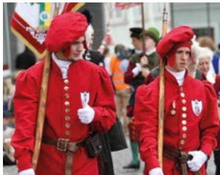
Z hornického setkání před deseti lety v Příbrami.