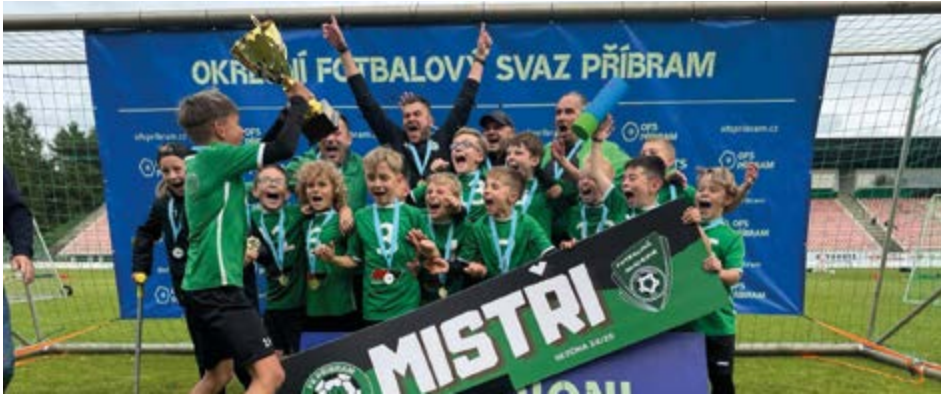
Loňská radost nejmladších příbramských fotbalistů.

V sobotu 6. června se na hlavním hřišti stadionu FK Příbram uskuteční 6. ročník Velkého finále přípravek Okresního fotbalového svazu Příbram. Tradiční závěr sezony mládežnických soutěží přivede do Příbrami celkem 59 týmů mladších a starších přípravek z celého regionu.