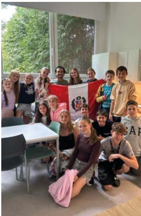
Společné focení po společném vaření s peruánským hostem.

Jedna skupina připravovala pokrm causa relena, což je studený vrstvený pokrm z odučených brambor plněný kuřecím masem a dalšími ingrediencemi typickými pro peruánskou kuchyni. Druhá skupina chystala chicha morada, osvěžující nápoj z fialové kukuřice, ovoce a koření, který děti zaujal svou výraznou barvou i netradiční chutí připomínající svařené víno. Velký úspěch slavily především alfajores – jemné sušenky slepované sladkým karamellem dulce de leche a obalené v kokosu a o osvěžení