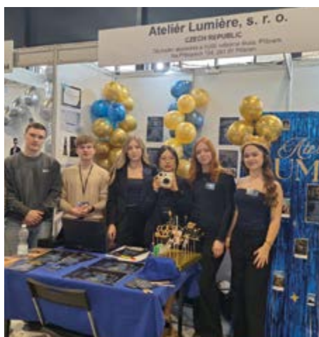
Příbramský Ateliér Lumière na Veletrhu fiktivních firem.

V polovině března se v Praze konal Mezinárodní veletrh fiktivních firem v Praze, kterého se účastnilo 74 studentských fiktivních firem z celé Evropy. V konkurenci Rakouska, Belgie či Rumunska se prosadili žáci OA a VOŠ Příbram, kteří přijeli s dvěma firmami – Ateliér Lumière a Immersa.