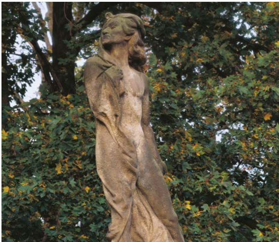
Socha Obětovaný v Hořovicích.

V roce 1922 vytvořil jeden z nejdůležitějších českých umělců počátku 20. století František Bílek (1872–1941) pro Hořovice osobitý pomník obětem 1. světové války s názvem Obětovaný . Dílo rozcházející se s očekávaným realismem části hořovického obyvatelstva bylo rozporuplně přijato a jeho další osud nebyl jednoduchý. Přesto dodnes patří k výrazným uměleckým památkám ve veřejném prostoru Podbrdská a celého Středočeského kraje.