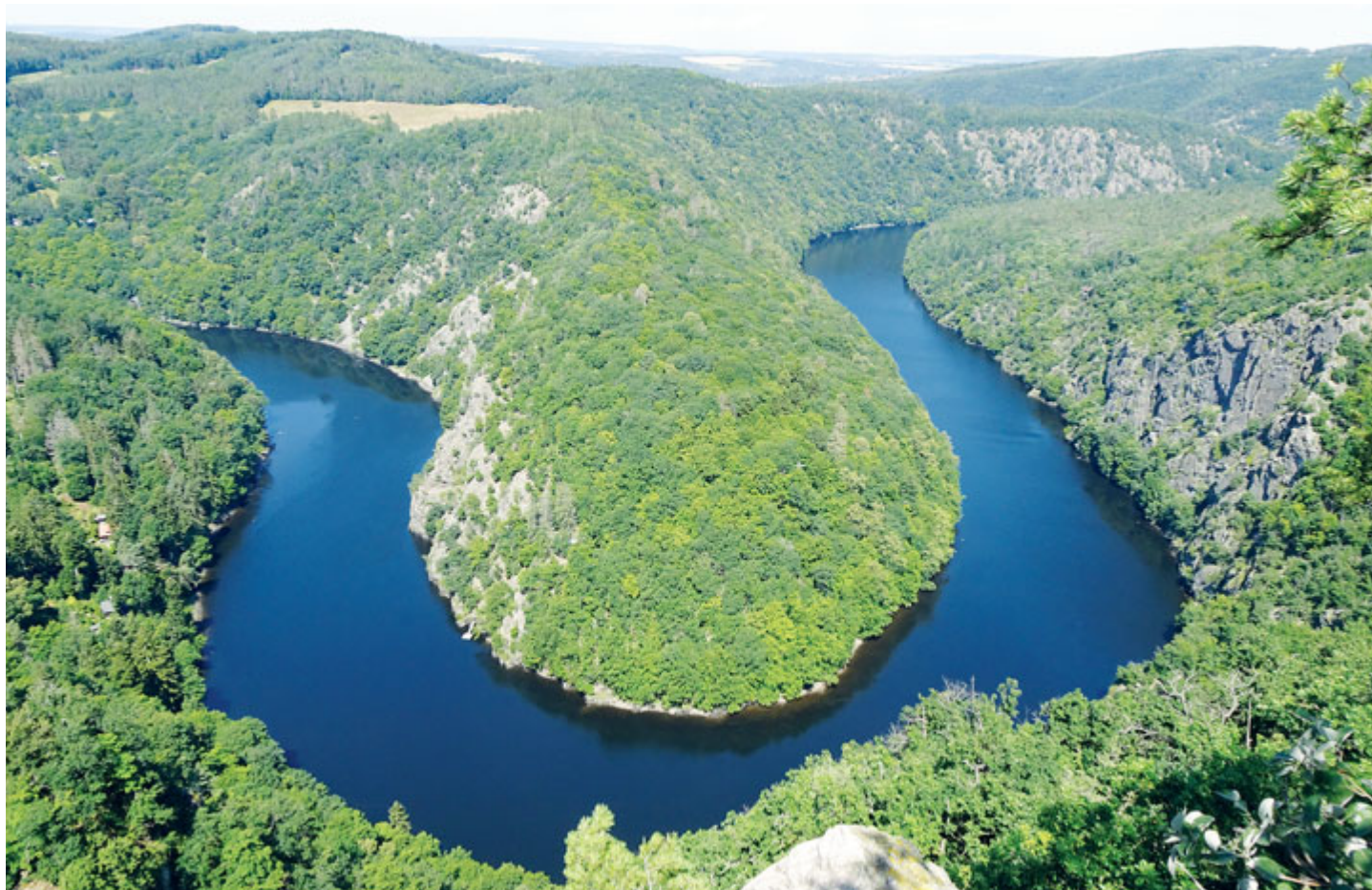
Pohled na svatojanské meandry z vyhlídky Máj.

Vltavský kaňon s naučnou stezkou Svatojanské proudy (o které jsme psali minule) je svým krajinným rázem dramatický a velmi fotogenický. Nelze se tedy divit tomu, že se na vysoko položených úbočích objevuje řada pěkných rozhledových míst.