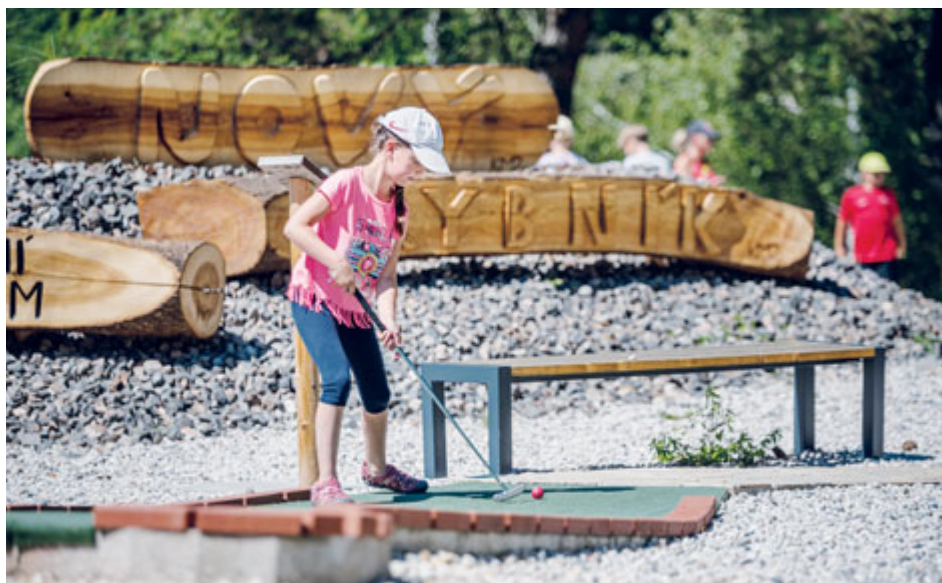
Sportovní zařízení města Příbram spravují mj. adventure golf na Novém rybníku.

Prvního července to bude na den přesně 20 let, kdy nabyla účinnosti městským zastupitelstvem schválená zřizovací listina pro vznik Sportovních zařízení města Příbram. Dnes jde o příspěvkovou organizaci, která má pod sebou všechna větší sportoviště v majetku města. Kromě sportu nabízí služby z oblasti kultury, rekreace, zábavy, stravování či ubytování, a to v Příbrami i v šumavském Zadově.