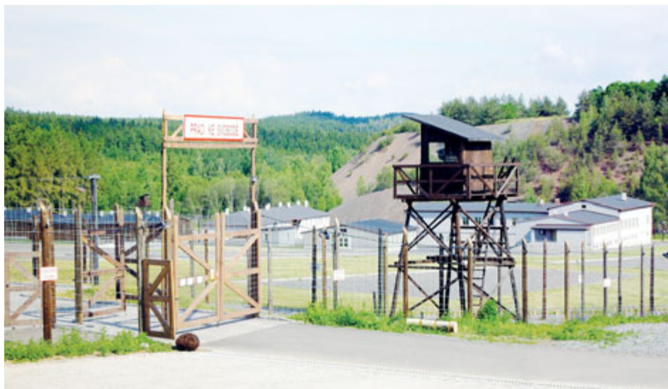
Vstupní brána Památníku Vojna Lešetice, kde se 27. června uskuteční komponovaný program při příležitosti Dne památky obětí komunistického režimu.

Červnové akce v Hornickém muzeu Příbram nabízejí zážitky pro všechny věkové kategorie – od dobrodružství pro rodiny s dětmi, přes novou výstavu, prohlídky podzemí a hudební představení až po pietní mši a připomínku obětí komunistického režimu.