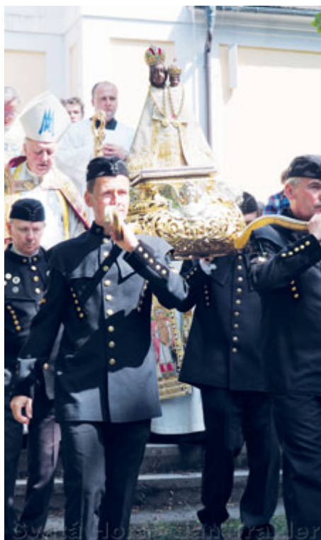
Soška Panny Marie Svatohorské.

Letos se bude konat 292. slavnost Korunovace Panny Marie Svatohorské. Korunovace patří k nejvýznamnějším a nejstarším mariánským slavnostem u nás a jako taková má nejen duchovní, ale i kulturní a historický význam. V letošním roce tato slavnost připadá na víkend 8. a 9. června.