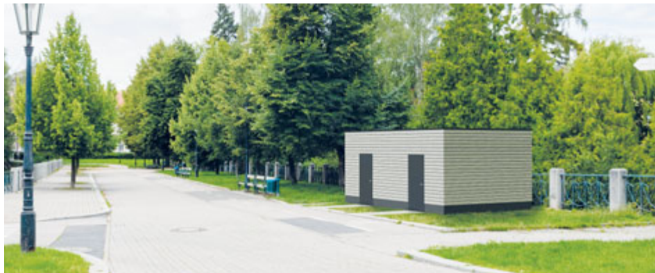
Takto by měly vypadat nové veřejné toalety na Dvořákově nábřeží.

V klidové zóně Hořejší Obora budou v průběhu léta vybudovány nové veřejné toalety. Nahrazeny tak budou nefunkční toalety v hrázi rybníka.