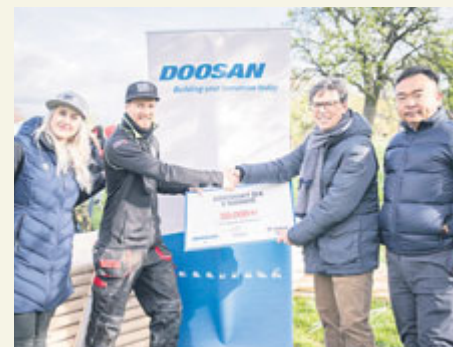
Po podepsání memoranda.

V úterý 16. dubna za podpory města Příbram podepsaly společnost Doosan Bobcat, spolek Svatohorské sady Příbram a Římskokatolická farnost u kostela Nanebevzetí Panny Marie společně memorandum. Firma se zavázala, že bude až do roku 2030 poskytovat finanční a materiální pomoc s cílem zlepšit stav svatohorských sadů a zajistit odpovídající péči o ně. Spolupráce zahrnuje konkrétní finanční prostředky i aktivní zapojení zaměstnanců a techniky Doosan Bobcat. Memorandum o spolupráci bylo podepsáno v rámci Dne biodiverzity.