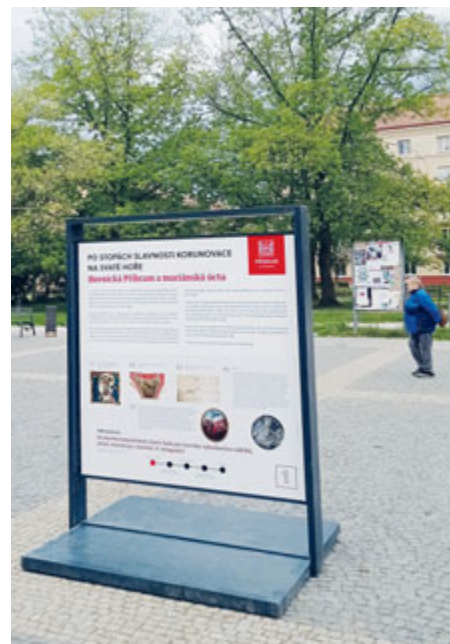
Jeden z panelů, které ve městě informují o slavnosti Korunovace Panny Marie Svatohorské.

mši svatou redemptorista David Horáček. Poté následuje průvod s milostnou soškou. Slavnost bude dále pokračovat tichou mší, mariánskou pobožností, varhanní půlhodinkou a mší svatou. Program zakončí v 16.15 české mariánské nešpory. Nedělní program bude rozšířen o loutkovou pohádku O námořníku Čepičkovi od 11.00 a vyhlídkové jízdy koňským spřežením od 11.00 do 14.00.