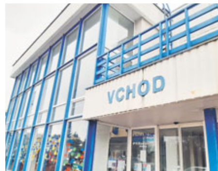
Na přestavbu čeká aquapark.

nízké (353 291 korun). Relativně vysoký vzhledem k ostatním městům je naopak počet pracovníků na DPP a DPČ (159).“ SZM generovala v roce 2022 celkem 27,4 mil. korun z poskytování sportovních zařízení, další příjmy spjaté s provozem sportovních zařízení byly na úrovni 11,9 mil. korun. „Příspěvková organizace se tak vzhledem k velikosti města řadí mezi provozovatele s relativně vysokými příjmy z poskytování sportovních zařízení, příjmy z dalších činností (11,9 mil. Kč) pak představují v porovnání s dalšími městy jednu z nejvyšších částek, což svědčí o efektivním využití sportovních zařízení a služeb nad rámec sportovních pronájmů a vstupného,“ stojí v dokumentu. Pokud bychom hodnocení SZM převedli na stupínky na „bedně“, pak je tu 1. místo pro zimní stadion s nejlepším hospodářským výsledkem, 3. místo pro krytý bazén s nejlepším hospodářským výsledkem a 3. místo pro krytý bazén s nejvyšší návštěvností.