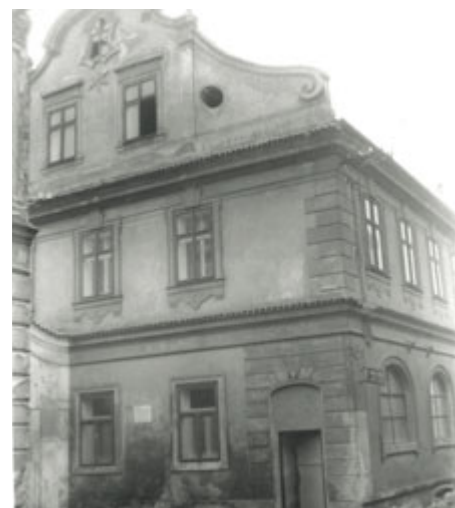
Gabischův dům v Dlouhé v roce 1968.

V roce 1578 vydal nejvyšší mincmistr na žádost horníků dobrozdání, že doly potřebují další finanční výpomoc. Při revizi starších hor-