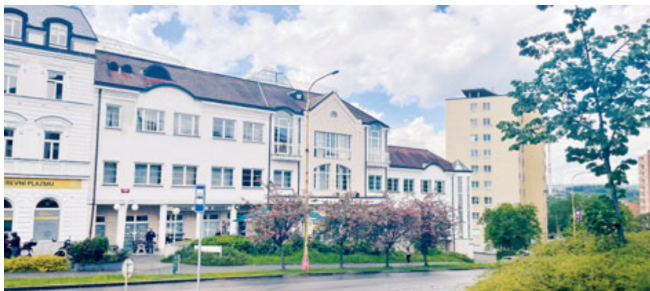
Odbor životního prostředí se přestěhoval do Domu Natura. Telefonní čísla, e-mailové adresy a úřední hodiny se nemění.

V souvislosti s novou legislativou, a s tím souvisejícím nárůstem zaměstnanců městského úřadu, je třeba zajistit další kancelářské prostory. Město jde cestou dočasného pronájmu a přípravou kanceláří ve vlastním objektu.