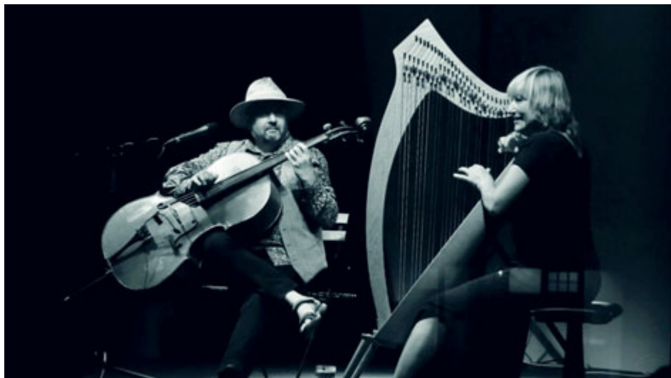
Během muzejní noci vystoupí hudební skupina Bárka.

Při příležitosti Dne památky obětí komunistického režimu se ve čtvrtek 27. června v Památníku Vojna koná komponovaný tematický program. V 16.00 začíná pietní mše, o hodinu