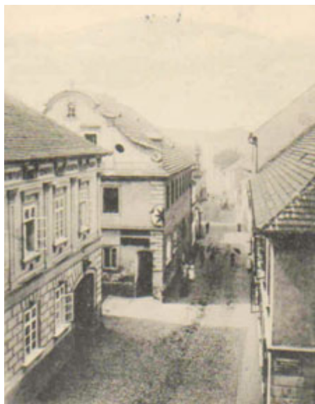
Gabischův dům v Dlouhé na staré pohlednici.