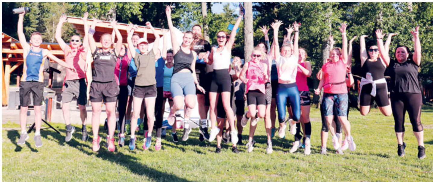
Z loňského Běhu proti demenci v areálu Nový rybník.

Spojit příjemné s užitečným mohou obyvatelé Příbrami 19. června, kdy se zde uskuteční tradiční Den bez paměti a charitativní Běh proti demenci, pořádaný neziskovou organizací Dementia.