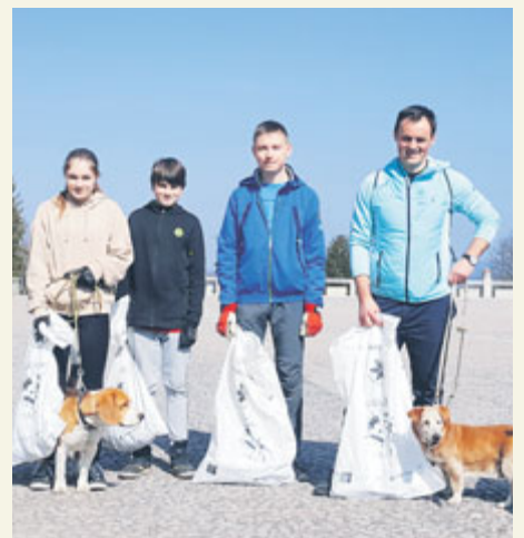
Clean-Up Day je procházka se psy spojená s úklidem odpadků.

Od roku 2019 rozvíjíme místní aktivity v Příbrami. Založením Volunteer team Příbram (podpora charitativních akcí, pomoc místním, charitativní akce) se snažíme měnit prostředí, ve kterém žijeme, a šířit osvětu o dobrovolnictví. Účastníci projektu pomáhají jako dobrovolníci a pořádají lokální akce. Obnovujeme drobné sakrální stavby na poutní cestě mezi Čechy a Německem a pořádáme Clean-Up Day (procházku se psy spojenou s úklidem pohozených odpadů v přírodě). Organizujeme charitativní běhy (Olympijský běh) či sbírky na podporu Ukrajiny nebo přímou pomoc prací na Moravě v místech, která poškodilo tornádo. Projekt svou činností podporuje také děti z Ukrajiny, Indonésie a Burkiny Faso. Další akce, na které můžete vidět dobrovolníky z Příbrami, je Běh pro republiku u Památníku Vojna, který se koná 20. října 2024.