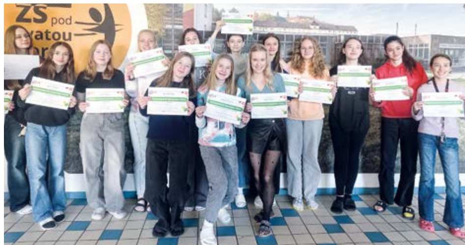
Účastníci Duolingo výzvy s certifikáty o absolvování.

Na Základní škole pod Svatou Horou se učitelé cizích jazyků rozhodli uspořádat prázdninovou Duolingo výzvu, jejímž cílem bylo motivovat žáky i školní zaměstnance k pravidelnému procvičování cizích jazyků během vánočních prázdnin.