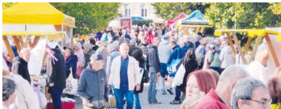
První farmářské trhy budou 15. března, bleší trhy nás čekají 5. dubna.

S příchodem jara ožívají trhy. První farmářské trhy se konají 15. března a poté každou první a třetí sobotu v měsíci. Chybět nebudou dětské dílničky, bleší trhy či středeční a čtvrteční trhy s čerstvými produkty od lokálních pěstitelů a výrobců.