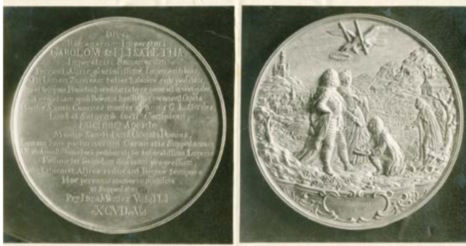
Medaile z roku 1728 pro císaře Karla VI.

výrobu a další výdaje zapůjčeno 1054 zlatých, z nichž téměř polovina nebyla se souhlasem rady vrácena.