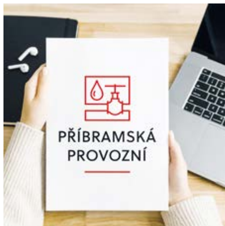
Nové logo společnosti Příbramská provozní odráží jednotnou grafickou identitu města Příbram.

náct zájemců. Jeden z uchazečů byl vyřazen kvůli změně nabídkové ceny po lhůtě pro podávání nabídek. Výběrová komise tak posuzovala deset nabídek, jejichž ceny se pohybovaly od 116 milionů korun až po 171 milionů korun včetně DPH. Nejvýhodnější nabídku ve výši 116 028 568 korun včetně DPH předložila společnost Stavmonta, která se stala vítězem tendru. Staveniště bylo předáno na začátku roku, doba realizace je 60 týdnů.