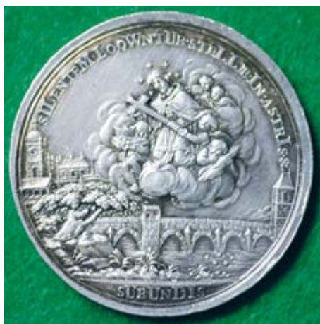
Revers pamětní medaile z roku 1729