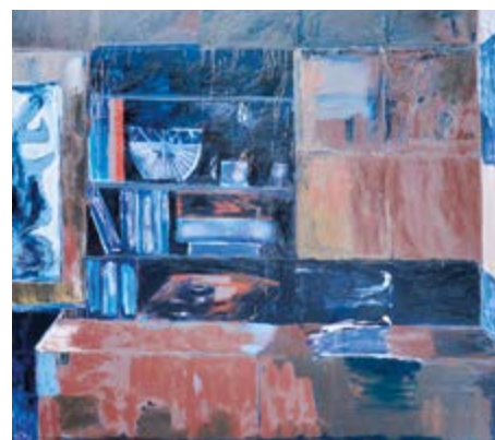
Malba bez názvu vznikla pro letošní výstavu v GFDP.

PŘÍBRAMSKÁ VÝSTAVA BUDE VELKÁ, NA PLOŠE 600 METRŮ, COŽ JE VE TVÉM VĚKU JEDNA Z TĚCH MINIMÁLNĚ ROZSAHEM VÝZNAMNÝCH VÝSTAV. S ČÍM SI MYSLÍŠ, ŽE SE DIVÁK POTKÁ, KDYŽ PŘIJDE NA TVOU VÝSTAVU?