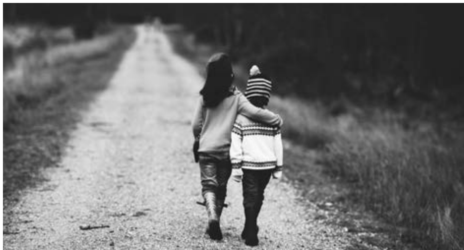
Sociálně aktivizační služby jsou určeny zejména pro rodiny s dětmi v tíživé sociální situaci.

V pokračování seriálu o sociální práci v Příbrami se tentokrát zaměříme na další službu z oblasti sociální prevence, a to na Sociálně aktivizační služby pro rodiny s dětmi. Společně již s představenými Terénními programy spadá služba pod Středisko terénních služeb Centra sociálních a zdravotních služeb města Příbram.