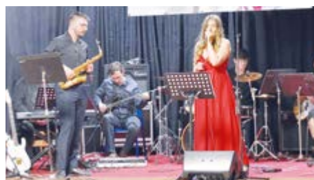
Milovníci umění a dobré muziky se mohou těšit na pestrý program z klasických skladeb i populárních písní.

Benefiční koncerty učitelů ZUŠ Antonína Dvořáka se staly pěknou tradicí. Co začalo v roce 2022 jako spontánní reakce na pomoc Ukrajině, pokračuje i letos už 4. ročníkem. Tentokrát opět podpoří dětské oddělení příbramské nemocnice.