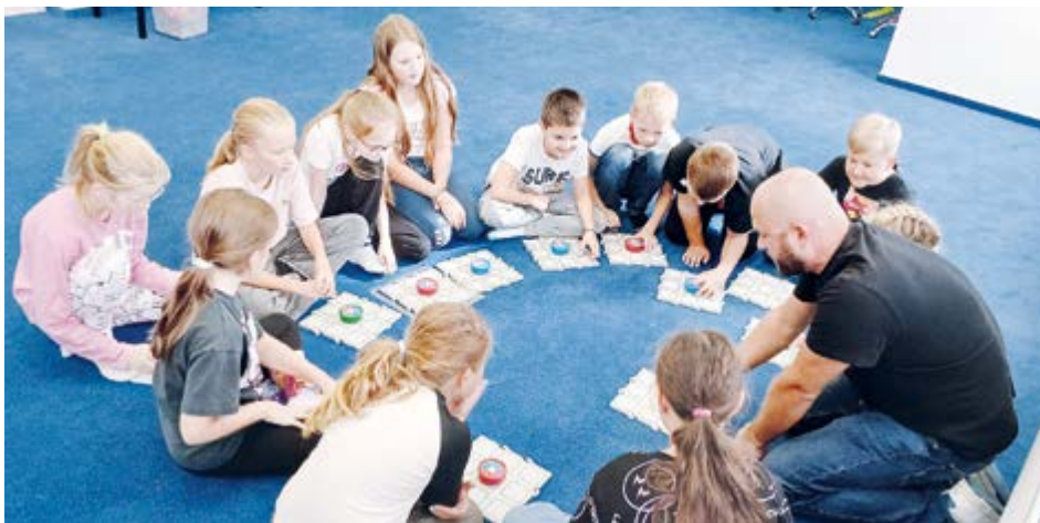
Z návštěvy příbramských žáků v březnickém centru Techak.

Žáci sedmých tříd ZŠ Školní navštívili Techak v Březnici, kde se seznámili s tématem robotizace a polytechniky, dozvěděli se o Průmyslu 4.0, vyzkoušeli programování robotů a Minecraftu a na závěr si užili virtuální realitu, která je přenesla na různé části světa. Žáci čtvrtých tříd prozkoumali vesmír, programovali roboty a zažili výlety do podmořských světů i na Měsíc pomocí brýlí pro virtuální realitu. Páté třídy se zaměřily na přírodní katastrofy, které prozkoumávaly jak teoreticky, tak pomocí virtuální reality.