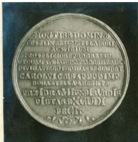
Mariánská medaile z roku 1727.

V roce 1726 se skutečně začalo dolování stříbra dařit. Z 288 hřiven stříbra se vytavilo 248 hřiven (asi 63 kg) přepalovaného stříbra, za které spolu s olovem a klejtem dostal horní závod 10 060 zl. Horní náklady činily 3856 zl., na desátek se vydalo 503 zl., na dva dědičné kukusy 60 zl., na dva kukusy pro příbramský kostel a školu 60 zl., zásoby měly cenu 1860 zl. Po odečtení nákladů zůstal přebytek 3720 zl., z něhož se konečně mohl začít umožovat dlouhodobý reces čili nedoplatek.