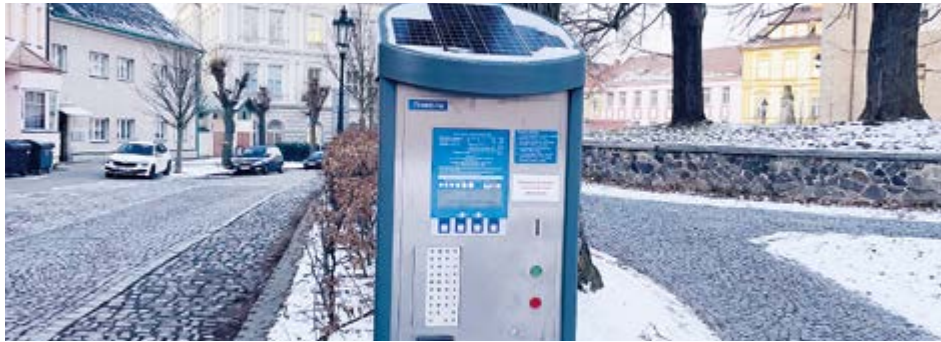
Příbramští mají k dispozici novou parkovací aplikaci od EasyPark Czechia.

Řidiči v Příbrami mohou platit parkovné v aplikaci VPA, která nevyžaduje instalaci do mobilního telefonu. Kromě VPA lze využít také aplikaci EasyPark Czechia, kterou je nutné nejprve stáhnout. Platit parkovné jde i nadále prostřednictvím platební karty nebo mincí.