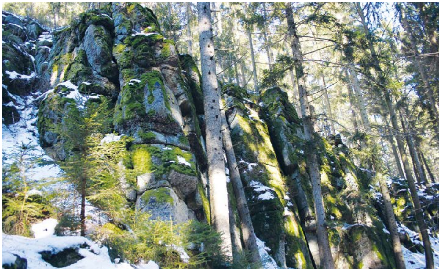
Skládaná skála ve střední části.

Zajímavým skalním útvarem, vzdáleným necelé tři kilometry vzdušnou čarou od okraje Strašic, ležícím na východních svazích brdského vrchu Kamenná (736 m), je několik set metrů dlouhé pásmo skal zvané Skládaná skála.