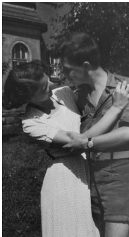
Pamětník se svojí spolužačkou v padesátých letech

Po úspěšném ukončení vysoké školy v roce 1958 absolvoval půlroční vojenskou službu ve Znojmě, kde dosáhl hodnosti majora. Umístěnku dostal na Uranové doly do Příbrami, za což byl vděčný, protože nechtěl nikam daleko od Prahy. Pracoval jako geolog v laboratoři na výzkumu vzácných prvků, především india. V té době už byl ženatý a měl syna, kdy jeho manželka, stomatoložka původem z Moravy, využila možnost následovat manžela do místa bydliště, kde získala práci. „Uranové doly tu měly skvělou zubní laboratoř s nejmodernější technikou,“ popisuje. Manželství ale trvalo jen krátce.