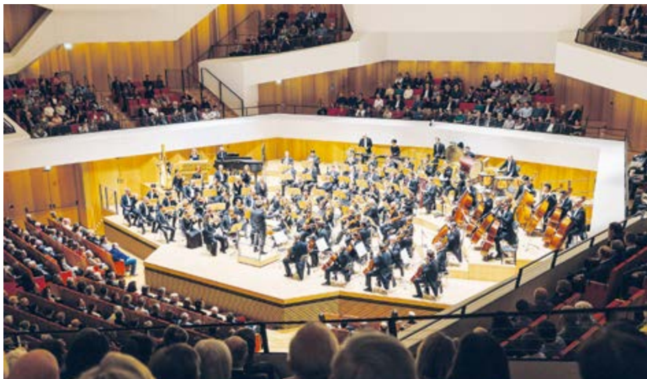
Festival zahájí Dresdner Philharmonie, jeden z nejuznávanějších evropských orchestrů.

Hudební festival Antonína Dvořáka Příbram letos vstupuje do svého 56. ročníku a od 22. dubna do 3. června 2025 přinese do celého příbramského regionu bohatý program plný špičkových umělců a jedinečných koncertů. Tento festival, který nese jméno jednoho z nejvýznamnějších skladatelů světové hudby, propojuje Dvořákův odkaz s díly dalších českých i zahraničních skladatelů a zároveň představuje Příbramsko jako inspirativní kulturní centrum.