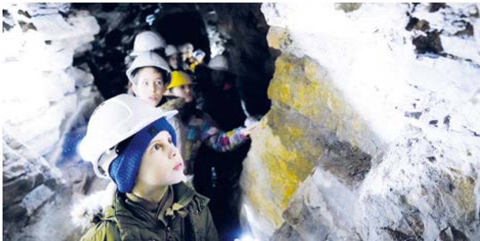
Během příměstského tábora prozkoumají děti březohorské podzemí.

Na program navazuje každý den odpolední tvůrčí dílna s tématem dětských jarních zábah, která je určena jak pro účastníky tábora s doprovodem, tak i pro další zájemce. Koná se vždy od 16.00 do 17.30. Děti i dospělí se naučí vyrábět pomůcky ke starobylé hře tlučení špačků, seznámí se s pravidly cvrnkání kuliček a zjistí, jak si zhotovit píšťalku z vrbového prutu. Účast je možná pouze po předchozí rezervaci na výše uvedeném e-mailu. Vstupné