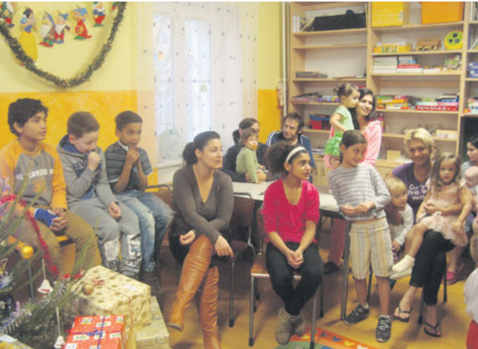
Vánoce v Azylovém domě v Příbrami.

Vánoce v azylovém domě mají určité punc zvláštnosti. Atmosféru provází nejistota ohledně dlouhodobých vyhlídek na vlastní bydlení, ale zároveň přichází momentální uspokojení z možnosti mít střechu nad hlavou a být se svými dětmi.