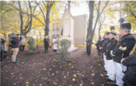
Svěcení kapličky sv. Jana Nepomuckého.