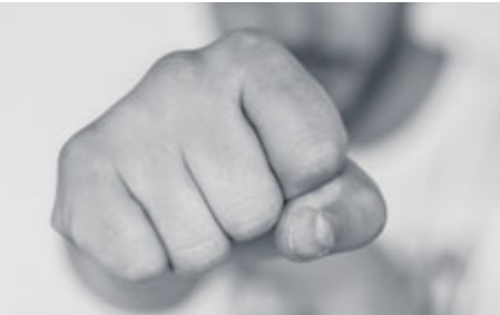
Hlavní zásadou je předcházet kritickým situacím. Pokud to nejde jinak, je třeba vědět, jak se ubránit při napadení.

Chcete se naučit, jak předcházet nebezpečným situacím? A pokud už nastanou, chcete vědět, jak je řešit? Potom se přihlaste do kurzů sebeobrany, které připravuje město Příbram.