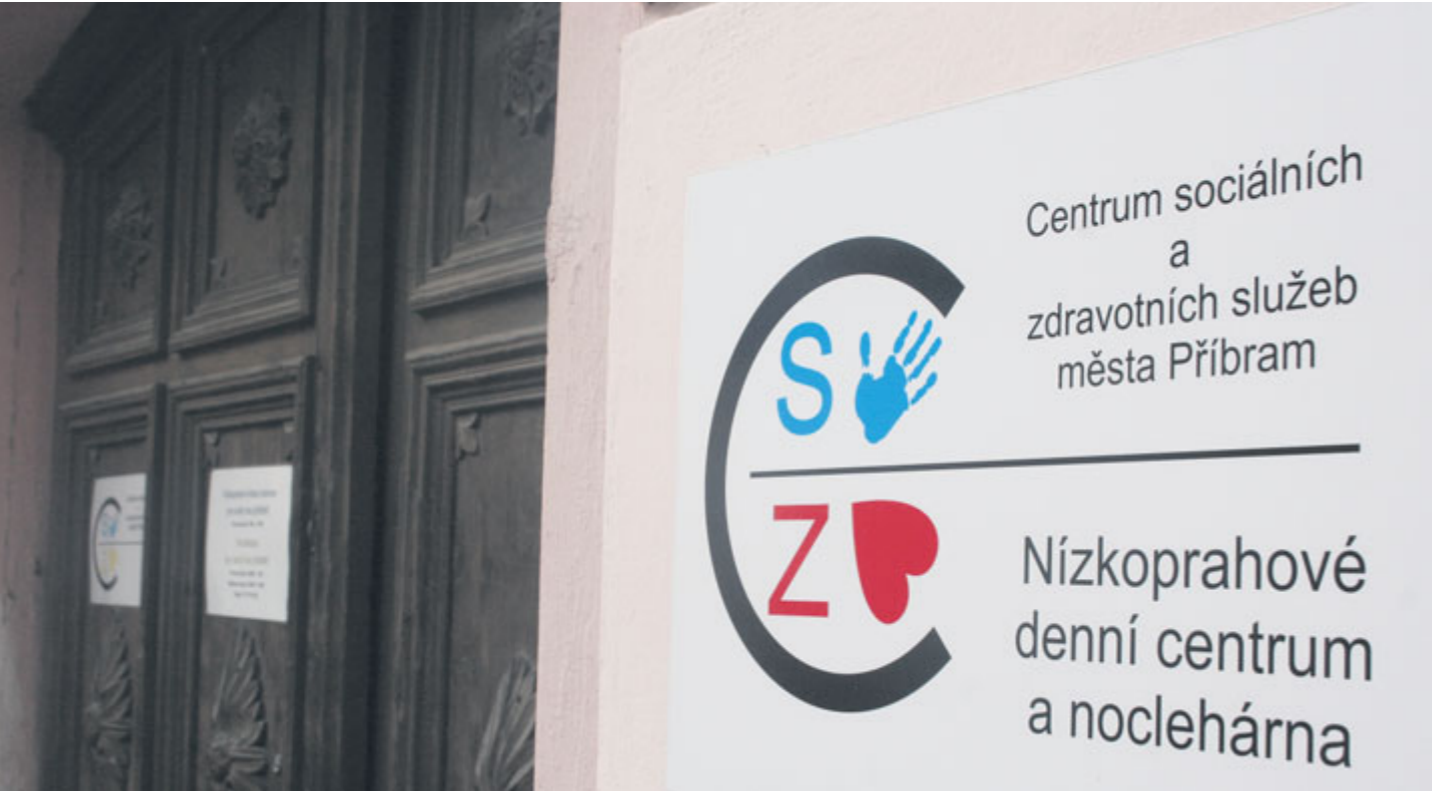
Omšelé dřevo, padající fasáda. Tak vítá nízkoprah lidi, kteří jsou na dně.

Příbram začala budovat nové nízkoprahové denní centrum a noclehárnu. Nesouhlas části veřejnosti s tímto záměrem přispěl k odložení realizace projektu, a tak bude nízkoprah k dispozici až po této zimě.