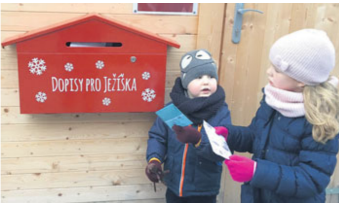
Schránka na dopisy pro Ježíška.