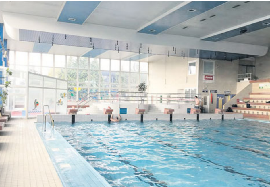
Údržba všech podlah i přes několikéré opravy spár je velmi náročná a mnohdy především vzhledově neodpovídá vynaloženému úsilí.

V současné době se velmi diskutuje o rekonstrukci plaveckého bazénu. Na toto téma debatují jak ti, kteří své názory vyjadřují z pohledu znalostí a vlastních zkušeností získaných z pravidelných návštěv, tak i lidé, kteří se dokážou k této problematice zasvěceně vyjádřit navzdory skutečnosti, že u nás v bazénu již léta nebyli. Pokusím popsat současný stav po jednotlivých zařízeních.