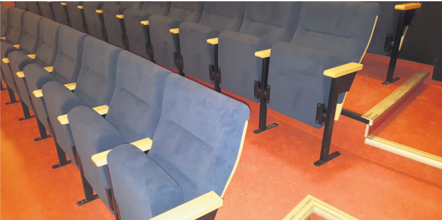
Úprava podlah a výměna sedaček přinesou divákům větší komfort.

Kino má za sebou rozsáhlou rekonstrukci. Úprava podlah, výměna sedaček, nová promítací technologie a odvodnění vyšly na přibližně 4,5 milionu korun. Promítání už začalo a diváci se mohou těšit na podstatně vyšší uživatelský komfort.