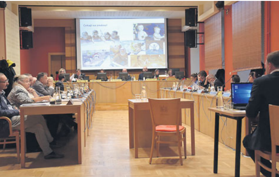
Po několikahodinové debatě se zastupitelé přiklonili k variantě, která by měla návštěvníkům bazénu přinést radikální změnu služeb k lepšímu.

Příbramští zastupitelé odsouhlasili rekonstrukci příbramského bazénu, a to ve variantě, která předpokládá nejen prostou renovaci stávajících prostor, ale vybudování plnohodnotného aquaparku včetně wellnessové zóny.