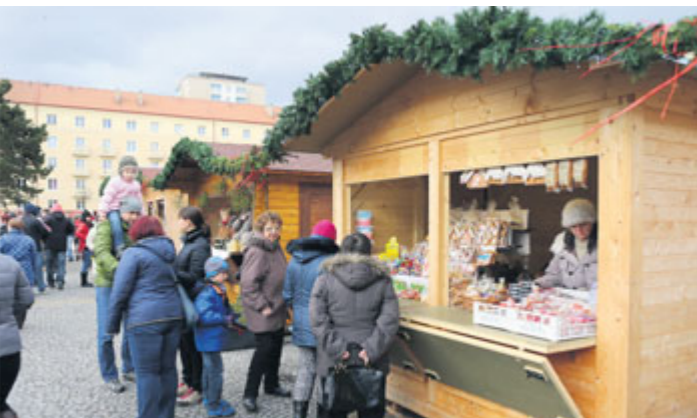
Vánoční trhy na náměstí 17. listopadu.