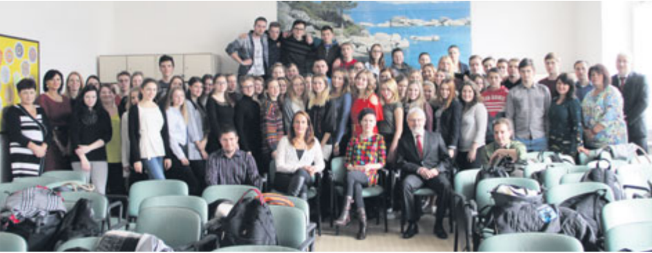
Součástí prvního společného setkání bylo testování znalostí žáků v oblasti prevence kriminality mládeže.

Na začátku školního roku zahájily Střední zdravotnická škola a Vyšší odborná škola zdravotnická v Příbrami mezinárodní projekt s jednou z lotyšských škol. Příbram navštívila skupina žáků a pedagogů z třetího největšího lotyšského města Libava (lotyšsky Liepāja), kterému se díky neustálému proudění vzduchu od Baltického moře přezdívá město větru.