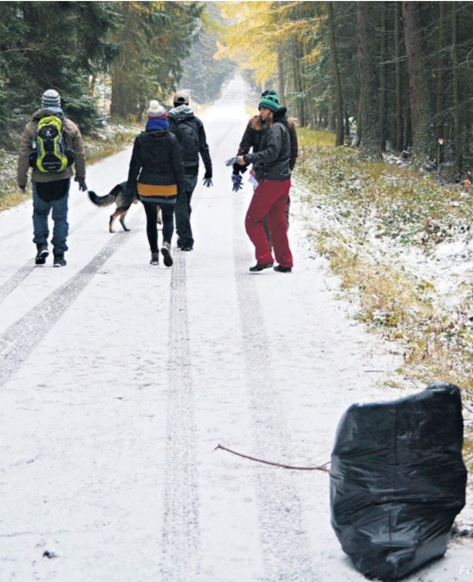
Nejčastějšími úlovkami dobrovolníků se staly poztrácené poklice aut, prázdné lahve od alkoholu a samozřejmě i PET lahve od nápojů.

Asi dvě desítky dobrovolníků se vydaly do Brd posbírat odpadky po první sezóně, kdy je území otevřeno po částečném odchodu vojáků.