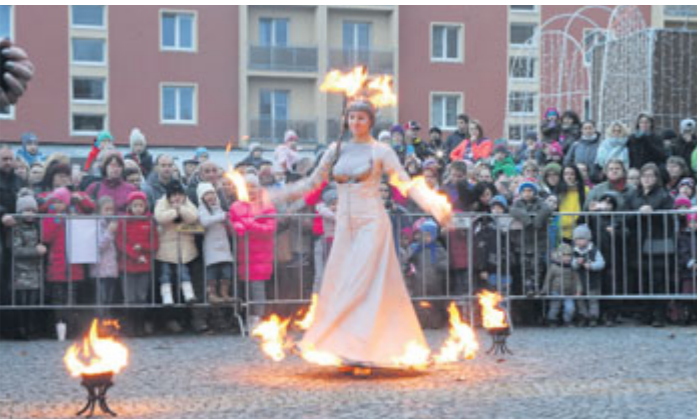
Ohňová show o adventní neděli.