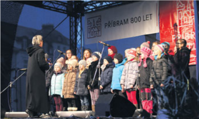
Zahájení adventu na náměstí T. G. Masaryka.