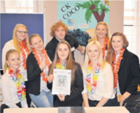
Prvenství vybojovala firma naší školy CK Coco, která se specializovala na zájezdy po ovocných ostrovech.