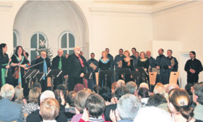
Putování do Betléma - společný koncert sborů Chairé a Codex Temporis.