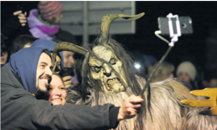
Selfie s čertem.