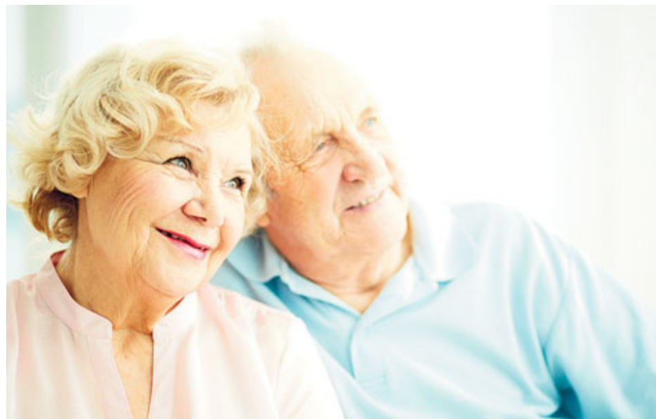
Nájemcem bytu v KoDuSu se může stát pouze člověk starší 60 let, který má v Příbrami hlášeno trvalé bydliště v souhrnu déle než 20 let.

V Příbrami vzniká unikátní bydlení pro seniory. Takzvaný Komunitní dům seniorů v Žežické ulici je jedním z prvních zařízení podobného druhu v České republice. Bydlet zde mohou lidé nad 60 let, kterým je blízká spolupráce a komunitní život s dalšími obyvateli.