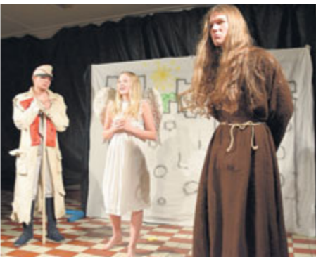
Hrátky s čertem.

Svatohorské gymnázium po dvoudenním Festivalu Divadla Dagmar završilo divadelní týden celoevropským projektem Noc divadel. Spolu s další více než stovkou souborů z celé České republiky tak třetí listopadovou sobotu nabídlo pestrý program i Malé svatohorské divadélko.