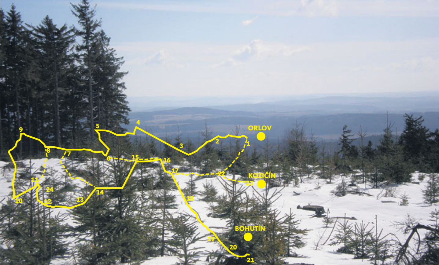
Krásný výhled z Brdců.

Když popisují tento výlet, poletuje venku sníh, který dnes leží i v Příbrami, a v Brdech od nějakých 700 m je to s opatrností i na starší běžky. Loni jsme koncem listopadu nad Drahlínem dobývali ze sněhu hříbky. Ale o Vánocích přichází pravidelně obleva a obávám se, že ani letos tomu nebude jinak.