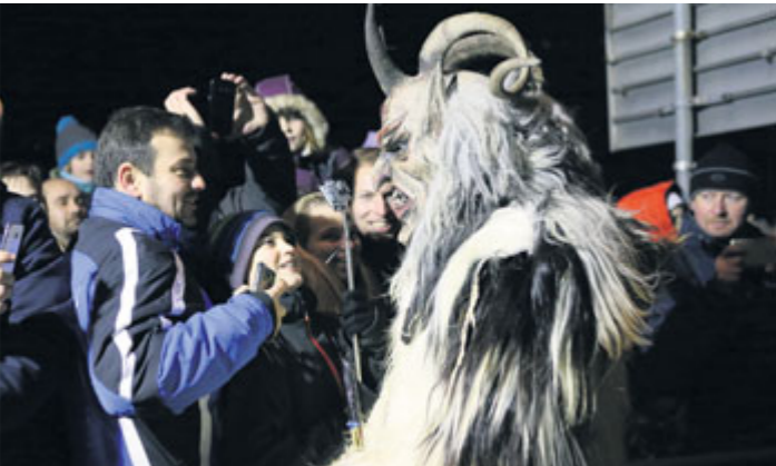
Příbramský Krampuslauf 2016.