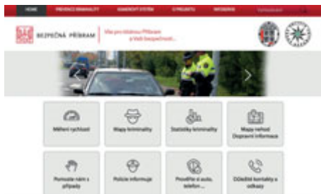
Úvodní stránka webu BezpecnaPribram.cz

Nový web BezpecnaPribram.cz je výsledkem spolupráce policistů, strážníků a města. Zapojit se mohou také občané – jako čtenáři, ale také autoři námětů a připomínek.