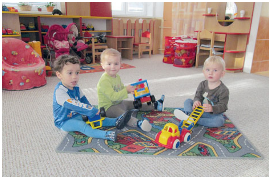
Foto: Městské jesle a rehabilitační stacionář

Městské jesle a rehabilitační stacionář tvoří integrální součást Centra sociálních a zdravotních služeb města Příbram.