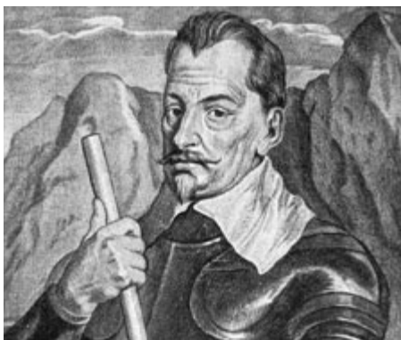
Vévoda frýdlantský a meklenburský Albrecht z Valdštejna.

Albrecht z Valdštejna byl úspěšný proto, že dokázal překonat společenské stereotypy své doby - nenechal se svazovat předsudky, pragmaticky vyhodnocoval situaci a jeho cíle byly ekonomicky podloženy. Byl tak mj. schopen dodat císaři potřebný počet vyzbrojené a vycvičené