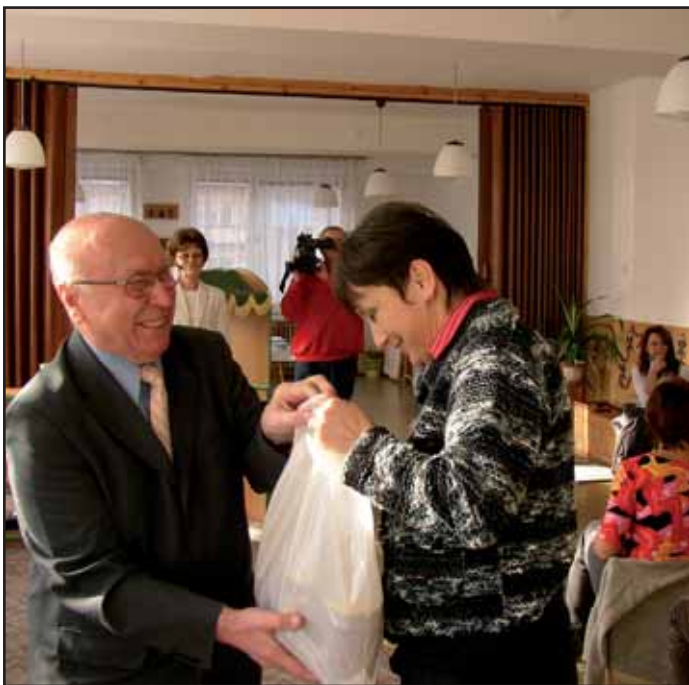
Příbramští včelaři předali městu zdarma 50 kg medu pro mateřské školy. Dne 30. 11. se oba místostarostové sešli s ředitelkami MŠ a med jim předali.