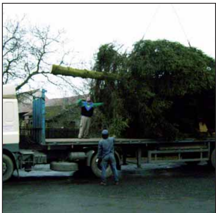
Tento vzrostlý strom věnovali Zavržičtí městu, aby zdobil náměstí TGM a připomínal všem krásný vánoční čas.