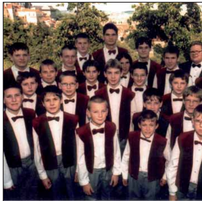
V pondělí 4. 12. zazpíval v Divadle A. Dvořáka chlapecký sbor Boni Pueri. Za svůj výkon sklídili obrovský aplaus.