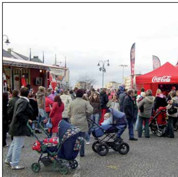
Vánoční kamion Coca-Cola přijel na náměstí TGM v úterý 5. prosince. Děti si zde příjemně zkrátily čekání na Mikuláše a čerty.