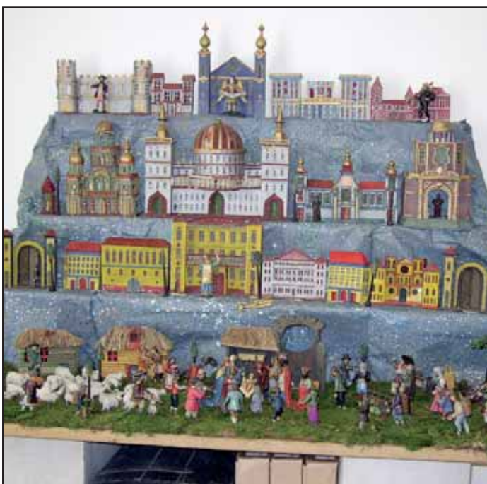
Od čtvrtka 7. 12. vystavuje Hornické muzeum Příbram v Galerii F. Drtíkova v Zámečku - Ernestinu betlémy příbramského regionu.