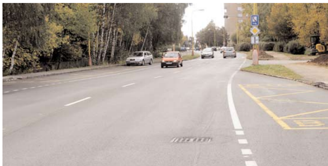
Další nově opravená silnice. V Příbrami je opravena část silnice č. III/1911 na Zdaboři. Jde o zhruba kilometrův úsek na hlavním tahu. Pětimilionová dotace byla využita na frézování, lokální sanaci a vyrovnání povrchu. V současnosti Středočeský kraj investuje do středočeských silnic půl miliardy korun navíc. Nově vyčleněné peníze jdou na rekonstrukce komunikací formou odloženého financování. Provádějí je firmy, se kterými má Středočeský kraj podepsané smlouvy na běžnou údržbu silnic II. a III. třídy a opravy zaplatí tzv. "ze svého". Středočeský kraj pak po dobu dvou let bude finance splácet bez jakéhokoli úrokového zatížení či navýšení podle již dnes platného a vysoutěženého ceníku oprav. Středočeské silnice tak získají zcela nové povrchy v celkové délce 200 kilometrů, to je pro představu jako by se udělala nová silnice z Prahy do Brna.