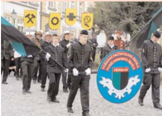
Studenti Střední průmyslové školy a VOŠ Příbram se zúčastnili tradiční hornické akce - Skoku přes kůži.