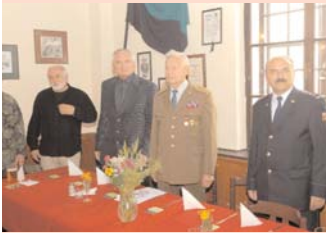
U příležitosti 65. výročí od Dukelské operace se konalo slavnostní setkání na Dole Marie.