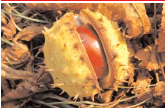
Krásný podzimní obrázek.