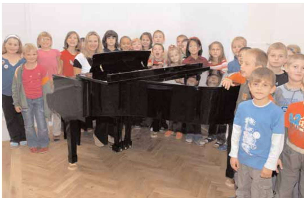
Základní škola Jiráskovy sady si z dotace z tzv. Norských fondů koupila také nové koncertní křídlo.