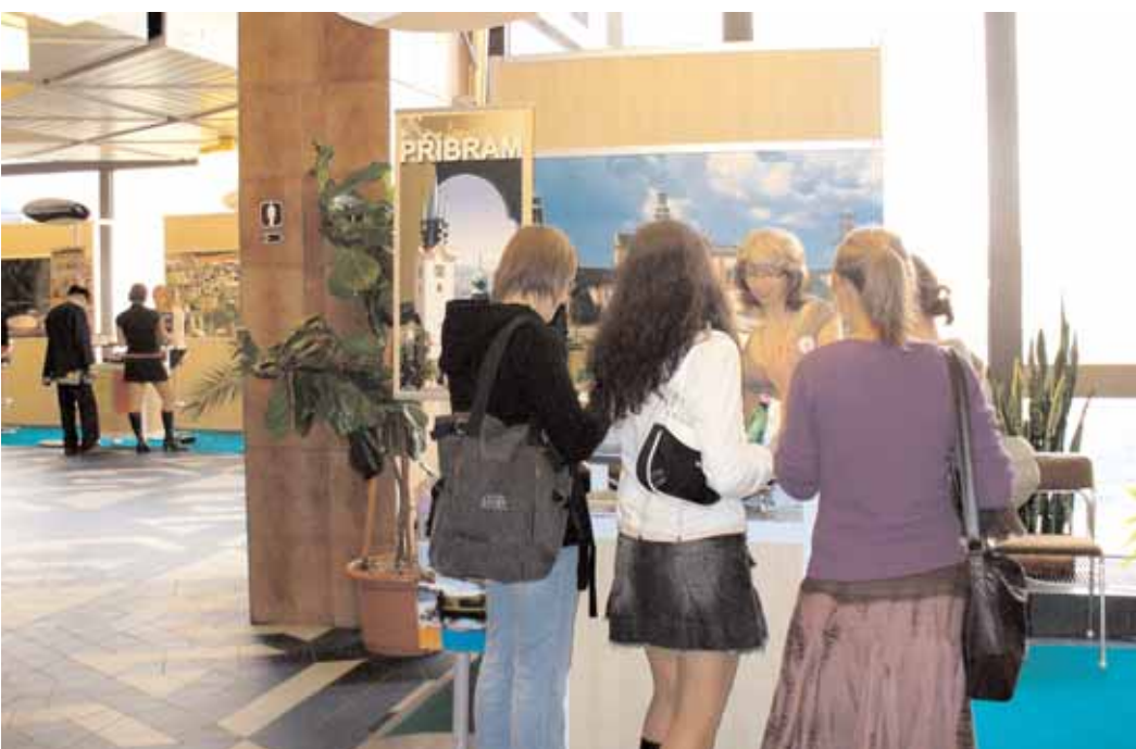
Město Příbram se zúčastnilo ve dnech 4. - 6. října 2007 veletrhu ITEP v Plzni