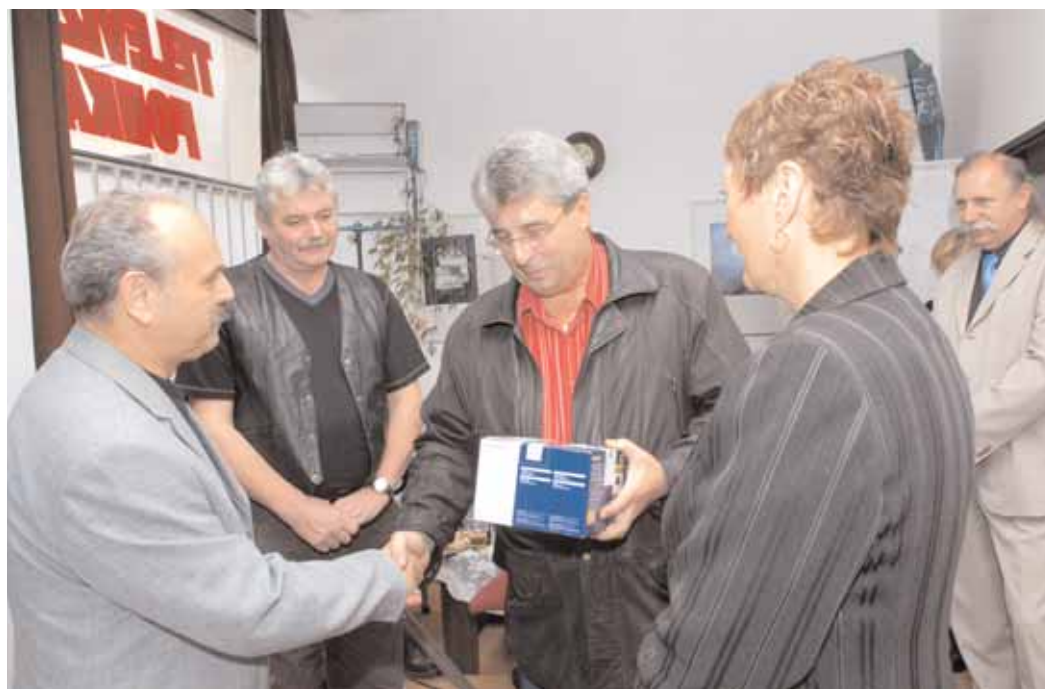
TV Fonka oslavila 2. listopadu deset let svého vysílání. Během oslavy předal starosta Příbrami kameru hasičům, kteří s TV Fonka v rámci integrovaného záchranného systému spolupracují.