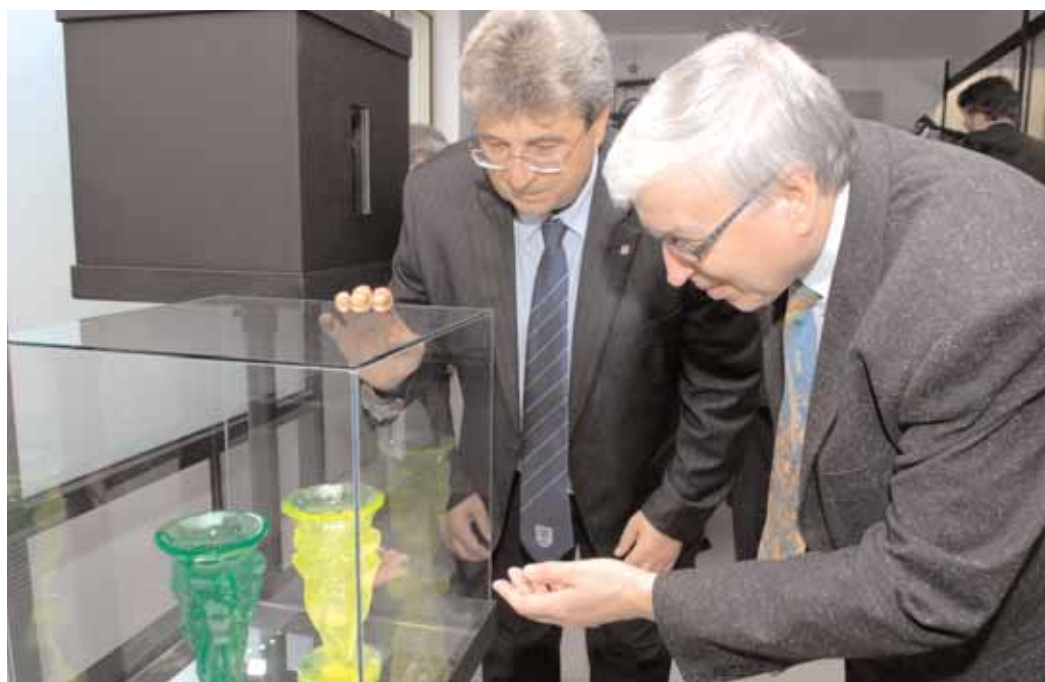
V Památníku Vojna byla letos v říjnu slavnostně otevřena expozice "Český uran".