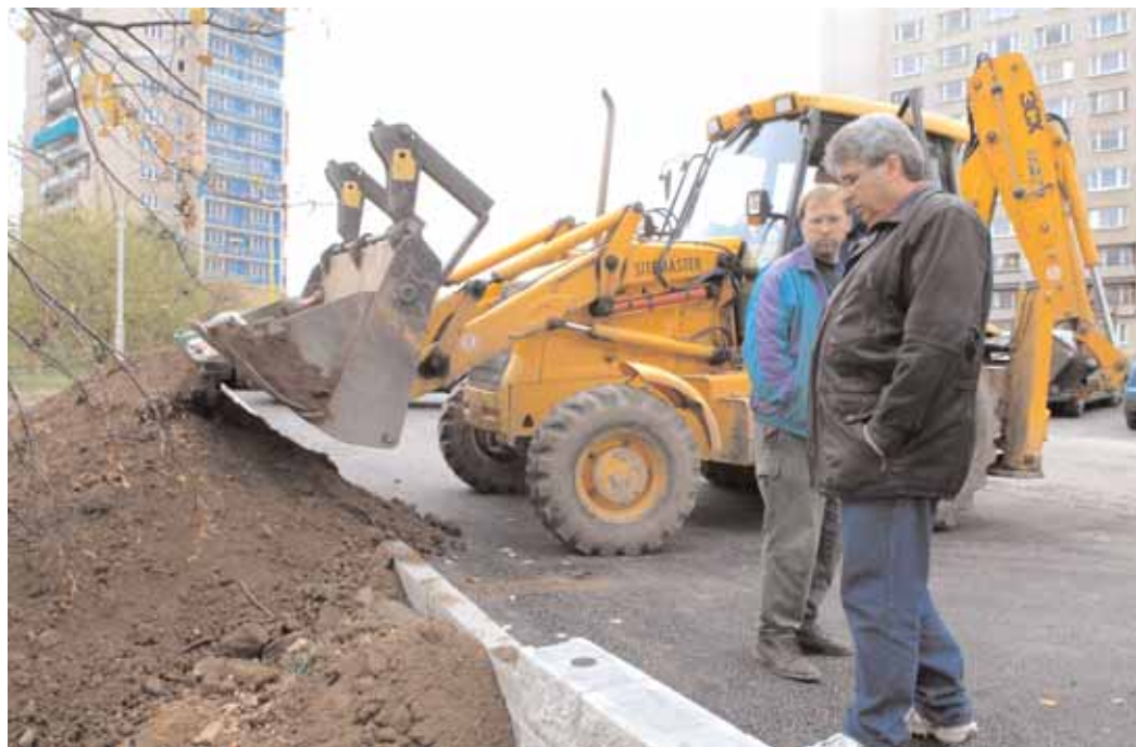
Dne 2. 11. starosta osobně kontroloval práce na výstavbě nového parkoviště v ulici Budovatelů.