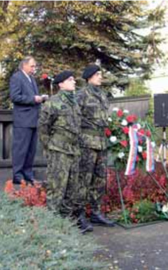
Město Příbram si letos připomnělo 88. výročí vzniku samostatného československého státu.