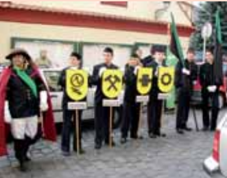
Dne 18. října se konal další Skop přes kůži. Tuto slavnostní akci organizuje každoročně Střední průmyslová škola a VOŠ Příbram. Účastníci byli přijati i na radnici.