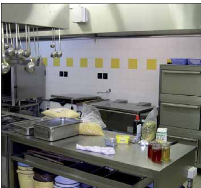
Ve školní kuchyni 3. ZŠ Březové Hory byly provedeny stavební úpravy, bylo dodáno nové gastrozařízení, vzduchotechnika, byl osazen výtah pro dovoz jídla ze suterénních prostor atd. Rekonstrukci prováděla firma Alva spol. s r. o. Cena díla je 4 370 000,- Kč. Po rekonstrukci kuchyně splňuje normy, které předepisuje Evropská unie.