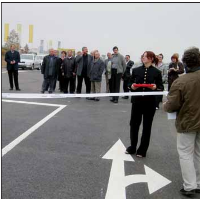
Obchvat Dubna byl slavnostně předán do provozu a slouží již řidičům. Občané Dubna si konečně mohli oddechnout.