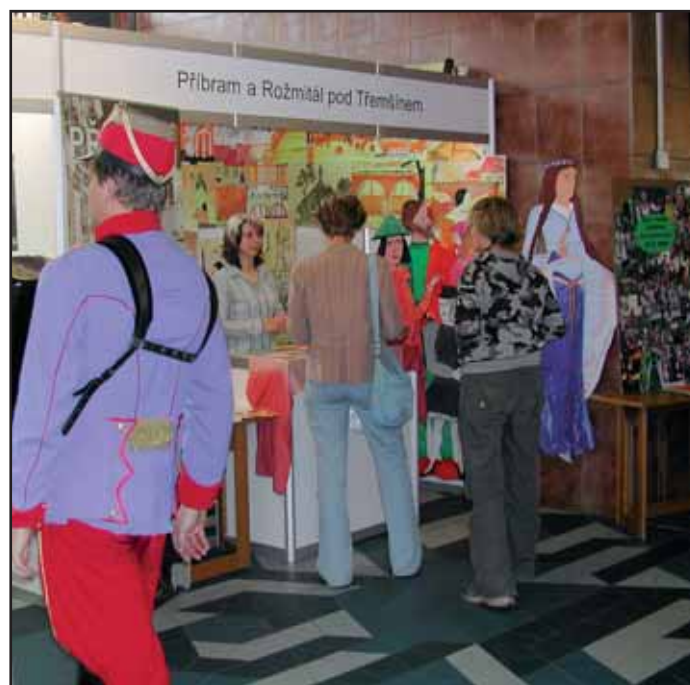
Město Příbram se poprvé zúčastnilo 2. ročníku veletrhu cestovního ruchu Plzeňského kraje ITEP 2006.