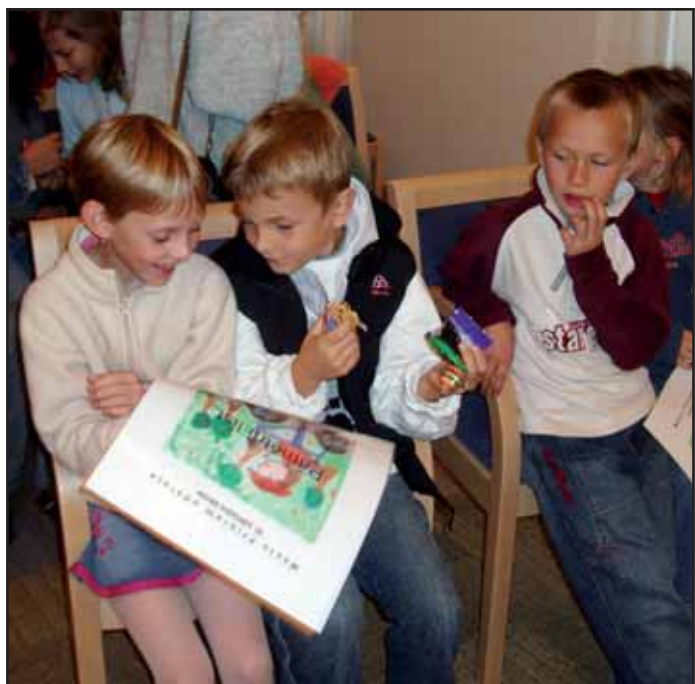
V obřadní síni v Záměcku - Ernestinu byla vyhodnocena výtvarná soutěž dětí vyhlášená v rámci Evropského dne bez aut.