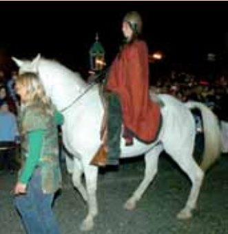
Spolek Prokop a město Příbram společně připravily na 10. listopad „Pochod se svítky za svatým Martinem“. Průvod šel z Březových Hor na náměstí TGM, kde děti přivítaly sv. Martina a na závěr se klouzaly na klouzačce s umělým sněhem.