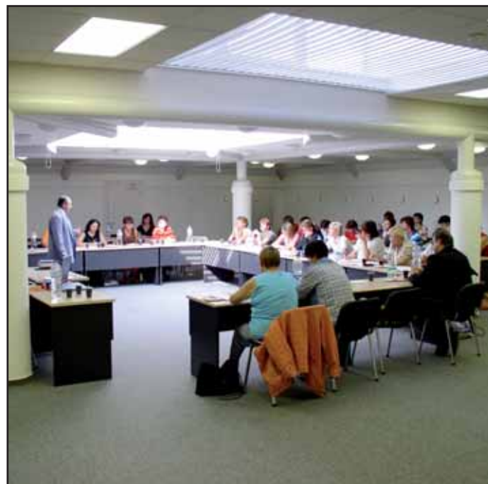
Nové vzdělávací středisko BOZP je od září v provozu. Více informací najdete uvnitř čísla.