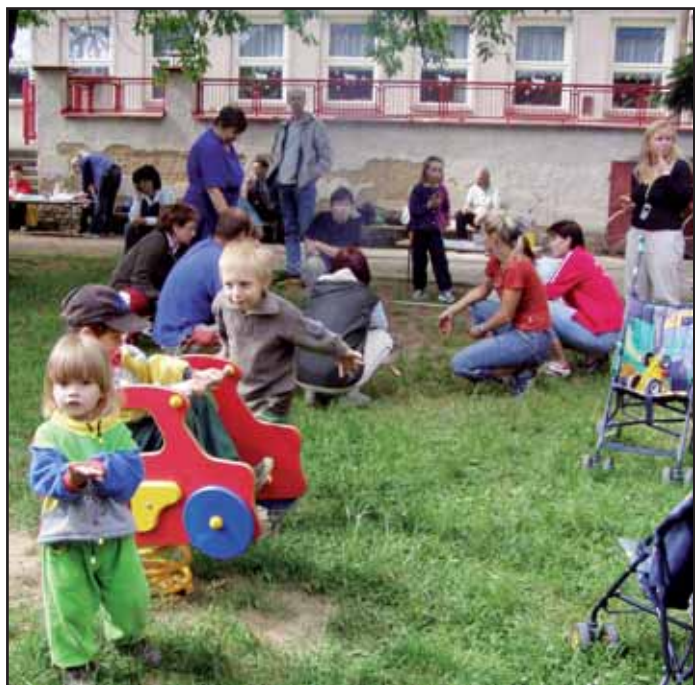
4. mateřská škola obdržela grant z krajského úřadu a za získané prostředky mají na školní zahradě nové vybavení.