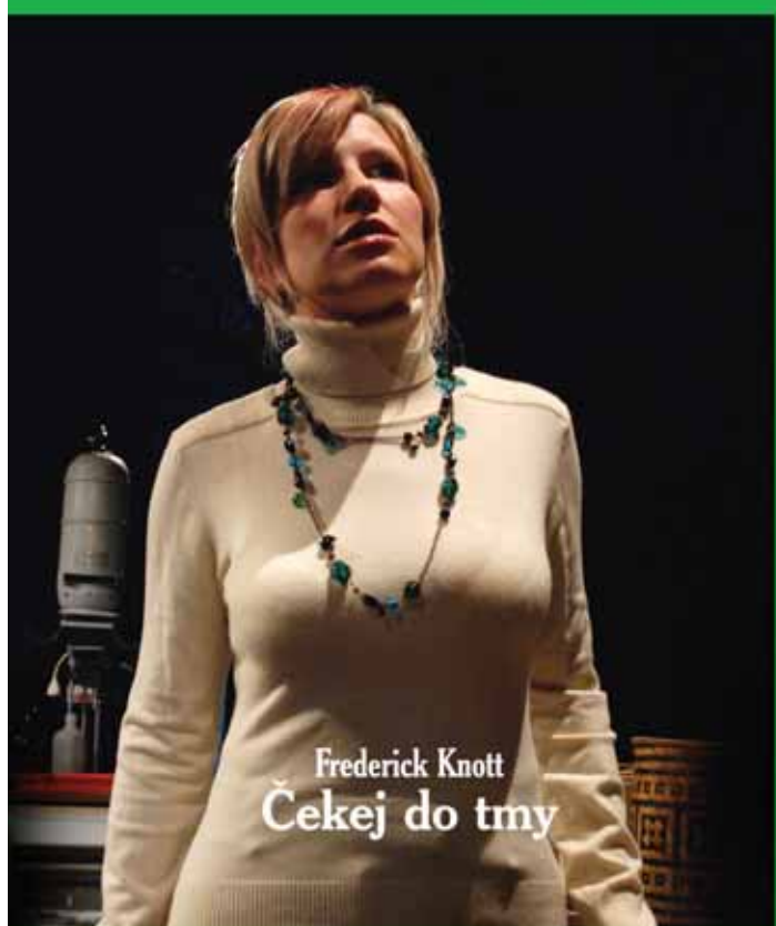
Frederick Knott Čekej do tmy