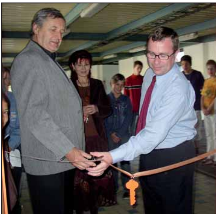
Zástupci města slavnostně otevřeli zrekonstruované tělocvičny na 7. základní škole Příbram.