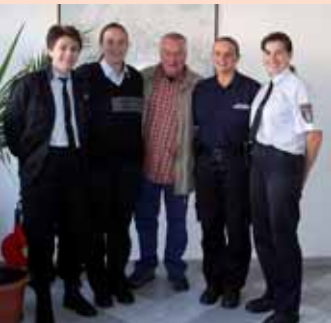
V říjnu se zastavil na služebně Městské policie na Březových Horách herec Ladislav Potměšil, kterého znáte z filmů o Policejní akademii. Že by se natáčel další?