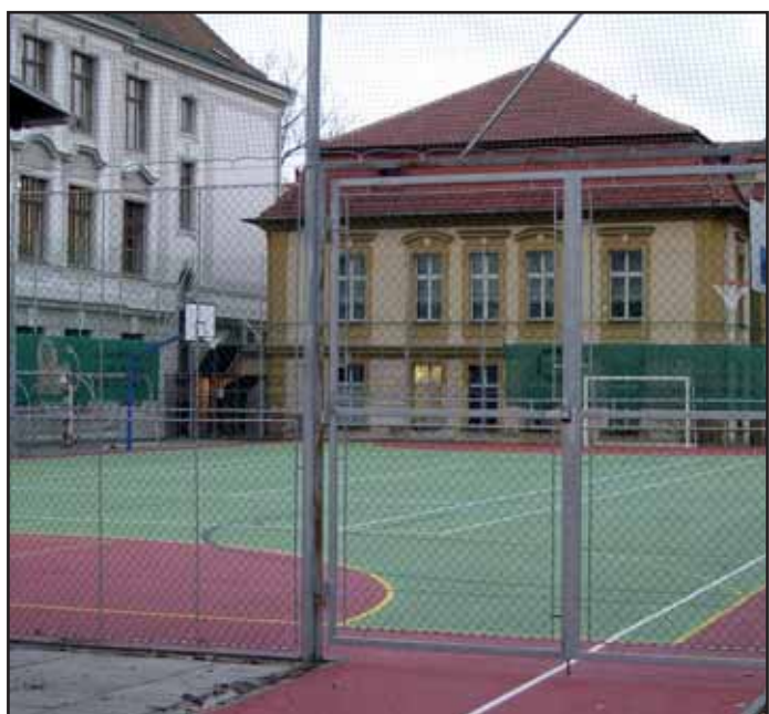
Na sportoviště ZŠ Jiráskovy sady byl položen umělohmotný povrch Conipur EPDM. Zhotovitelem byla firma Tubeko sport, s. r. o., náklady činily 2 016 136,- Kč. Akce zahrnovala položení povrchu na hřiště a běžecké dráhy ve dvou barvách včetně lajnování, dodávku branek, sloupků, sítí, košů a vybudování prostoru pro vrh koulí.