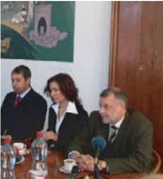
Bulharský velvyslanec Martin Tomov (první vpravo) navštívil dne 24. října Příbram. Slavnostního přijetí na radnici se zúčastnil starosta i oba místostarostové.