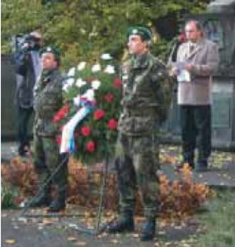
Ve čtvrtek 27. 10. jsme si připomněli výročí vzniku samostatného československého státu.