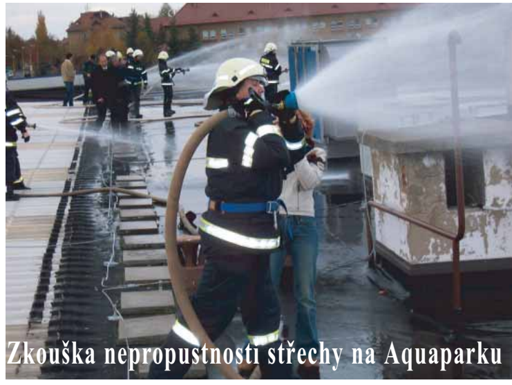
Zkouška nepropustnosti střechy na Aquaparku

Ve dnech 23. až 26. října se konal v Divadle Příbram již 7. ročník Mezinárodního festivalu dětských pěveckých a tanečních souborů. Podle informace 1. místostarosty V. Beneše byla účast souborů v letošním roce o něco nižší než vloni. Jednotlivá představení byla i v blízkých městech, například Březnici, Rožmitále a Milíně.