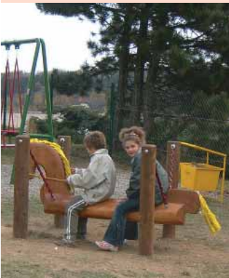
Nové hřiště vybudovali pracovníci Technických služeb v Příbrami VIII. Hledá se další místo, které bude takto zvelebo.

Dne 23. září 2005 podepsalo město Příbram grantovou smlouvu na projekt „Hornický vláček Březové Hory“. Dotace, kterou Příbram získala ze strukturálních fondů EU, činí 3,5 mil. Kč, což představuje 75 % celkových nákladů projektu. Dle plánovaného časového harmonogramu by stavební práce měly být ukončeny v červenci příštího roku.