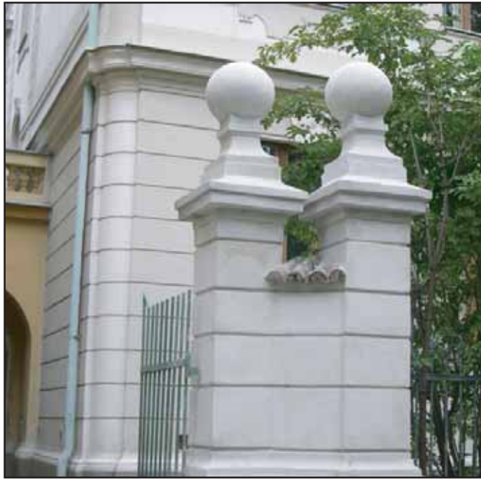
Na budově 7. školní jídelny byla opravena fasáda i ozdobné prvky.