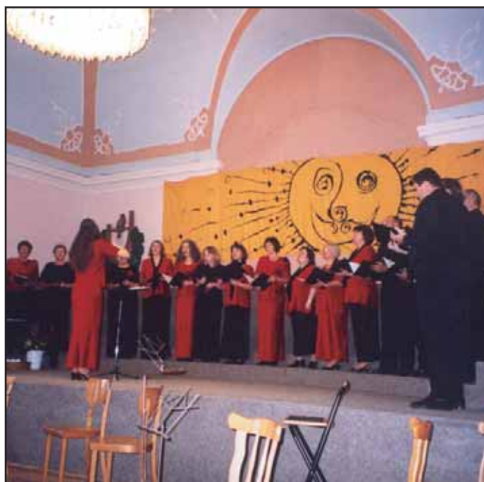
V sobotu 16. října se v aule ZŠ Jiráskovy sady uskutečnil I. ročník Festivalu pěveckých sborů.