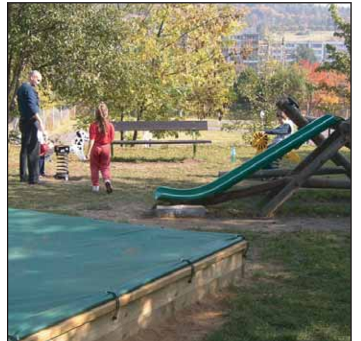
Při krásném počasí je nové dětské hřiště plně využíváno.