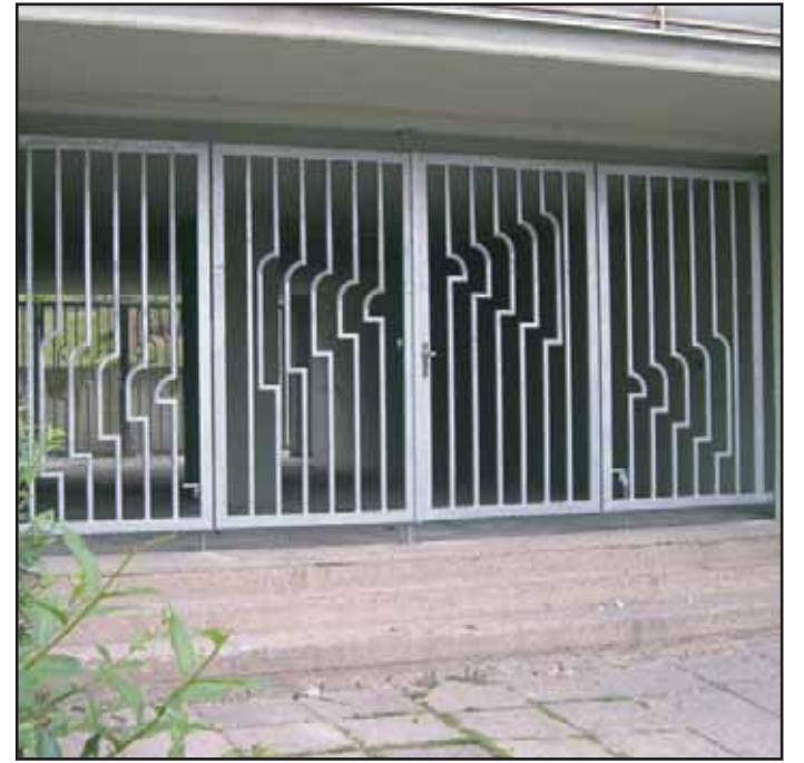
V Dlouhé ulici byly osazeny mříže, kterými se na noc uzavírá nebezpečný průchod. V tomto místě došlo k přepadení.