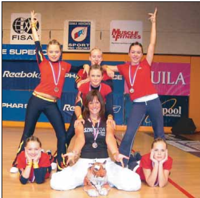
Ve finále PHAR SERVICE FITNESS CUPU 2004 obsadily kadetky Sportovního klubu Oxygen Příbram krásné 3. místo.