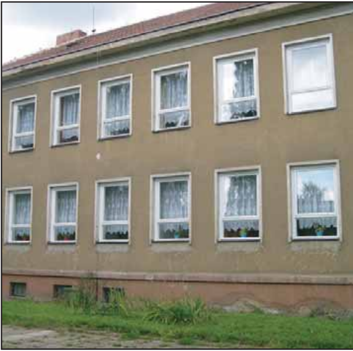
Během léta byla opravena a natřena okna 6. mateřské školy.