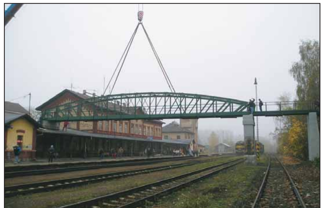
Ve středu 3. 11. 2004 byla na původní místo vrácena zrekonstruovaná lávka přes železniční trať. Do užívání byla slavnostně předána ve čtvrtek 4. listopadu.