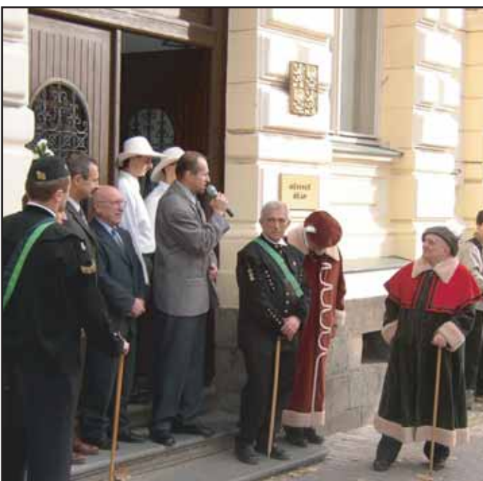
Slavnostnímu „Skoku přes kůži“ předcházela tradiční průvod městem. Účastníci průvodu byli také přijati na radnici.