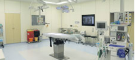
Všech šest operačních sálů má nyní laparoskopické vybavení s Full-HD kvalitou.

Lékařům při laparoskopických zákrocích pomohou s orientací v prostoru a odhadem vzdáleností nově i 3D brýle se speciální laparoskopickou 3D kamerou.