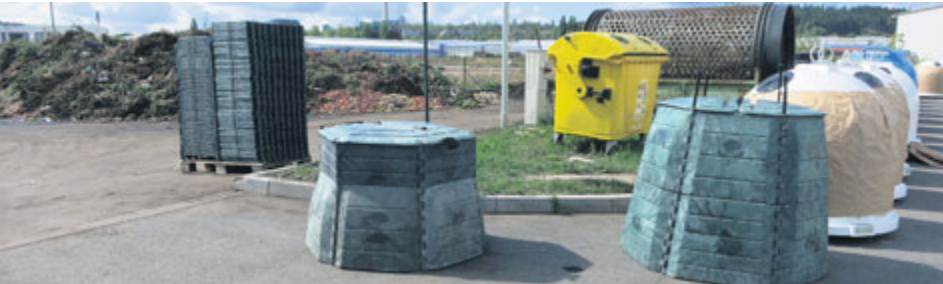
Kdo v minulosti již nezačal s kompostováním, dostal nyní ideální příležitost.

Kompostéry budou moci lidé využít pět let formou zápůjčky od města Příbram, které bude v této době jejich majitelem. Posléze kompostéry přejdou do vlastnictví jednotlivých uživatelů.