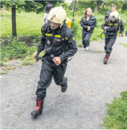
Jedním z pravidel Běhu hasičů do Svatohorských schodů je, že se běží ve dvojici a časomíra se zastaví až při doběhu druhého závodníka.