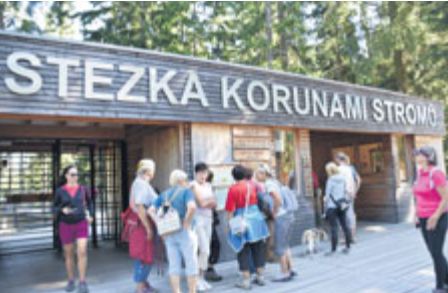
V neděli dopoledne měli senioři možnost rozhlížet se ze Stezky korunami stromů. Odpoledne se příjemně unavení vraceli do Příbrami. „Měli jsme nádherné pocity z toho, co vše jsme zvládli,“ říkají účastníci.

■ Text: Tým příbramských seniorů (Senior Point)