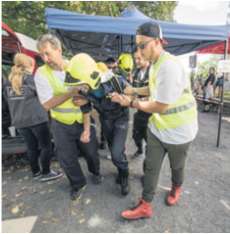
Zdolat schody je náročné. Hasiči si touto soutěží připomínají požár areálu Svaté Hory a nasazení, s jakým se do záchrany památky pustili jejich někdejší kolegové. Letos jsme si připomněli 40 let od této události.

■ Fotografie: Petr Čížek Text: Stanislav D. Břeň