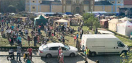
Takto vypadala letošní Šalmaj: Krásné počasí a spousta návštěvníků.