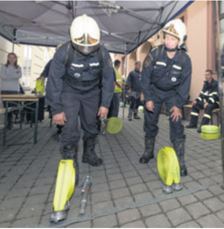
Síla a odhodlání na startu závodu v ulici Dlouhá. Na start se letos postavilo přes sedm desítek dvojic. Schody si vyběhlo také 19 ženských družstev.

Zdolat Svatohorské schody může představovat pro některé návštěvníky nelehký oříšek. Příbramští hasiči zvou již několik let své kolegy z blízkého i vzdálenějšího okolí, aby se s nimi o tento zážitek podělili. A to v „plné polní“ a na čas. Letos přijeli změřit své síly i hasiči z partnerského města Hoorn.