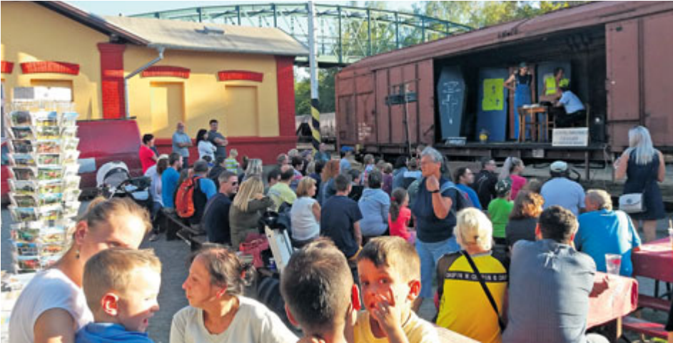
Obvyklý celodenní doprovodný program zahrnoval jízdy na drezíně, divadelní a hudební představení nebo prohlídky pracoviště výpravčího. V rámci oslav Dne železnice v Příbrami pak naleštěná modro-žlutá lokomotiva odvezla i zvláštní vyhlídkový vlak z Příbrami do Jince a zpět do Březnice. Své cestující si opět našly i zvláštní vlaky do Kovohutí, které nově dopravovaly dvě historické motorové lokomotivy řady T 212. Více zájemců o svezení zaznamenala i retro vyhlídková linka Podbrdského minibusu, spojující vlakové nádraží, dějiště Běhu Kovohutěmi, Pivovar Podlesí a Hornické muzeum na Březových Horách. Ste výročí vzniku ČSR a související význam železnice připomněli ochotníci z Divadla za vodou v Čenkově ztvárněním postavy prezidenta osvoboditele Tomáše Garrigue Masaryka a jeho doprovodu.

■ Fotografie: Ondřej Švandelík Text: Ondřej Švandelík