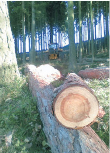
Novela stavebního zákona ruší samostatné řízení o povolení kácení dřevin pro účely stavebního záměru.

Nedávná úprava legislativy se týká mimo jiné kácení dřevin v souvislosti se stavebními záměry. Přinášíme stručný přehled změn a doporučení, jak postupovat, pokud je kácení stromů nevyhnutelné.