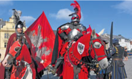
V dopoledních hodinách se na náměstí T. G. Masaryka šikoval průvod, který se pak za doprovodu obyvatel a hudby (mj. zvuků šalmaje) vydal na Svatou Horu.

Nádvoří Svaté Hory se v sobotu 8. září opět přeneslo o několika století zpět. Konal se zde 11. ročník Příbramské svatohorské šalmaje, která přibližuje, jak lidé žili a bavili se ve středověku. Šalmaj je přehlídkou řemeslného, artistického, tanečního, divadelního i pěveckého umu. Nejinak tomu bylo i letos.