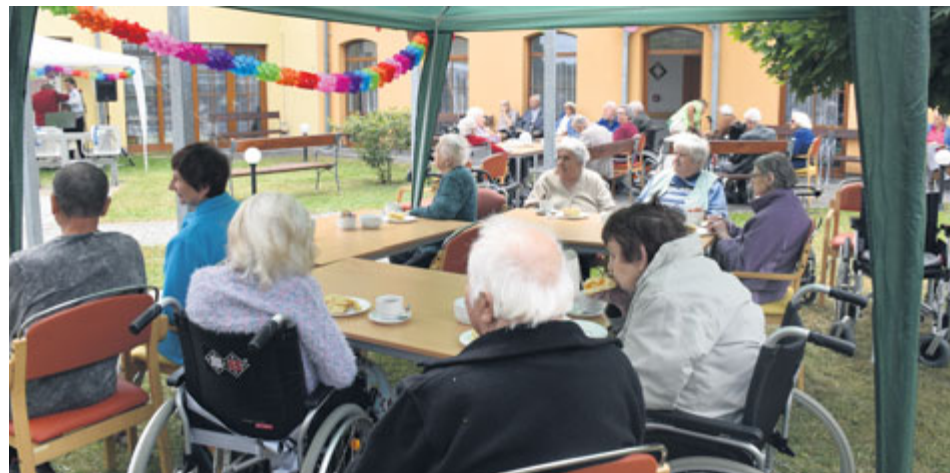
Centrum sociálnych a zdravotných služieb sa stará o seniory...

Letos v létě to byly tři roky od doby, kdy bylo zřízeno Centrum sociálních a zdravotních služeb města Příbram. Jedná se o příspěvkovou organizaci, jejímž hlavním smyslem a úkolem je poskytování sociálně zdravotních služeb jak pro občany města, tak pro lidi z bližšího i širšího okolí.