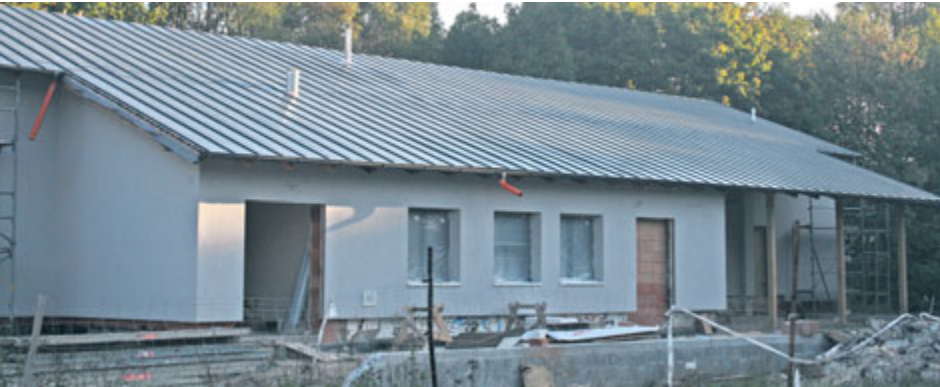
V čase uzávěrky Kahanu finišovaly v Junioru stavební práce.

Rekonstrukce Junior klubu se přiblížila ke svému závěru. Na konci září se zde dokonce uskuteční první zahajovací party. Město Příbram aktuálně hledá provozovatele celého klubu s občerstvením.