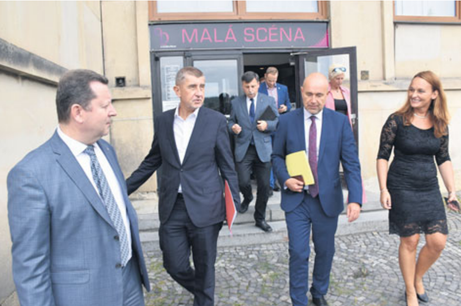
Debata o potřebě rekonstrukce se nevedla pouze na radnici, ale přímo v kulturním domě.