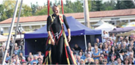
Velkou pozornost vzbudila hra Romeo a Julie „v závěsu“.