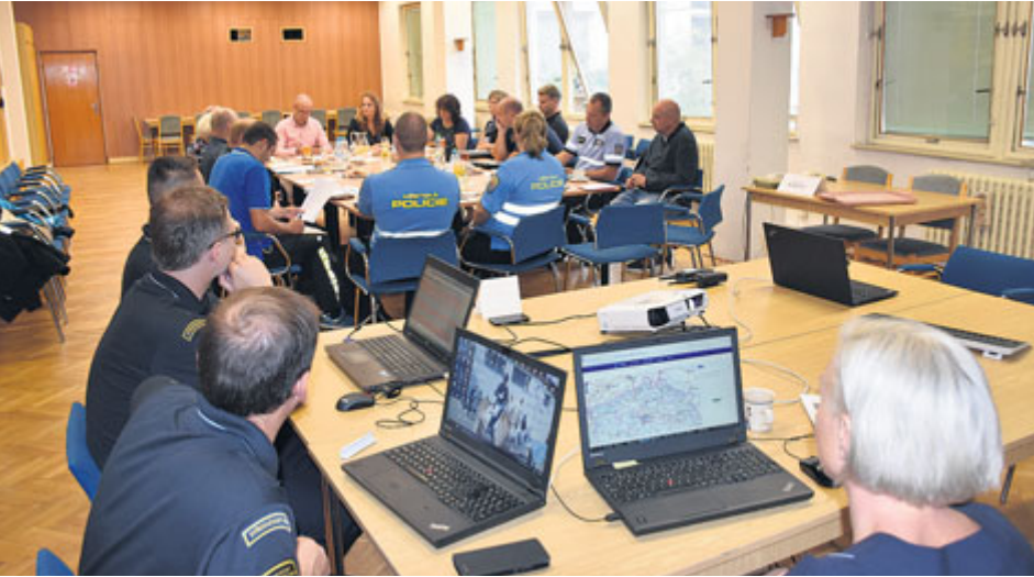
Příbram se zapojila do cvičení, které se zaměřovalo na kompletní výpadek elektřiny, tzv. blackout.

Na začátku září letošního roku se město Příbram zapojilo do celokrajského cvičení nazvaného Blackout 2018. Po jeho vyhodnocení by měl mít kraj dostatek informací o tom, jak by města nebo celý kraj měly reagovat na případný kompletní výpadek dodávky elektrické energie.