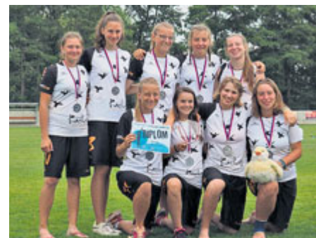
Hráčky týmu Kachny Příbram...

Ultimate frisbee je sport, který není v Příbrami tak dlouho. Atletický tým SK Sporting se však už nyní může pochlubit juniorským stříbrem z Mistrovství České republiky.