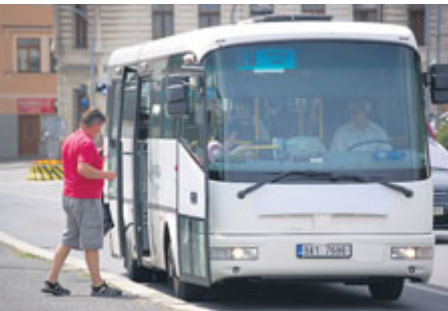
Kdo bude provozovat příbramskou MHD, se rozhodne ve výběrovém řízení.

V závěru volebního období mělo příbramské zastupitelstvo na programu jeden z klíčových bodů, a to městskou hromadnou dopravu v Příbrami. Příbramští zastupitelé na svém zasedání v pondělí 10. září nakonec neschválili prodloužení smlouvy se současným provozovatelem příbramské městské hromadné dopravy, kterým je společnost Arriva Střední Čechy.