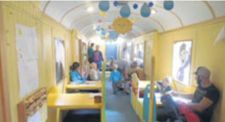
Děti uvítaly provoz kinovozy a nově i speciálního Vlákku hráčku.