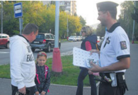
Policisté informovali děti, jak mají správně přecházet silnici.

Každoročně se začátkem školního roku probíhá po celé republice dopravně preventivní akce s názvem Zebra se za tebe nerozhlédne. Ve čtvrtek 6. září se uskutečnila v Příbrami u ZŠ Školní.