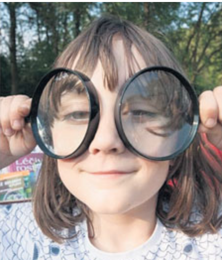
Chystá se akce pro všechny zvědavé děti.

Příbramský spolek DaR, který provozuje Montessori klub, chystá zábavně-vzdělávací den pro celou rodinu, který se uskuteční v pátek 28. září 2018 v lesoparku Litavka.