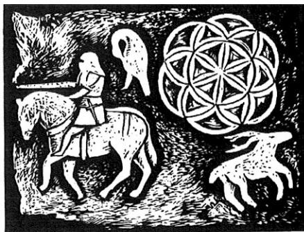
Reliéf na kresbě Jana Čáky.

Na jedné z parcel, na kterých dnes na příbramském náměstí TGM stojí budova Knihovny Jana Drdy (č. p. 156/I), prokazatelně bývala nejpozději v první polovině 17. století hospoda.