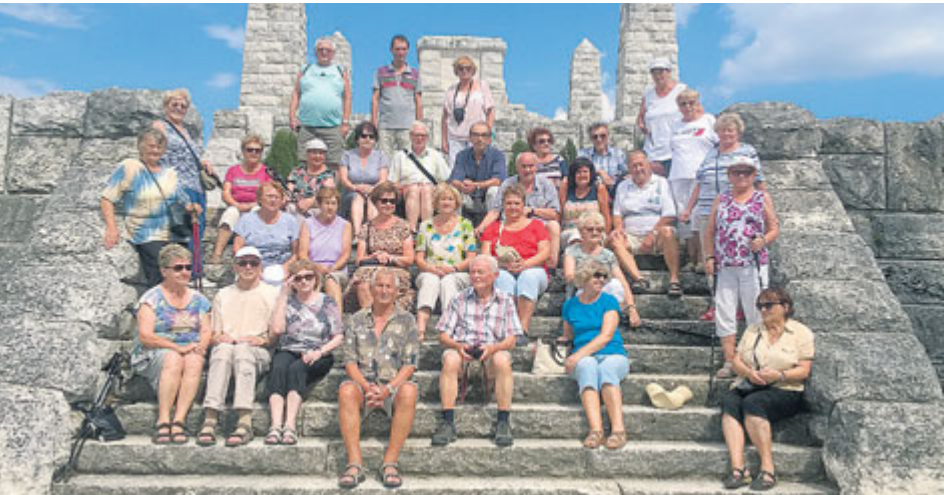
Vládlo pěkné počasí i skvělá nálada.

Výletníci z příbramského Svazu tělesně postižených se na Slovensku nezajímali pouze o krásy lázeňského města. Během výletů do okolí si připomněli také sté výročí založení samostatného Československa.