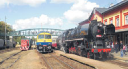
Největší zájem veřejnosti byl o jízdy parními vlaky do Březnice, v jejich čele letos stanula těžkotónážní lokomotiva řady 556 - „Štokr“. Velké zpestření představovalo i mimořádné nasazení retro soupravy legendárního rychlíku Ostravan a unikátní motorové lokomotivy řady T 499 - „Kyklop“ na pravidelný spěšný vlak Cyklo Brdy z Prahy do Březnice a zpět.

V sobotu 8. září se po několikaměsíčních přípravách uskutečnil na příbramském nádraží další, v pořadí již osmý ročník regionálních oslav Dne železnice. Ve spolupráci s partnery akce bylo pro návštěvníky připraveno mnoho zajímavostí.