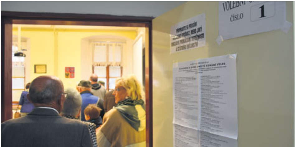
V Příbrami a osadách je 39 volebních okrsků.

V řádném termínu vypsaném prezidentem republiky se v Příbrami uskuteční volby do zastupitelstva města. Konají se v pátek 5. a v sobotu 6. října letošního roku.