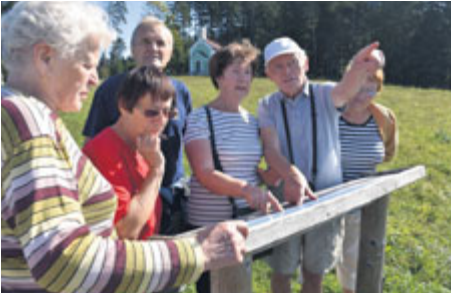
Sobotní program byl zahájený cvičením jógy na břehu Lipenského jezera. Dopoledne cykloskupina využila cyklostezky, která vede po břehu Lipenské přehrady. Pěší skupina vyšla podle Křížové cesty ke kapliče, vyhlídkovému místu. Odtud byl vynikající výhled na jezero i Frymburk.