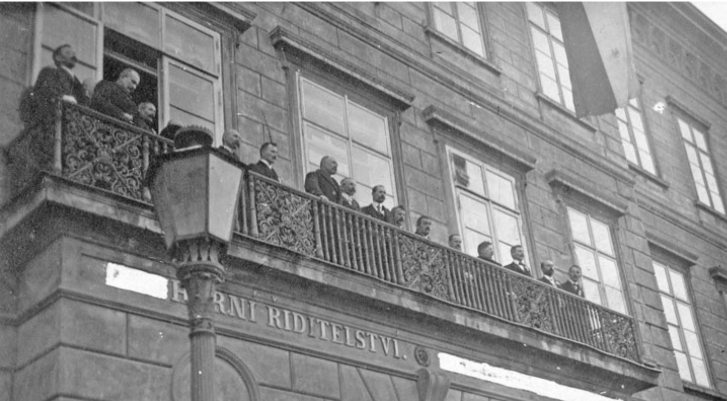
Členové příbramského Okresního národního výboru vyhláší 29. října 1918 vznik ČSR, a to z balkonu Báňského ředitelství.

Česká republika si letos připomíná 100. výročí od založení Československa. Toto významné jubileum nezůstane bez povšimnutí ani v Příbrami. Oslavy založení Československa se ve městě uskuteční 13. a 24. října, a to za podpory Ministerstva kultury ČR.