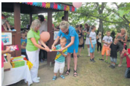
..., ale v rámci dětských skupin také o ty nejmenší.

Centrum sociálních a zdravotních služeb města Příbram