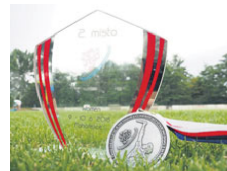
... a trofej z Mistrovství ČR.

Kachny Příbram, tak si říká příbramský team moderní kolektivní hry Ultimate frisbee. Založen byl před dvěma lety v rámci atletického klubu SK Sporting. Z letošního léta se může tento relativně mladý oddíl pochlubit stříbrnou medailí na Mistrovství ČR juniorek a také účasti na mnoha dalších soutěžích. Co to vlastně je frisbee? Jedná se o kolektivní bezkon-