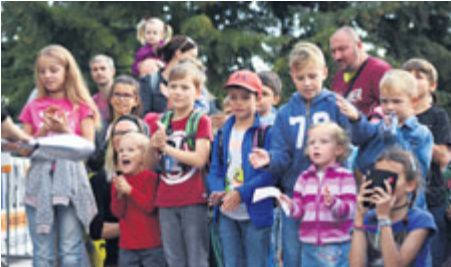
Každoročně je Šalmaj podívanou především pro děti. Samy si mohou např. vyrobit svíčky, potisknout tašku nebo si vyzkoušet stará řemesla jako provaznictví.