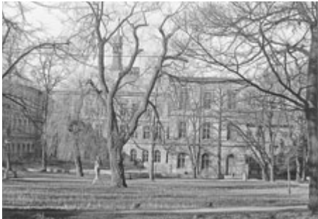
Park Zátiší v letech 1968–1969.

Letošní oslavy 100. výročí vzniku Československé republiky vyvrcholí během října. Trvalou vzpomínkou by se měl stát i nový strom republiky, který bude vysazen 24. října 2018 v parku zvaném dnes Zátiší. Strom ponese jméno Lípa dr. Josefa Lukeše.