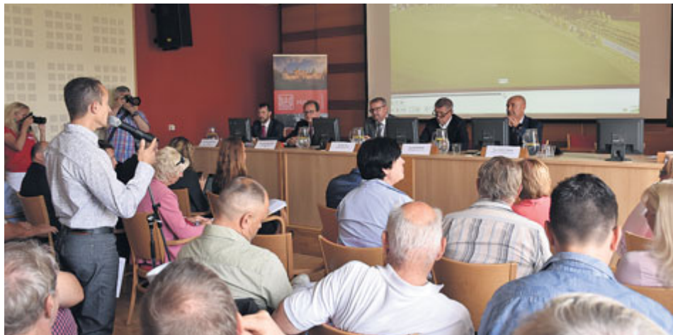
Součástí ministerské návštěvy byla i diskuse s občany a zástupci osadních výborů.

Ministr dopravy Dan Ťok a premiér Andrej Babiš jednali v pátek 31. srpna s vedením Příbrami. Hlavním tématem byl jihovýchodní obchvat města. Část programu byla určena i pro setkání s veřejností. Vystoupili například zástupci osadních výborů městských částí, kterých se výstavba obchvatu týká nejvíce.