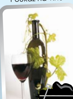
Poukaz na víno