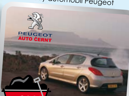
Nový automobil Peugeot