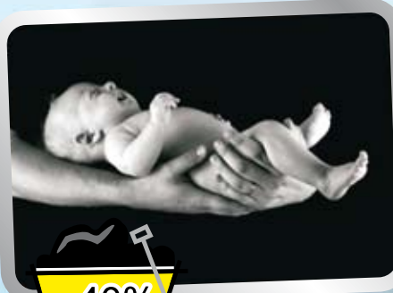
Sleva na focení v ateliéru

VELMI SNADNÉ OBJEDNÁNÍ, JEN PÁR KLIKŮ A UŽ MÁTE SLEVOU ČEKÁ VÁS JIŽ OD 3.10. 2011