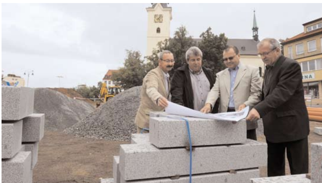
Poslanec Parlamentu ČR Jiří Papež (ODS) navštívil Příbram a prohlédl si staveniště rekonstruovaného náměstí TGM. Zajímal se o budoucí podobu centra staré části Příbrami. Ocenil úsilí vedení příbramské radnice, které se podařilo zkoordinovat postup výstavby i se Středočeským krajem a Ředitelstvím silnic a dálnic ČR. Na snímku si poslanec Papež na rozestavěném náměstí TGM spolu se starostou Příbrami MVDr. Josefem Řihákem a místostarosty MUDr. Ivanem Šedivým a Václavem Černým prohlíží plány rekonstrukce.