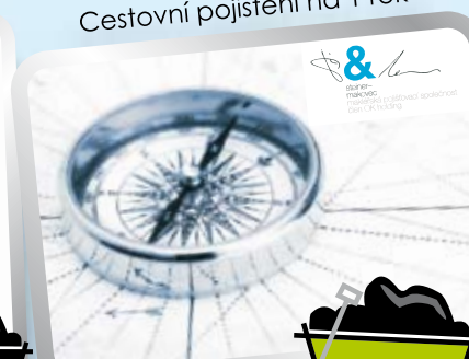
Cestovní pojištění na 1 rok