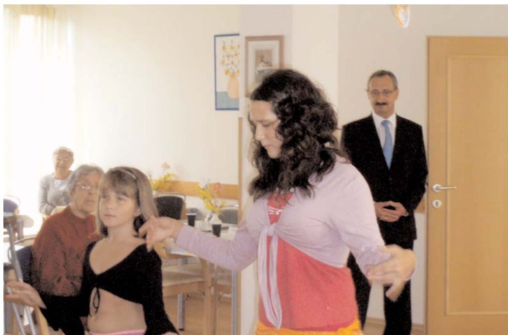
V Domově seniorů na Březových Horách pravidelně pořádají zajímavé akce pro místní obyvatele. Nedávno to bylo např. vystoupení bříšních tanečnic. Domov seniorů spravuje Pečovatelská služba města Příbram, v jejímž čele je MUDr. Ivan Šedivý.