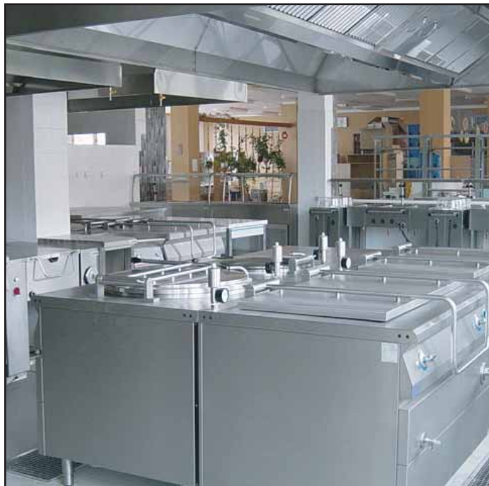
V těchto dnech byla předána do provozu zrekonstruovaná kuchyně v 1. základní škole. Náklady činily téměř 15 milionů Kč, byly hrazeny ze státního rozpočtu. Kuchyně odpovídá normám EU.