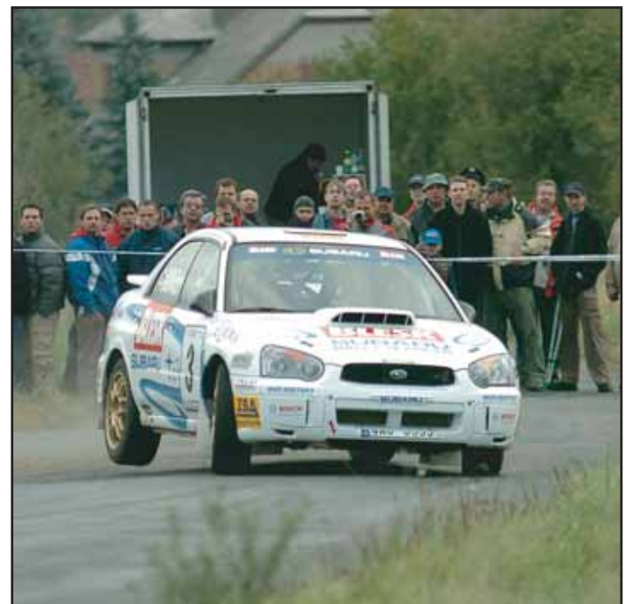
Minulý víkend se v našem regionu jel XXVIII. ročník Fuchs Oil Rally Příbram.