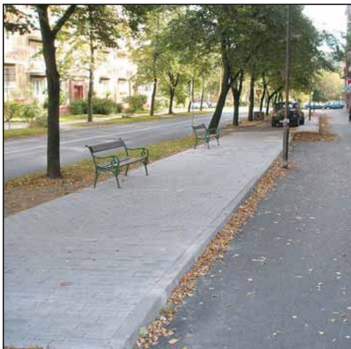
V uplynulých dnech byl vybudován v ul. E. Beneše nový chodník a na něm byly osazeny lavičky. Akci zajišťoval odbor správy silnic.