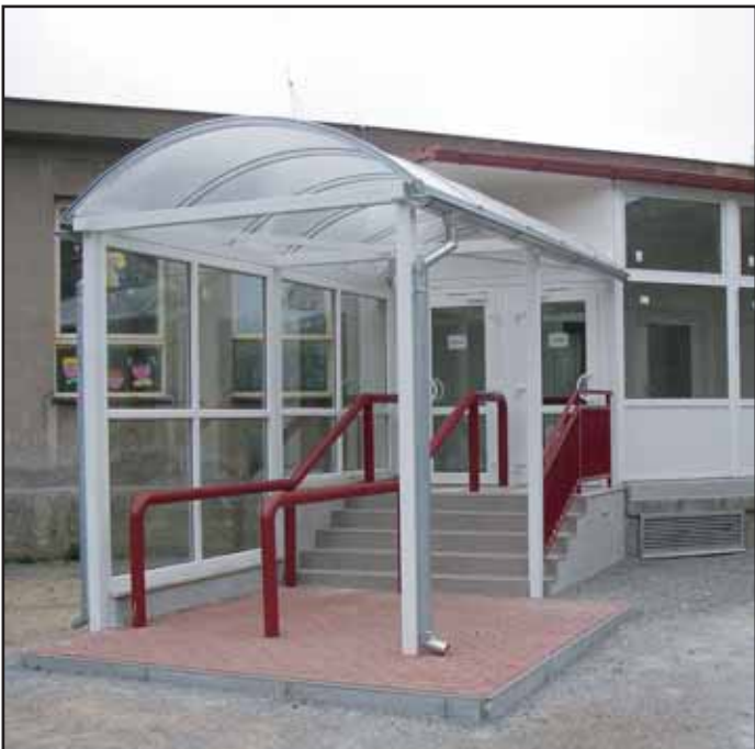
Odbor správy budov realizoval v letních měsících také tuto stavbu - přístavbu vchodu do školní jídelny v Základní škole Bratří Čapků.