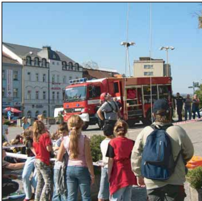
V rámci Evropského dne bez aut předvedli na náměstí T. G. Masaryka své umění příbramští hasiči.