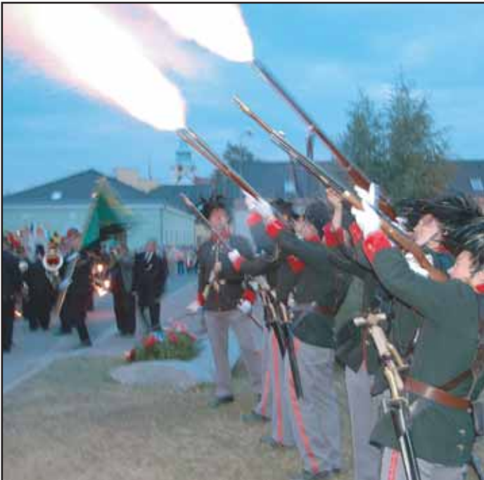
Na setkání hornických měst přijeli také ostrořtelci, kteří své umění předvedli jak na Březových Horách, tak na náměstí TGM.