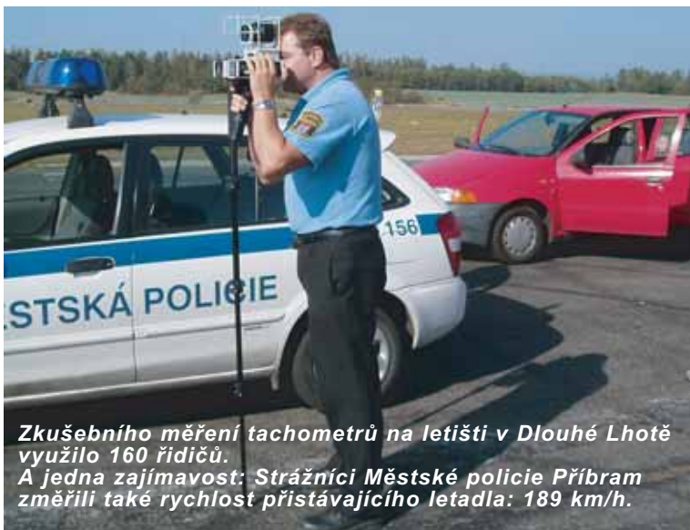
Zkušební měření tachometrů na letišti v Dlouhé Lhotě využílo 160 řidičů. A jedna zajímavost: Strážníci Městské policie Příbram změřili také rychlost přistávajícího letadla: 189 km/h.

Řešení neuhrazených nájmu ze strany firmy Ave Star a zároveň započítávání investic do majetku města za období od 1. 1. 1998 do 31. 12. 2002 je vyřešeno. Vše proběhlo na základě stanoviska soudního znalce, kterého určil okresní soud. Firmě Ave Star byla uznána a započítána částka 14 milionů korun. Za tuto uznanou investici vloženou do majetku města bylo firmě Ave Star smazáno dlužné nájemné k datu 31. 12. 2002. Od 1. 1. 2003, kdy pokračují další sporné zápočty, které jsou opět řešeny prostřednictvím soudního znalce, obdobně firma Ave Star neplatila některé nájemy a zdůvodňovala to tím, že vše uhradí opět v rámci zápočtu. Nicméně v této věci není ještě rozhodnuto a celková dlužná částka firmy Ave Star včetně penále je 8 milionů korun. Tento dluh je neuhrazen a všechny jednotlivé částky jsou upomínkovány a následně i zažalovány. Vyústěním těchto sporů bylo podání výpovědi. Rada města rozhodla o podání výpovědi k 31. 8. 2006. Ta byla odeslána doporučenou poštou firmě