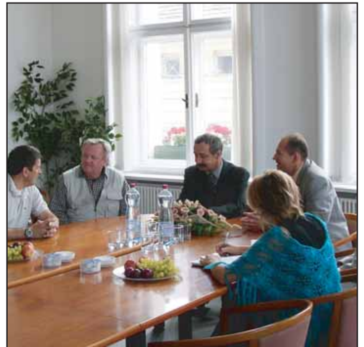
Naši radnici navštívila italská delegace. Jejimi členy byli Italové, kteří pátrají po stopách italských vysídlenců z doby I. světové války v Čechách, mj. i na Příbramsku.