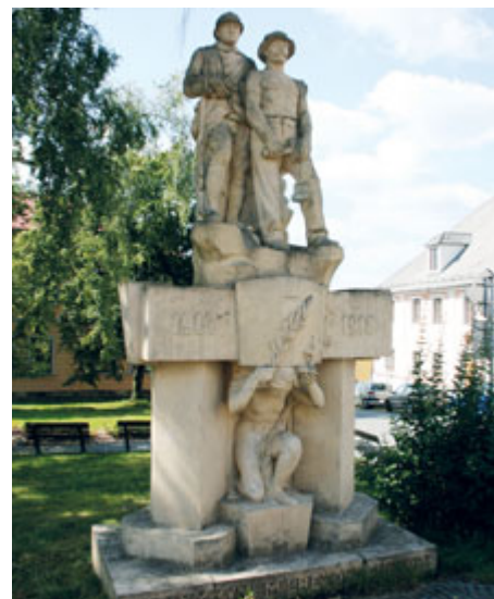
Pomník Padlým synům Březových Hor (1914-1918)