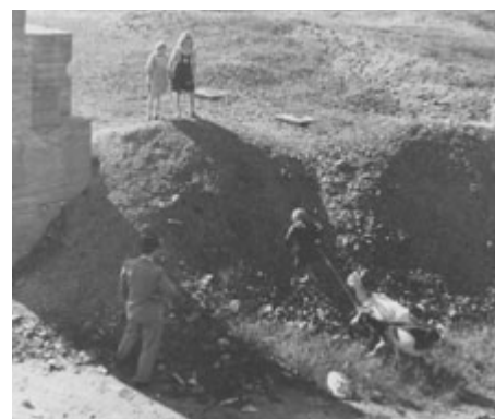
Březohorské děti pásly kozy ještě za první republiky.

Mnohé chudé březohorské rodiny se snažily chovat alespoň kozy. Nejvíce koz bylo na „dolejší“ Horách, kterým se proto říkalo posměšně Kozí Hory či Kozinec. Počet koz se březohorská samospráva snažila omezovat, protože jejich majitelé většinou neměli vlastní pastviny, takže kozy spásaly všechny obecní pozemky a působily značné škody. Snaha pře-