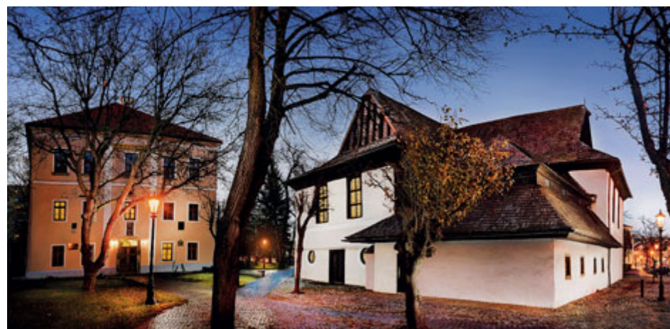
Dřevěný artikulární kostel je na seznamu UNESCO.