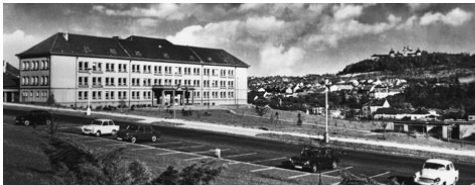
Škola a její okolí v 60. letech 20. století.

Školní rok 2021–2022 se ponese v duchu připomínání 150. výročí příbramského gymnázia. Začátek oslav připadá na víkend 2. a 3. října letošního roku, zvána je široká veřejnost.