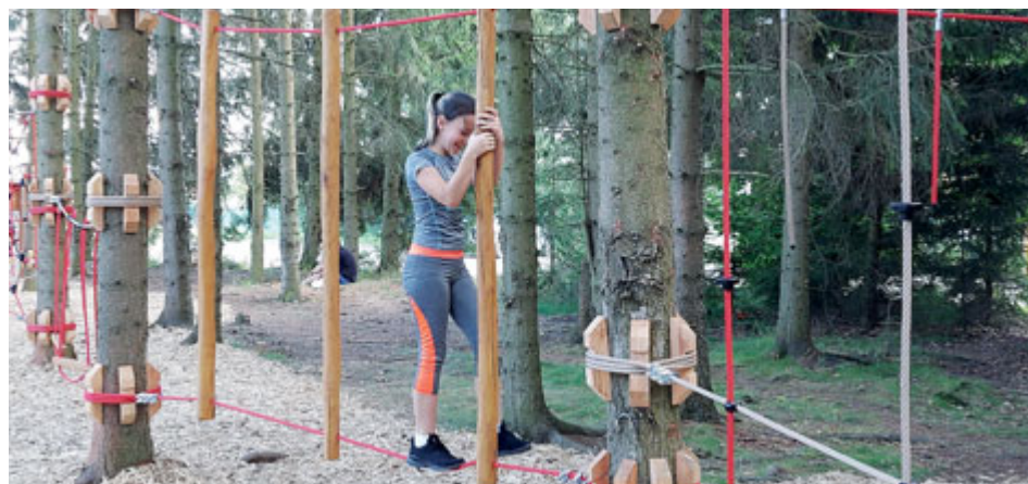
Oblíbené jsou lanové překážky.

Poblíž nového turistického odpočívadla v Kozičíně bylo mezi stromy vybudováno lesní hřiště s několika herními prvky, na kterých se mohou malí turisté protáhnout před výpravou do Brd. Jedná se o sestavu nízkých lanových balančních a lezeckých překážek.