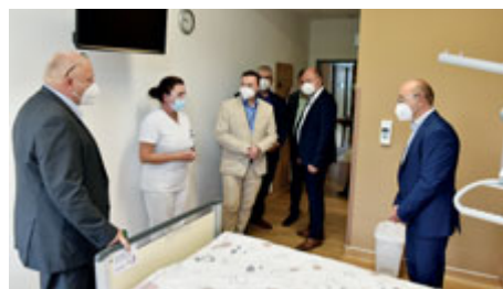
Z otevření oddělení neurologie.

Oblastní nemocnice Příbram otevřela zrekonstruované neurologické oddělení. Investici ve výši 10 milionů korun hradila instituce ze svého rozpočtu. Nemocnice také upozornila na přesun některých ordinací do areálu ve Zdaboři.