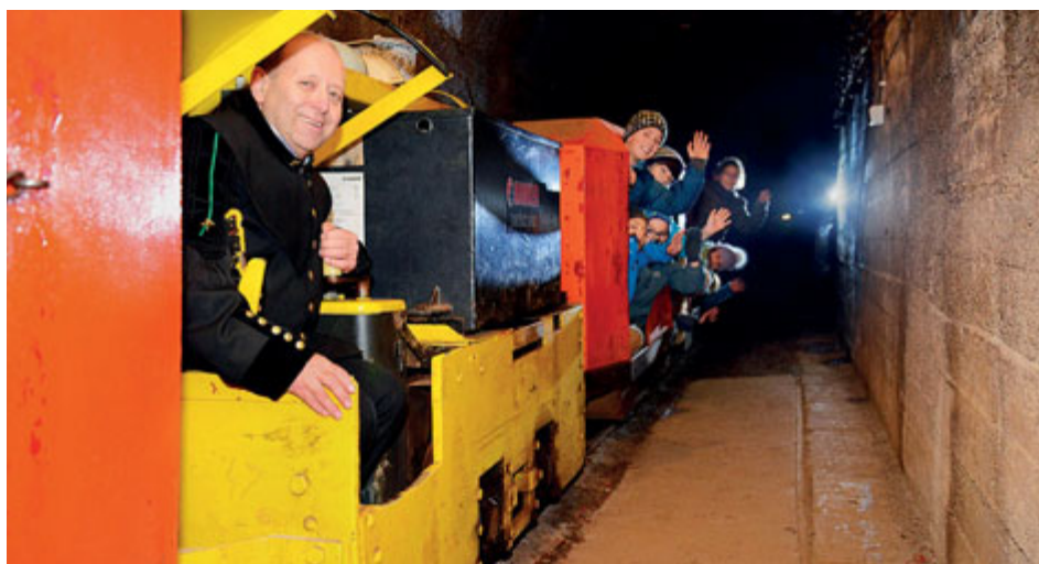
Vyhledávanou atrakcí jsou jízdy důlním vláčkem.

Z hlediska dějinného vývoje se Příbramsko může pyšnit tím, že hrálo v hornické činnosti