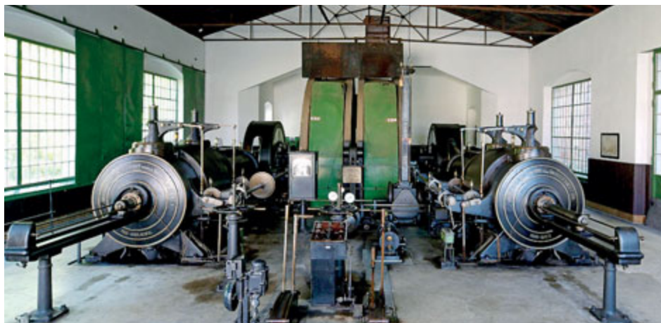
Dochovaná technická rarita - parní těžní stroj na Dole Anna.

V polovině 20. století zde bylo otevřeno uranové ložisko, které se záhy zařadilo k velkým a významným nalezištím Evropy i světa. V roce 1975 bylo dosaženo v šachtě č. 16 Uranových dolů Příbram největší hloubky ve střední Evropě - 1838,4 metru. Množství hornicky zpracovaného kovu bylo vyčísleno 48 432 tunami uranu a představuje okolo 36 procent podílu na celkové exploataci uranu z území našeho státu. Také díky této skutečnosti zaujímá i v současné době v produkci uranu Česká republika 12. příčku mezi největšími těžařskými zeměmi planety, byť se v naší republice uran již od roku 2016 nikde netěží. Pořadí je následující: Kanada, USA, Kazachstán, Německo, Austrálie,