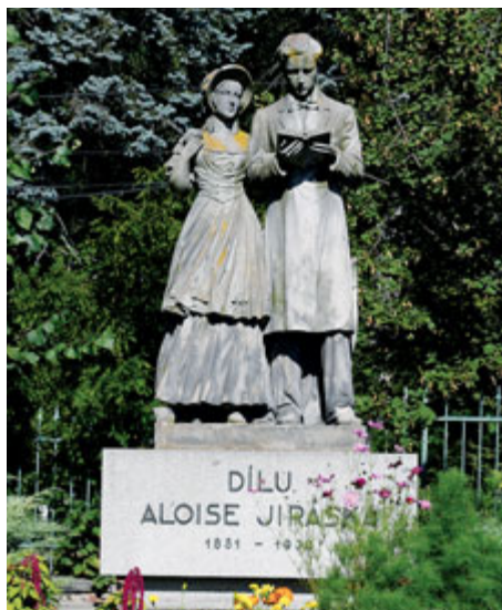
Sousoší Dílu Aloise Jiráska