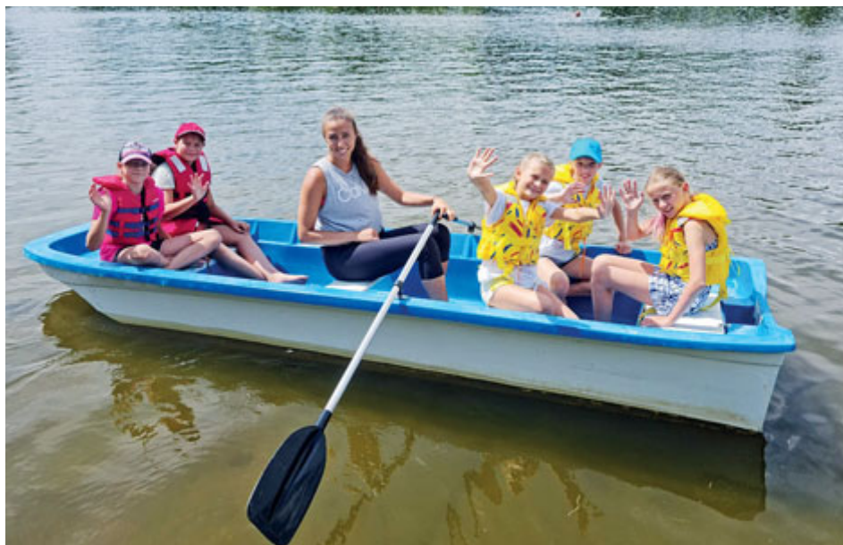
Nejvíce událostí včetně aktivit příměstského tábora se v létě konalo v areálu Nový rybník.