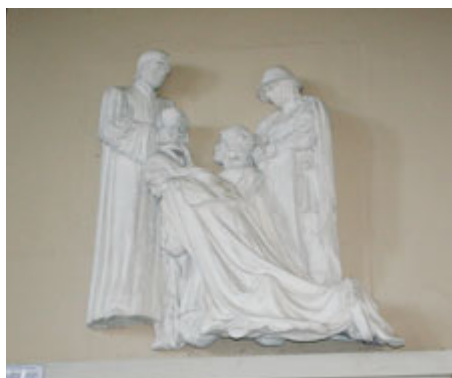
Jeden z reliéfů ve sboru Mistra Jakoubka ze Stříbra na Březových Horách