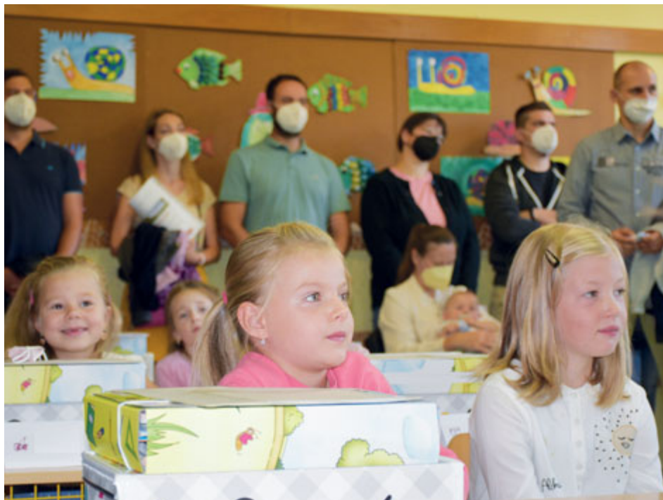
Do příbramských škol letos nastoupilo přes 400 prvňáčků.

Nový školní rok 2021/2022 byl ve všech příbramských základních školách zahájen ve středu 1. září tradičně i za přítomnosti zástupců města a pracovníků Odboru školství, kultury a sportu. Do lavic zasedlo téměř 4000 žáků, z toho více než 400 prvňáčků. Slavnostní zahájení i celý začátek nového školního roku proběhly v relativně normálním režimu. Jistě také proto bylo na všech, zejména ale na těch nejmenších, vidět, že se do školy těší.