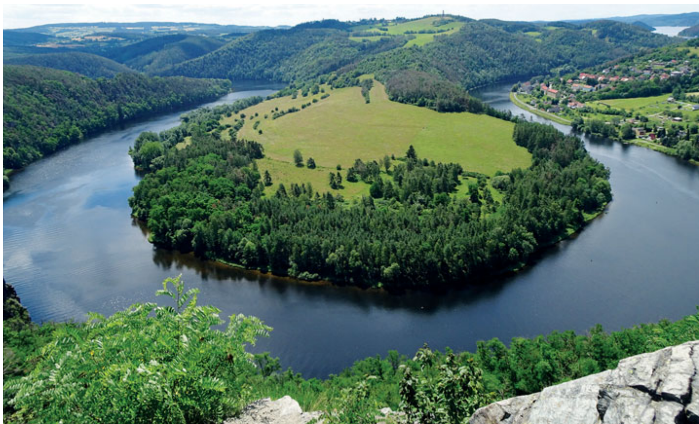
Solenická podkova z vyhlídky na levém břehu Vltavy.

Kamýcká vodní nádrž má na délku necelých 10 km a není tak hustě turisticky využívána jako sousední jezera. Avšak pravotočivý meandrovitý ohyb řeky, zvaný Solenická podkova, který můžeme nejlépe obdivovat z vysoko položené stejnojmenné vyhlídky na levém břehu, rozhodně patří k nejkrásnějším partiím na řece Vltavě.