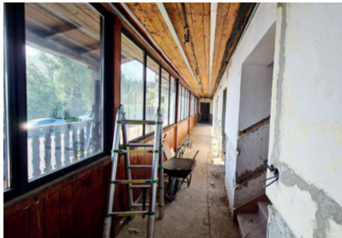
Rekonstrukce je v plném proudu, první hosté by mohli Granit navštívit na konci roku.