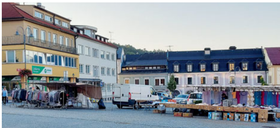
Trhy jsou nově také na náměstí T. G. Masaryka.

Město Příbram na svém území nabízí několik míst pro pořádání trhů. Po dlouhých letech se trhy vrátily na náměstí T. G. Masaryka, farmářské trhy pokračují i nadále na Dvořákově nábřeží.