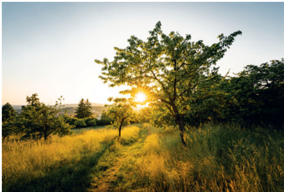
Svatohorský sad představuje jednu z nejrozsáhlejších ploch souvislé zeleně v Příbrami.

I když Příbram byla historicky velmi průmyslová, město charakterizuje výrazná „zelená pokrývka“. Zeleně je v mnoha vnitroblocích, na sídlišti i v historických částech města. Společně s takzvanou Zelenou páteří města jde o devizu, kterou mohou Příbrami mnohá i větší sídla závidět.