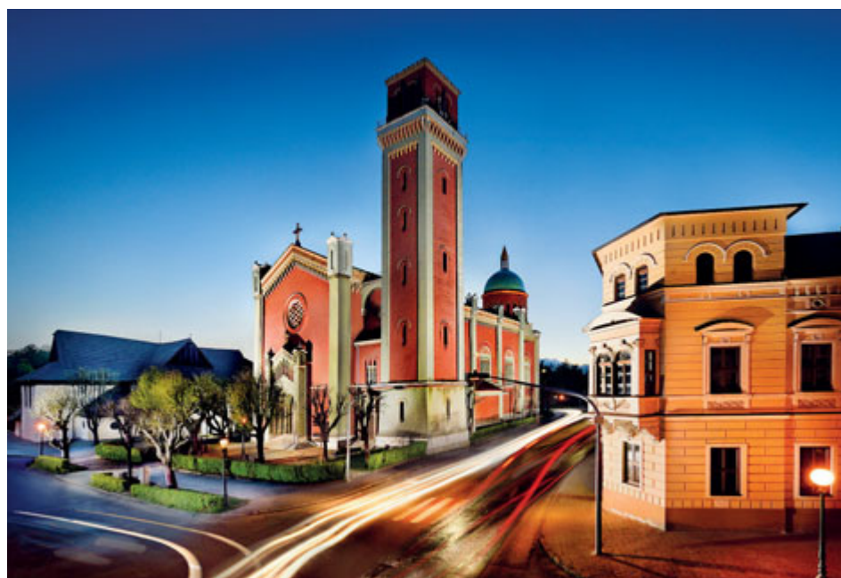
Nový evangelický kostel v Kežmaroku.

Spolupráce Kežmaroku a Příbrami byla zpečetěna smlouvou o partnerství z 15. listopadu 1997. Obě města spojuje skutečnost, že ve středověku byla královskými městy. Spolupráci rozvíjejí na úrovni oficiálních návštěv a společnými projekty institucí, především v oblasti školství.