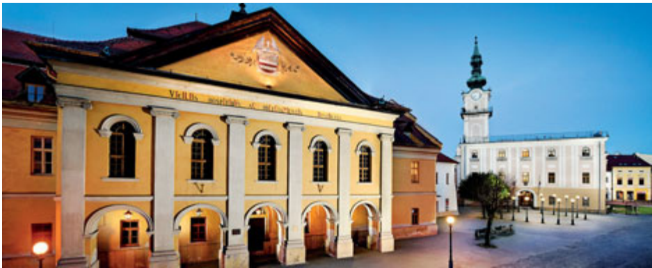
Reduta v popředí, v pozadí kežmarská radnice