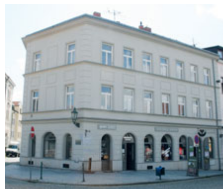
Rodný dům Václava Šáry v Dlouhé 142

V roce 1934 byla na balustrádu nově upraveného prostranství před Pražskou bránou na Svaté Hoře umístěna první ze zamýšleného souboru Šárových soch, alegorické ztvárnění Lásky . V roce 1935 realizoval autor Víru , o rok později Spravedlnost . Původně sedmidílný cyklus ctností zůstal nedokončen. Šárovy sochy byly později z balustrády přemístěny do prostoru ke svato-horským stánkům.