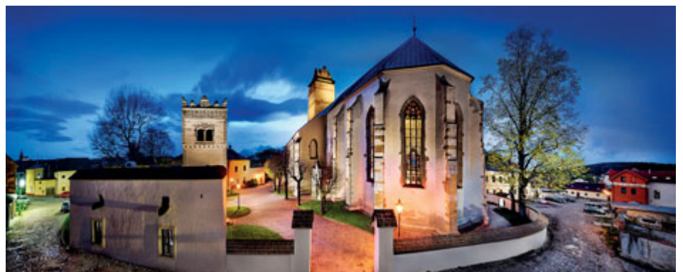
Bazilika sv. Kříže