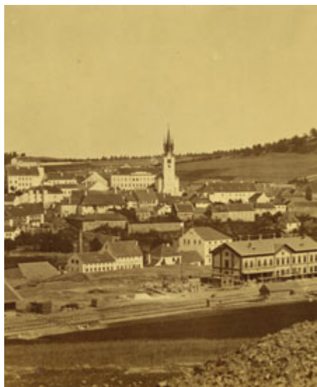
Příbram v roce 1875. Fotografie nejspíš z ateliéru Jana Mosa.

Pro chudé rodiny v Příbrami nebo na Březových Horách bylo vlastnictví kozy zárukou obživy a krávy luxusem. Zvířata však mohla způsobit i neštěstí, což dokumentuje následující příběh.