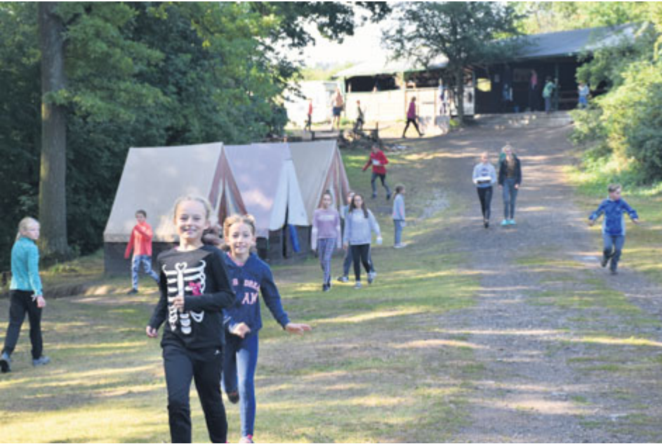
Tábor Sokola Příbram v Jablonné navštívila téměř stovka dětí.

V průběhu dvou dnů v polovině července vedení radnice navštívilo dva letní tábory pořádané v blízkosti našeho města. Táborníci si pobyt velmi užívali.