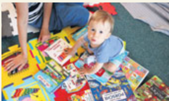
Nepochybně budoucí čtenář.