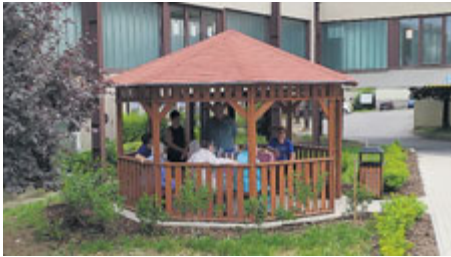
... ale také široké veřejnosti.

Relaxační a revitalizační bezbariérová zóna nemocnice nabízí více možností využití. Pacienti nemocnice v ní mohou sami nebo v doprovodu odborného personálu, dobrovolníků či blízkých posilovat kondici na jednoduchých venkovních trenežerech. Dále mohou posedět s členy rodiny nebo zúčastnit se dobrovolnických aktivit (hudební odpoledne, výtvarné dílny, společenské hry, tréninky paměti a další).