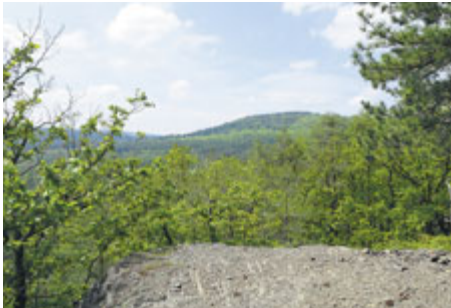
Z jednoho ze skalisek na jižním svahu Vystrkova je přes údolí dobře vidět protější Koníček (667 m), jeden z vrcholů Jineckých hřebenů.

Na Vystrkov, klasický jinecký vrchol, se můžeme zajít podívat například od Pstruhového potoka z ohrazenické lokality Na Luhu, z osady Velcí nebo také z jineckého vlakového nádraží. Můžeme prozkoumat jak převážně zalesněné západní svahy, tak i bezlesou část