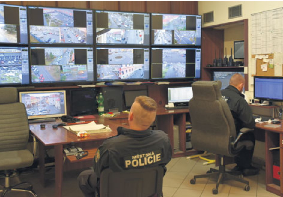
Zanedlouho bude mít příbramský dohledový systém více než 30 kamer.

Příbramská městská policie ve spolupráci se svými republikovými kolegy vytipovala sedm míst, která budou vhodná pro instalaci nových kamer v rámci městského kamerového systému.