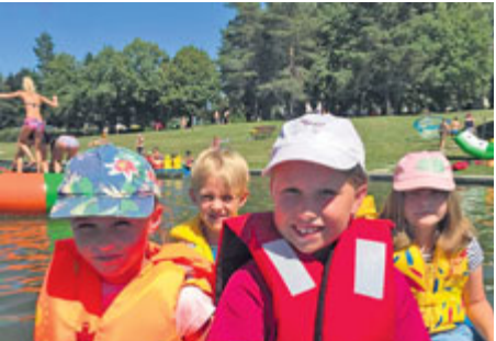
Děti se vyřádily na vodě...

V létě se opět konal sportovní příměstský tábor pod taktovkou Sportovních zařízení města Příbram (SZM). Ani letos se z kapacitních důvodů nepodařilo uspokojit všechny žadatele.