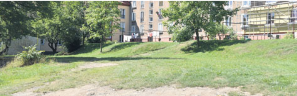
Pro každý z vnitrobloků bude připravena architektonická studie.

V rámci dotazníkového šetření se lidé žijící v takzvaných vnitroblocích vyjadřovali k tomu, jaké změny vyžadují ve své lokalitě. Častým přáním bylo zachování nebo zlepšení stavu veřejné zeleně.