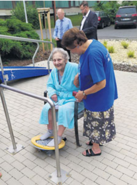
Nový odpočinkový areál...

Příbramská nemocnice ve svém areálu ve Zdaboři otevřela relaxační zónu. Nová instalace byla z větší části hrazena ze sponzorských příspěvků.