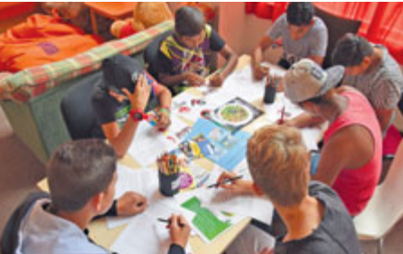
Bedna pomáhá mladým smysluplně trávit volný čas.

Na konci září se v příbramském Křížáku uskuteční v pořadí osmý ročník Bednění 2019. Kulturně zábavná akce, kterou pořádá Nízkoprahové zařízení pro děti a mládež Bedna neziskové organizace Ponton, je určena dětem, mladým lidem a komukoliv, kdo si chce užít zábavné odpoledne a dozvědět se informace o nízkoprahových službách pro děti a mládež.