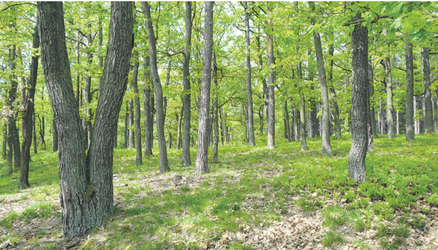
Vrcholovou partii Vystrkova pokrývá pěkný dubový les.

Vystrkov představuje klasický jinecký vrchol, který přitahuje nejen turisty, ale také hledače zkamenělých otisků trilobitů. Na výlet sem se můžete vydat například od Pstruhového potoka.