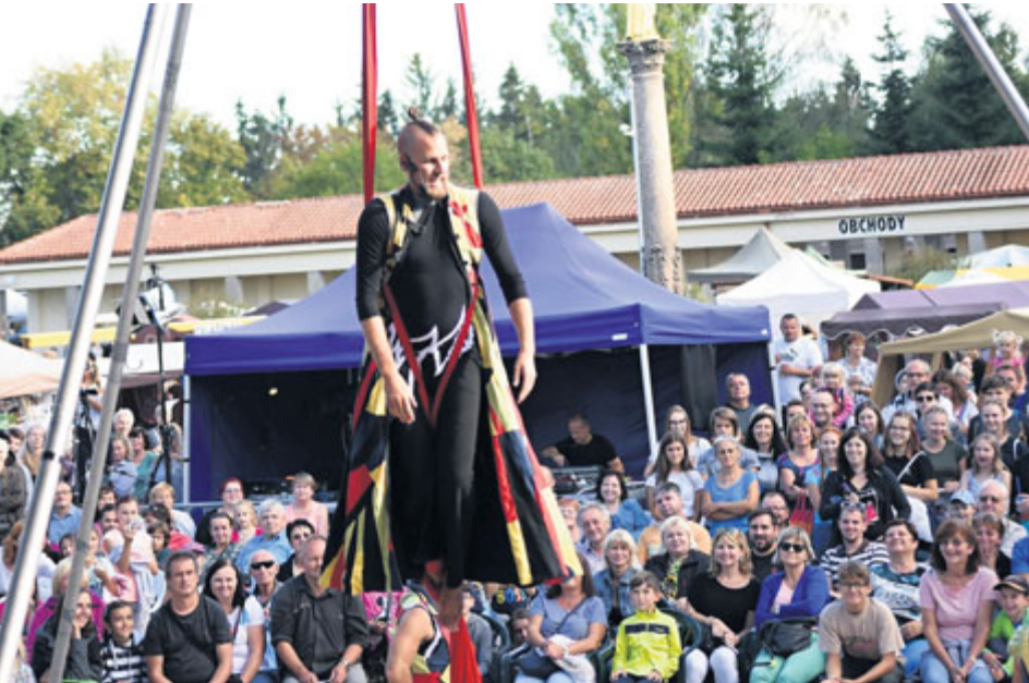
I letos se můžete těšit na vystoupení souboru Chůdadlo.

Příbramská svatohorská šalmaj je tradiční událost, kterou se město loučí s létem. Na jeden den se na Svaté Hoře setkají umělci, rytíři, kejklíři, muzikanti..., zkrátka lidé mnoha profesí a dovedností. Jejich cílem je aspoň na chvíli vrátit do Příbrami atmosféru středověké slavnosti a všeho, co k tomu patří.