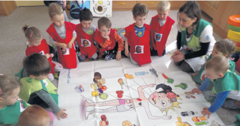
Děti jsou od mala vedeny k zásadám správné životosprávy.

V průběhu celého roku připravujeme pro naše nejmenší mnoho akcí a zábavných aktivit. Mimo jiné jsme pro děti z Dětských skupin a rehabilitačního stacionáře v Příbrami v nedávné době připravili několik akcí, které se týkaly zdraví.