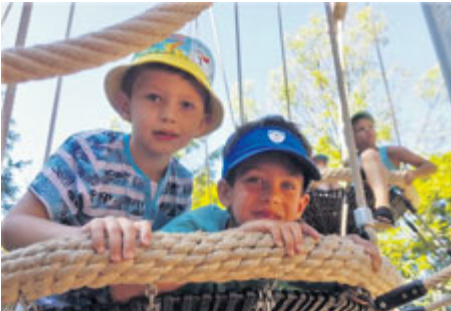
... i v lanovém centru.

Program táborů je nabitý a pestrý. Instruktoři s dětmi využívají prostory příbramského