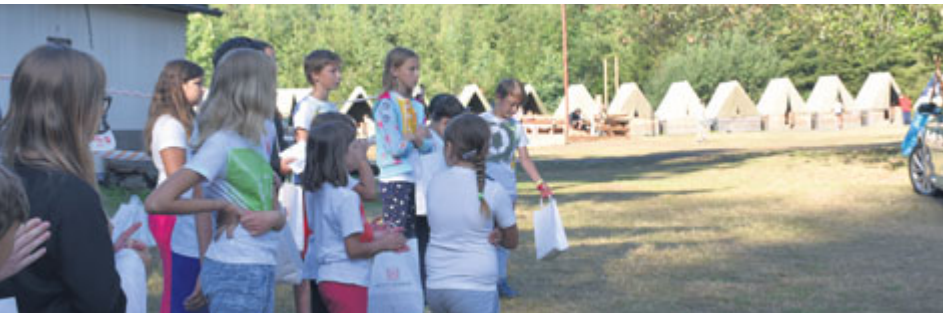
Terapeutický tábor je spojením zábavy a edukace.

Dvanáctým rokem město Příbram pořádá terapeutický pobyt pro děti s rizikovým chováním, jehož hlavním cílem je zejména v dlouhodobém horizontu předcházet patologickým jevům, které se u dětí zařazených do projektu projevují, a snižovat je.