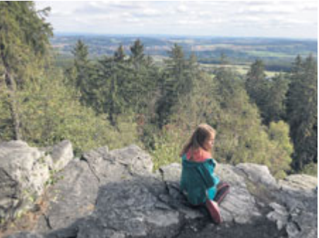
Pochod je příležitostí i pro rodinný výlet s dětmi...