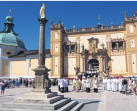
Bendlův portrét se nedochoval. V popředí snímku je jeho dílo – svatohorský sloup.

V našem seriálu navážeme na vylíčení životních osudů dalších umělců, kteří se podíleli na výzdobě Svaté Hory nad Příbramí. Po malířích se budeme věnovat autorům sochařské výzdoby. Slušelo by se začít Arnoštem z Pardubic, domnělým autorem sošky P. Marie Svatohorské, ale o něm již zde byla před lety řeč, a proto zahájíme postavou neméně významnou, a sice jedním z nejvýznamnějších českých barokních sochařů vůbec Janem Jiřím Bendlem.