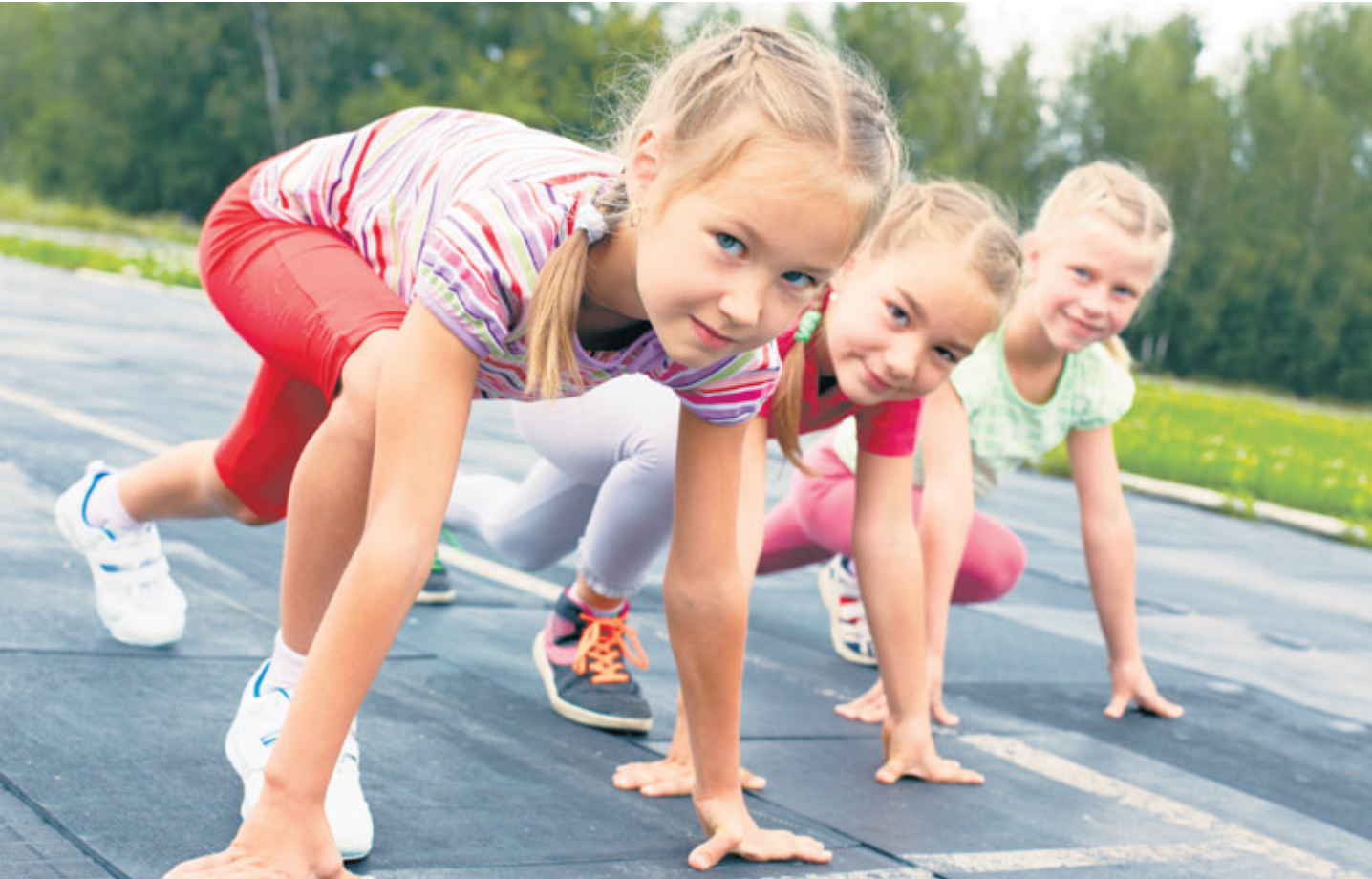
Příbramská Konference sportu poradí, jak nastartovat děti ke vhodnému typu pohybu.

Celorepublikovým problémem dnešní doby je obezita dětí a s tím spojené civilizační choroby. Řešením je úprava životosprávy, a především více pohybových aktivit. Právě sport je tématem, na které se chceme nyní ve městě zaměřit a jež se bude probírat na připravované Konferenci sportu.