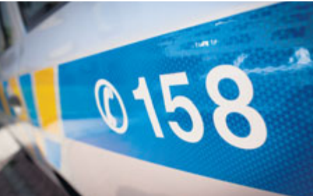
Podvodník se na policii ke svým činům nakonec doznal.

Začátkem července jsme varovali před podvodníkem, který obcházel obchody na Příbramsku se zajímavou fintou a snažil se z důvěřivých lidí vylákat peníze. Dobříšským policistům se ho podařilo dopadnout a sdělili mu podezření z přečinu podvodu.