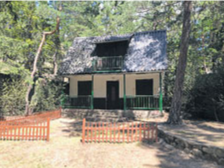
Přístup k přírodnímu divadlu byl opraven poté,...

Po přivalovém dešti byla nedávno odplavena část komunikace vedoucí k Lesnímu divadlu Skalka v Novém Podlesí. Město Příbram cestu opravilo a odvodnilo.