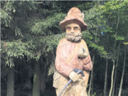
...nebo seznámení s brdským duchem Fabiánem.