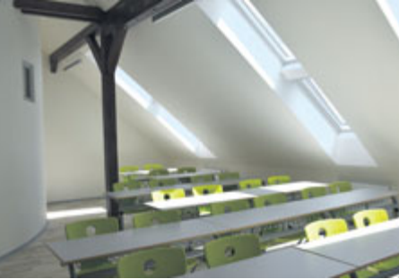
Za 32 milionů korun dostala základní škola...

Žáci a učitelé Základní školy v ulici 28. října budou mít od začátku nového školního roku k dispozici učebny, které vznikly v prostorách někdejší půdy.