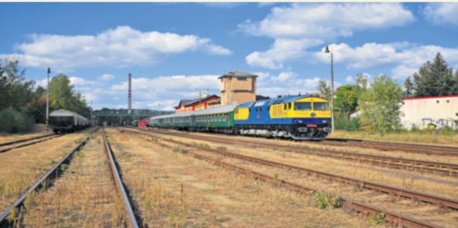
Den železnice připomíná vznik konvenční železnice.

Měsíc září bude z pohledu železničářů a příznivců železnice dobou různých tematických a vzpomínkových akcí určených široké veřejnosti. Mimo Národního dne železnice, který letos hostí v Lužné u Rakovníka, se koná i několik menších regionálních oslav vzniku konvenční železnice. Jedním z těchto míst bude v sobotu 14. září opět i příbramské vlakové nádraží.