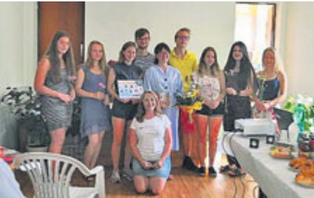
A dobrovolnická činnost bude pokračovat i po prázdninách.

Dobrovolnické centrum Adra v září zahajuje další ročník svého působení v Příbrami. Na třetí zářijový týden bude připravena tradiční burza oblečení, hraček a školních pomůcek. Rodiče si v tuto dobu mohou vybrat to, co by jejich děti potřebovaly do školy, ale v případě zájmu také přihlásit své dítě na doučování pro školní rok 2019/2020. Zkušenosti s doučováním z minulého školního roku popisuje jedna z dobrovolnic.