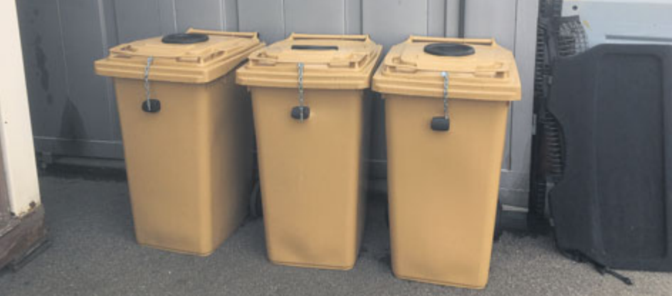
Nová legislativa zavádí povinnost třídit olej z domácností.

Povědomí o ochraně životního prostředí se stále zlepšuje. Třídění odpadu je pro nás již samozřejmostí. V souladu s novou legislativou přichází Technické služby Příbram s další možností recyklace. Tentokrát se jedná o sběr použitého oleje a tuků z domácností.