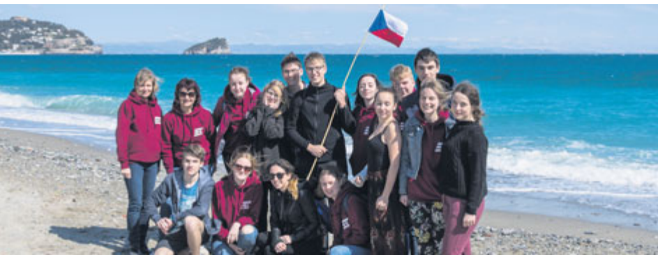
Týden v Itálii posílil znalosti angličtiny i vztahy se studenty z jiných zemích.

Sedmnáct let se studenti Gymnázia Příbram účastní mezinárodních projektů Evropské unie – nejdříve to byl projekt Comenius, v posledních letech se pak jedná o projekt s názvem Erasmus+. V uplynulých dvou ročnících se v jeho rámci věnovali dramatické tvorbě a kreativnímu psaní v anglickém jazyce, a to ve spolupráci se svými partnerskými školami ze čtyř dalších zemí – Itálie, Německa, Norska a Polska. Téměř stovka středoškoláků se pak každoročně setkává na studentské konferenci – tu letos hostila škola v severoitalském Carcare.