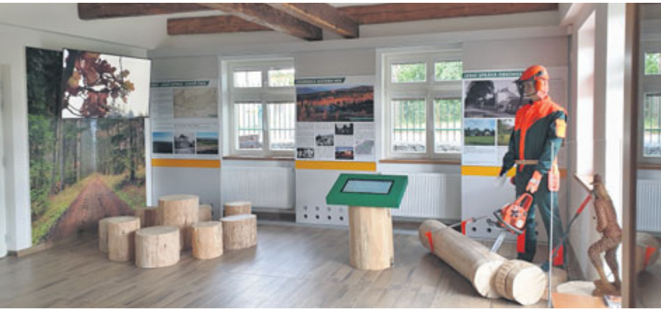
Infocentrum navazuje na naučnou stezku Klobouček, která začíná jen kousek odtud.

Vojenské lesy a statky ČR slavnostně otevřely nové informační centrum v Obecnici, které bude sloužit návštěvníkům Chráněné krajinné oblasti Brdy.