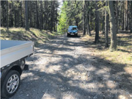
... co jej vzala velká voda.

Obyvatelé Příbrami mají štěstí, že v našem městě funguje již dlouhých šedesát let oblastní divadlo, které se poslední roky v žebříčcích