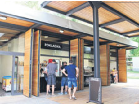
... se ihned stalo vyhledávaným místem.

Vzhledem k faktu, že SZM převzala stavbu pouhý den před otevřením a zároveň s první důležitou letní akcí, byla to velká výzva. K mé