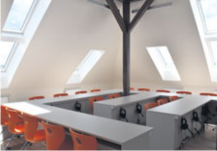
...zcela nové výukové prostory.

„Půdní vestavba velkým způsobem pomůže organizaci výuky ve škole. V minulosti bylo vede-