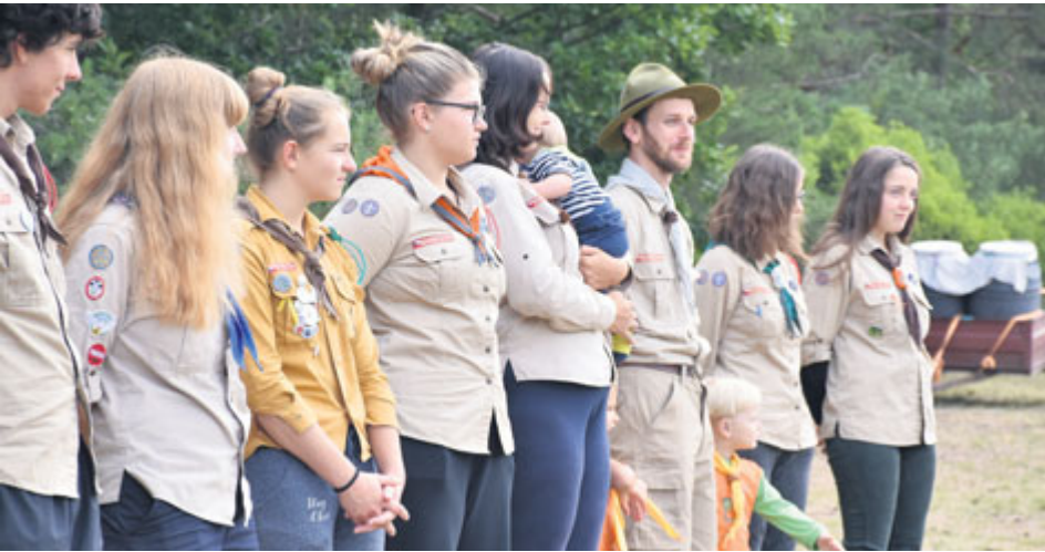
Skauti letos prožili letní tábor se svými nizozemskými kamarády.

V týdnu od 13. do 20. července se na tábořišti v Oborách u Příbrami uskutečnil mezinárodní tábor skautů. 2. skautské středisko Příbram zde hostilo oddíl starších dětí ze střediska Martina Luthera Kinga z partnerského města Hoorn (Nizozemí).