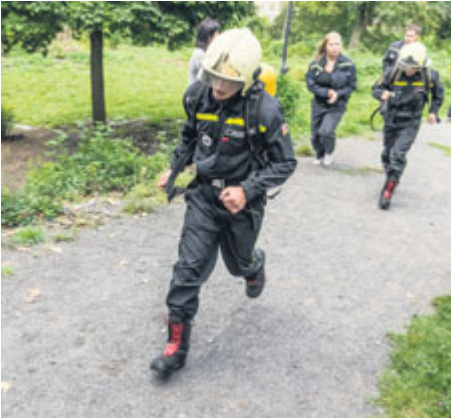
Při běhu do Svatohorských schodů zdolávají soutěžící 80 výškových metrů.

V loňském roce jsme si připomněli čtyřicáté nechvalně známé výročí obřího požáru Svaté Hory. Tuto skutečnost každoročně připomíná