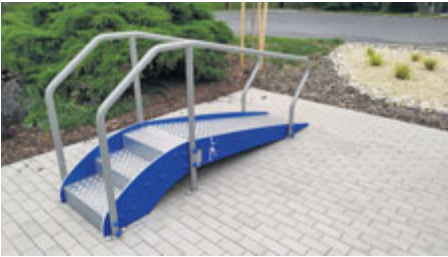
... slouží nejen pacientům nemocnice,...

K úpravám se nabízelo místo před pavilonem E, ve kterém se nacházejí obě lůžkové jednotky následné péče. Nejdříve vznikala