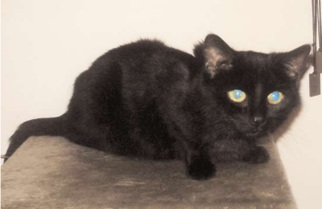
Bubáček je asi dvouletý černý kastrováný kocourek. Je velice mazlivý a přítulný, nemá rád však společnost jiných koček. Proto byl po čtyřech měsících vrácen zpět do Spolku pro kočku - nezvykl si na další zvířecí společnost. Tel. 737 170 116