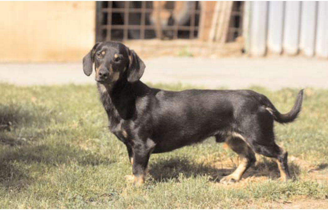
Pišta, ev. č. 172 Jezevčík černé barvy s pálením, stáří asi 4 roky. Je to dobrý hlídač, čistotný, vhodný do bytu. Zpočátku hodně nedůvěřivý, po čase mazlivý.