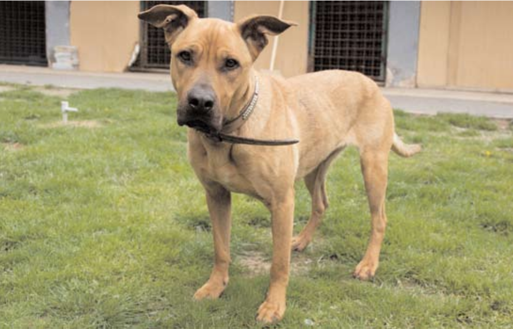
Alfí, ev. č. 52 Tato tříletá fenka křížence stafordšírského teriéra je v útulku půl roku. Je poslušná a za pamlskek se naučí a udělá jakýkoliv povel. Je výborná hlídačka a svoji rodinu opravdu ochrání. Alfí vyžaduje ale stálou společnost svých páníčků. Nemá ráda kočky.