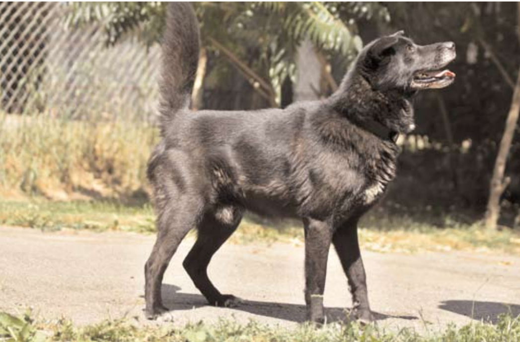
Endy, ev. č. 153 Kříženec velkého vzrůstu, černé barvy s bílou náprsenkou, stáří 5 let . Je to čistotný pes. Výborný hlídač vhodný pro strážní službu. Ve své blízkosti nemá rád dalšího psa.