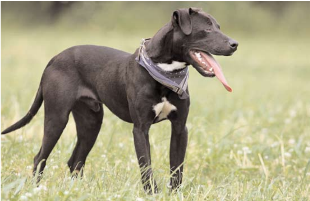
Cedr, ev. č. 58 Kříženec stafordšírského teriéra, asi roční pes, bohužel mu chybí jedno oko, ale nechybí mu veselý elán do života. Je hravý, vnitřní, vhodný i pro výcvik. Není vhodný k dalšímu psovi. Je hodně majetnický ke svému pánovi. Nedoporučujeme ho ani k dětem. Výborný hlídač. V útulku je již od 22.2.