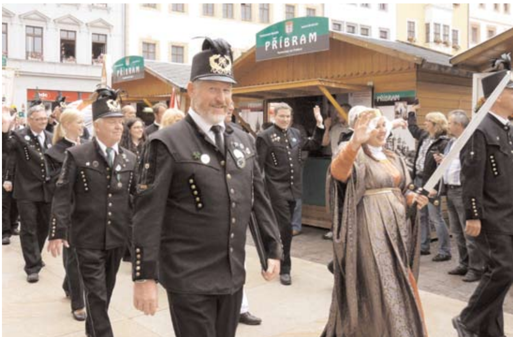
V červnu se horníci reprezentující Příbram zúčastnili průvodu v rámci Hornických slavností v partnerském městě Freiberg. Akce je spolufinancována EU v rámci ROP Střední Čechy.