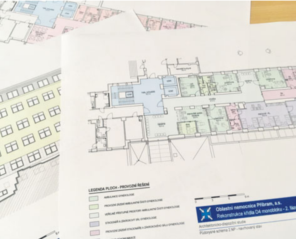
Rekonstrukce další části pavilonu D4 není jediné, co má nemocnice v plánu. Nové bude také lůžkové oddělení paliativní péče.

Příbramská nemocnice bude mít rekonstruovaná zbývající patra pavilonu D4. Stavební práce má na starosti firma Staveko, zřizovatel nemocnice investuje téměř 100 milionů korun.