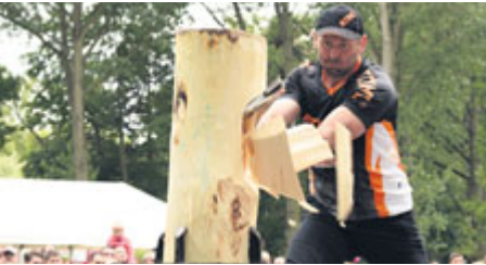
Ti, co netopí dřevem, si nedokážou představit, jak velkou zábavou může být jeho porcování.