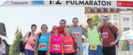
Zejména hojná účast štafet ukázala, že běh a týmová pospolitost příbramským běžcům jednoznačně sedí.