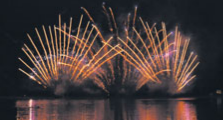
Ohňostroj na hrázi tvoří už neodmyslitelný závěr letní akce na Nováku.

■ Text: Stanislav D. Břeň