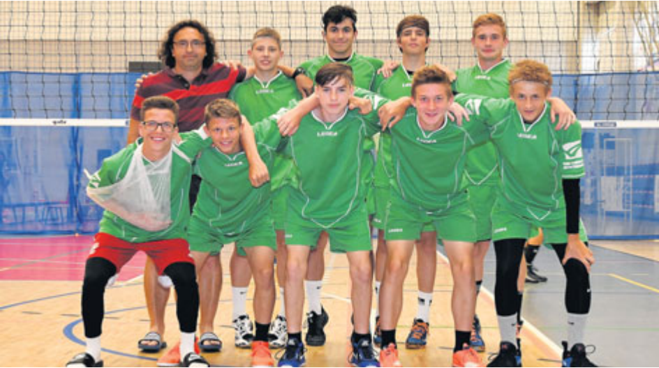
Hráči fotbalové školy se uplatní velmi dobře i jako volejbalisté.

Fotbalová škola z Březových Hor slavila nečekaný úspěch ve volejbale. Cestou do republikového finále musela přejít i přes několik škol z celé republiky, které se specializují na volejbal.