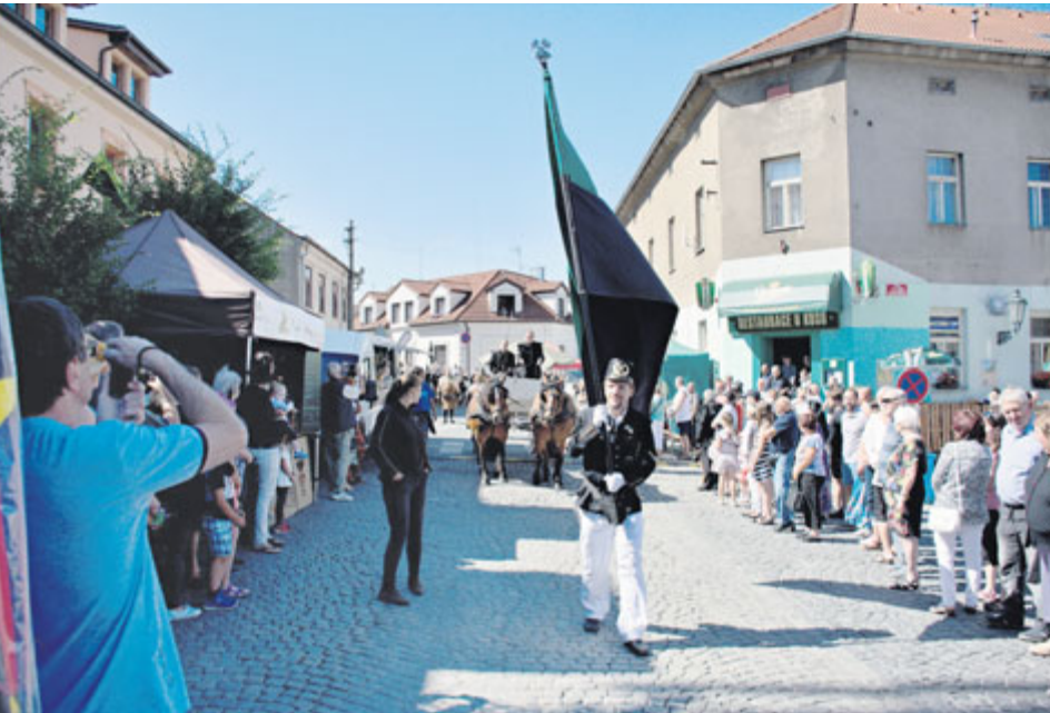
Průvod krojovaných horníků tradičně končí v „příbramské hornické Mekce“, tedy na Březových Horách.

Prokopská pouť patří k tradičním událostem začátku letních prázdnin v Příbrami. A letos tomu nebylo jinak. Po hornické parádě a průvodu městem následoval bohatý program na Březových Horách. Vstup do expozic Hornického muzea Příbram činil v neděli 8. července pouze symbolickou korunu.