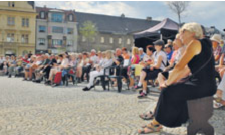
Náměstí T. G. Masaryka zaplnily stovky posluchačů.

Text: Stanislav D. Břeň