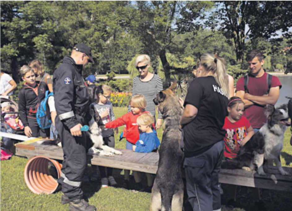
O poslušné a chytré psy měly zájem zejména děti.

■ Pavlína Svobodová Městský úřad Příbram