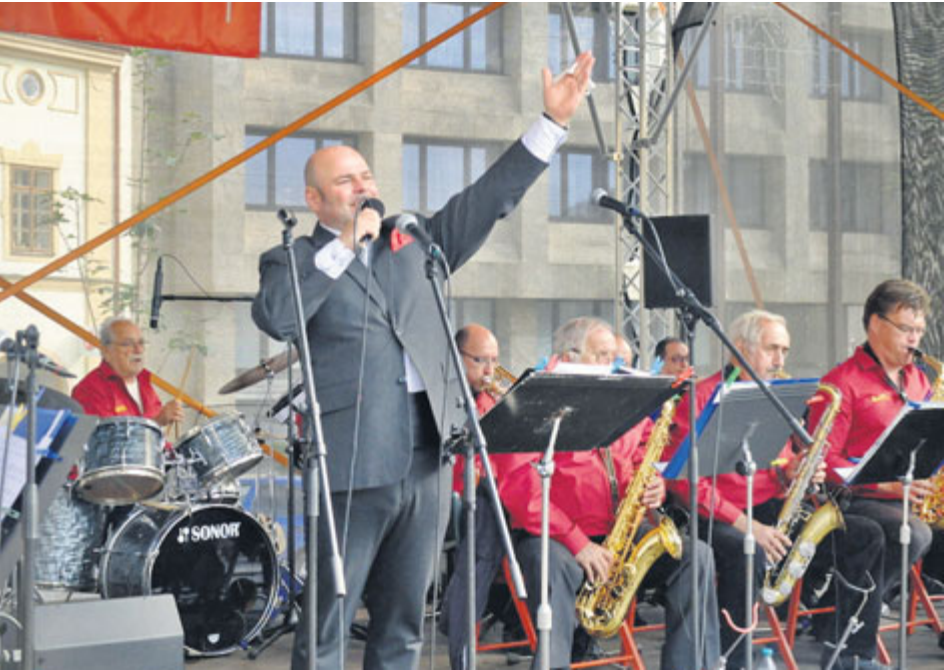
Příbramské kulturní léto zahájil Příbramský Big Band.

V tomto roce se Příbramské kulturní léto koná již počtvrté. Za tu dobu si získalo stovky fanoušků. Je vždy tematicky rozděleno tak, aby si na své přišli příznivci všech žánrů. Proto se i letos začínalo jazzem, pokračovalo folkem, následně přišla na řadu dechovka a v závěru prázdnin hudební seriál přitvrdí rocková hudba.