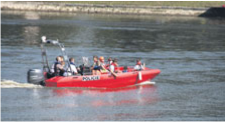
Nechyběly oblíbené projíždky na člunu.