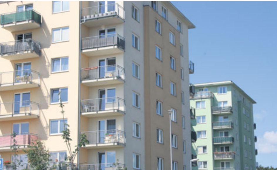
Bytů v Příbrami je relativně dost. Svůj bytový fond spravuje město a v posledních letech vzniklo i několik nových bytových projektů soukromých investorů.

Bydlení patří mezi základní potřeby drtivé většiny lidí. Občané měst a obcí, které vyprodaly většinu svého bytového fondu často za neadekvátně nízké ceny (mezi které Příbram patřila), se v poslední době opět více zajímají, jak o zbytek bytů pečovat a jak je přidělovat lidem, kteří je opravdu potřebují.