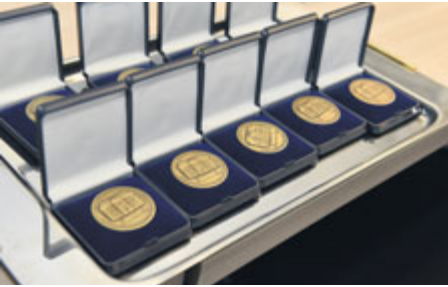
Medaile pro lékaře a sestry, kteří se zasloužili o rozvoj zdravotnictví na Příbramsku.

Otázky etiky, práva a ekonomiky v medicíně řešily přednášky v rámci devátého ročníku vzdělávací akce Kadeřábkův den. Ta se letos konala v Oblastní nemocnici v Příbrami na počest prvního primáře interního oddělení Františka Kadeřábka.