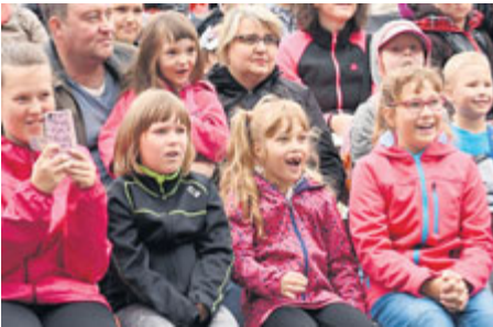
Program, který uchvátí...