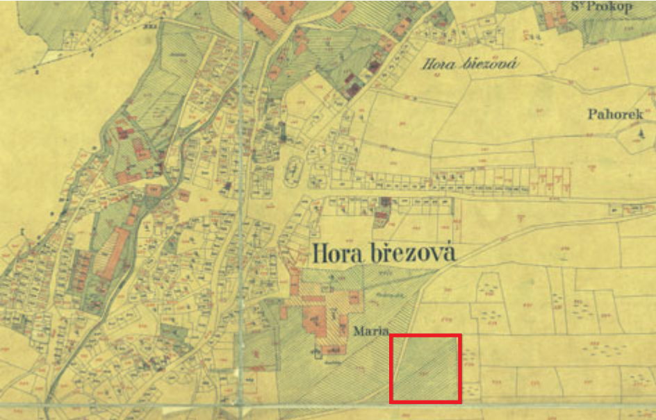
Mapa Březových Hor s vyznačením proutníku na pozemku horního závodu.

Muž, který si dlouhou řadou svých milostných dobrodružství vyslouží označení proutník, není zrovna životní výhrou. Tou ale nebyl pro Březové Hory ani ten jejich, i když se v tomto případě jednalo o skutečný proutník, nikoliv o proutníka.