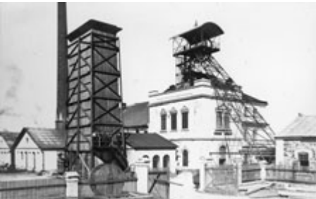
Důl Marie zrekonstruovaný po katastrofě.

Důl Marie byl hlouben od roku 1822, avšak důlní činnost v této lokalitě začala už o několik století dříve. Na dochovaných starých důlních mapách je vidět, že kolem šachty vedlo několik štol v různých hloubkách. Dlouholetý hlavní měřič někdejších Rudných dolů, jejichž těžební činnost skončila rokem 1978, v odpovědi na dotaz týkající se případného zavlažování zdejší vrbovny prohlásil, že tam z nějakého starého důlního díla skutečně voda mohla vyvěrat a že by odtud voda ze stařin nejpravděpodobněji odtékala dolů k Dědičné stole, ale že je to v současnosti prakticky neprokazatelné. Nicméně se podařilo zjistit, že v roce 1989 byl na sídlišti pod Březovými Horami budován kolektor CZT (centrálního zdroje tepla). Přestože hydrogeologický průzkum nepředpokládal výskyt podzemních vod, při razbě kolektoru se narazilo na přítoky vod 8 l za sekundu, t. j. 28 800 l za hodinu. K odvedení těchto vod směrem k šachtě Marii byla ražena chodba o profilu 6 m² s TH výztuží. Ve vzdálenosti 6 m od jámy