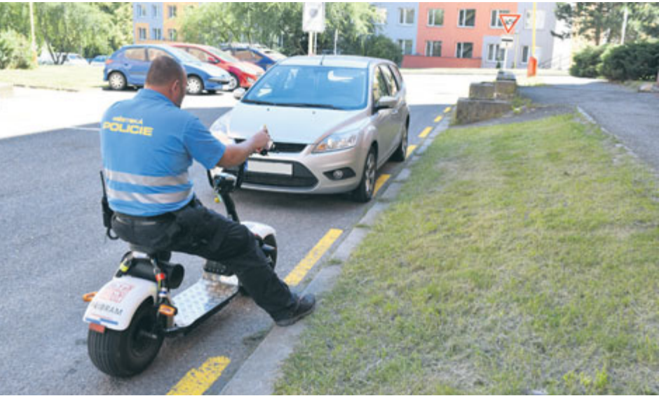
Ne vždy řidiči respektují dopravní značku Zóna - zákaz stání mimo vyznačená parkovací stání.

Hlavním důvodem změny režimu parkování na Drkolnově byla neukázněnost řidičů, kteří mnohdy parkovali na všech úzkých komunikacích vnitrobloku včetně křižovatek, čímž znemožňovali průjezd vozidel Hasičského záchranného sboru. Hasiči pak nemohli projet s výškovou technikou, jež je důležitá pro případnou záchranu lidí z vyšších pater budov, pokud by došlo k požáru. Případný zásah v takových případech trvá déle a je mnohem komplikovanější. Dalším důvodem změn je zvyšující se počet automobilů. „S tím, jak přibývá aut, se zároveň zhoršují i životní podmínky těch, kteří jsou zvyšující se dopravou a četností automobilů nejvíce postiženi. Především ve večerních a nočních hodinách se popojíždění automobilů, svícení do oken, hluk