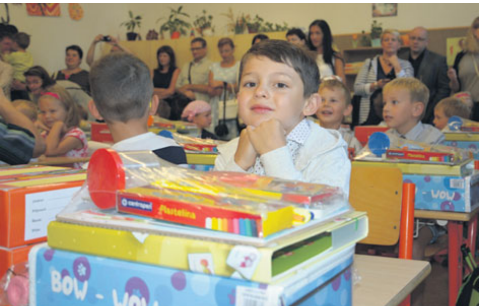
Mnoho školáků přijde po prázdninách do školy, kterou povede nový ředitel.

Příbramští radní jmenovali dva nové ředitele základních škol. Na jménech se rada města shodla jednomyslně – všech šest přítomných radních respektovalo doporučení odborné výběrové komise.