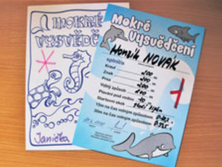
Honzík Novák není zdaleka jediným úspěšným držitelem „Mokrého vysvědčení“.

Plaveckou výuku navštívilo za školní rok 2017/2018 bezmála 6000 dětí z mateřských, základních a středních škol z širokého okolí. Na konci turnusu dostává každý malý plavec „Mokré vysvědčení“ s hodnocením plaveckých dovedností a něco dobrého na zub.