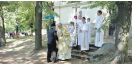
Část programu Prokopské pouti se odehrává také u kostela sv. Prokopa, který je patronem horníků.