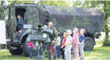
Vojenská technika nechá chladným málokteré dítě.

Vojáci, záchranáři, policisté, kynologové, celníci, hasiči... Ti všichni, a nejen oni, na jednom místě. S technikou, zajímavými ukázkami své práce a bohatým doprovodným programem. To je Den bezpečné Příbrami, který se letos na Novém rybníku konal už potřetí. Rok od roku přitahuje větší pozornost dětských i dospělých návštěvníků.