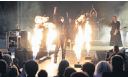
...bez hodně ohně.

Text: Stanislav D. Břeň