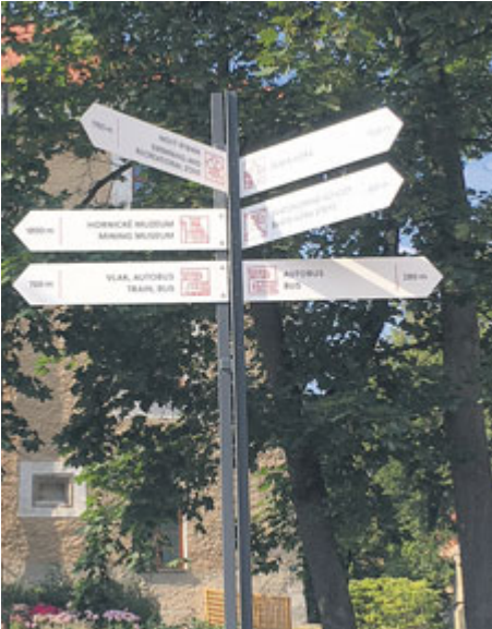
OKM se podílel na přípravě turistických rozcestníků, účastní se veletrhů cestovního ruchu nebo měl na starosti změnu vizuální identity města.

v reklamě stejný význam jako Český lev pro film. Dalším krokem byl již Kahan. Ten získal nejen novou grafiku v souladu s novým vizuálním stylem města, formát, ale především obsah, do kterého jsme přidali například oblíbené články o historii města a křížovku. Kvalita zpracování byla oceněna v celostátní soutěži o nejlepší obecní a městský zpravodaj, kterou Kahan v roce 2016 a 2017 vyhrál. Dále jsme v rámci otevřenosti radnice zavedli nový informační servis města. Informace jsou poskytovány sms zprávami v případě mimořádných krizových událostí a týdnenními e-maily s informacemi o dění ve městě. V systému máme aktuálně zaregistrováno přes 2100 e-mailů a téměř 3000 telefonních čísel.