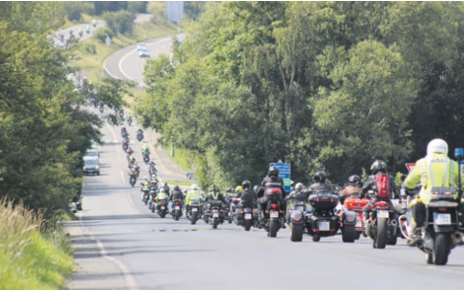
Motorkáře čekala přibližně osmdesátikilometrová vyjížďka za doprovodu policie. Cílem byla Dlouhá Lhota.

Ve snaze zlepšit vztahy mezi motorkáři, policisty i širokou motoristickou veřejností se letos uskutečnila kampaň vrcholící v Dlouhé Lhotě. Součástí byla také společná spanilá jízda motocyklistů a policistů.