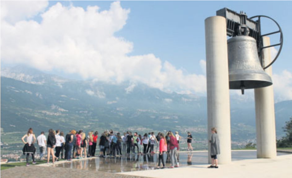
Návštěvníci si prohlédli také Zvon míru v Roveretu, který byl po konci 1. světové války ulitý z nalezených zbraní.

upolíny a liliemi. Poslední den pobytu navštívili moderní muzeum vědy MUSE v nedalekém Trentu.