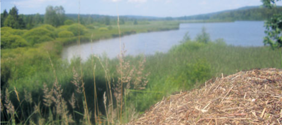
Mraveniště s výhledem na Dolejší padrťský rybník.

Východiska: Z Rožmitálu (vlak, bus, parkoviště, stravování, občerstvení, ubytování, tři muzea, nepřístupný zámek, koupaliště) po červené značce (z náměstí) 8,8 km. Pohodlná cesta; Z Hutí pod Třemš. (parkoviště, občerstvení) po