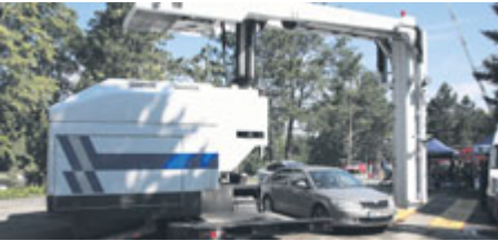
K vidění byl unikátní rentgen celníků.