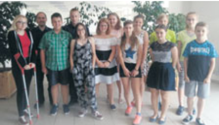
Pilná příprava se zúročila.

V sobotu 2. června 2018 se na ZŠ Školní 75 konaly druhým rokem Cambridge dětské jazykové zkoušky z angličtiny / Young Learners. Letošní školní rok proběhl pod záštitou Akcent International House Prague.