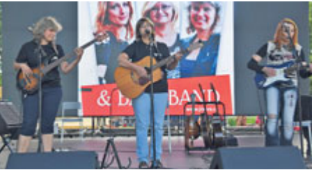
Druhý koncert Příbramského kulturního léta se uskutečnil premiérově na Nováku. Na programu byl folk.