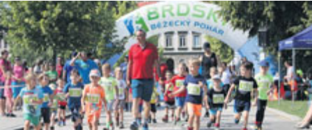
Příbramský půlmaraton má ambici přivést k běhu i děti.

Text: Stanislav D. Břeň