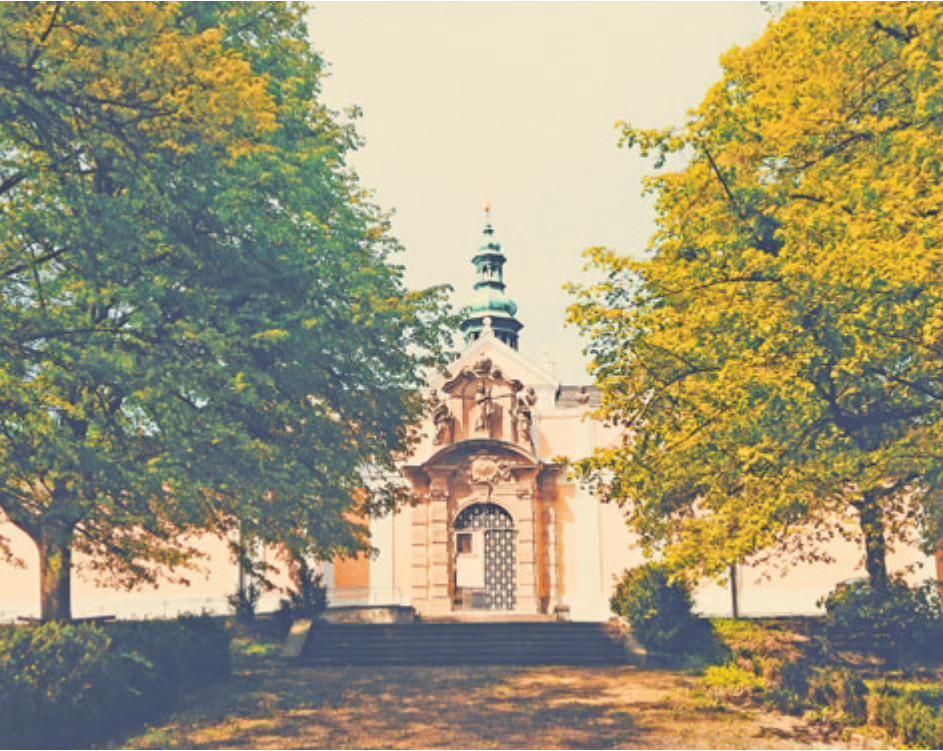
Tvůrci Poznej Příbram chystají každý měsíc originální sérii fotografií, které zachycují místa spjatá s významnými osobnostmi.

Projekt Poznej Příbram získal pozornost Asociace public relations agentur, která jej ocenila v kategorii Státní správa, veřejný a neziskový sektor. Zařadil se do společnosti dalších zajímavých PR aktivit jako například Emběčko paní velvyslankyně.