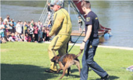
Zakousnout se a nepustit. Demonstrace kynologů.