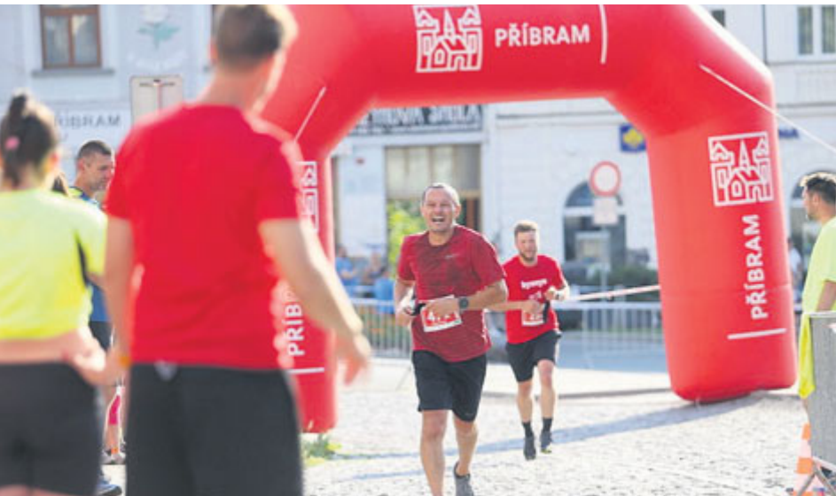
Na trať se letos vydalo 200 individuálních běžců a 80 štafet.

Běh je skvělou příležitostí zapojit všechny svaly těla, pročistit mysl a „našlápnout“ se dávkou endorfinů. Pokud zároveň vyběhnete ulicemi svého města s dalšími stovkami sousedů, kamarádů a spoluobčanů, pak je zážitek dokonalý.