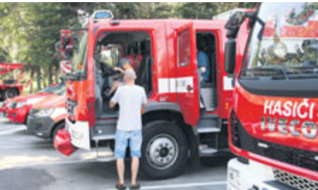
Návštěvníci si mohli „prošmejdit“ i veškerou techniku.