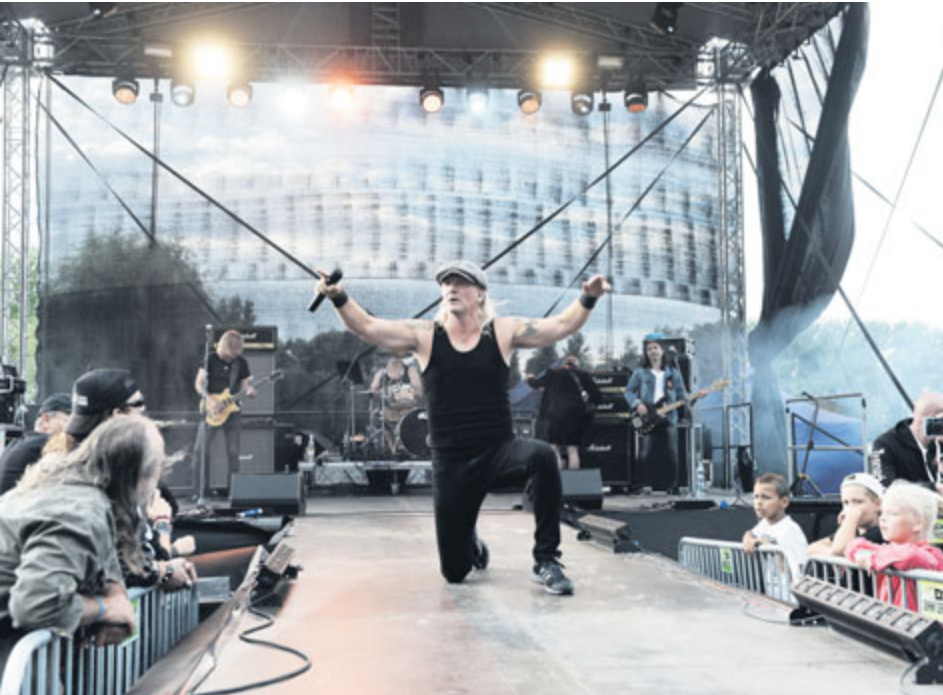
Fanoušci tentokrát obléhali nejen samotné pódium, ale také speciální molo.

Vítání slunovratu v podání našich předků bývalo poněkud divočejší záležitostí. Při tomto vědomí se pořadatelé letošního prvního ročníku Vítání slunovratu na Nováku uchýlili k tvrdšímu programu. Novák nejdříve rozehl revival AC/DC, skupina Špejbl's Helprs, a potom řádně přitopila kapela RCZ, která čerpá z repertoáru skupiny Rammstein.