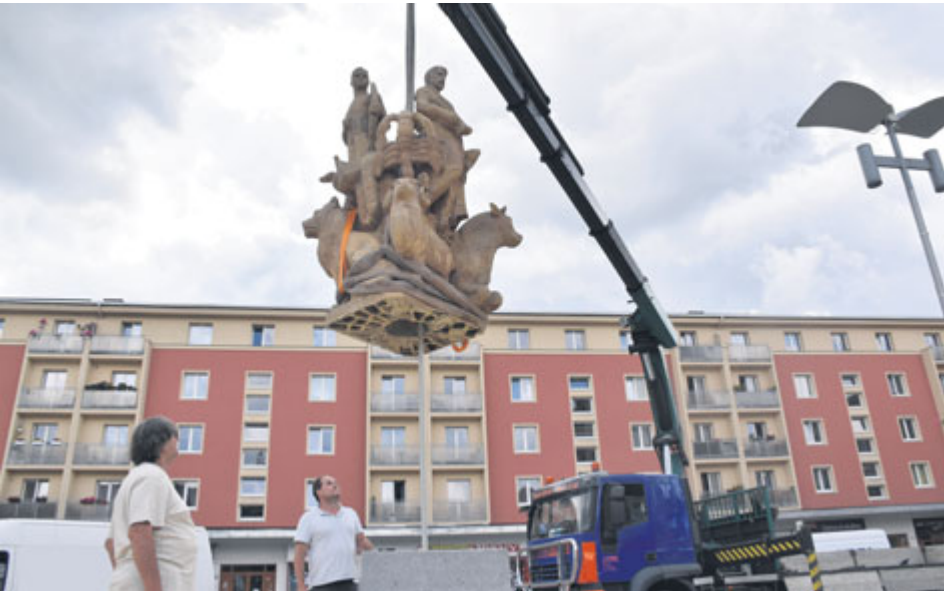
Po několika měsících práce byl restaurátorský proces zakončen usazením sousoší na jeho původní místo.