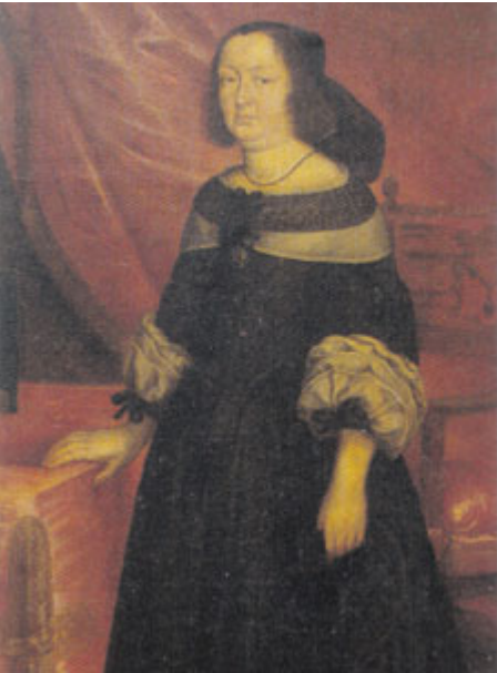
Ludmila Kateřina Benigna ze Šternberka.

I v tomto díle budeme pokračovat ve vyprávění příběhů o životech mecenášů nejvýznamnější příbramské stavby svatohorského areálu. Tentokrát se zaměříme na ženu, a to na hraběnkou Ludmilu Kateřinu Benignu ze Šternberka, rozenou Kavkovou z Říčan (* ?? – + 1672). Je zajímavé, že o mnoha významných osobnostech toho stále víme velmi málo, a Ludmila Benigna je právě takovým případem. Z informací, které o ní víme, je patrné, že se jednalo o energickou ženu, která byla schopná řídit svůj osud a v případě potřeby i osud jiných, zejména svých příbuzných.