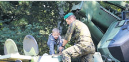
Kolem houfnice byl vždy velký houf malých i velkých.

■ Foto: Roman Prokůpek Text: Stanislav D. Břeň