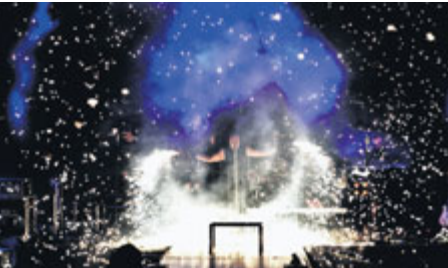
Kapela RCZ se svou Rammstein Tribute Show se neobejde bez ohně...