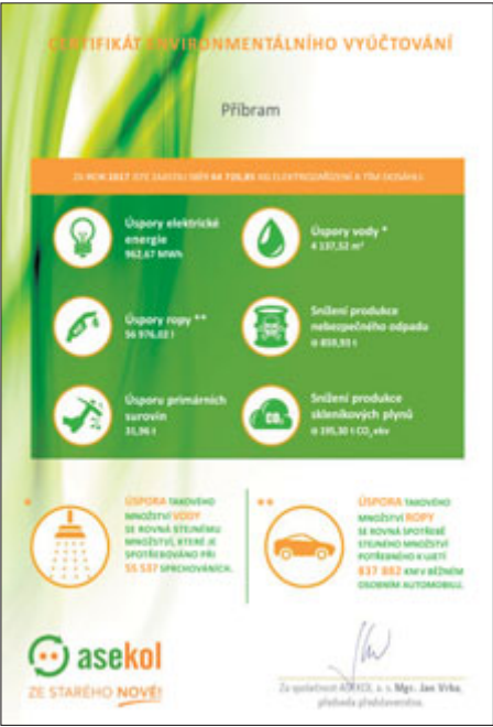
Certifikát environmentálního vyúčtování pro Příbram.