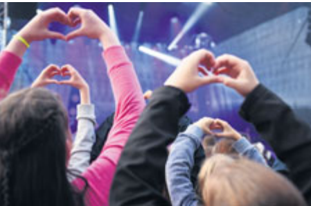
Slza a srdce. Kapela a její fanoušci.