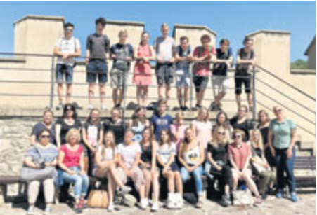
Nizozemské studenty okouzila Praha i Karlštejn.

Na příbramské gymnázium zavítala návštěva z partnerského města Hoorn v rámci projektu Copernicus. Přijelo 14 studentů za doprovodu tří pedagogů a v Příbrami i okolí si užili příjemný šestidenní pobyt.