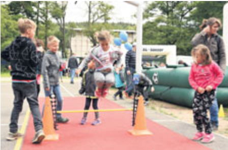
Nechyběly atrakce, které přivedly návštěvníky k pohybu do všech světových stran.