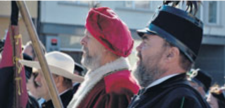
Prokopská pouť začala tradičně hornickou parádou na náměstí T. G. Masaryka, odkud se vydal průvod celým městem.

■ Foto: Karel Plaček Text: Stanislav D. Břeň