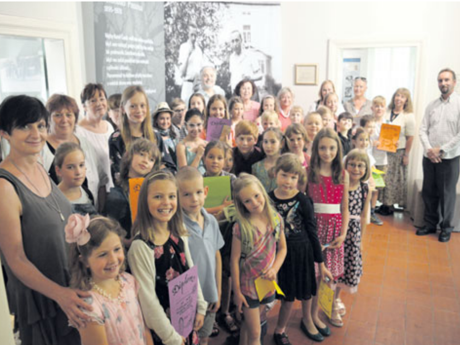
Recitační soutěže se účastnilo 27 dětí z deseti škol z Příbrami a okolí.

V Památníku Karla Čapka se každoročně scházejí děti z Příbramska, aby změřily své síly v recitaci básní a získaly titul nejlepšího recitátora okresu. Ani letošní rok nebyl výjimkou.