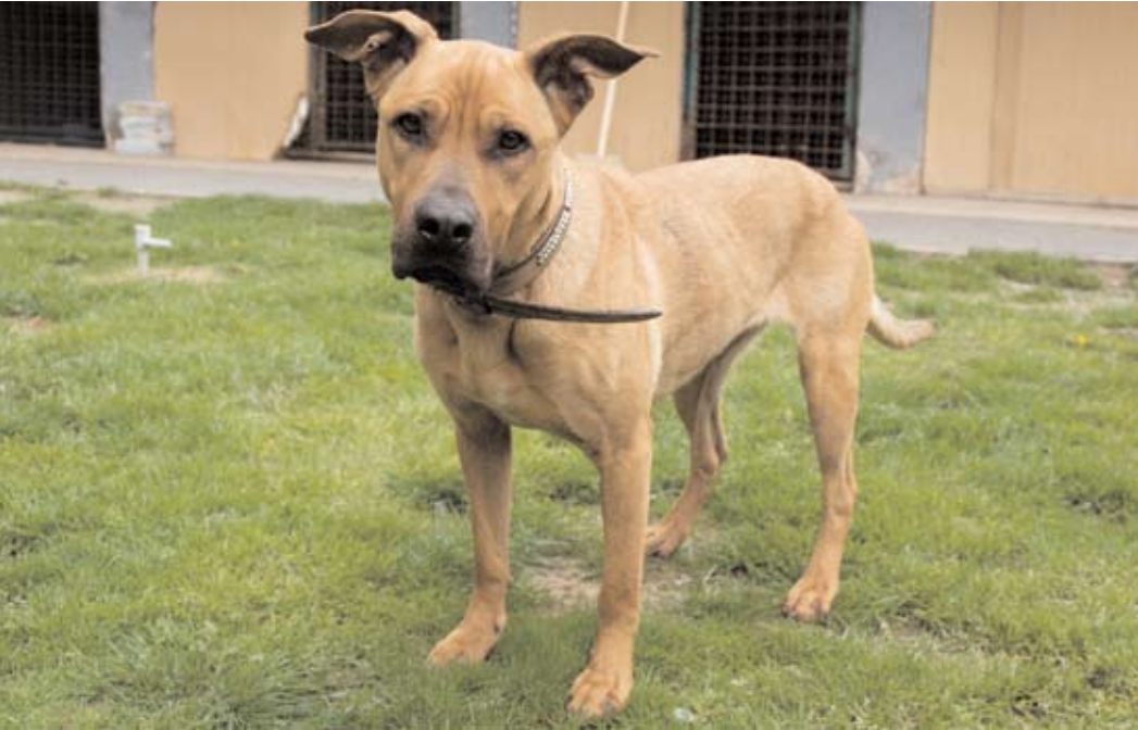
Alfí, ev. č. 52 Tato tříletá fenka křížence stafordšírského teriéra je v útulku půl roku. Je poslušná a za pamlskek se naučí a udělá jakýkoliv povel. Je výborná hlídačka a svoji rodinu opravdu ochrání. Alfí vyžaduje ale stálou společnost svých páníčků. Nemá ráda kočky.