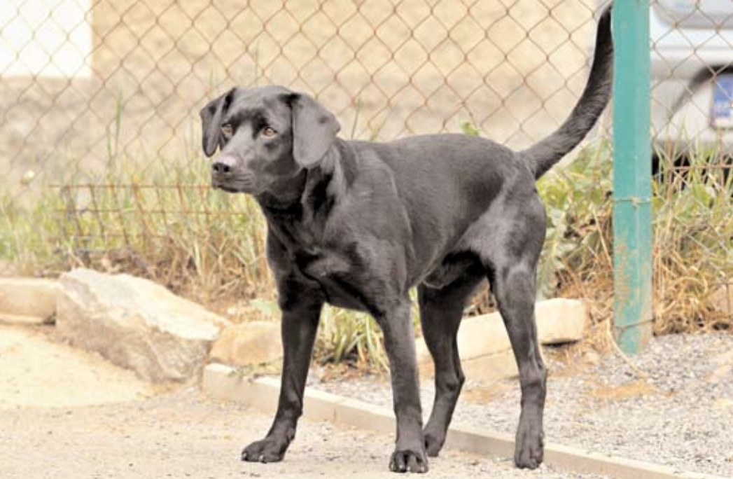
Bruno, ev. č. 7 Asi tříletý kříženec labradora střední velikosti, černé barvy. V útulku strávil již celý rok. Tohoto psa bychom doporučili třeba na výcvik agility kvůli jeho vitalitě. Bruno má bohužel touhu utíkat, ale poslušně se zase domů vrací. K malým dětem ho nedoporučujeme.