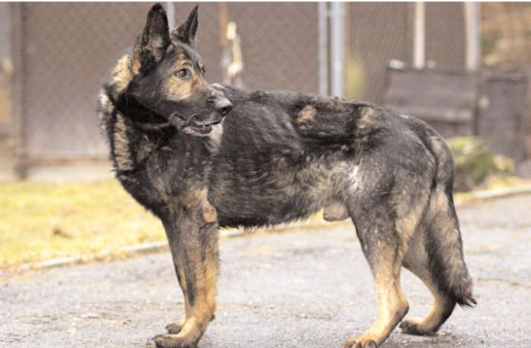
Bady, ev. č. 73 Německý ovčák ve stáří cca deset let, je velice hodný. V útulku od 6. 3. 2013. Má oční vadu, krátkozrakost, proto není vhodný k dětem. Rád by určitě dožil své stáří někde na zahrádce ve společnosti starších lidí.