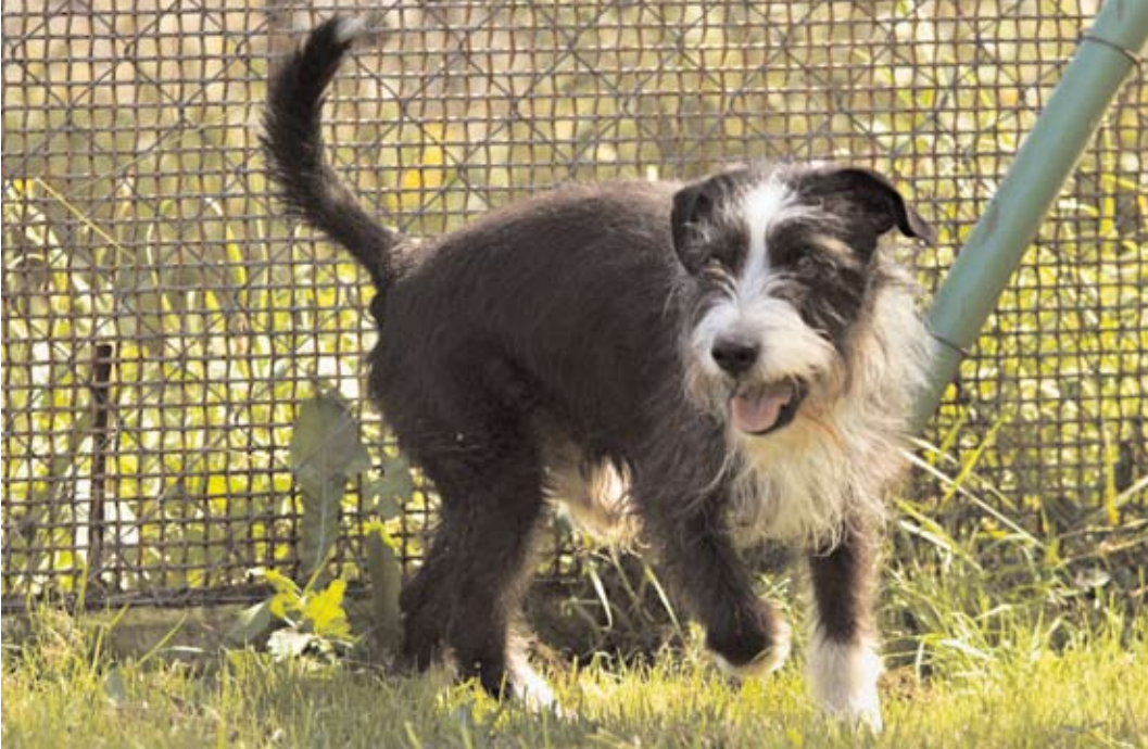
Rafík, ev. č. 47 Asi 4-5letý kříženec malého knírače. Tento pes je již v útulku přes rok a půl. Je vhodný k domku se zahradkou. Nemá rád uzavřené prostory. Je velice oblíbený mezi našimi venčiteli. Není vhodný k dětem. Starší lidé by ocenili jeho přítulnost.