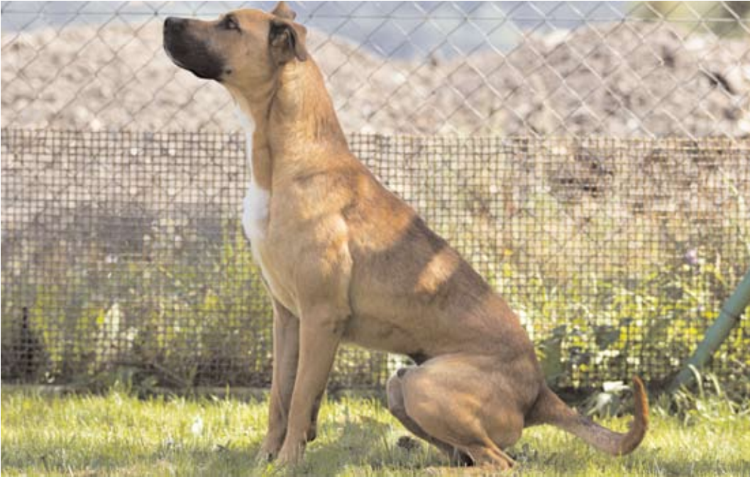
Argo, ev. č. 5 Kříženec staforda asi tříletý, v útulku je již delší dobu. Nemá rád psy, ale sám s nimi konflikt nevyhledává. Je mazlivý a poslušný, má rád lidskou přítomnost. Je výborný hlídač. Vhodný k domku se zahradou. K dětem ho nedoporučujeme.