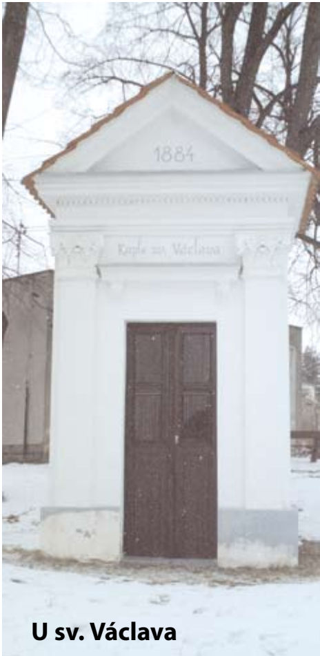
U sv. Václava