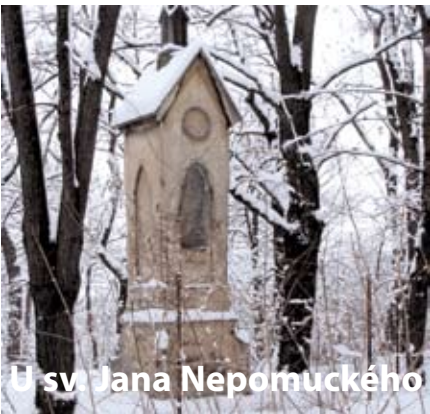
U sv. Jana Nepomuckého