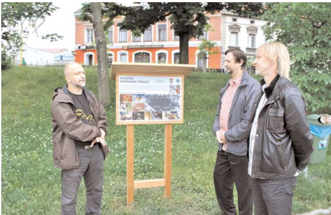
V rámci spolupráce 1. SČV, ČSOP a města Příbram byly u Hořejší Obory instalovány budky pro sýkorky, rehky, špačky a netopýry.