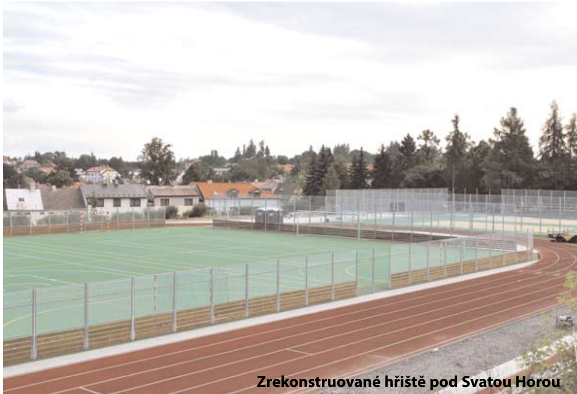
Zrekonstruované hřiště pod Svatou Horou