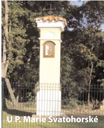
U P. Marie Svatohorské