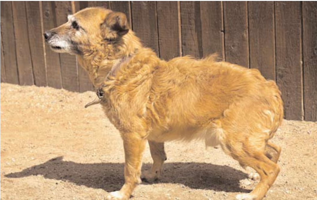
Bobík, ev. č. 8 Asi 10letý psí důchodce, do útulku ho přivezla před rokem Městská policie ve velmi zuboženém psychickém i fyzickém stavu. Bobík ale již poznal, že není každý člověk zlý. Svoji důvěru umí ukázat podáním packy. Při venčení se chová ukázkově a naši venčitelé si ho dopředu zamlouvají. Byl by vhodný k starším lidem. Je čistotný.