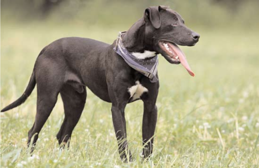
Cedr, ev. č. 58 Kříženec stafordšírského teriéra, asi roční pes, bohužel mu chybí jedno oko, ale nechybí mu veselý elán do života. Je hravý, vnitavý, vhodný i pro výcvik. Není vhodný k dalšímu psovi. Je hodně majetnický ke svému pánovi. Nedoporučujeme ho ani k dětem. Výborný hlídač. V útulku je již od 22.2.