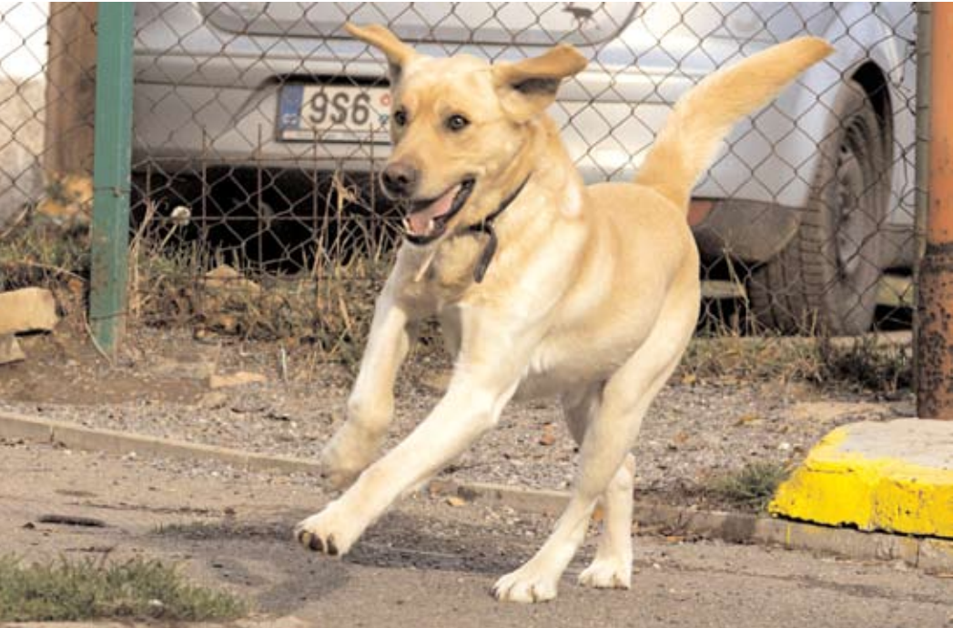
Majky, ev. č. 36 Od ledna je v útulku tříletý labrador, veselý, hravý pes, pokud není v okolí jiný pes. Bohužel má snahu se vytahovat a jiné psy napadat. Je vhodný k hlídání, pokud v sousedství není další pes. Není vhodný do rodiny s dětmi. Vhodný k výcviku.