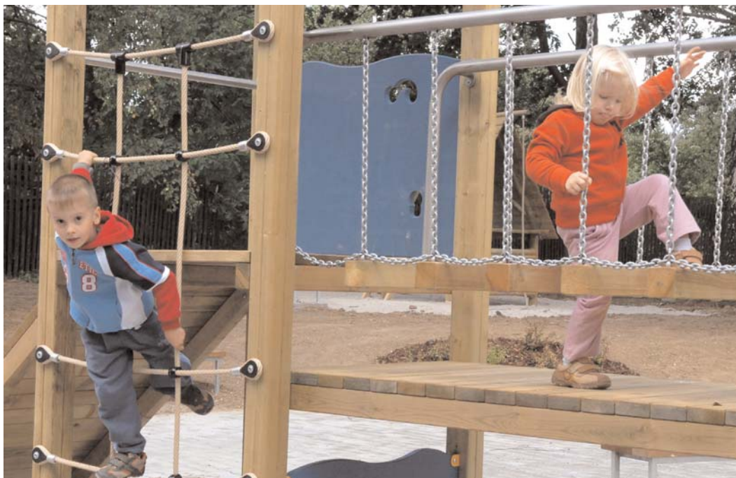
Víceúčelové hřiště na Hlinovkách již slouží veřejnosti. Jeho součástí je také dětské hřiště.