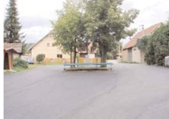
Krásného letního počasí město využilo k pokládání nových asfaltových povrchů na místních komunikacích, např. na návsí v Zavržicích.