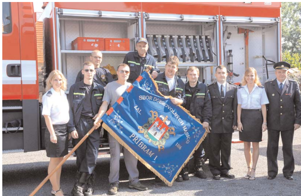
Příbramští dobrovolní hasiči se koncem července zúčastnili oslav 130. výročí založení SDH Dubno. Při této příležitosti hasiči z SDH Příbram I představili novou hasičskou stříkačku MAN, kterou hasičům město Příbram koupilo v letošním roce.