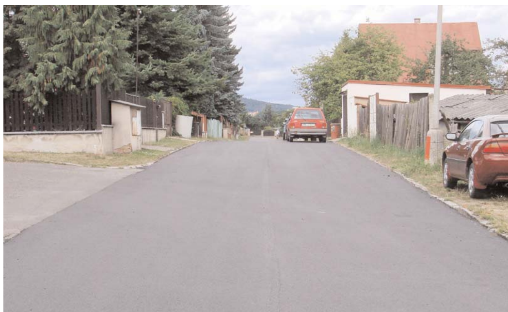
Na žádost Osadního výboru Sázky zajistilo město Příbram pokládku nového asfaltového povrchu na chodníku před prodejnou na Sázkách a v ulici V Domcích.