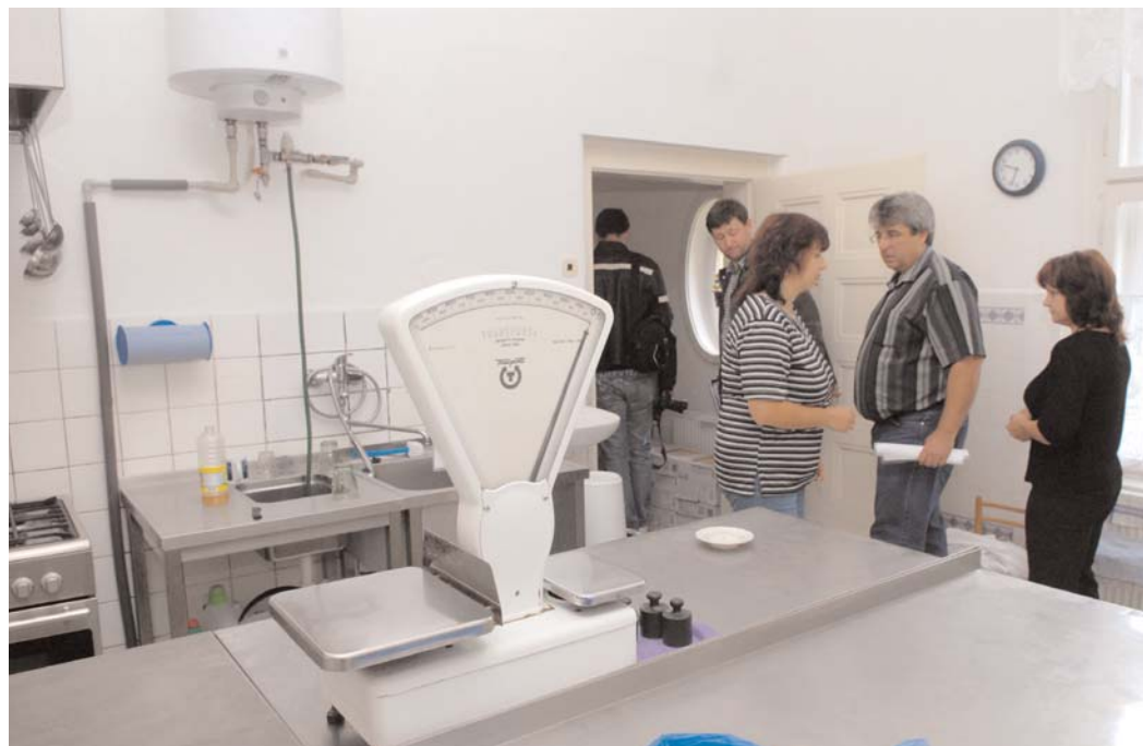
V Mateřské škole Kličkova víla probíhají rozsáhlé rekonstrukční práce. Ve sklepních prostorech ve školce se buduje hygienické zázemí pro pracovníky kuchyně. Současně se ve sklepích dělají sanační omítky a vnitřní drenážní systém, čímž dojde k odvlhčení budovy.