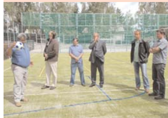
Snímkem se vracíme k otevření víceúčelového hřiště na Hlinovkách.