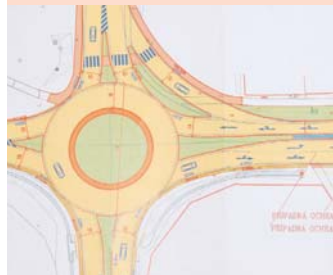
Na snímku vidíte kruhový objezd, který by měl být postaven na křižovatce ulic Evropská a Jinecká.