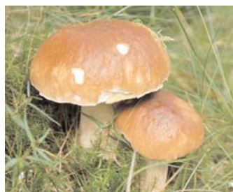
Co říkáte, rostou nebo nerostou?