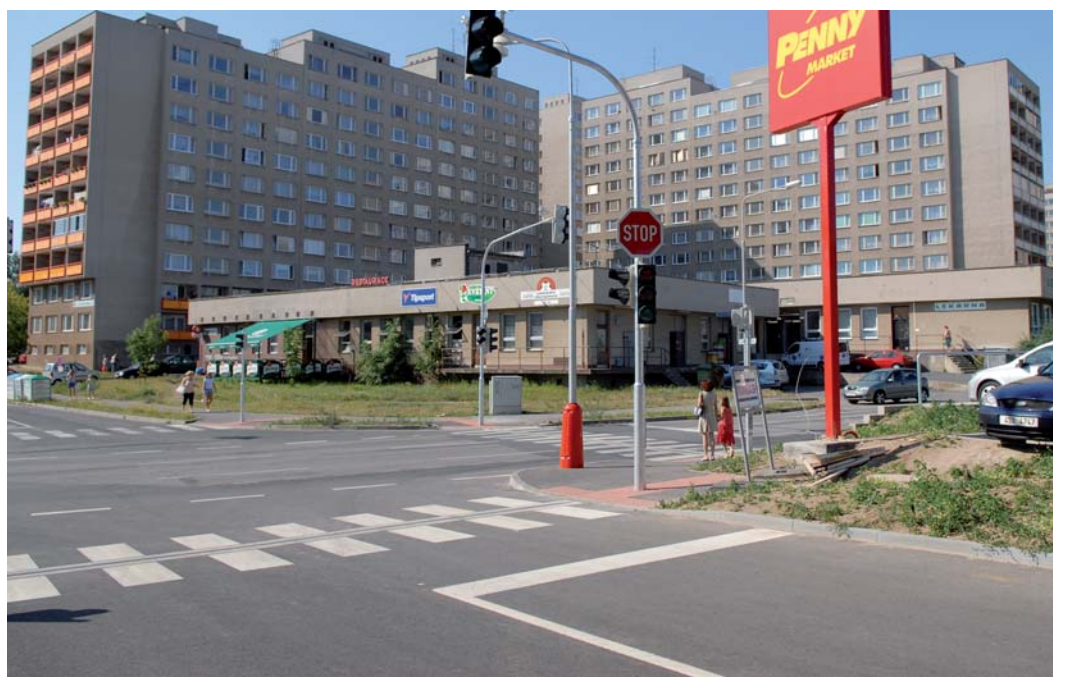
Po vybudování PENNY MARKETU v Seifertově ulici zde byla vybudována nová křižovatka.