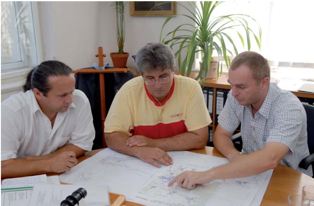
V červenci se sešlo vedení města nad projektem Čistá Litavka. Ani o prázdninách se nezaháli.