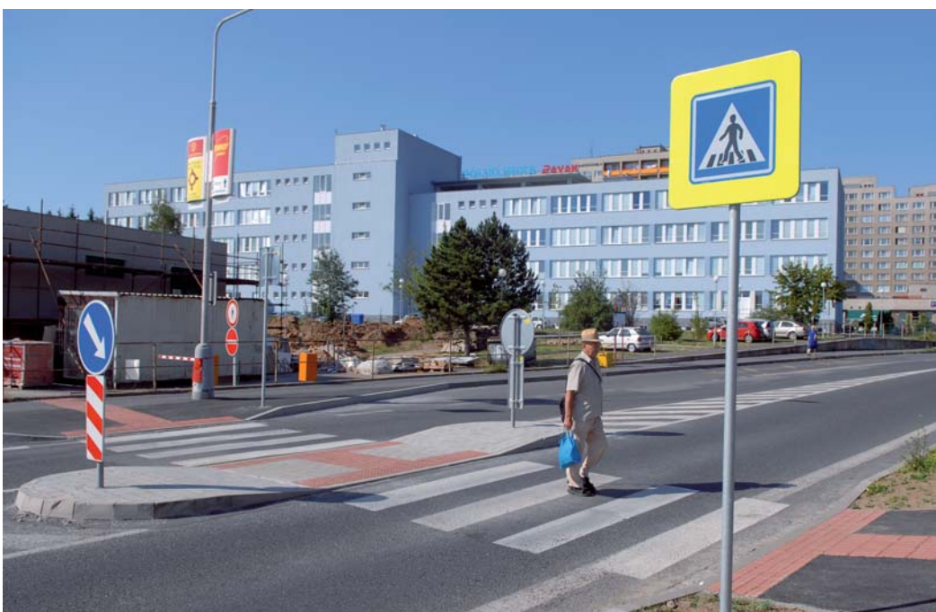
Na křižovatce u Alberta v Seifertově ulici byl vybudován nový přechod pro chodce.