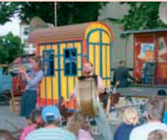
Ve čtvrtek 15. 7. přijel do Příbrami divadelní soubor „Teatr Viti Marčička“. Obecenstvo se při jeho hrách nejen příjemně bavilo, ale i spolupůčinkovalo.