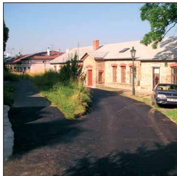
Na prvním snímku je nově vybudovaný bezbariérový vstup do kostela sv. Jakuba na náměstí T. G. Masaryka. Na druhém nový asfaltový povrch na komunikaci Pod Čertovým pahorkem. Třetí záběr je z Jarolímkových sadů.