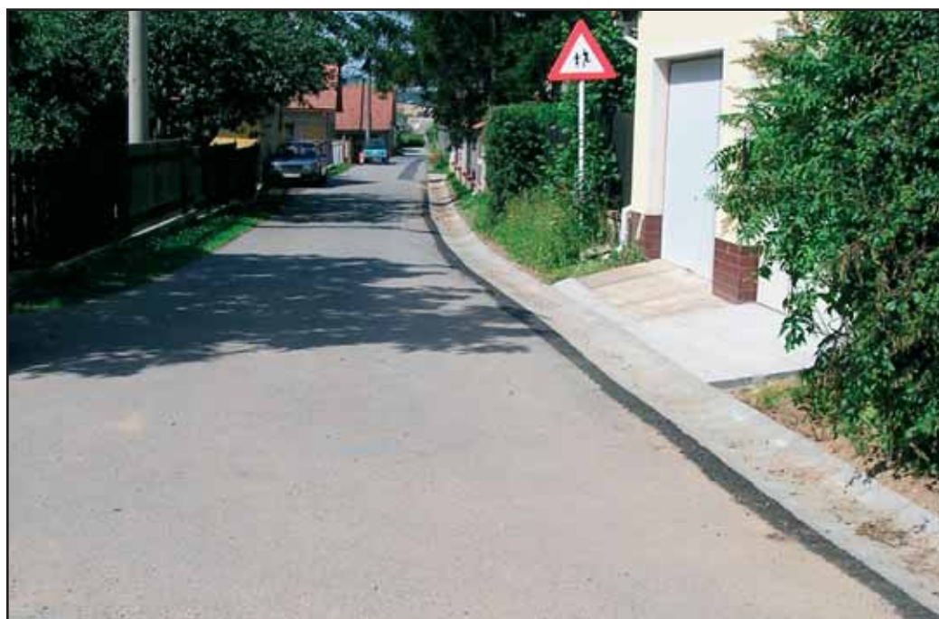
Město nezapomíná ani na přilehlé obce. Na snímku vlevo je komunikace v Žezčicích. Byl zde položen nový asfaltový povrch. Na komunikaci v Jerusalémě byly položeny nové žlabové desky, které pomohou odvodnit místní komunikaci při prudkém dešti.