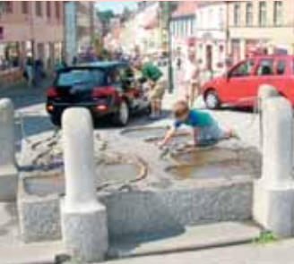
V horku poslouží k osvěžení i kašna na Václavském náměstí.