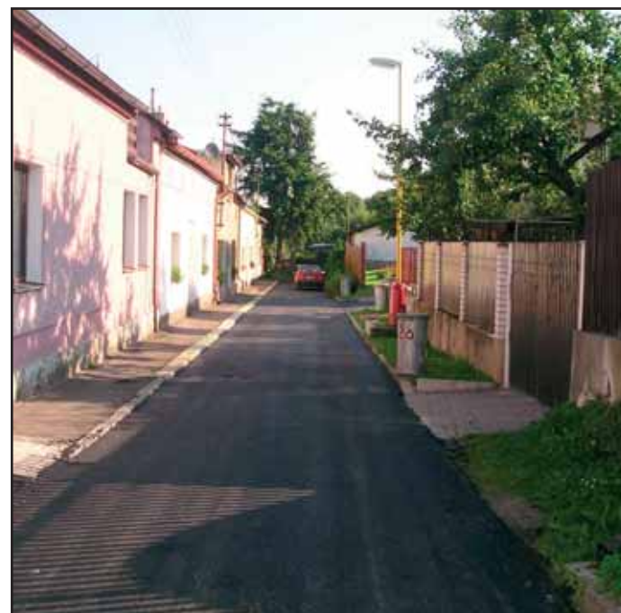
V rámci schváleného rozpočtu zajišťuje odbor dopravy MěÚ Příbram opravy komunikací. Na první fotografii je nový chodník k Hlinomazové ulici. Druhý snímek je z ulice Pod Čertovým pahorkem. Byla to rozsáhlá akce a opravená komunikace přispěla ke zlepšení životního prostředí zdejších obyvatel. Třetí záběr je z Libušiny ulice na Březových Horách.