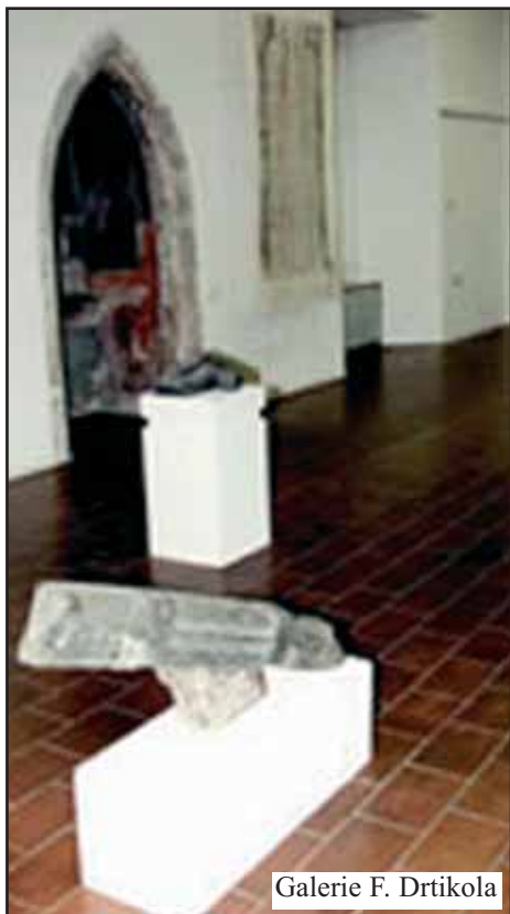
Galerie F. Drtíkova

Další položkou je Infocentrum. Rozpočet je ve výši 925 000,- Kč. Z něj se hradí provoz IC a Zpravodaj