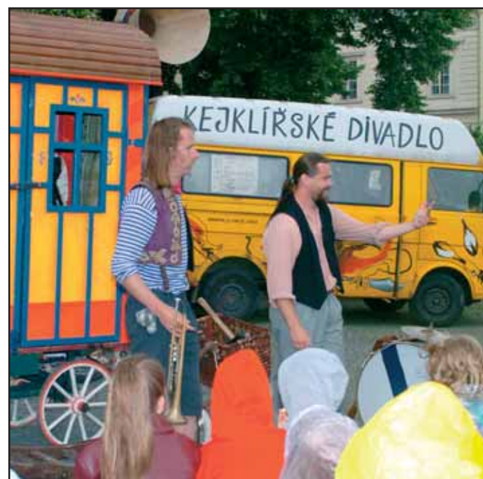
Teatr Vít Marčíka zapojil do děje i přítomné občanstvo.