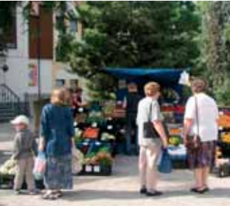
Léto je již v plném proudu a na trhu s ovocem a zeleninou je pořád rušno.