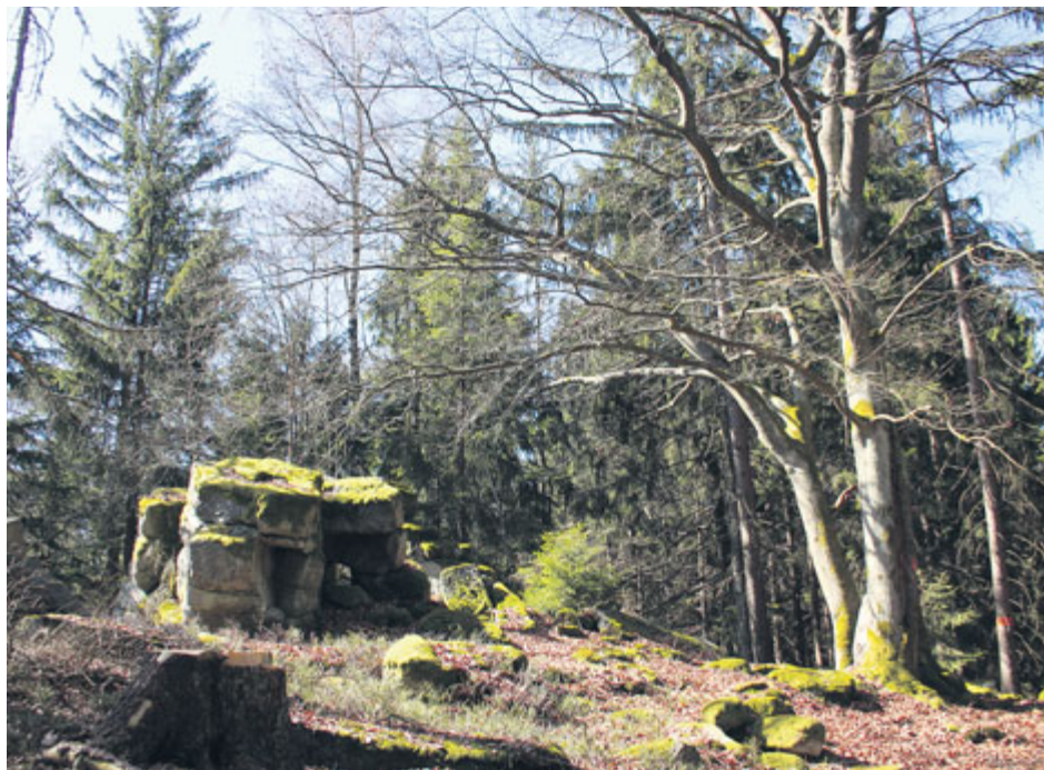
Kamenná, skalisko na jižním vrcholu (733 m).