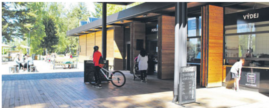
Vyhledávaným cílem na Nováku se stalo SeZaM bistro.

Díky „korona“ přestávce jsme realizovali nejen běžnou údržbu a opravy, ale také práce, které se za provozu realizují komplikovaně. Každé středisko má své specifické požadavky. Hřiště pod Svatou Horou bývá po zimním čase v mírně zdemolovaném stavu. Opravili jsme dřevěná hrazení, síť, zábradlí, herní prvky a provedli kompletní úklid a dezinfekci. Na Novém rybníce probíhaly dvě velké investiční akce, dále pak opravy elektroinstalace letního kina, laviček, pochozích cest nebo dětských hřišť. Vnitřní plavecký bazén prošel již popisovanými změnami. Při zprovoznění venkovního bazénu jsme renovovali betonové prvky, čerpadla, sekali trávu a dezinfikovali. Odstávka zimního stadionu se využila k pravidelné kom-