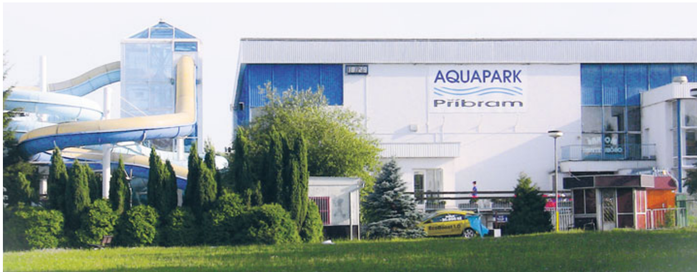
Projekt počítá s rekonstrukcí plaveckého bazénu i toboganů.

Příbramský aquapark má letos 43 let. Stavba tohoto věku vyžaduje komplexní přestavbu. Příbram ji připravuje už několik let, v květnu se však zastupitelstvo rozhodlo, že nepodpoří do té doby platnou maximalistickou variantu. Shodlo se na tom vedení města i opoziční zastupitelé. Na rekonstrukci aquaparku se pracuje dál, ale v okleštěné podobě. V první fázi se nepostaví například saunový svět, i tak by však přestavba měla přinést nové možnosti a služby pro návštěvníky.