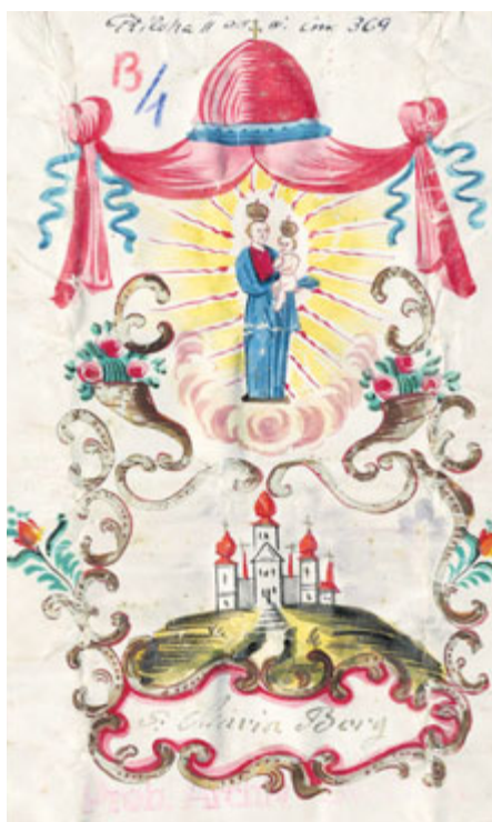
Svatohorský obrázek, před rokem 1778.