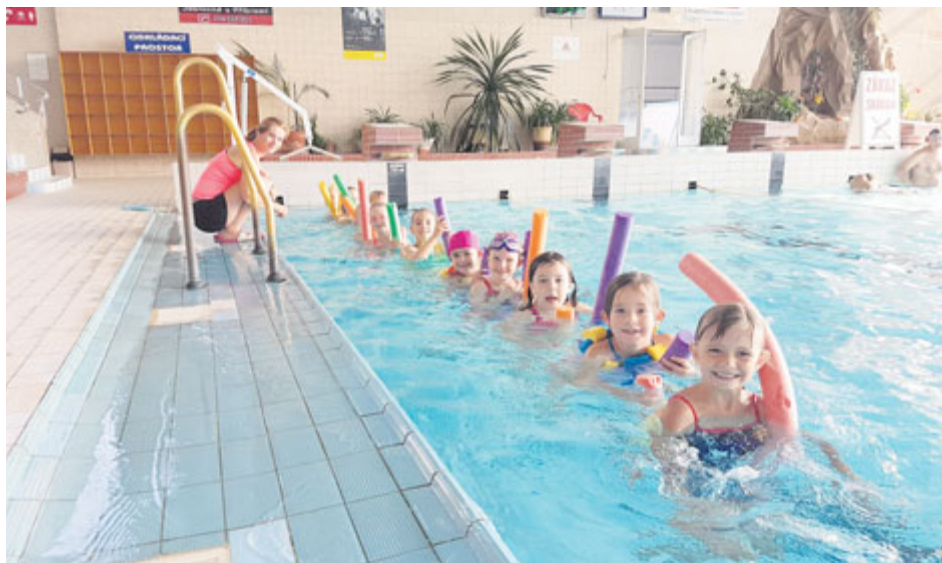
Častými návštěvníky aquaparku jsou školy a dětské skupiny.