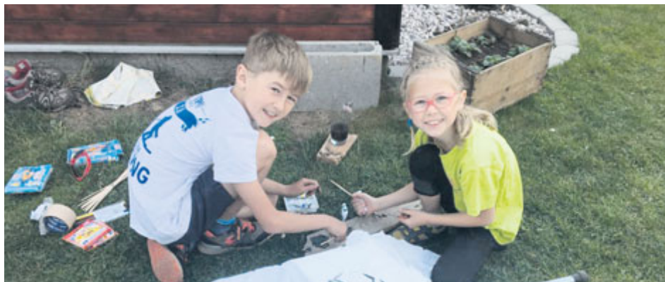
Zavření škol probudilo v některých dětech (i rodičích) větší kreativitu.

Hurá! Jsme nazpět ve škole opět mezi přáteli a kamarády. Po dlouhé době a za přísných hygienických opatření mohli 25. května alespoň někteří naši žáci znovu usednout do školních lavic. Jak jsme zvládali dva a půl měsíce koronavirových „prázdnin“?