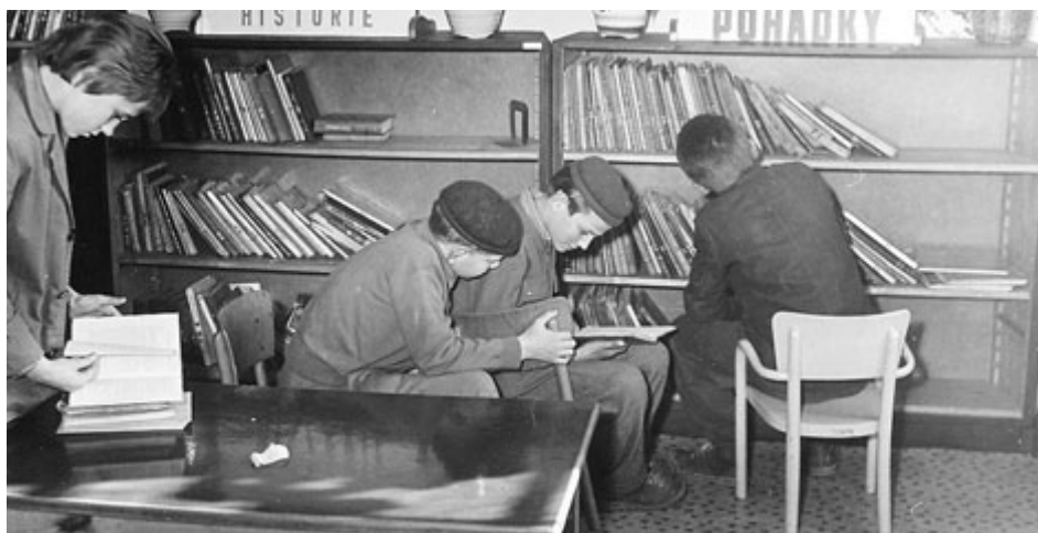
Dětská čtenářka v padesátých letech minulého století.