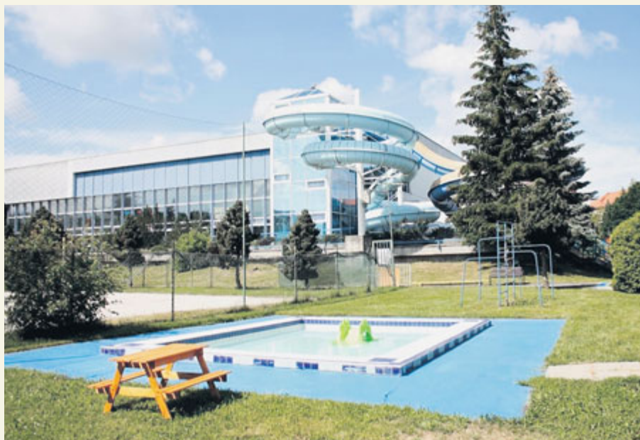
V těsném sousedství aquaparku je i venkovní bazén se zázemím pro malé děti.

Průvih nastal tak, že existoval rozpočet, který byl vypracovaný na základě dokumentace pro stavební povolení. Ten mířil k 300 milionům korun. O půlroku později přišel rozpočet podrobný, prováděcí dokumentace, a najednou jsme se všichni orosili. Protože ten byl přes 400 milionů. Tam někde je chyba. Samozřejmě máme zodpovědnost, já jako někdejší starosta, koaliční partner, který to měl na starosti, i on má odpovědnost, i zastupitelé, kteří hlasovali pro. Všichni máme zodpovědnost za to, že projekt zamířil někam, kam nechceme. Jak mohl však některý ze zastupitelů, radní nebo i starosta předvídat, že rozdíl mezi rozpočtem, který byl dělán na základě dokumentace pro stavební povolení, a druhým, podrobnějším rozpočtem, bude příšerných 100 a více milionů korun? Tím se nikdo z nás předtím nesetkal. Je mi smutno, protože nyní se pravděpodobně odsuzujeme k vytvoření projektu, který je bezpochyby morálně zastaralý. Prostě budeme mít pár plaveckých drah se studenou vodou. Tím určitá šance pro Příbram zemřela.