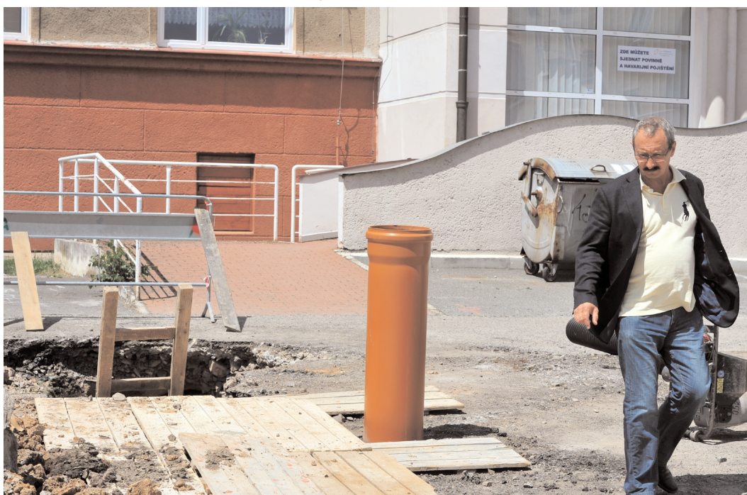
Také o probíhající rekonstrukci vnitrobloku Ve Dvoře Vás informujeme na titulní straně.