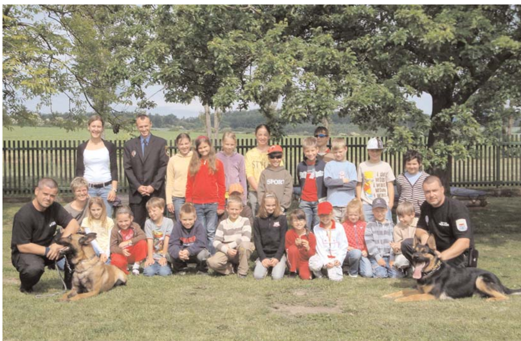
Strážníci Městské policie Příbram předvedli žákům Základní školy Suchdol v rámci Programu prevence kriminality zásahy se služebními psy.