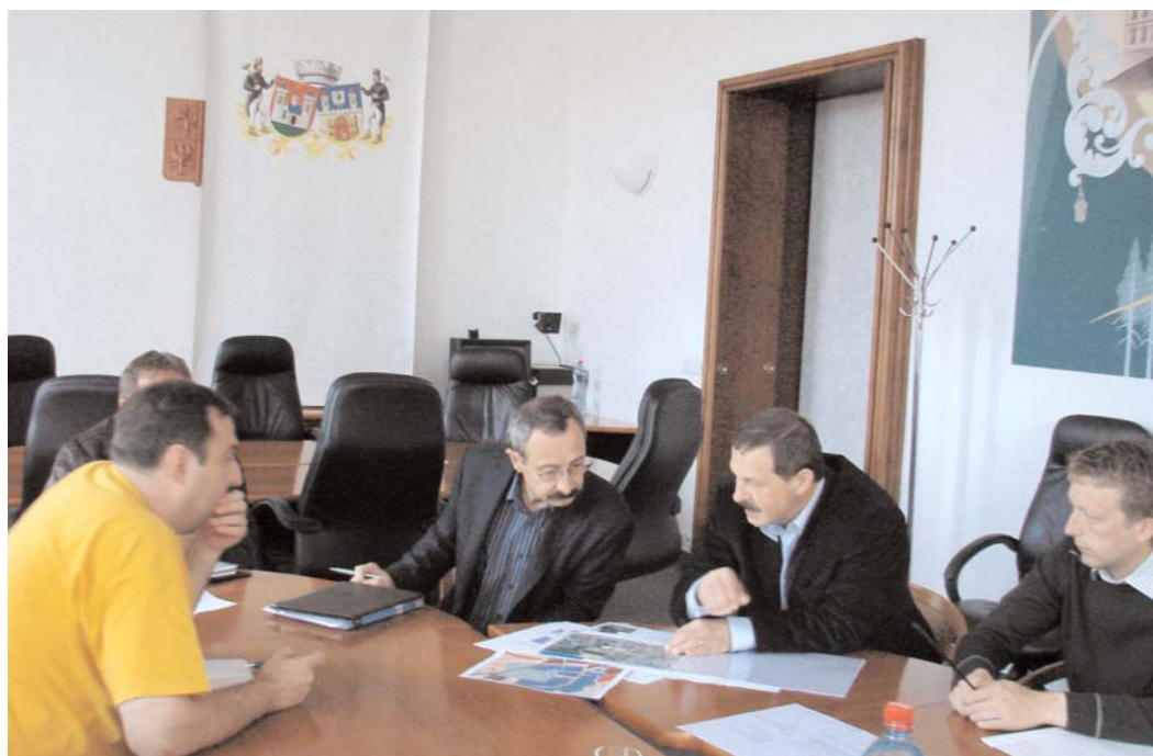
Ve středu 24. 6. proběhlo na radnici další jednání ohledně výstavby parkovacího domu.