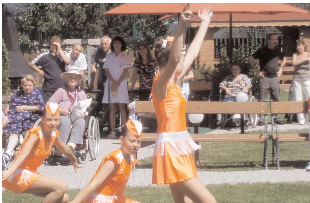
Obyvatelé Domova důchodců na Březových Horách prožili příjemné odpoledne - na zahradě poseděli u krbu a sledovali kulturní program, který pro ně zorganizovali zaměstnanci. Hlavními účinkujícími byly malé mažoretky, které předvedly krásné vystoupení.