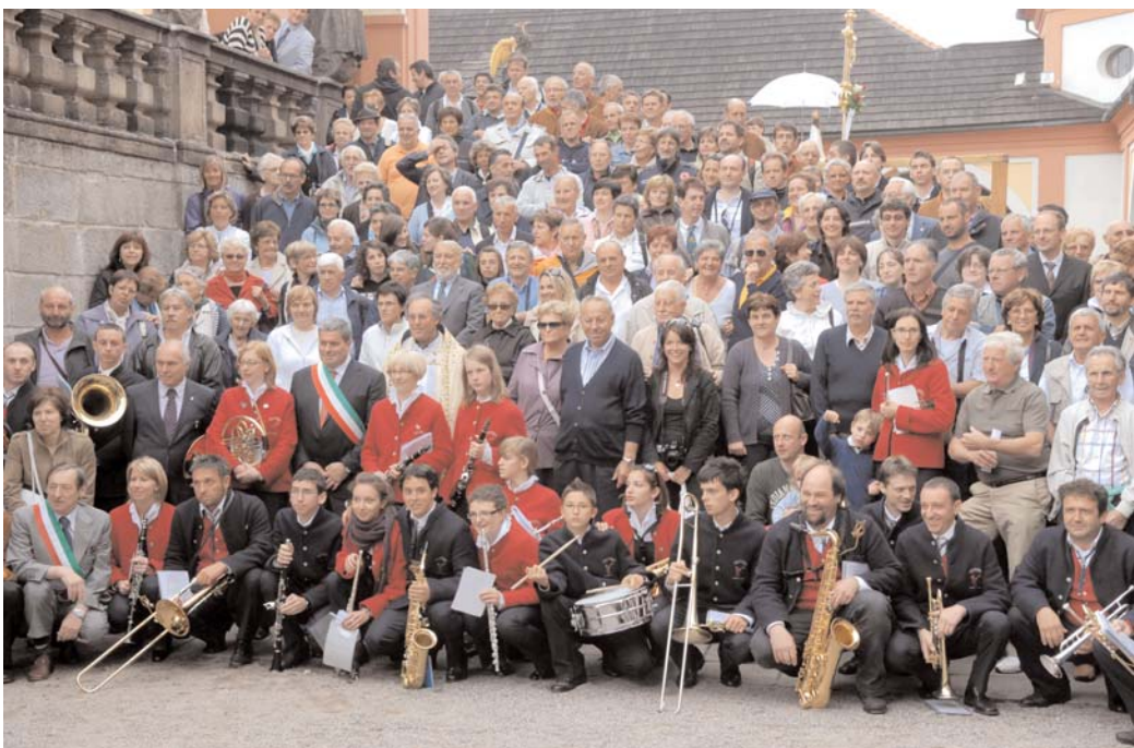
To jsou zástupci obyvatel z údolí Valle di Ledro, kteří mají od svých předků v živé paměti jejich vyprávění o pobytu na Příbramsku. Za pomoc během válečných let jsou všichni stále velmi vděční a jsou rádi, že mohli na vlastní oči poznat místa, která znají z vyprávění. Na shledanou, přátelé!