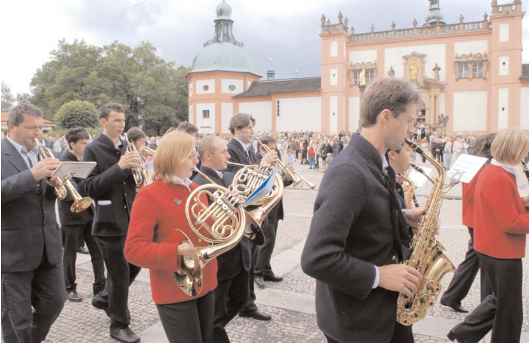
S italskými hosty přijeli také členové hudebního souboru Corpo Bandistico della Valle di Ledro, dvakrát koncertovali na Svaté Hoře a měli velký úspěch.