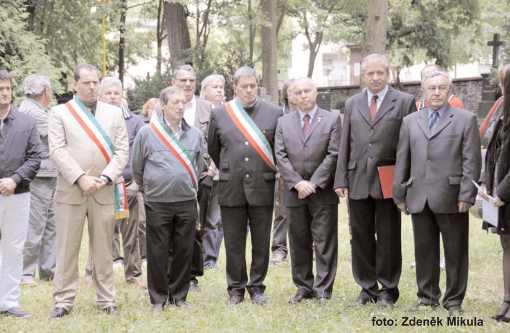
V sobotu odpoledne byly na březohorském a slivickém hřbitově odhaleny pamětní desky se jmény italských občanů, kteří jsou na těchto hřbitovech pohřbeni.