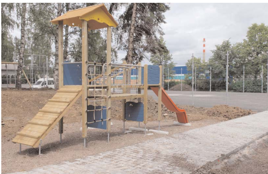
Na Drkolnově na "Hlinovkách" město vybudovalo multifunkční hřiště a bylo již předáno občanům do užívání.