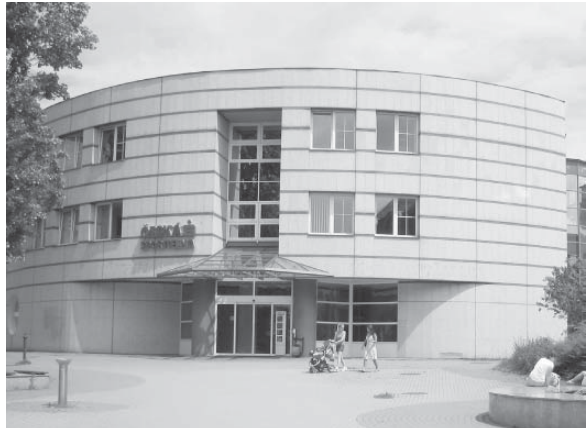
O kvalitě služeb se můžete přesvědčit v pobočce v Příbrami, Milínská ul. 166, tel. 318 646 301.

Přesto nebo právě proto pobočka patří k těm neúspěšnějším, každoročně získává ocenění za kvalitu poskytovaných služeb, která vychází z hodnocení klientů a dále jsou zde pilotovány mnohé projekty a nové produkty. Dalším významným úspěchem při rozvoji Příbramska je podíl klientů komunální sféry, kterých je obsluhováno více než 82 %.