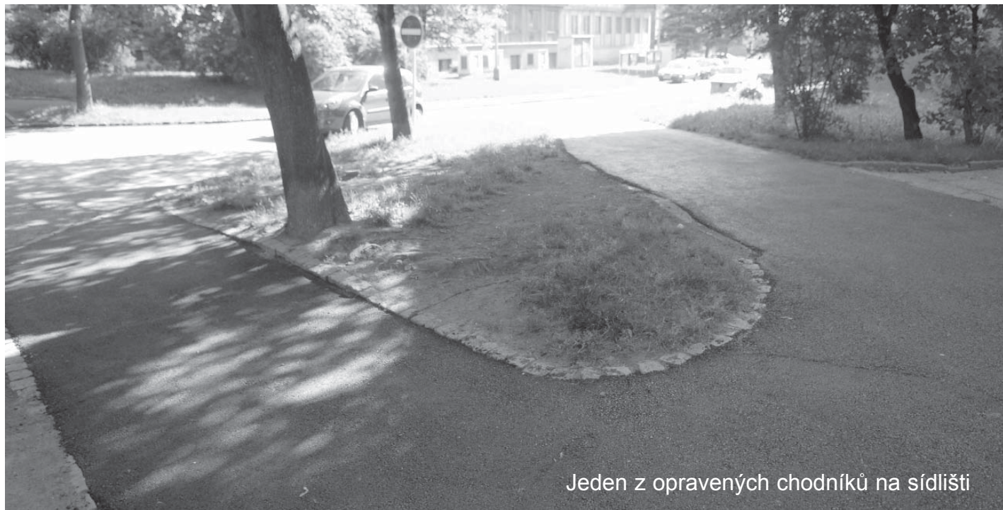
Jeden z opravených chodníků na sídlišti