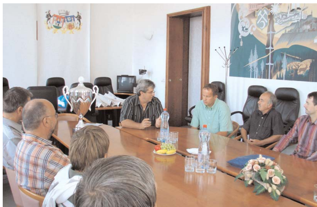
V úterý 8. 7. přijal starosta na radnici fotbalisty. Byli to členové FC Union Brdy, kteří získali titul mistra republiky v malé kopané pro rok 2008. Mistrovství se konalo 28. a 29. 6. v Pardubicích.