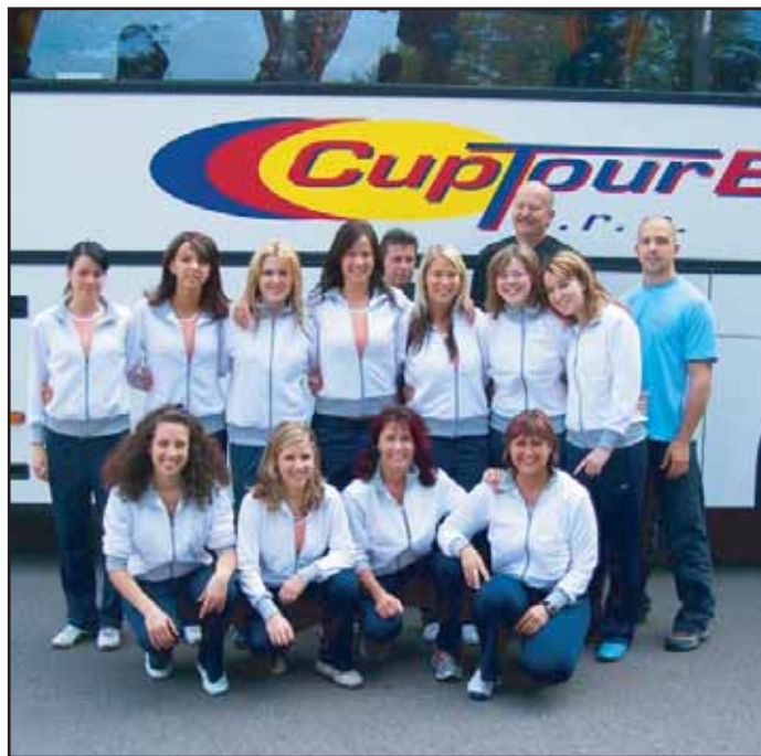
Týmy Sportklubu Oxygen jsou letos opět úspěšné.