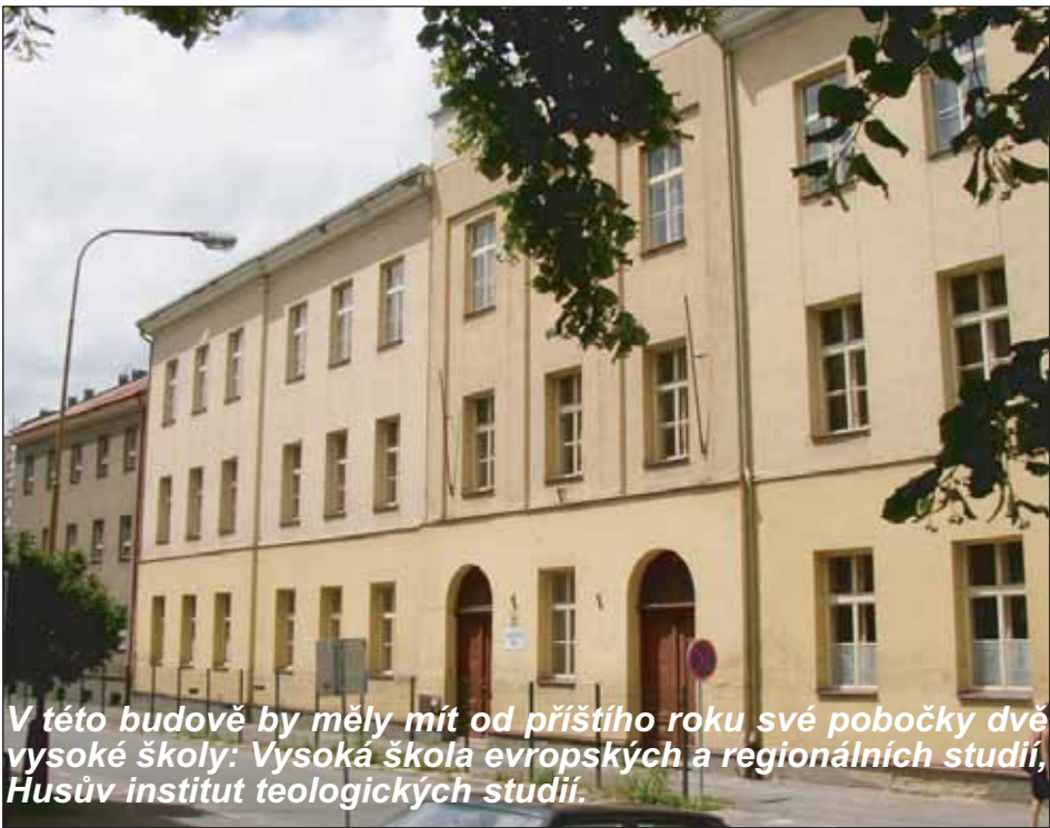
V této budově by měly mít od příštího roku své pobočky dvě vysoké školy: Vysoká škola evropských a regionálních studií, Husův institut teologických studií.

● Firma, která zvítězila ve výběrovém řízení na rekonstrukci Divadla Příbram, od soutěže odstoupila s tím, že dosud nebyla vyzvána k podpisu smlouvy. Důvodem bylo odvolání se firmy, která skončila na druhém místě, a bylo tedy nutné dodržet zákonné postupy. Je možné, že realizace těchto prací bude odsunuta až na příští rok, nebo práce provede firma, která skončila druhá v pořadí a nabídla i kratší dodací lhůty. V současné době již je připraveno i výběrové řízení na vý-