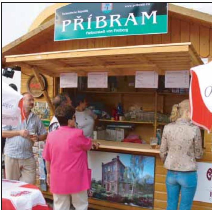
Město Příbram se v červnu zúčastnilo tradičních hornických dnů v německém Freibergu.