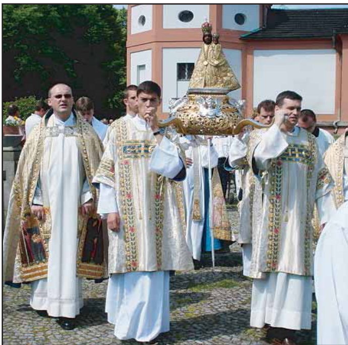
V neděli 25. 6. se konala na Svaté Hoře tradiční korunovace.