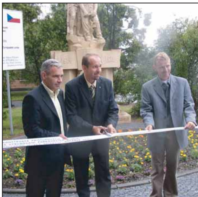
V pátek 30. 6. byla slavnostně předána dokončená stavba „Hornické muzeum - příjezdová komunikace“. Stavbu podpořila EU.