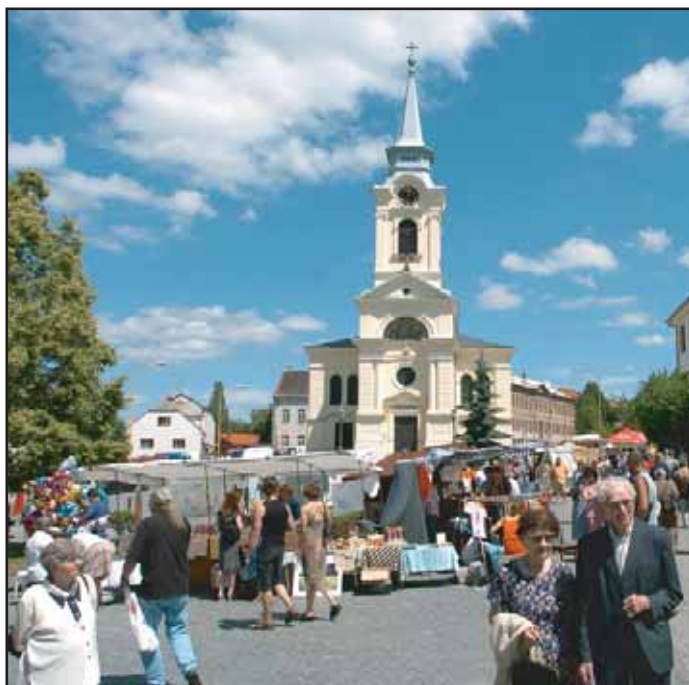
V neděli 2. července proběhla na Březových Horách tradiční Prokopská pouť. Organizátoři vše opět zvládli na jedničku. Děkujeme a již nyní se těšíme na Prokopské pouti v roce 2007 na shledanou!