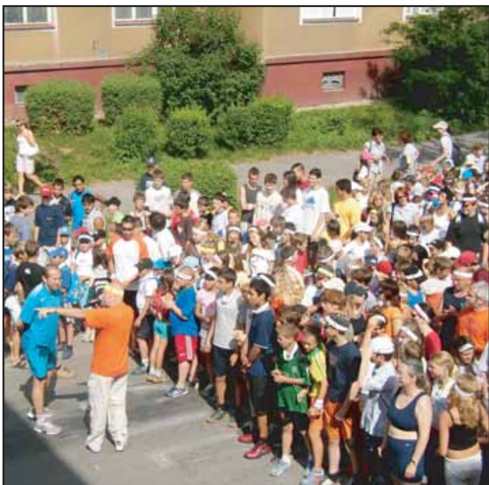
V pondělí 26. 6. se běžel v Příbrami Běh Terryho Foxe. Snímek zachycuje atmosféru těsně před startem.