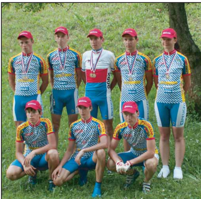
Cyklisté Cykloklubu Příbram byli úspěšní na Mistrovství ČR 2006.