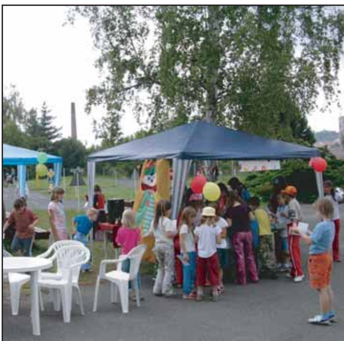
Dne 29. června zakončilo Dětské dopravní hřiště školní rok uspořádáním "Dětského dne". Zúčastnilo se ho 225 žáků z celé Příbrami.