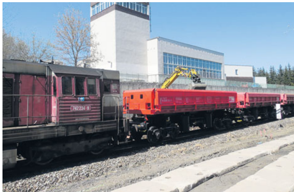
Vytěžená zemina byla odvážena speciálními stavebními vlaky.