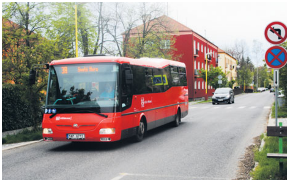
MHD by měla ideálně být páteří příbramské dopravy.

Další podstatnou složku dokumentu představuje generel parkování. Jeho základními cíli je zlepšit kvalitu parkování, zvýšit kapacity parkovacích stání, snížit zbytnou dopravu pomocí naváděcích a informačních systémů, zvýšit dopravní bezpečnost a přispět k ekonomickému a společenskému rozvoji města. „Při analýze parkování se vycházelo z průzkumu parkování ve vybraných částech města, z dat