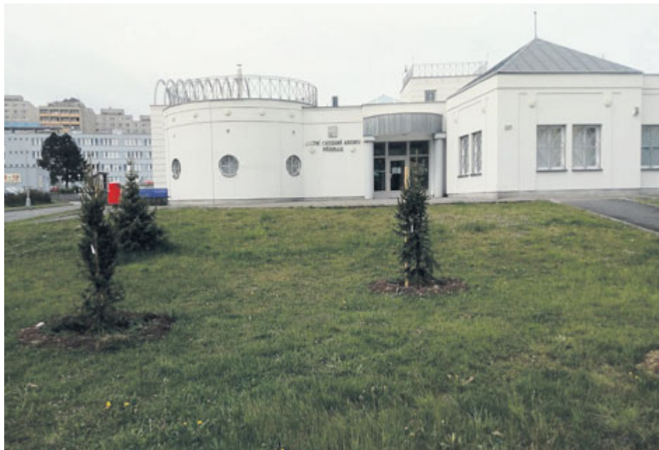
Nové stromy přibyly i před budovou příbramského archivu.

Na dvě stovky stromů a keřů vysázeli v průběhu dubna pracovníci Technických služeb Příbram hned v několika příbramských lokalitách.