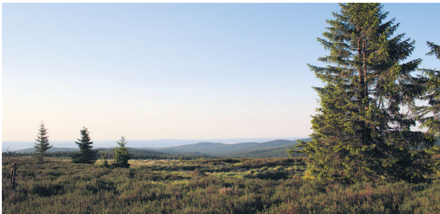
Z bezlesé severní planiny Toku se otevírá široký pohled k severním hranicím České republiky.

Cesta Aliance je jednou z nejvýznamnějších brdských lesních cest, ve své nejvyšší části překlenující sedlo mezi dvěma brdskými vrcholy – Tokem (865 m) a Houpákem (794 m). Vrcholová část Aliance je zároveň důležitou křižovatkou. Tato lokalita se jmenuje Dlouhý kámen.