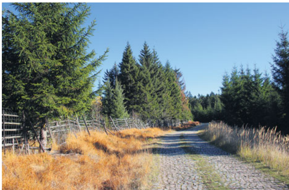
Lesní cesta Aliance patří k nejvýznamnějším brdským komunikacím.