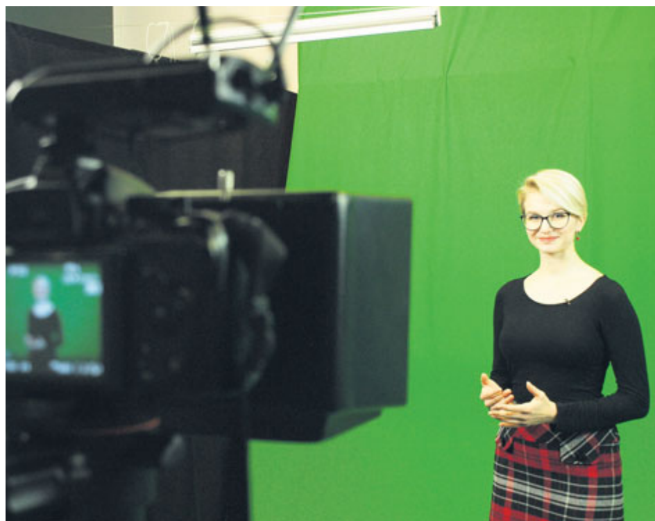
I práce pro školní televizi vyžaduje nasazení, odpovědnost, přehled a spolehlivost.

Před 15 lety se začala psát, či spíše vysílat, historie GymTV, školní televize Gymnázia Příbram. Jejím cílem bylo přinášet jednou měsíčně zprávy ze školy. Postupně se k tomu přidalo webové zpravodajství, spolupráce s ostatními školními televizemi i Českou televizí, dokument o škole, záznamy školních akcí a nakonec i přímé přenosy či měsíčník živě vysílaných rozhovorů.