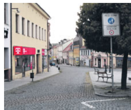
Ne každý respektuje značku pěší zóny, a tak, ke slovu“ přicházejí sloupky bránící vjezdu.