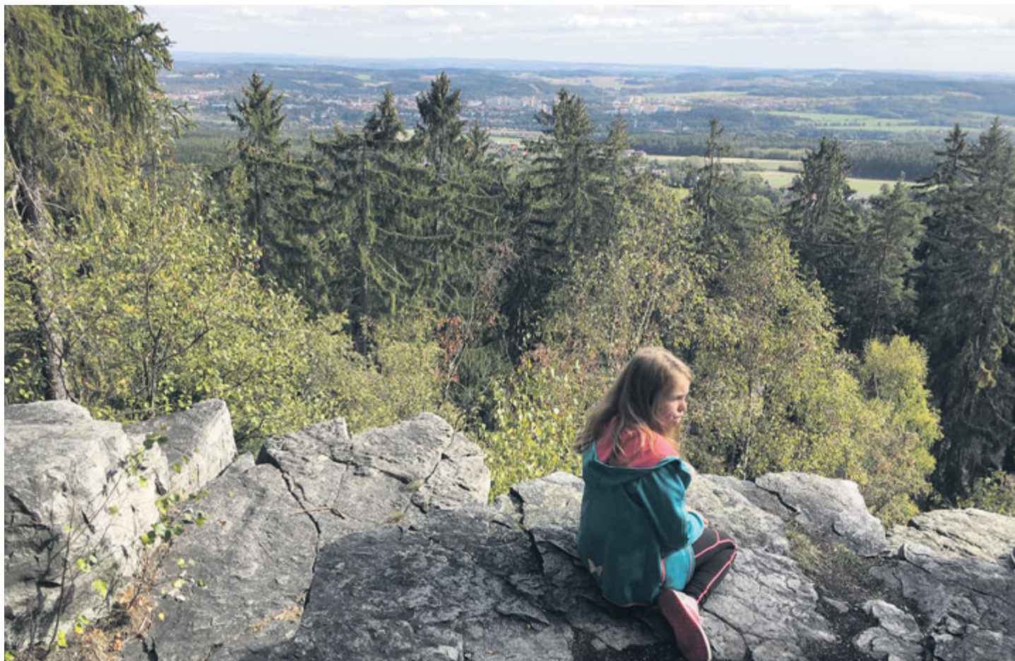
Udělejte si rodinný výlet do Brd.

V čase nejprudších karanténních opatření v souvislosti s šířením onemocnění covid-19 se oči mnohých obyvatel Příbrami upnuly k vrcholům Brd. Zde bylo a je možné relaxovat při běhu či na kole i bez ochrany obličeje, a fakticky i obrazně se tak opravdu zcela nadechnout. Opět se potvrdilo, že blízkost Brd k městu je velmi cennou devizou. Turistická sezona tak pro Příbramské letos začíná a vzhledem ke karanténním opatřením možná i skončí „pouze“ výlety do Brd.