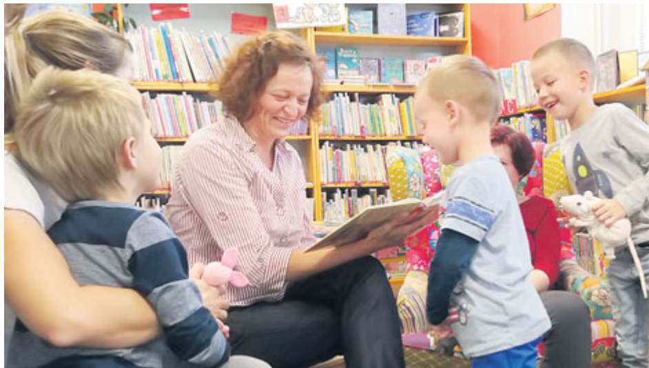
Společné čtení baví všechny zúčastněné.

Představujeme Knihovnu Jana Drdy v roce 120. výročí jejího založení. Tentokrát pokračujeme pobočkou Škola, která sídlí v největší základní škole v Příbrami.