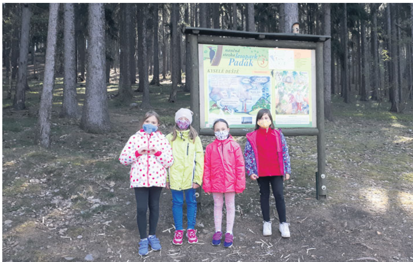
V době nouzového stavu se o děti rodičů, kteří pracují v rámci IZS, staraly vychovatelky ze ZŠ Školní. V rámci prvouky se jim snažily vysvětlit koloběh života v přírodě - ať již programem Od semínka k semínku , kdy si děti zasadily kytičku, nebo vycházkou na naučnou stezku Padák .

Rozšiřování nákazy novým typem koronaviru způsobujícího velkou úmrtnost po celém světě, které záhy zasáhlo také naši republiku, postavilo vládu a krizový štáb na státní úrovni před nelehký úkol zpomalit rychlé šíření viru. Celá situace výrazně zasáhla školství.