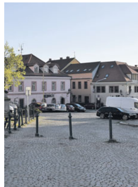
Debata se vede například o tom, nakolik má být na náměstí zachováno parkování.

rekonstrukce-alis.pribram.eu web o architektonické soutěži