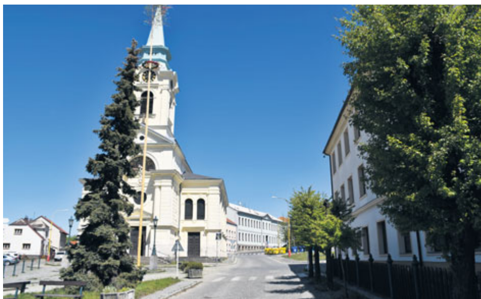
Dominantou březohorského náměstí je kostel sv. Vojtěcha.