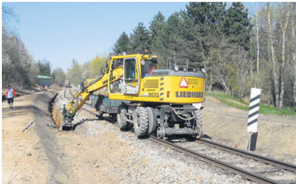
Podle Správy železnic vyjde vybudování nové zastávky na skoro 30 milionů korun.

„Železniční doprava na zastávce bude dostupná pro občany se sníženou schopností pohybu i pro zrakově postižené díky vybudování bezbariérového přístupu na nástupiště. V ploše nástupiště budou umístěny vodící linie, varovné a signální pásy,“ uvedla Radka Pistoriusová. V rámci výstavby nové zastávky se provádí také rekonstrukce železničního svršku a sanace železničního spodku v délce přibližně 150