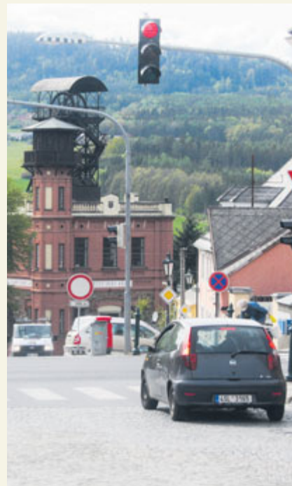
Jedním z největších problémů Březových Hor je předěl lokality silnicí první třídy.

Vzhledem k tomu, že nejsem architekt, mohu jen těžko posoudit všechny okolnosti, které mohou ovlivnit možnosti rekonstrukce prostor nám. J. A. Alise. Jisté ale je, že současný stav náměstí nesplňuje svou funkci centrálního místa Březových Hor, určitě není jejich pěknou vizitkou. Podle mého názoru by si náměstí zasloužilo více zeleně, představoval bych si jakousi klidovou zónu, která by korespondovala s dominantou celého náměstí, kostelem sv. Vojtěcha. Myslím, že betonové květináče jsou ohyzdné, i když jsou pokusem vnést aspoň trochu života do tohoto