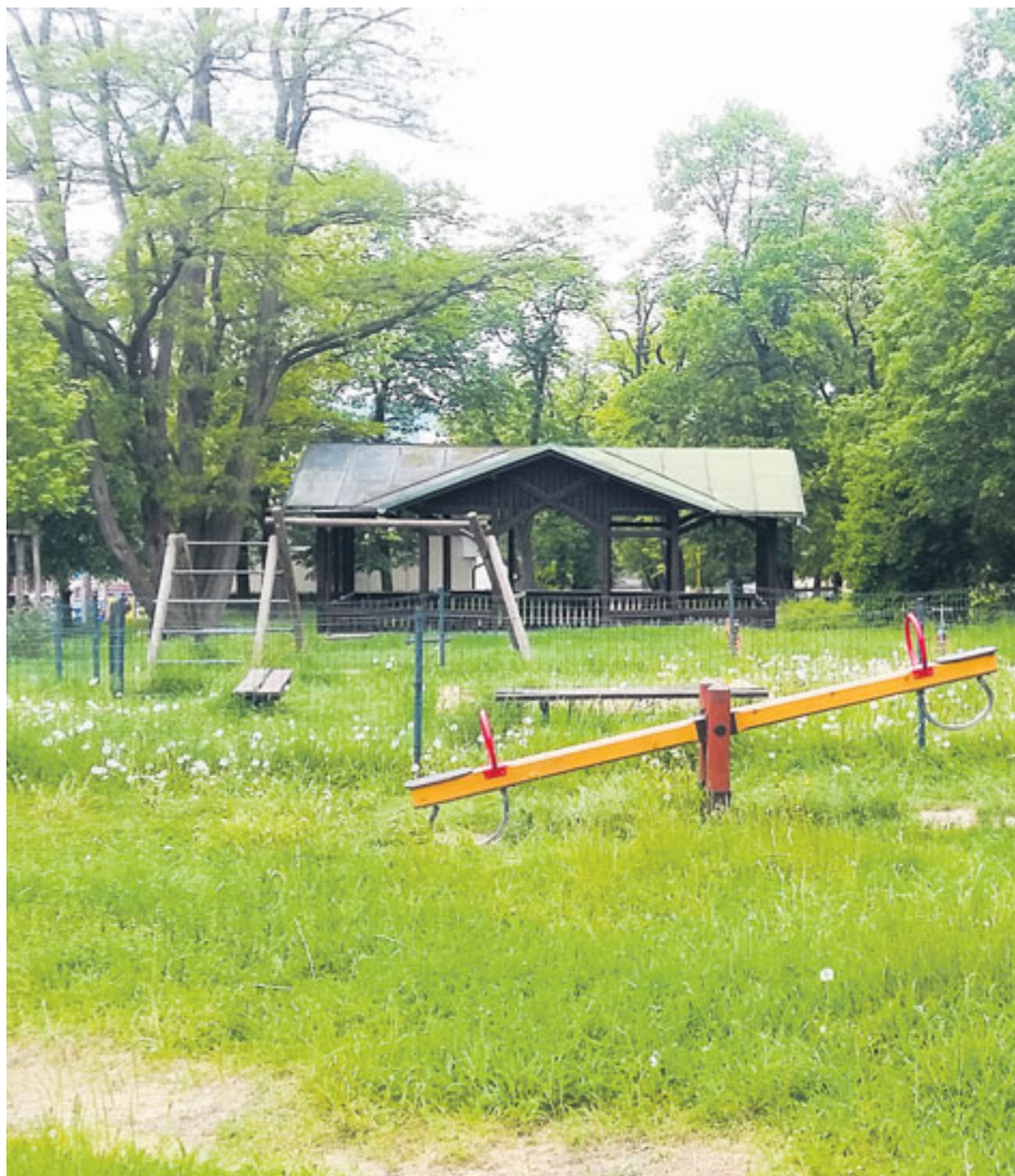
Participativní rozpočet se dobře hodí například pro financování obnovy dosluhujících dětských hřišť.

Od pondělí 1. června mohou občané dát své hlasy některému z deseti projektů, které bojují v rámci participativního rozpočtu Společně pro Příbram. K hlasování stačí mobil a přístup k internetu nebo zajít do městského infocentra.