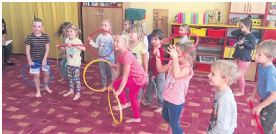
Mateřské školy zahájily provoz 11. května.

Hodnocením žáků ve druhém pololetí školního roku 2019/2020 se zabývá vyhláška MŠMT č. 211/2020 ze dne 24. dubna 2020. Hodnocení bude vycházet z podkladů získaných v době, kdy měli žáci povinnost docházet do škol, dále z podkladů získaných při vzdělávání na dálku a z hodnocení výsledků žáka za první pololetí školního roku 2019/2020.