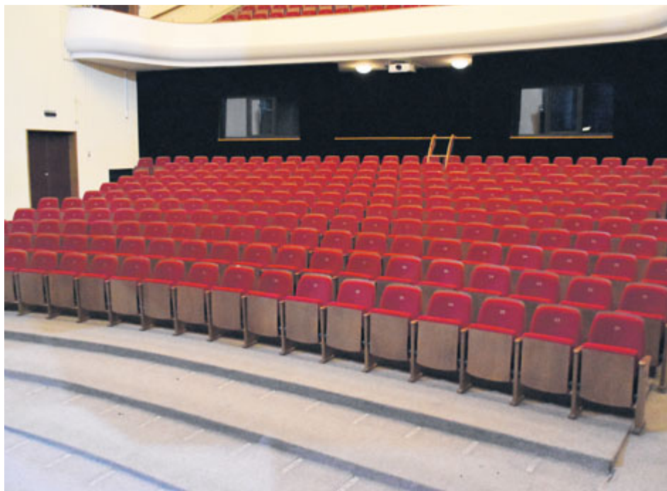
Řady nového hlediště se rozvolní, a sezení tak bude pohodlnější.

Příbramský kulturní dům oslavil v minulém roce své šedesátiny, je tedy nejvyšší čas k jeho obnově. Letos se dočkáme zcela nových sedadel na velké scéně divadla.