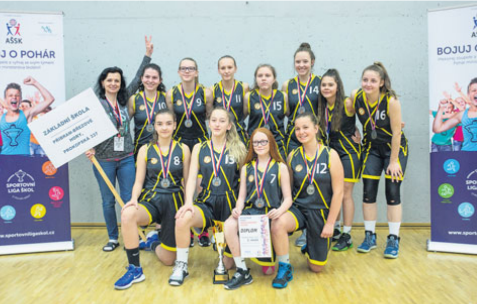
Po finálovém utkání se dostavily především pocity smutku, jelikož ten nej výsledek byl na dosah. Přesto je druhé místo velkým úspěchem.

Dívky ze ZŠ Příbram – Březové Hory vybojovaly vynikající umístění v republikovém finále Asociace školních sportovních klubů České republiky v basketbalu. Nakonec nestačily pouze na tým pražských basketbalistek.