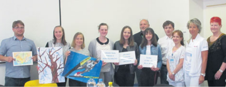
Spolupráce mezi ZŠ Jirákovy sady a příbramskou nemocnicí probíhá už několik let.

Žáci Základní školy v Jirákových sadech v Příbrami předali dětskému oddělení Oblastní nemocnice Příbram finanční dar. Zároveň nemocnici věnovali obrázky z výtvarného kroužku, které přispějí ke zkrášení prostoru nemocnice.