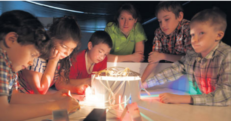
Zvědavé děti se dozvědí vědecké zajímavosti v rámci prezentace plzeňské Techmanie.

Již čtvrtým rokem patří příbramský červen Novému rybníku. I v letošním roce město připravilo lákavý program. Těšit se můžete na koncert Pražského výběru, rodinnou akci Novák Fest a Vítání slunovratu s Prague Queen.