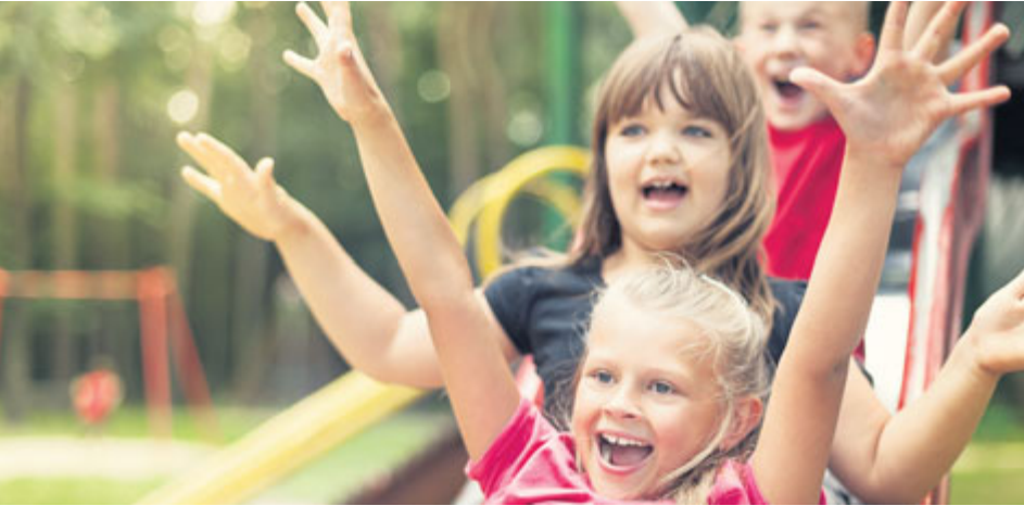
Den dětí, velmi dobrý důvod k oslavě.

Za deset korun se mohou děti 1. června přijít vykoupat, zabruslit si nebo třeba otestovat zbrusu nový adventure golf na Nováku, jehož slavnostní otevření proběhne právě v tento den v deset dopoledne.