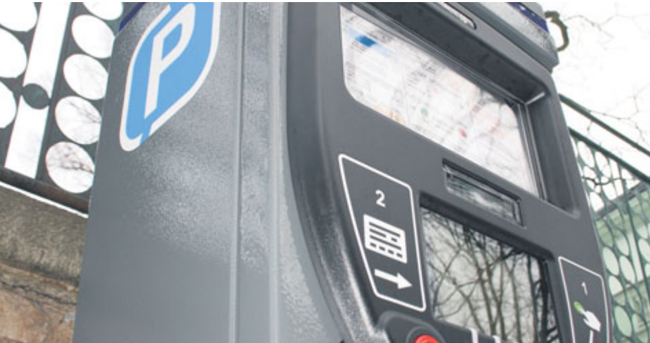
Parkovné v Příbrami lze platit pomocí klasických parkovacích automatů nebo také mobilní aplikace.

Zavedení parkovacích zón v Příbrami by mělo přispět k tomu, že parkování najde každý, kdo jej potřebuje. Cílem tohoto opatření je nastavit vyvážený poměr mezi parkováním rezidentů, krátkodobým odstavením vozu i parkováním občanů a mimopříbramských motoristů.