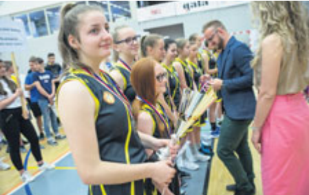
Skvělé druhé místo v republikovém finále

Náš boj o republikové finále Asociace školních sportovních klubů České republiky (AŠSK) v basketbalu začíná jednoznačným vítězstvím v okresním kole v prosinci 2018. Do krajského kola zbývaly tři měsíce. Tvrdá příprava probíhala na soustředění v Milevsku a účasti v soutěžích České basketbalové federace v Nadregionální lize (NRL) U-15. V soutěži se nám dařilo a posledním vítězným zápasem s Borotínem jsme si zajistili první místo v NRL. Krajské kolo AŠSK v basketbalu dívek pořádá Nymburk na konci března. Účastnilo se ho osm vítězů okresních kol. Také zde naše děvčata zúročila hodiny tvrdé práce a dosažené druhé místo jim zajistilo postup na kvalifikaci na republikové finále v Jindřichově Hradci.