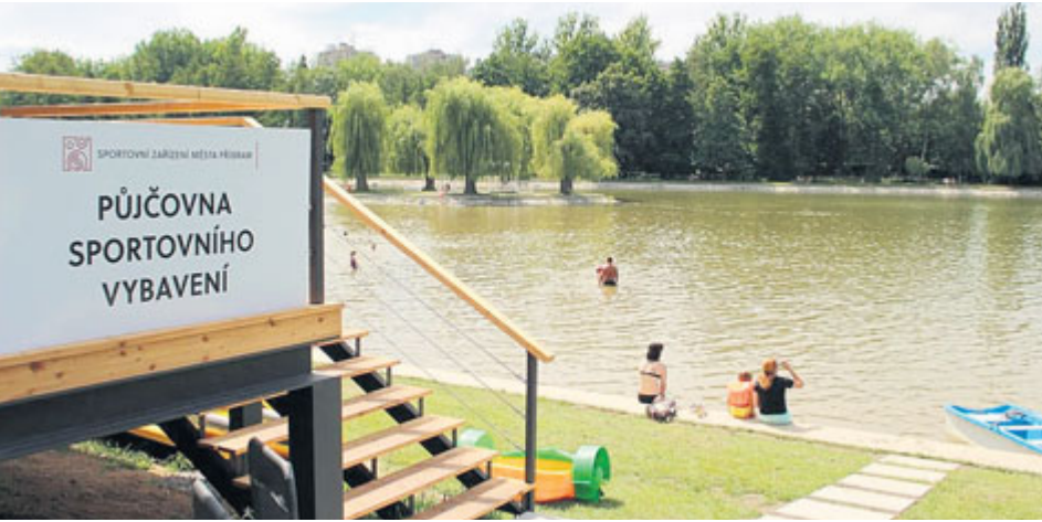
Atrakcí na Nováku stále přibývá, nyní to budou koloběžky.

Největším sportovištěm v Příbrami je areál Nový rybník, který v posledních letech se začínající sezonou nabízí vždy novou aktivitu pro sportovce.