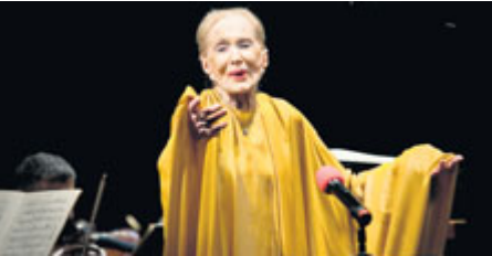
Slavnostní zahájení 51. ročníku Hudebního festivalu Antonína Dvořáka Příbram s hvězdným obsazením. Fenomenální Soňa Červená uchvátila všechny přítomné.