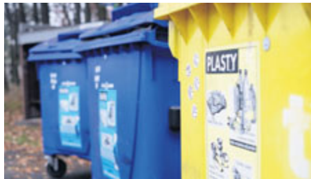
Třidíte odpad a soutěžíte.

Chystáte se během června třídit odpady do barevných kontejnerů v Příbrami? Pak můžete v unikátní hře Hledání Kontíků vyhrát některý z recyklovaných dárků nebo jednu z deseti hlavních cen. Cílem hry je pobavit nejen děti i dospělé, ale především podpořit třídění odpadů ve městě.