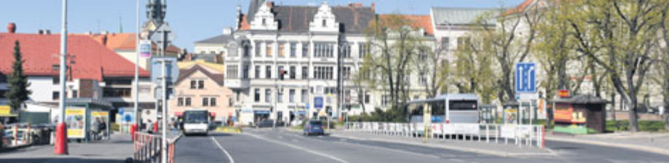
Jiráskovy sady jsou uzlem MHD v Příbrami, proto se zde objeví elektronická informační tabule.

S novou smlouvou o provozovateli příbramské městské hromadné dopravy přicházejí novinky, které se netýkají pouze avizovaných nových autobusů. Upravovat se bude i související infrastruktura, konkrétně autobusové zastávky.