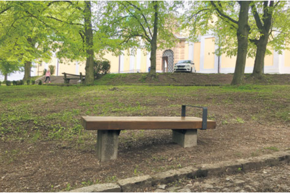
Nové lavičky na Svaté Hoře jsou už výsledkem loňského ročníku participativního rozpočtování.

Druhý ročník participativního rozpočtu míří do cílové rovinky. Sešlo se 19 námětů, které se od 1. do 21. června utkají o milion korun z městského rozpočtu. Ve výběru jsou čerstvé projekty i zajímavé návrhy z loňského roku. Hlasovat může každý, vše podstatné najdete na internetových stránkách spolecne.pribram.eu .