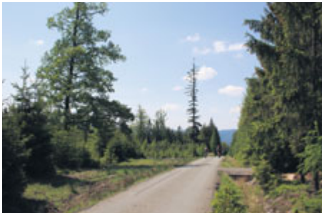
Lesní cesta Klášterka