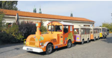
Pro vláček se nenašel provozovatel.

V květnu býval zahajován provoz městského turistického vláčku. Letos se jeho start přinejmenším odsunul, je však možné, že nebude jezdit celou sezonu. Hledá se totiž nový provozovatel.