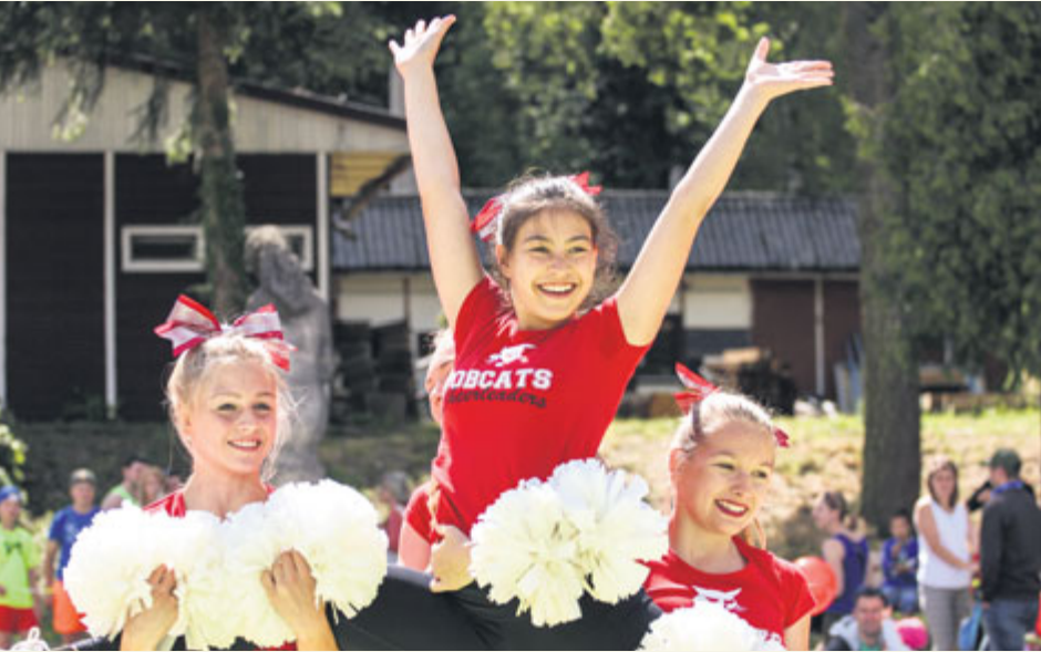
Ve sportovní zóně se představí také příbramské roztleskávačky.

Těšit se můžete na: fotbal s 1.FK Příbram a Spartakem Příbram, hokej s HC Příbram, cyklistiku s CK Příbram, volejbal s Volejbalovým klubem Příbram, fitness s Oxygenem Příbram, TJ Sokol Příbram, Bruslařský klub Příbram, Příbramské mažoretky, Potápěče Atol, box s Pan-kration Gym Příbram a taneční školu T.C.R.A.K. Příbram.