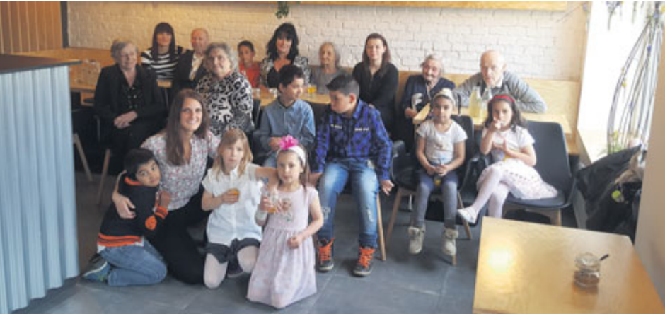
Společná výprava Majáku a Bedny do divadla a do cukrárny se vydařila.

V polovině dubna se uskutečnila další akce, kterou pro své klienty zorganizovali pracovníci Nízkoprahového zařízení pro děti a mládež Bedna a pracovníci Domova Maják.