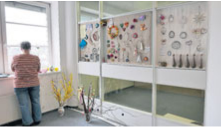
Výstava potrvá do konce června.

Kromě této činnosti jsme si vytvořily i program mimo pletení a scházíme se každé poslední úterý v měsíci na faře Církve československé husitské, která nám poskytuje prostory za účelem dalších aktivit. Tak např. máme za sebou korálkování, krajkování, decoupage, vánoční a velikonoční dekorace, zdobení perníčků, bubnování ke zdraví, zpracování exotického ovoce, výrobu papírových květů a mnohé jiné činnosti. Do některých akcí zapojujeme i svá vnoučata.