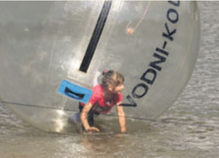
Adrenalinová zóna by se neobešla bez aquazorbingu

10.30–18.00: Hornická hra Stan pro děti a maminky Čtení pohádek Malování na obličej