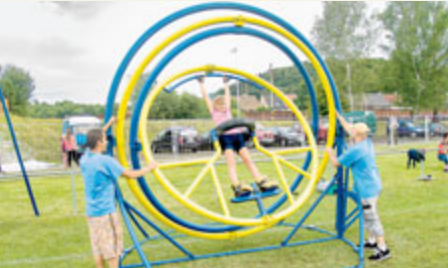
Aerotrim aneb Simulace stavu beztlíže

PROGRAM NA KAMENNÉM PÓDIU BĚHEM CELÉHO DNE Ukázka závodního aerobiku klubu Oxygen Vystoupení Příbram Bobcats Cheerleaders Představení Techmania Science Center Plzeň Vystoupení Mažorettek Příbram Vystoupení břišních tanečnic Sokol Příbram Ukázka závodního aerobiku klubu Oxygen Vystoupení Příbram Bobcats Cheerleaders Vědecké pokusy Vystoupení Mažorettek Příbram Aerobik pro všechny se Sokolem Příbram