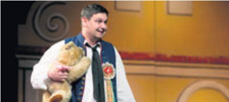
Představení pro děti příbramských ZŠ – Prodáváme nevěstu.