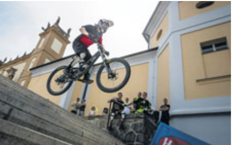
Závodníci se spustí ze Svaté Hory a adrenalinovou jízdu...

V sobotu 8. června letošního roku bude historické centrum města opět plné adrenalinu, skoků a závodních kol. Na vítězného jezdce čeká titul mistra České republiky.