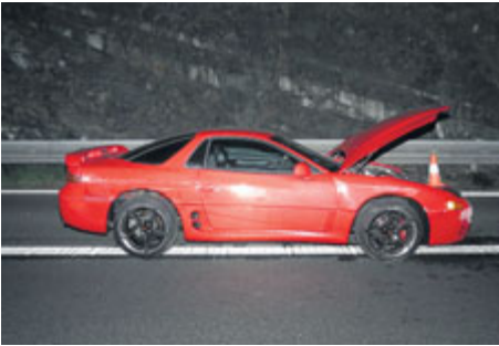
... a poté vyšetřování, které zastavilo D4.

Pátek 3. května po třetí hodině ranní. Projíždějící policejní hlídka v příbramské ulici Čs. armády chce zkontrolovat vozidlo značky Mitsubishi. Motorista nejdříve zastavuje, když však policista vystupuje ze služebního vozu, šlápne na plyn a snaží se zmizet. Takto začíná policejní honička.