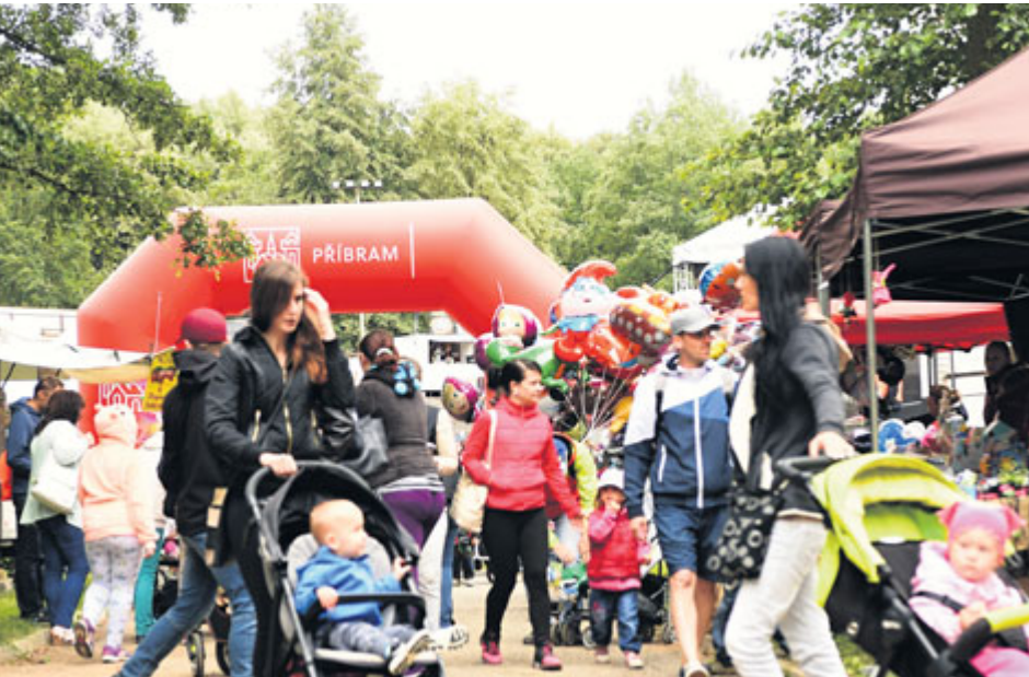
Bude na Nováku opět plno?