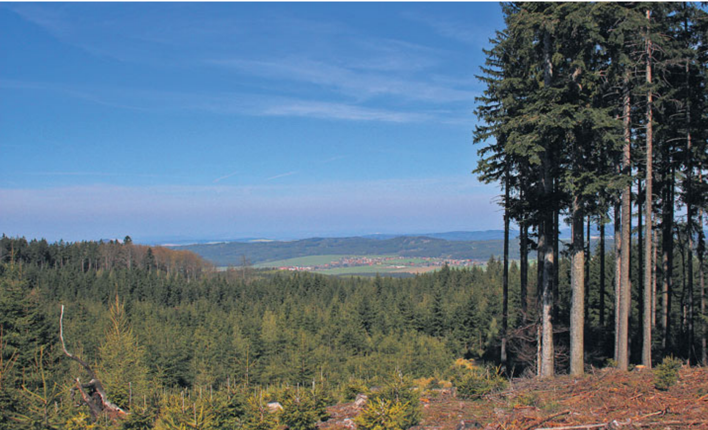
Asi 600 metrů jihozápadně od zalesněného vrcholu Hlavy nalezneme rozsáhlou mýtinu, která nám umožní pěkný pohled na Strašice.

Brdský vrchol Hlava byl prý místem, kde byl před téměř půlstoletím naposledy zaznamenán původní brdský tetřev. K návštěvě však láká nejen tento zajímavý vrchol, ale také bezprostřední okolí.