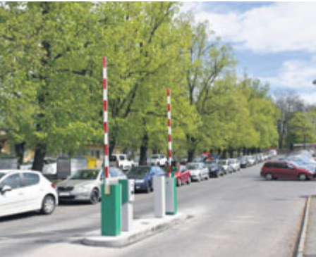
Motoristé platí 10 korun za první hodinu stání.

Na parkovištích v blízkosti nemocnice se nyní platí 10 korun za první hodinu stání, 20 korun za dalších 60 minut a 50 korun v případě celodenního parkování.