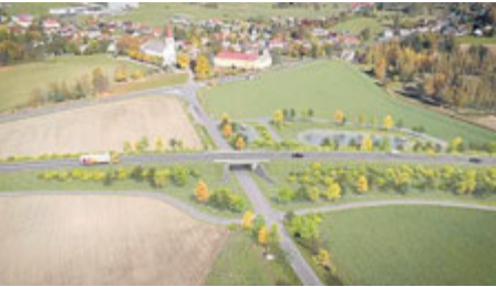
Vizualizace Jihovýchodního obchvatu.

Jihovýchodní obchvat Příbrami, který má vyřešit problémy s dopravou ve městě, se diskutuje dlouhé roky. Nyní nastává chvíle, kdy jsou známy termíny zahájení a ukončení výstavby obchvatu jako celku.