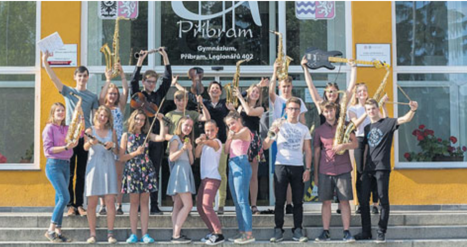
Dvacetičlenný orchestr hraje pop, jazz, filmovou hudbu i funk nebo jazz-rock.

GymBand založili studenti Gymnázia Příbram a poprvé vystoupili na školní kulturní akademii v roce 2009. I tyto události si orchestr připomene happeningovým koncertem.