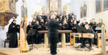
Český filharmonický sbor Brno nadchl publikum zaplněného kostela sv. Jakuba v Příbrami.