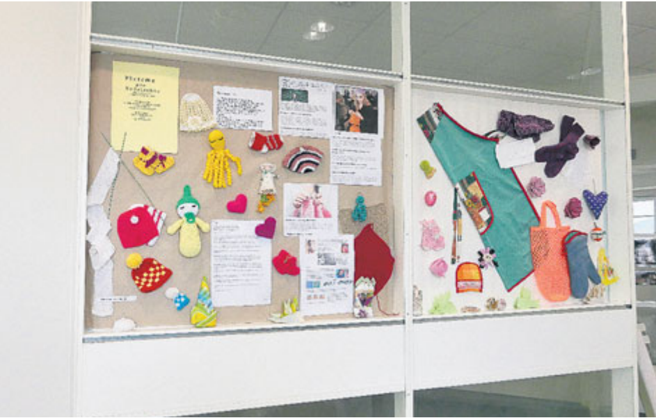
Obě organizace spojily síly a vystavují výsledky činnosti kurzů textilních technik.

V Domě Natura Příbram můžete navštívit společnou výstavu textilních technik kurzu Senior Pointu Příbram a ručních prací Tvořivé dílny Březové Hory.