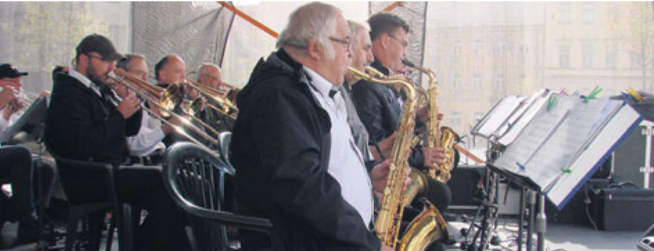
Příbramský Big Band uzavře letošní ročník Příbramského kulturního léta.

Tradice Příbramského kulturního léta opět pokračuje a tentokrát bude také součástí festivalů a velkých hudebních akcí. Letošní ročník zahájí koncert pod širým nebem hudební skupiny Pražský výběr.