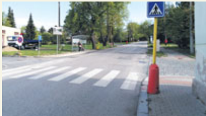
Rekonstrukce v Balbínově ulici je u konce.