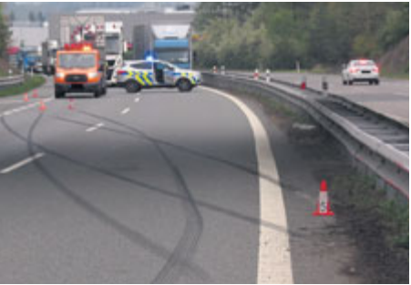
Nejdříve smyk a náraz do svodidel...

Na začátku května se odehrála dramatická honička v Příbrami a následně na dálnici D4 ve směru do Prahy. Pronásledované vozidlo nakonec havarovalo do svodidel nedaleko Voznice. Třicetiletý řidič měl uložen zákaz řízení motorového vozidla, a to až do příštího roku. Tento důvod jej pravděpodobně přiměl ke zběsilé jízdě s následnou havárií.