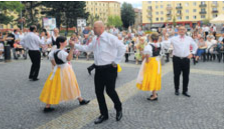
Nové centrum bude pořádat například Příbramské kulturní léto.

Příbram směřuje k tomu, že bude mít nové městské kulturní centrum. Jeho cílem bude zastřešit společenské, kulturní a částečně sportovní události a také koordinovat akce se soukromými subjekty.