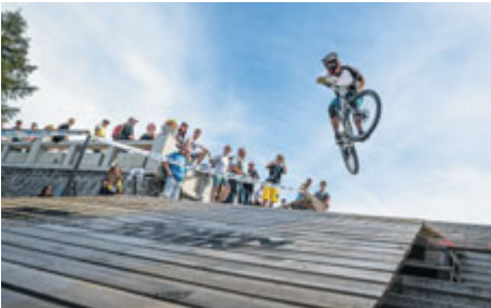
... zakončí na Václavském náměstí.

Už potřetí se ze Svaté Hory do centra Příbrami rozjede na 130 jezdců. Tradice Svatohorského Downtownu pokračuje 8. června a chystá se několik změn a novinek. Hlavní výzvou pro jezdce letošního ročníku je fakt, že jezdec, který bude mít nejrychlejší čas a splní podmínky mistrovského závodu, si odveze korunu pro mistra ČR v této disciplíně.