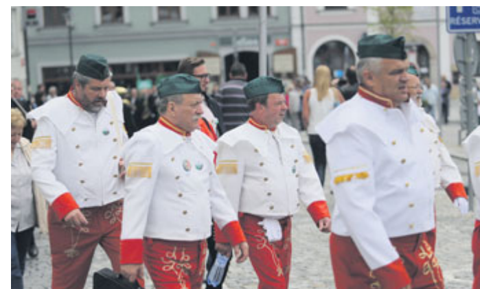
Průvod dorazil na náměstí T. G. Masaryka