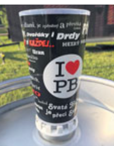
Kelímek 50 Kč