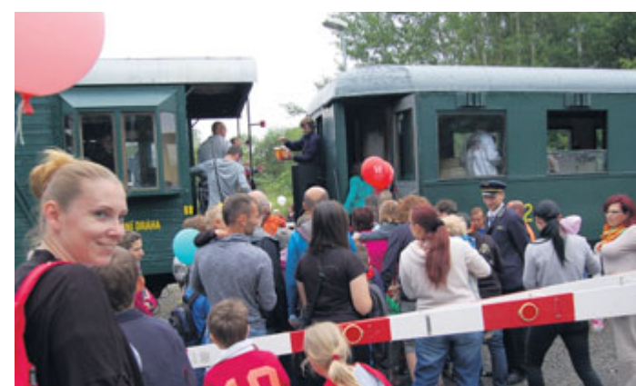
K oslavám se připojila i Rakovnicko-protivínská dráha