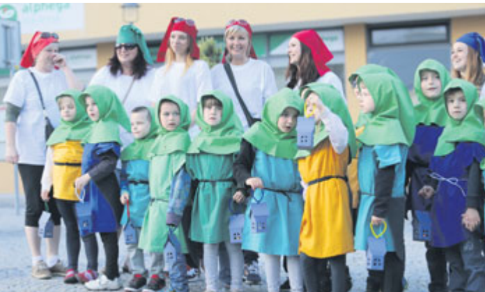
Průvod zdobili permoníci z příbramských škol a školek