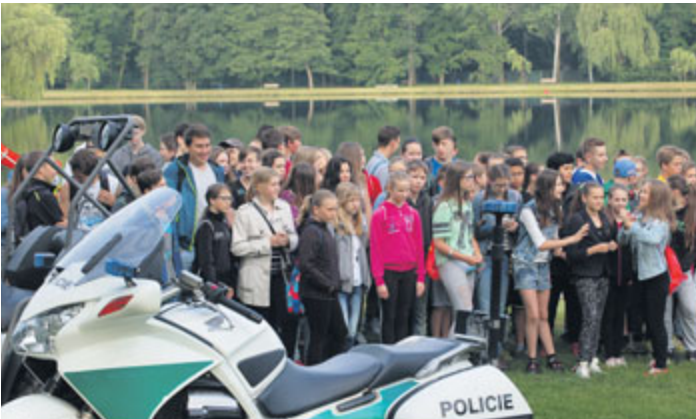
Nový rybník: Děti slaví 800