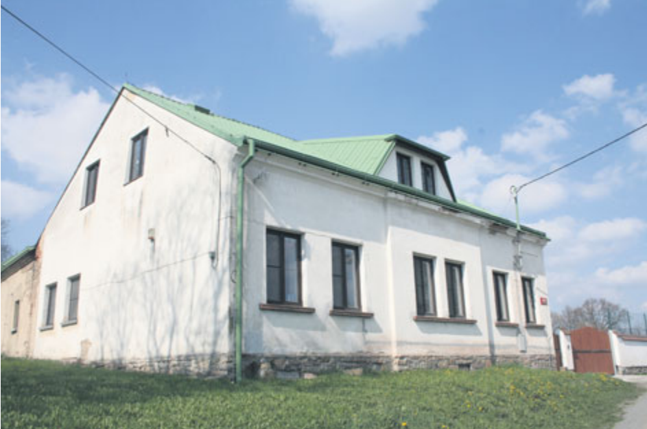
V domově žije málo dětí a cílenou snahou je navodit prostředí větší rodiny.