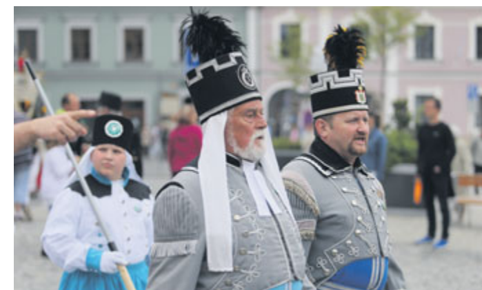
K vidění byly krásné uniformy