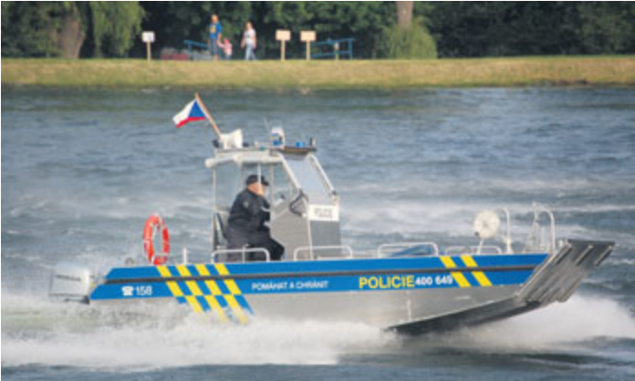
Dynamická ukázka práce Policie ČR