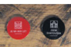
Odznak „Jsem svatoušek“ „Je mi 800 let“ 15 Kč