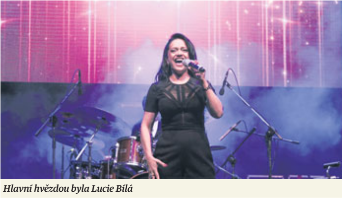
Hlavní hvězdou byla Lucie Bílá