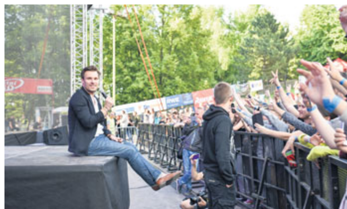
Showman Leoš Mareš