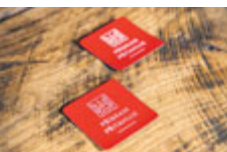
Magnetka „Příbram přitahuje“ 19 Kč