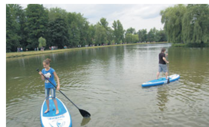
Paddleboarding v akci