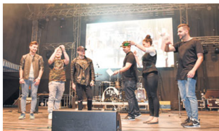
Členové kapely Atmo Music v Příbrami pokřtili nové CD