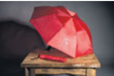
Deštník „Kape mi na karbid“ 99 Kč

V Informačním centru Městského úřadu Příbram v Zámečku-Ernestinu si můžete koupit propagační předměty, které vznikly při příležitosti oslav letošního 800. výročí města.