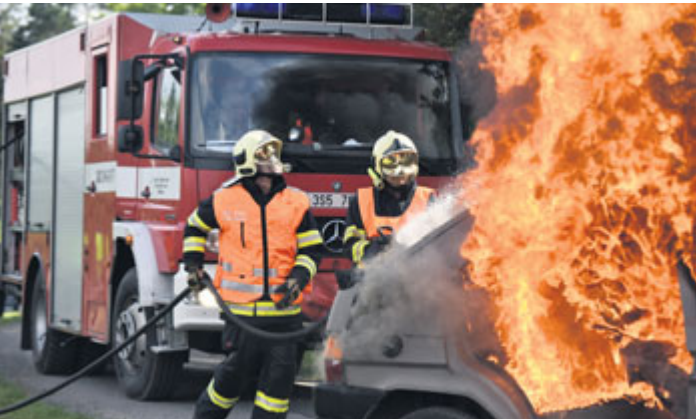
Ukázka zásahu hasičů