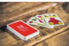
Karty „Příbram 800 let“ 59 Kč