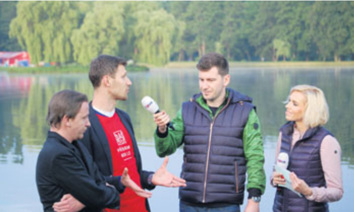
Oslavy odstartovala Snídaně s Novou z areálu Nového rybníka