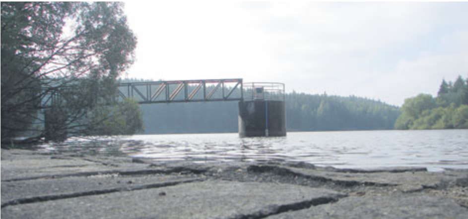
Vodní nádrž Drásov.

Vývoj dostupného množství vody ve vodních zdrojích v horizontu pěti až deseti let bude závislý zejména na charakteru počasí, jmenovitě pak na množství, intenzitě a rozložení srážek, neboť všechny hlavní zdroje využívají vodu povrchovou. Pokud se naplní scénáře předpokládaného dopadu klimatických změn na naši republiku, lze v budoucnu očekávat zvýšení nerovnoměrností ve výskytu srážek, tj. častější a delší sucha střídaná kratšími, ale o to intenzivnějšími dešti. Pro vodárenské nádrže v Brdech to bude znamenat vyšší kolísání hladin a potřebu většího využívání jejich akumulacího prostoru. Nelze zcela vyloučit, že v některých letech bude množství vody v nádržích omezené a bude třeba je oproti stávajícímu stavu více doplňovat odběrem vody z Vltavy. Předpokládat lze v této souvislosti také významné kolísání kvality vody v těchto nádržích. V případě Vltavy, jejíž tok je dostatečně regulován přehradami Vltavské kaskády, je i v dlouhodo-