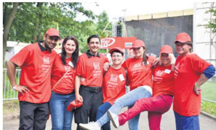
Bez dobrovolníků by to při oslavách nešlo