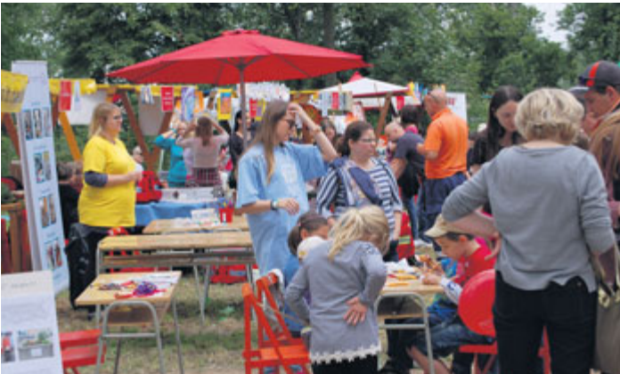
Městečko pod hrází