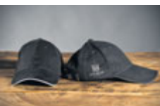
Kšiltovka „Je mi 800 let“ 89 Kč