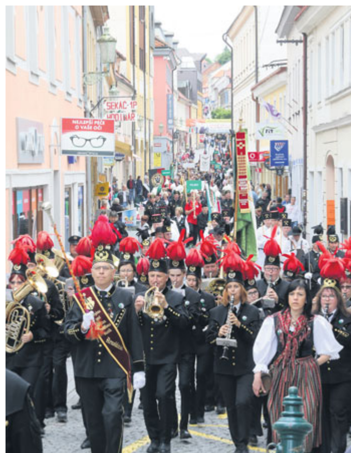
Sobotní hornická paráda