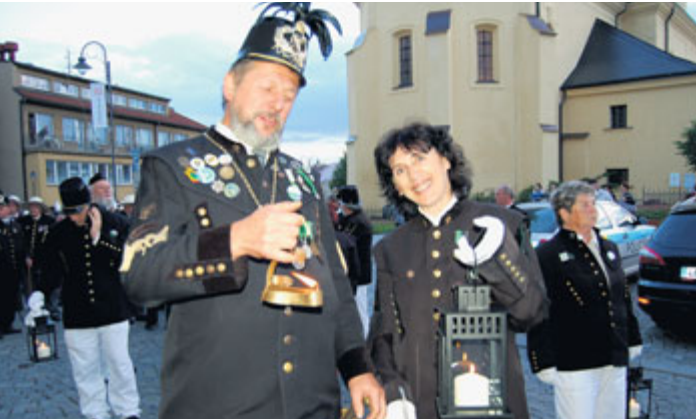
Perkmistr Cechu příbramských horníků a hutníků