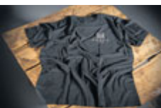
Tričko „Je mi 800 let“ 139 Kč