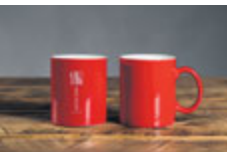
Hrnek „Až do dna!“ 69 Kč