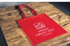
Látková taška „Unesu haldu věcí“ 59 Kč