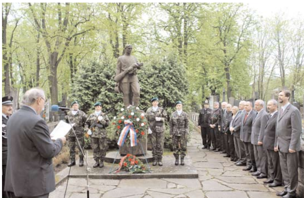
Město Příbram si připomnělo ukončení II. světové války v květnu 1945.