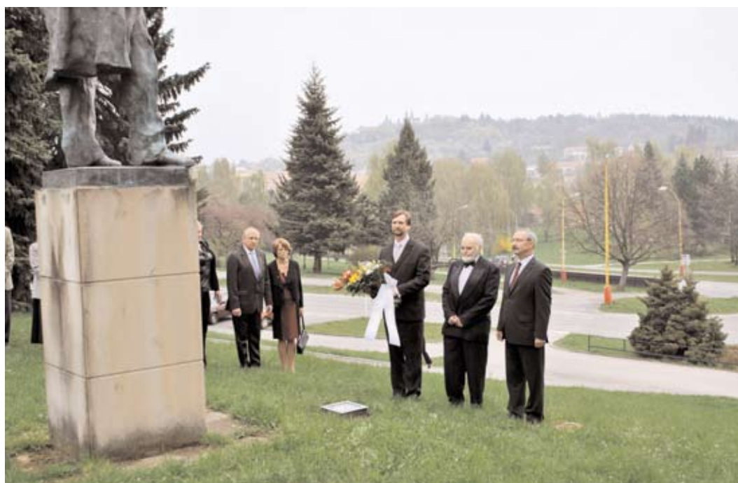
Hudební festival A. Dvořáka byl zahájen položením kytice k soše Antonína Dvořáka.