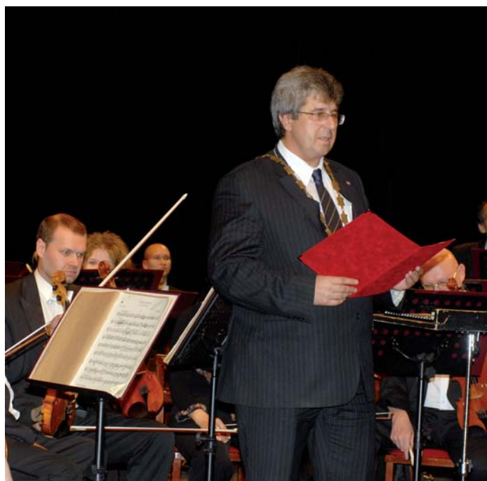
V květnu proběhl největší příbramský hudební svátek - Hudební festival A. Dvořáka. Na snímku je starosta při jeho zahájení. Po slavnostním úvodu zahrála houslistka G. Demeterová.