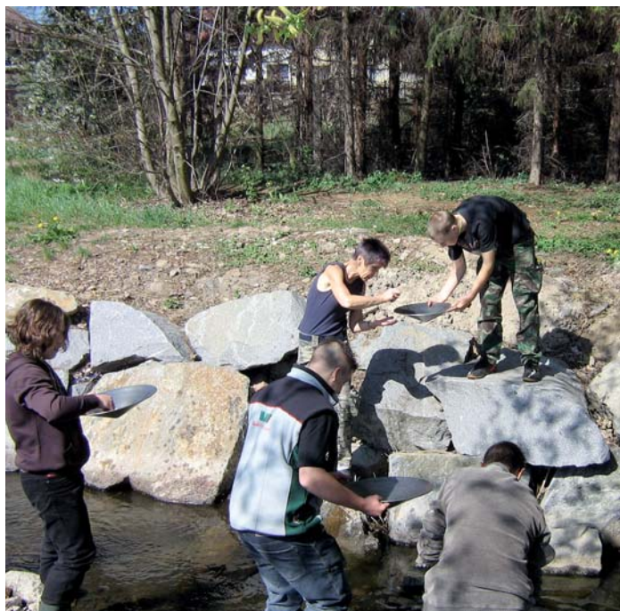
Žáci 3. základní školy Březové Hory si na vlastní kůži vyzkoušeli rýžování zlata. V akci jim pomáhalo Hornické muzeum Příbram.