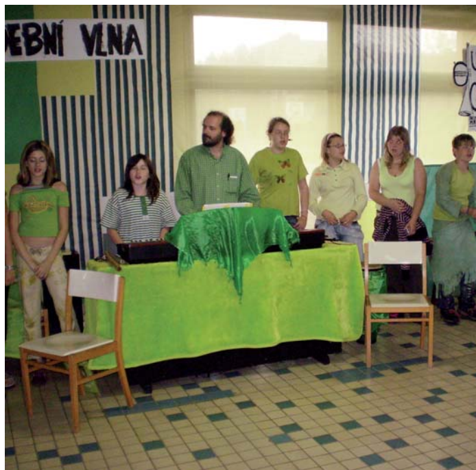
Uvnitř listu se můžete dočíst o tom, jak se 7. základní škola proměnila v Ekoškolu.