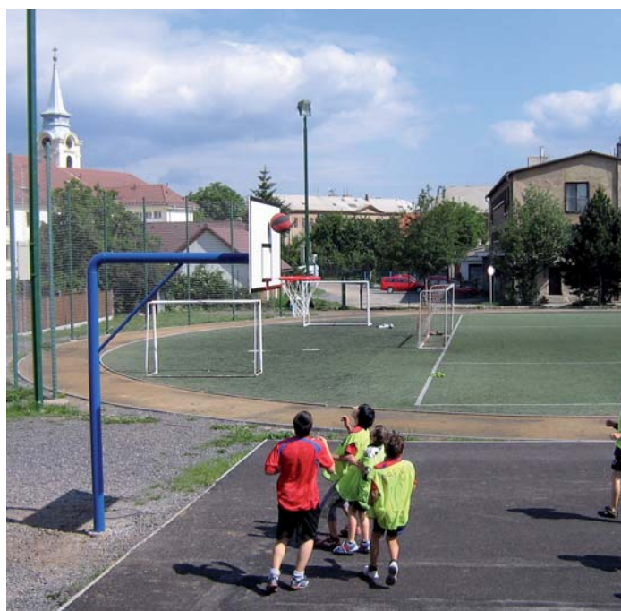
3. základní škola Březové Hory zrekonstruovala díky příspěvku z kraje a města své školní hřiště.