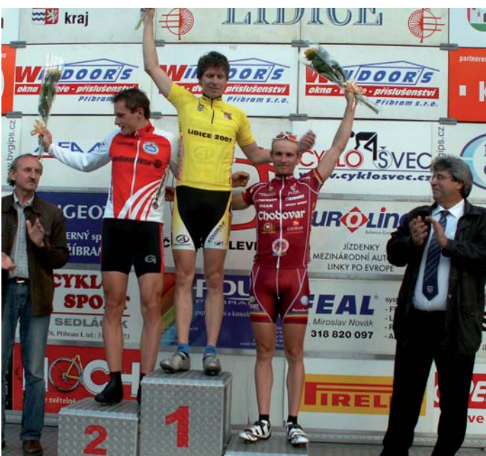
Ve středu 30. 5. se v Příbrami konal cyklistický závod. V kategorii juniorů vyhráli dva mladí Příbramáci.