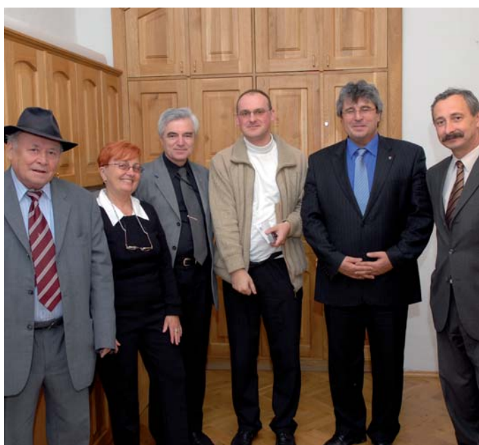
Koncem května se sešel Nadační fond Svaté Hory. Jednání se zúčastnil i starosta města.