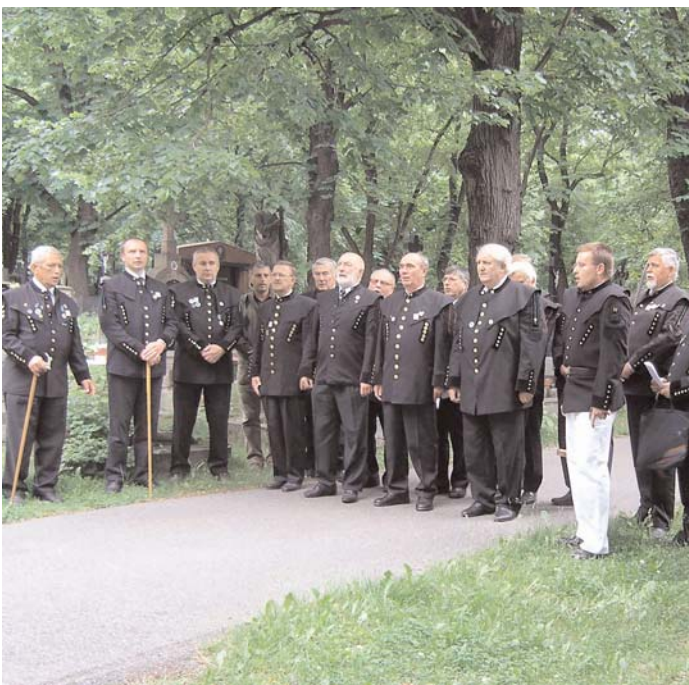
V sobotu 2. června si Příbram připomněla výročí březohorské důlní katastrofy. Díky Cechu příbramských horníků a hutníků neupadají hornické tradice v zapomnění.