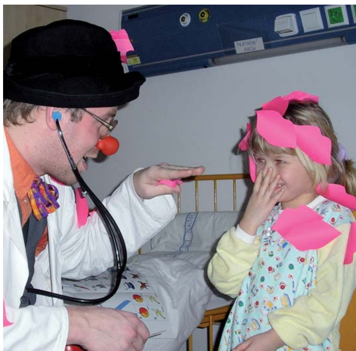
Zdravotní klauni pravidelně navštěvují dětské pacienty a zpřjemňují jim pobyt v nemocnici. V té naší byli již několikrát.