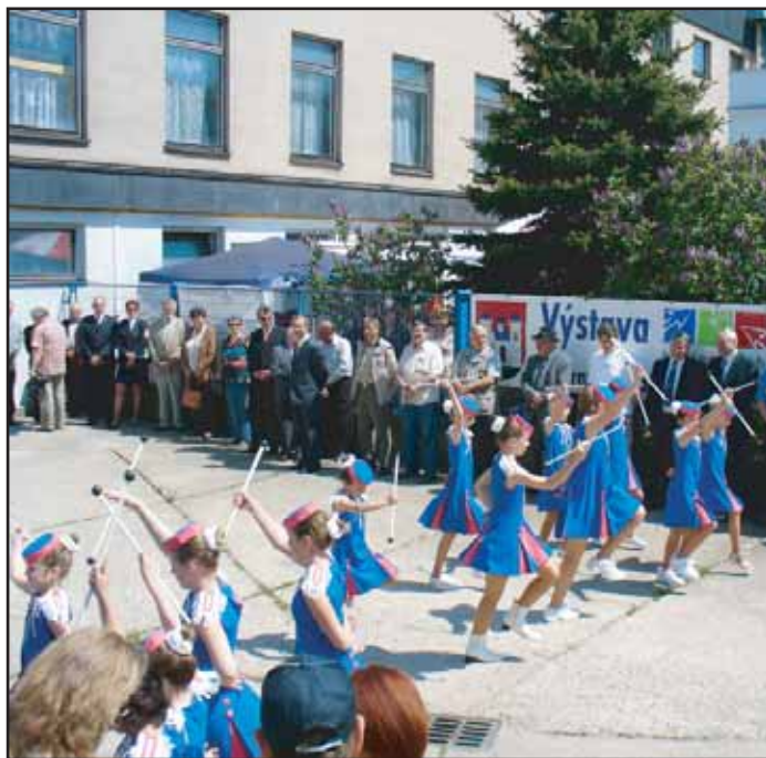
Na slavnostním otevření výstavy Příbram 2006 - bydlení, hobby, zahrada, volný čas vystoupily také malé mažoretky.