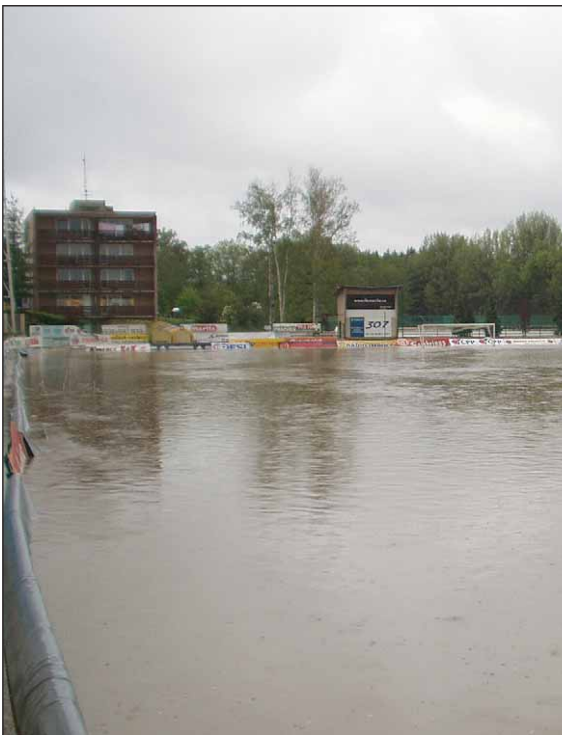
Příbramský stadion Na Litavce byl zasažen květnovou povodní. Na snímku vidíte krizovou situaci.