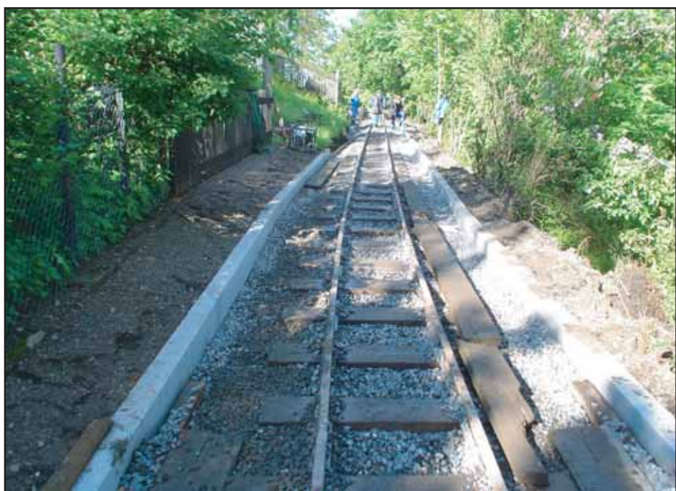
V ulici Pod Struhami byla zahájena stavba Hornického vláčku - Březové Hory. Tento projekt je spolufinancován Evropskou unií (grantový program na podporu rozvoje místní infrastruktury cestovního ruchu - SROP), více na www.pribram-city.cz .