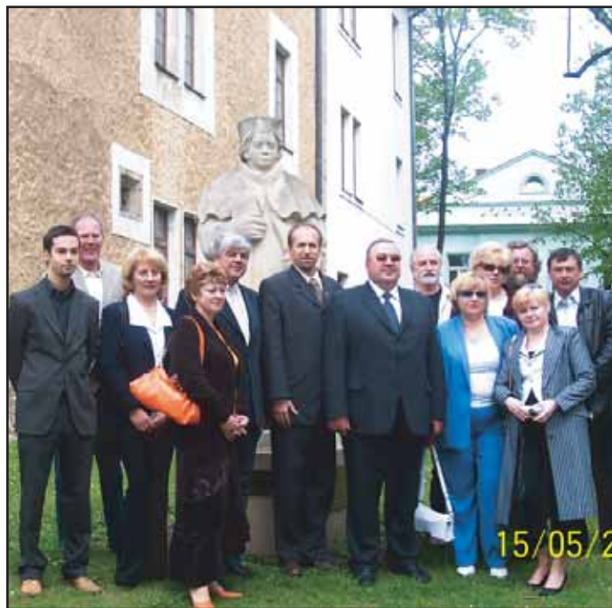
V květnu pozvalo město Příbram na návštěvu všechna svoje partnerská města. Účast přijala města Čechov, Freiberg, Kežmarok.