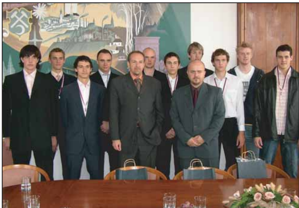
Dne 31. května přijal starosta na radnici juniory z Volejbalového oddílu Příbram.