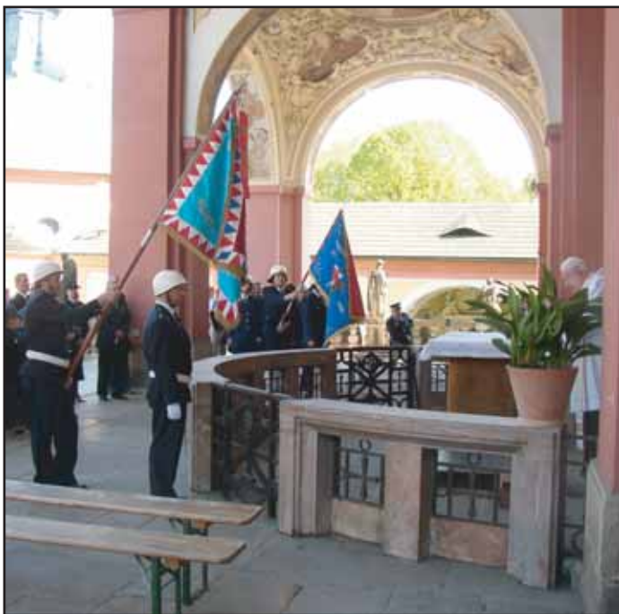
Hasiči ze Sboru dobrovolných hasičů Příbram I si nechali dne 12. 5. 2006 na Svaté Hoře posvětit nový prapor.