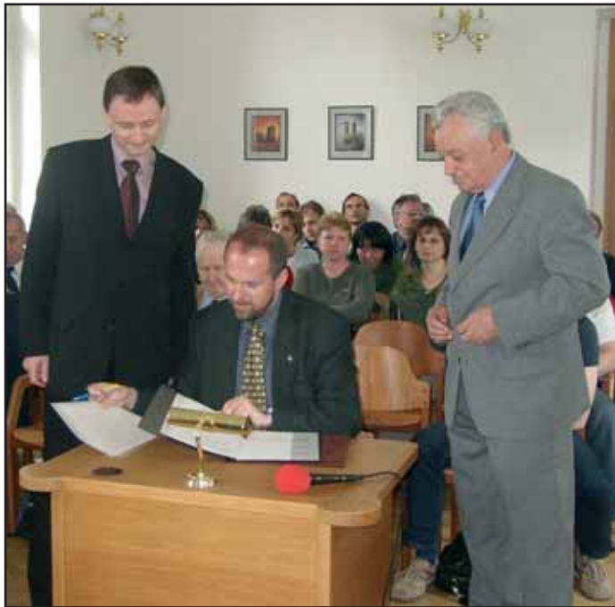
Na jednání zastupitelstva bylo podepsáno memorandum o VŠ.