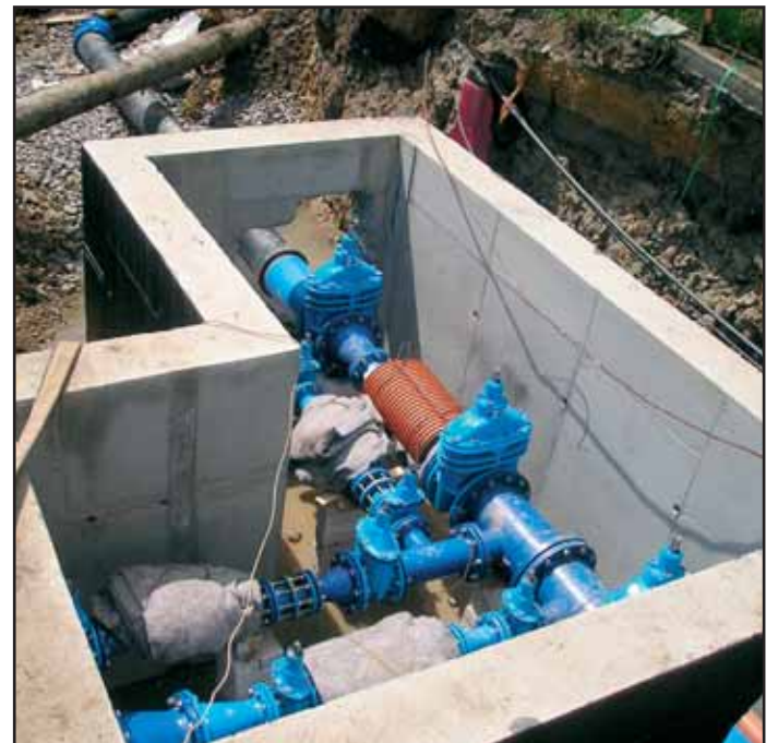
Při rekonstrukci Husovy ulice byly vybudovány nové šachty - tato armaturní šachta v křižovatce s ulicí prof. Pobudy slouží jako předávací a měřicí místo pitné vody pro město Příbram.