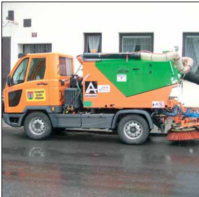
K zametání chodníků slouží nová zametací nástavba Fumo – Multikar z Itálie, která stála 1 milion korun a nahradila původní zařízení staré sedm let. Již je v provozu.