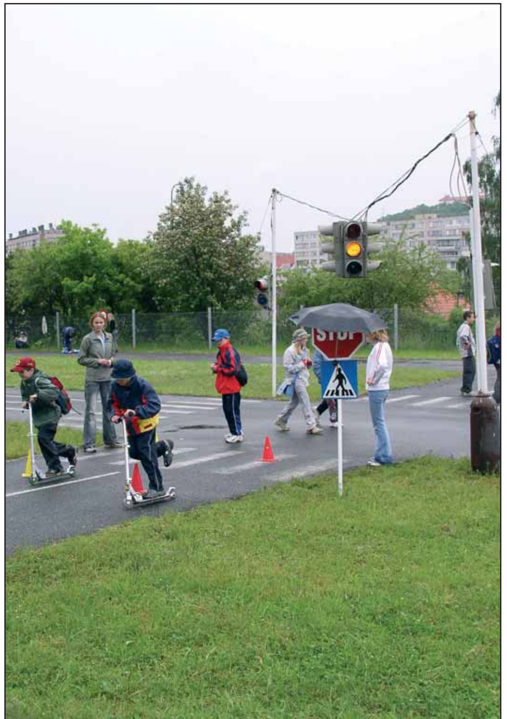
V úterý 1. června bylo slavnostně otevřeno zrekonstruované dětské dopravní hřiště. Provozovatelem je Autoklub Příbram v AČR.