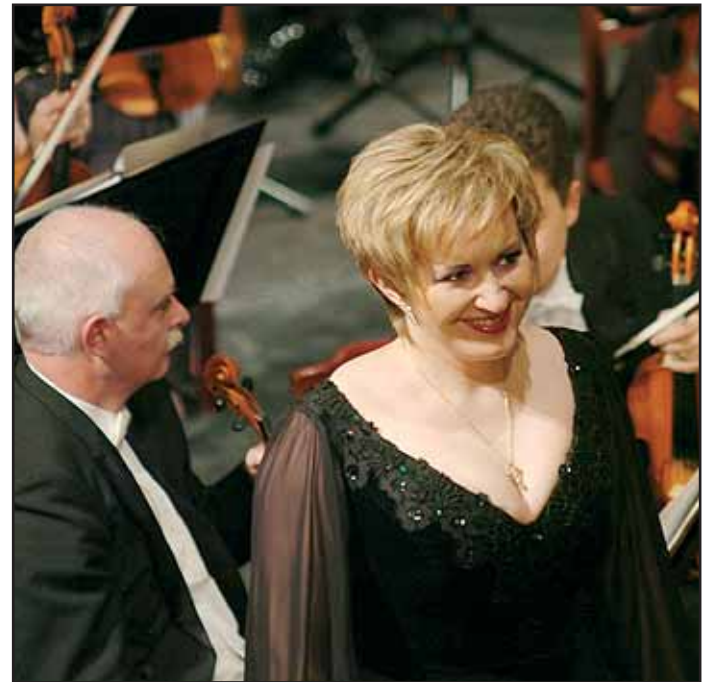
Koncert Evy Urbanové byl nádherným kulturním zážitkem.