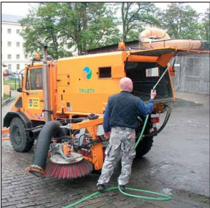
Novou zametací nástavbu Unimoc v hodnotě 2 milionů Kč koupily Technické služby Příbram. Stroj určený k zametání komunikací je v provozu od minulého týdne a nahradil Avii starou devět let.