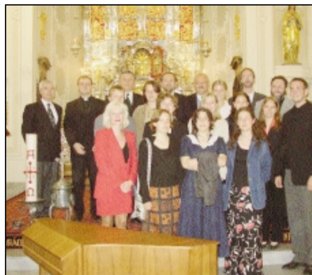
27. 5. přijeli hosté z německého Altöttingu.