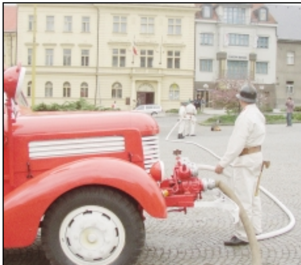
3. 5. se slavil svatý Florián, patron hasičů.