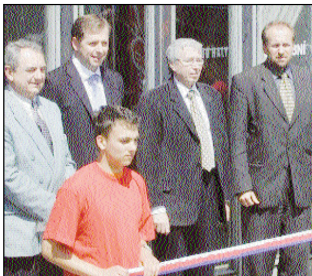
16. 5. byla zahájena Živnostenská výstava.