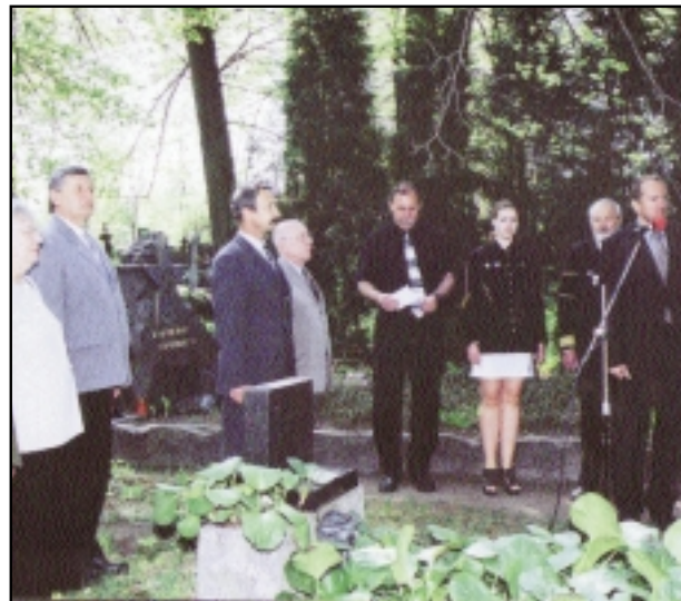
7. 5. Oslava Dne osvobození od fašismu.