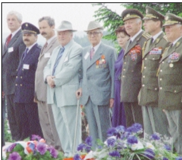
10. 5. Zahájení rekonstrukce bitvy na Slivici.