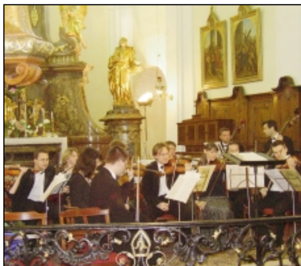
25. 5. byl koncert Pražské komorní filharmonie.