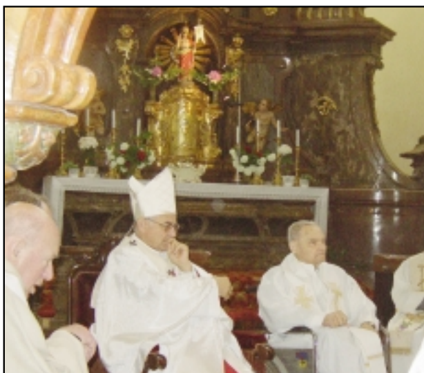
Kardinál Miloslav Vlk sloužil slavnostní mši.