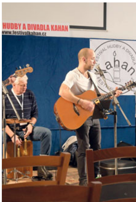
Z minulých ročníků festivalu Kahan