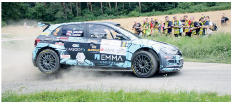
Pokud příbramskou rally letos nezastaví nedostatek financí nebo jiná hrozba, měla by se uskutečnit na konci července.

Organizátor uvádí, že celkové náklady závodu činí bezmála tři miliony korun a původně po Příbrami požadoval částku ve výši 400 000 korun.