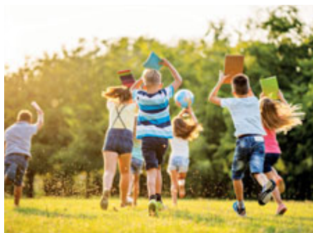
Ilustrační foto: All Stars School

Nabídka příbramských škol a školek se rozšíří o All Stars School, která je koncipována jako soukromá a vícejazyčná vzdělávací instituce. Pro svůj akademický program si kromě českého také vybrala mezinárodní školní curriculum International early years curriculum (IEYC), které se inspiruje britským rámcovým programem EYFS.