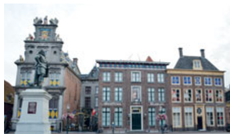
Západofríské muzeum s 30 000 exponáty

Založení Hoornu je opředen mnoha pověstmi a legendami. Podle jedné ze starých fríských legend se název města Hoorn odvozuje od krále Radboda, který osadu na břehu zálivu pojmenoval Hornus. Jiná legenda vypráví, že jméno