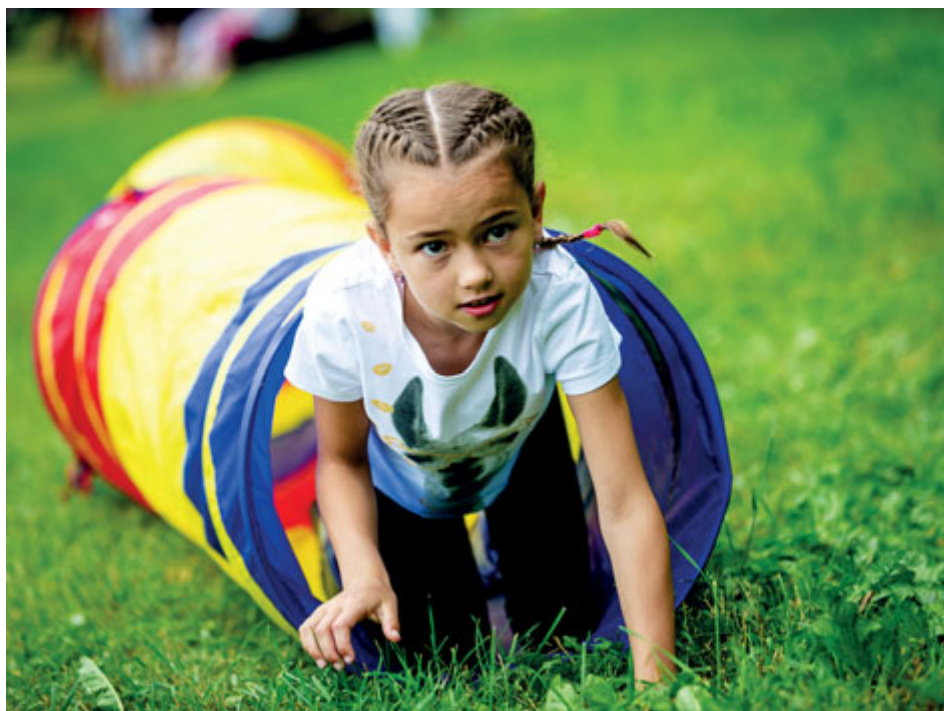
Na Novák Festu si děti vyzkoušejí nejrůznější pohybové aktivity.

Minulý rok si Novák Fest dal nedobrovolnou pauzu, nebo spíše byl postaven do ofsajdu. Nyní je zpět a všichni věří, že v neděli 20. června opět pobaví a rozhybe stovky dětí a rodin. Letošní téma Novák Festu zní Příbram pod pěti kruhy. Bude se sportovat a jako odměnu za výkony si děti odnesou medaile. Ve znamení sportu, a také kultury se však ponese celý víkend 18. až 20. června.