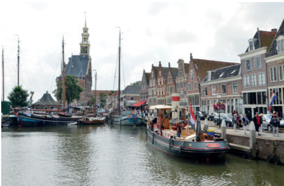
Přístav a za ním velká obranná věž ze 16. století zvaná Hoofdtoren

Hoorn je nejen příjemným místem k životu, ale také rájem pro turisty. Čas lze strávit návštěvou historického centra, místních muzeí či jen tak procházkou historickými uličkami jako vystříženými z obrazů slavných holandských mistrů. Jistě stojí za to navštívit místní restaurace a ochutnat typická holandská jídla či jen