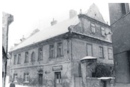
Severní štít v lednu 1968. Nad dveřmi uprostřed východní stěny byl výklenek s freskovou malbou Panny Marie s Ježíškem.