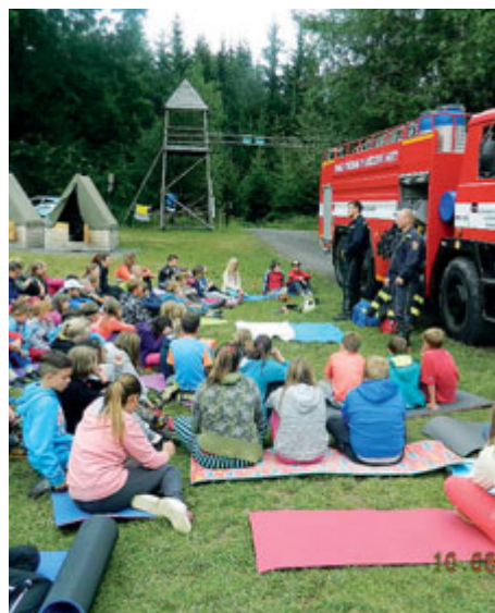
Přednáška pro děti a mládež o prevenci požárů

Zabezpečení proti neoprávněnému vstupu nabylo na významu po tragickém útoku ve Žďáru nad Sázavou v roce 2014, kdy se zabezpečení škol a školek začalo řešit na národní úrovni. Od této doby město jako zřizovatel udělalo kus prá-