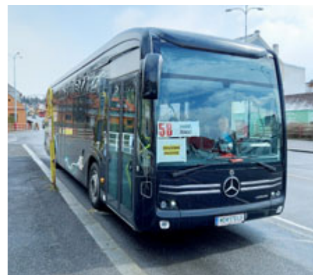
Elektrobus v příbramské MHD.

S podpisem nové desetileté smlouvy se společností Arriva, která vešla v platnost v prosinci roku 2019, se příbramský vozový park kompletně obnovil. Aktuálně MHD v Příbrami zajišťuje dvacet autobusů, z toho čtrnáct nových. Stávající vozy splňují normu Euro 6, tedy aktuálně (chystá se zavedení Euro 7) nej-