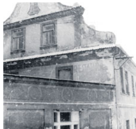
Jižní štít domu č. p. 82 v lednu 1968