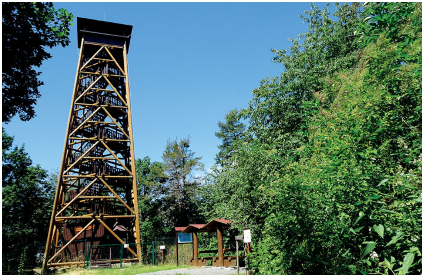
Drtinova rozhledna má 109 schodů.

Na vrcholu Besedná (496 m), asi 3 km vzdušnou čarou západně od Živohoště na levém břehu Vltavy, byla v roce 1926 otevřena Drtinova rozhledna, a to původně ve tvaru husitské hlásky. Díky úsilí obce Chotilsko a místních spolků se podařilo na základech původní již porušené stavby v roce 2014 vybudovat rozhlednu novou, jejímž konstrukčním základem jsou nerezovými prvky spojené dřevěné vazníky. Na zastřešenou vyhlídkovou plošinu ve výšce 21 m se dostanete po 109 pohodlných schodech.