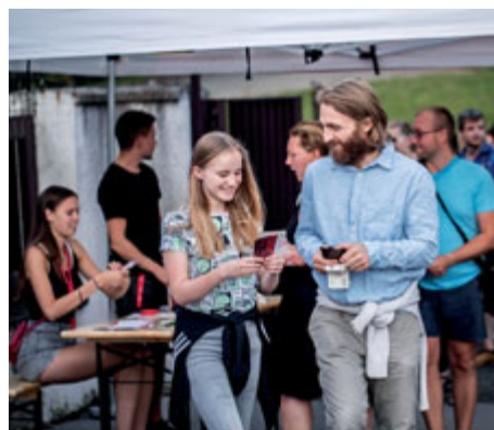
Bavit se až do jedenácté.

V letních měsících bude prodloužena doba, kdy začíná noční klid. Bude se to týkat pátků a sobot, kdy noční klid začne až jedenáctou hodinou večerní.