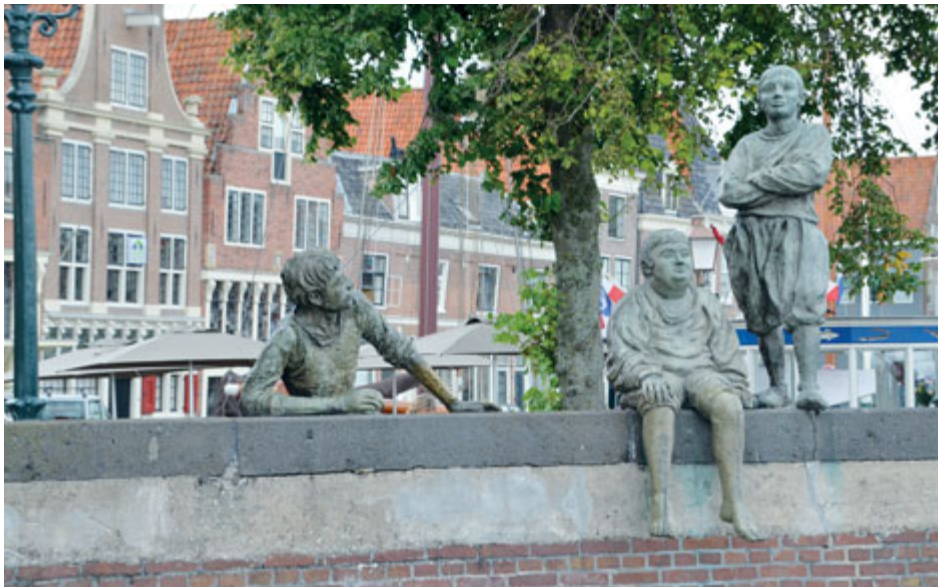
Plavčíci kapitána Bontekoea (1924, De scheepsjongens van Bontekoe ) je dobrodružný román od spisovatele Johana Fabricia. Popisuje dobrodružství chlapců, kteří se zúčastnili plavby lodi Nový Hoorn do Indie pod vedením kapitána Willema Ysbrandtsoona Bontekoea (1587-1657). Ve starém přístavu v Hoornu příběh připomíná toto sousoší.

vila samosprávná oblast Severní Holandsko, jejím hlavním městem se stal Haarlem, nikoli Hoorn, byť historicky byl přirozeným centrem regionu.