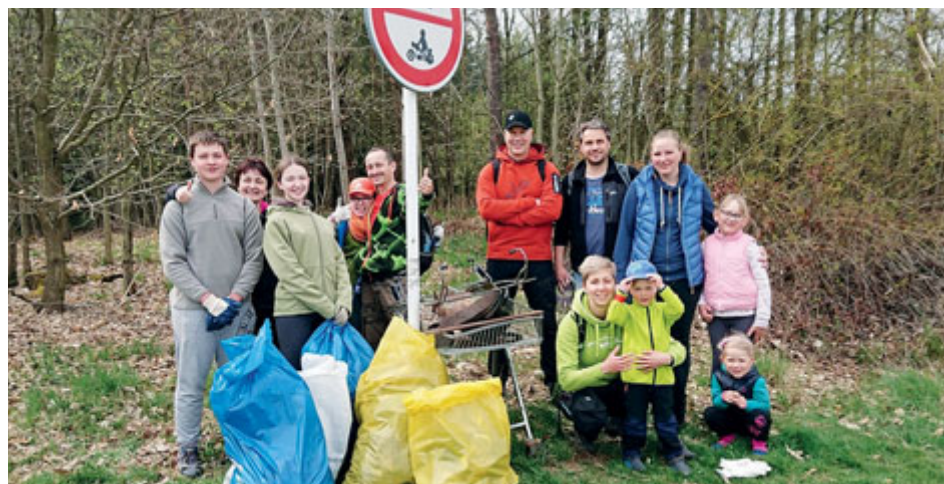
Uklídme Zdaboř - akce pro všechny generace.