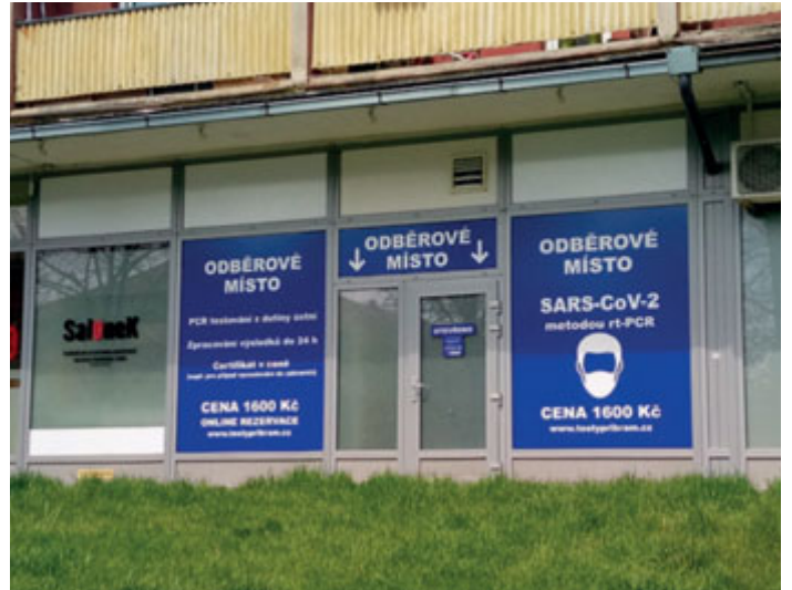
... a v ulici Politických vězňů.