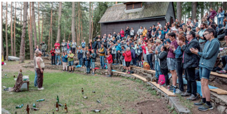
Kdy se opět vrátí ovace vestoje?

Kultura je droga. Takto bychom mohli parafrázovat vyjádření jednoho umělce v následujícím článku. Při dlouhém nedostatku živé kultury vlivem nekončících restrikcí se dostávají silné abstinenční účinky. To, zda se po opětovném „otevření“ dostaví – zůstaneme-li u adiktologického pojmosloví – dlouhotrvající rauš, kdy lidé budou bažit po kulturních aktivitách, nebo zda bude abstinence pokračovat, dnes s jistotou neřekne nikdo. Jednotliví umělci tak podle vlastního naturelu (a možná i „svého“ uměleckého stylu) propadají spíše optimismu, nebo spíše pesimismu.