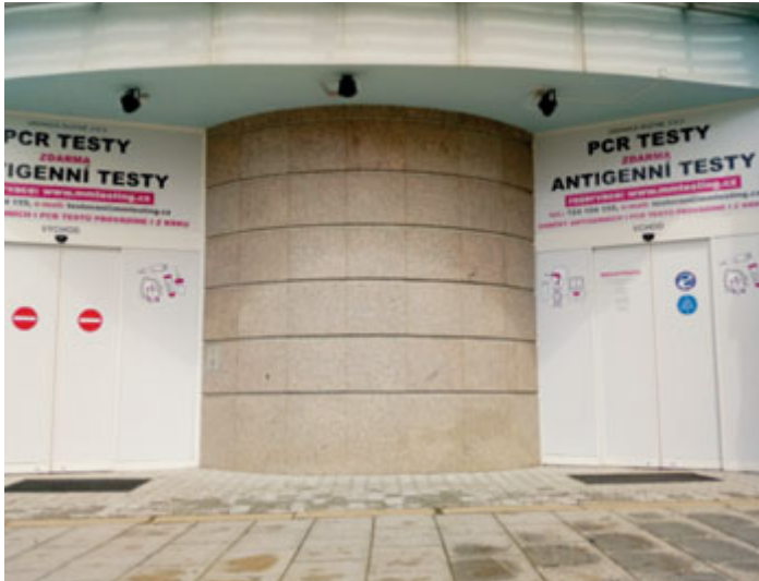
Nové odběrové pracoviště na náměstí T. G. Masaryka...

Protiepidemická opatření vyžadují soustavné testování na covid-19. To se masivně rozeběhlo na začátku roku a postupně přibývají další testovací centra. Kromě firem a škol lze v Příbrami absolvovat odběr na celkem čtyřech místech.