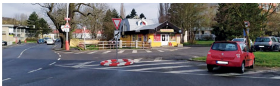
Most na Rynečku je třeba vyparkovat.

Na území města najdeme na čtyři desítky mostů a lávek. Všechny prošly prohlídkami, při kterých byl posuzován jejich aktuální technický stav. Špatný stav byl zaznamenán na Rynečku, kde je podle technické zprávy nejpozději do pěti let potřeba vybudovat most nový.