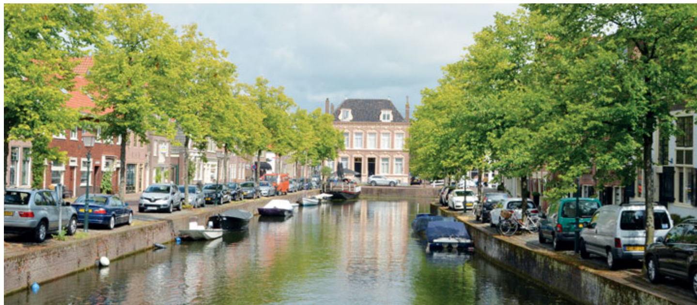
Hoornský kanál a ulice nazývané Appelhaven.

Dne 21. dubna 1992 byl v Hoornu založen Výbor pro spolupráci Hoorn – Příbram, organizace, která od počátku své existence pomáhá navazovat a udržovat kontakty mezi Hoornem a Příbramí a podporuje společné projekty.