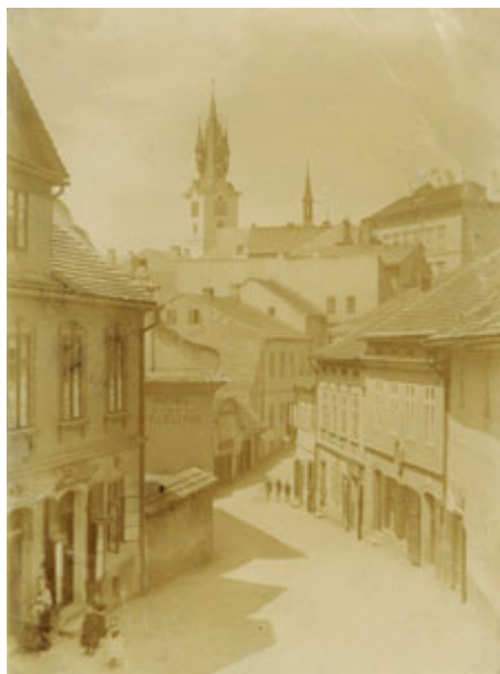
Barokní hostinec č. p. 82 v dnešní ulici V Brance na snímku z roku 1902.