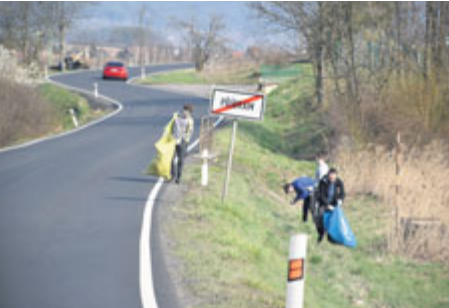
Díky pilným účastníkům úklidu...

Odborným termínem se tomu říká littering, poněkud lidovější výraz zní „bordel“. Odhozených odpadků bývá podél silnic nebo v okolní přírodě poměrně dost. A jaro je příležitostí pro generální úklid.