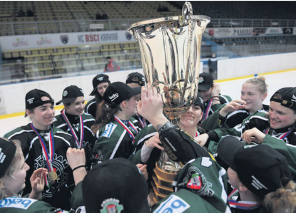
Příbramský ženský hokej opět osvědčil své kvality.

Tým žen HC Příbram má za sebou úspěšnou premiérovou sezonu v extralize žen, kde z dvaceti utkání jich osmnáct vyhrál a jen dvě prohrál. Cíl pro budoucí sezonu je jasný: obhájit titul.