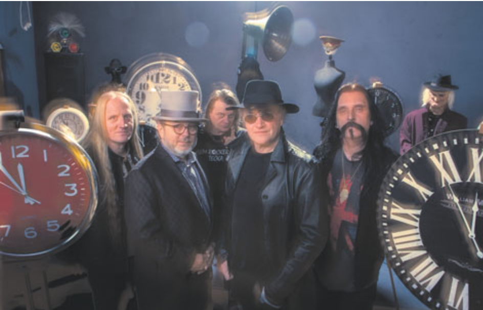
Vstupenky na legendární Pražský výběr jsou už v předprodeji.

Příbram se chystá na události, které v červnu rozproudí kulturní i sportovní život ve městě. Vedle akcí Svatohorský Downtown a Příbramský půlmaraton se veřejnost může těšit na koncert Pražského výběru, Novák Fest a Vítání slunovratu.