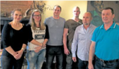
Strážníci byli oceněni za svůj postup při nedávném přepadení banky v centru Příbrami.

Práce strážníků Městské policie Příbram se skládá z mnoha činností. Jejich hlavním cílem je dohlížení nad pořádkem v ulicích. Mimo své běžné činnosti strážníci také pravidelně spolupracují s Policií ČR. Příkladem může být prosincový zásah při ozbrojeném přepadení jedné z příbramských bank, kde bylo drženo několik rukojmí. V pátek 1. března se uskutečnilo neformální setkání vedení města se strážníky MP. Na tomto setkání udělil starosta šesti strážníkům pamětní plaketu jako poděkování za aktivní účast při řešení uvedené mimořádné události.