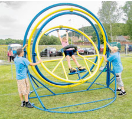
Novinkou bude simulátor stavu beztlíže.

Po protažení svalů si Příbramští mohou potrápit mozkové závity. V zóně Věda se