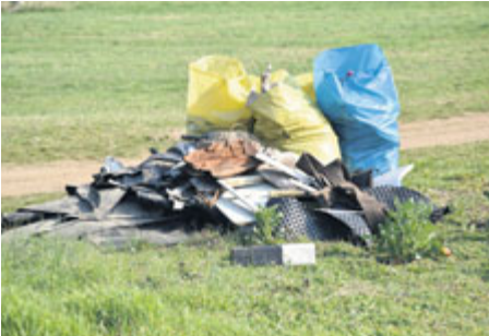
... se přírodě ulevilo od odpadků.

V sobotu 6. dubna se Příbram opět zapojila do celorepublikové akce Uklidme Česko. Úklidové „čety“ byly k vidění na řadě míst a díky nim Příbram opět prokoukla. „V letošním roce se akce zúčastnilo 120 dospělých a na čtyři desítky dětí. Celkem bylo sebráno 15 m 3 komunálního odpadu, 10 m 3 plastů a padesát pneu-