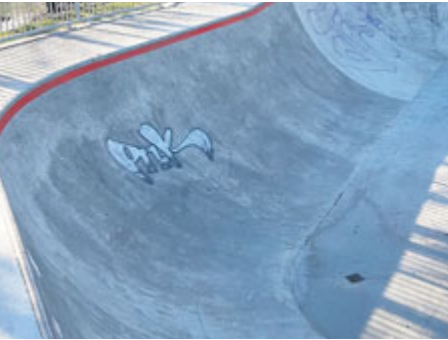
... a posprejovali překážky ve skateparku.