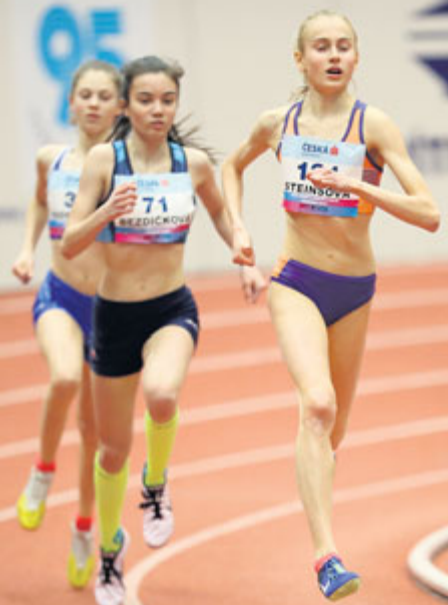
V Ostravě byly vidět soustředěné výkony,...

O víkendu 2. a 3. března se konalo Mistrovství republiky žáků v krásné moderní hale v Ostravě a naši atleti přivezli tři zlaté a jednu bronzovou medaili.