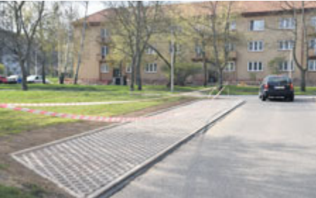
Zeleň, která už stejně neexistuje, bude postupně upravena na parkovací stání.

Vyčlenění pracovníci Technických služeb města Příbram budou kultivovat místa, kde se v současnosti parkuje, a přitom ničí tráva. Tyto partie ulic budou postupně osazovány zatravnovacími dlaždicemi.