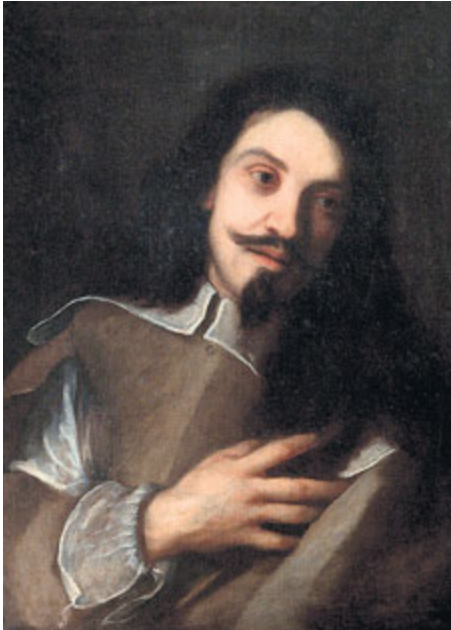
Karel Škréta Šotnovský ze Závovic.

Věnujeme-li se v našem seriálu umělcům, spojeným se Svatou Horou, nemůžeme pominout ani zakladatelskou osobnost české barokní malby Karla Škréty (1610–1674), byť jeho přímý tvůrčí přínos pro svatohorskou rezidenci není až tak zásadní.