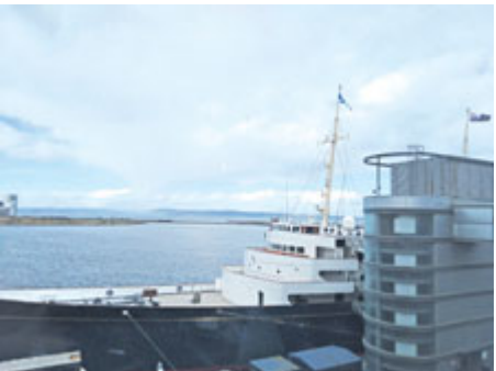
Při návštěvě královské jachty Britannia.

V posledním březnovém týdnu se vybraní žáci ZŠ Březové Hory účastnili tematického zájezdu do Skotska. Tato naše tradiční akce se velice vydařila a všichni se vrátili z cest v pořádku a s nadšením, které neochladilo ani pověstné nevlídné skotské počasí.