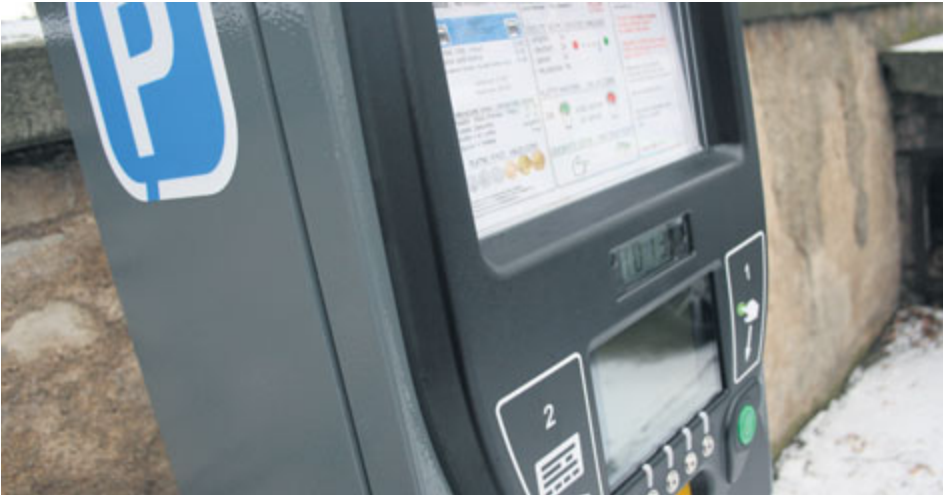
Chceme zvýšit výběr parkovného, aby se napříště mohlo do parkování více investovat.

Reaguji na příspěvek zastupitele Vladimíra Krále k tématu parkování v Příbrami a věcně podotýkám následující.