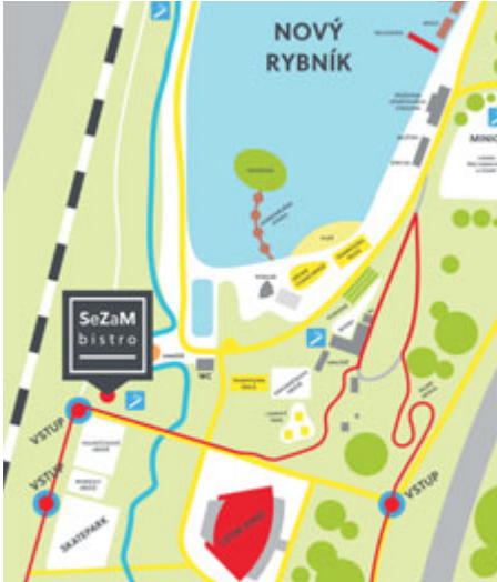
... a otevírá nové občerstvení SeZaM.

s nugátem. Samozřejmostí jsou teplé a studené nápoje: káva, čaj, pivo, limo nebo třeba kokosová voda, veganské mléko či pití pro děti. Součástí občerstvení je venkovní posezení se slunečníky. Projekt SeZaM bister vznikl v loňském roce, kdy Sportovní zařízení města Příbram zřídila vlastní gastro provoz. „Cílem bylo sjednotit nejen provozovatele jednotlivých občerstvení napříč středisky ve správě SZM, ale také společný vizuální styl,“ doplňuje ředitel SZM Jan Slaba.