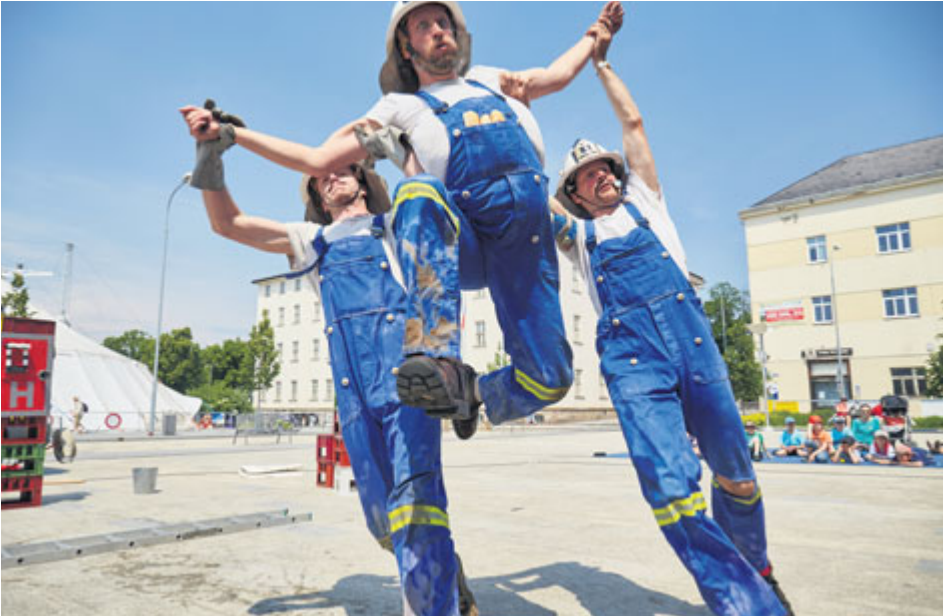
Bombéros ukáží, jak by to u hasičů fungovat rozhodně nemělo.

Nejmenší návštěvníky čeká program šitý na míru v letním kině, kde pro ně bude nachystané pásmo zábavných vystoupení. Děti si užijí kouzelnickou show, vystoupení Majdy z Kouzelné školky s Petrem Vackem nebo hasičskou