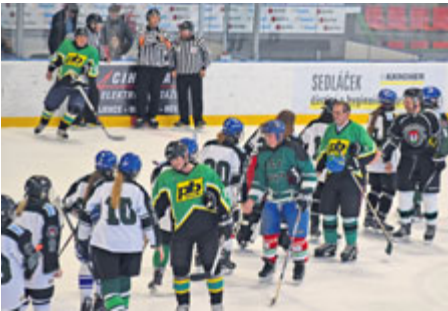
V utkání týmu žen proti VIP Příbram padlo 14 gólů.

Jméno Jaroslav Krůta je v příbramských sportovních kruzích známé především díky akcím jako Zakončení sezony 2018-2019. Tyto akce mají vždy charitativní podtext a tentokrát byla částka 15 600 korun vybrána na dobrovolném vstupném určena Spolku Ichtyóza.