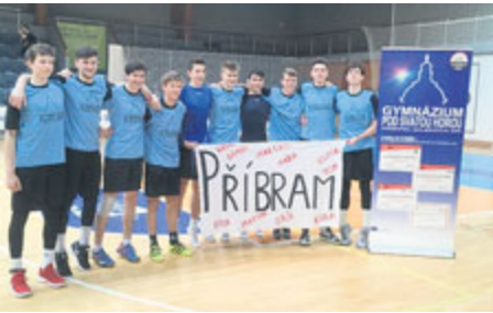
Družstvo Gymnázia pod Svatou Horou po vítězném tažení celou soutěží v odbíjené středních škol.