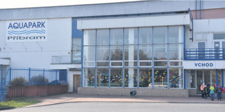
Aquapark vyžaduje rekonstrukci. Otázka zní, jak rozsáhlá by měla být.

V těchto týdnech příbramští zastupitelé intenzivně diskutují o nové podobě aquaparku. Tuto diskuzi zažehly nové posudky, které se zabývají ekonomickými parametry chystané stavby.