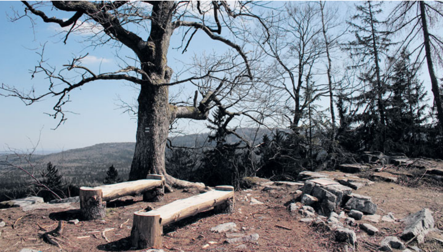
Březen na vrcholu Kloboučku.

Klobouček v Brdech patří k oblíbeným turistickým cílům. Před desítkami let tu stávala hájovna a zbytky lidského osídlení jsou patrné dodneška. Na vrcholu si lze odpočinout a přitom se kochat výhledem do krajiny.