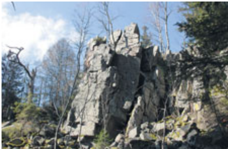
Mrazový srub na východní straně Kloboučku je asi 15 metrů vysoký.