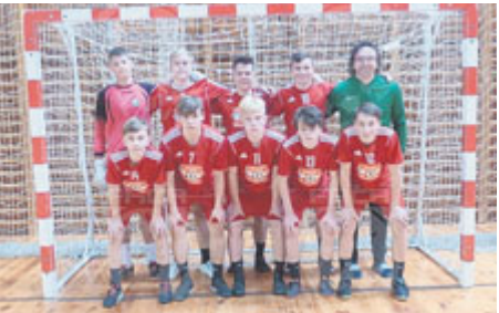
Březohorské týmy excelovaly.

Finálový turnaj školní futsalové ligy se hrál tentokrát ve Žďáru nad Sázavou. Skvělou připravenost a nasazení zde prokázala obě družstva Základní školy na Březových Horách.