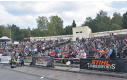
Timbersport vloni přilákal stovky zájemců.