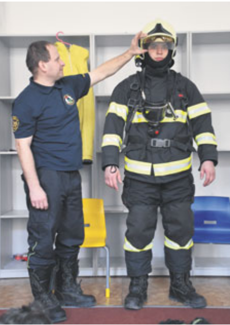
Děti poznaly, z čeho sestává oblek hasičů.