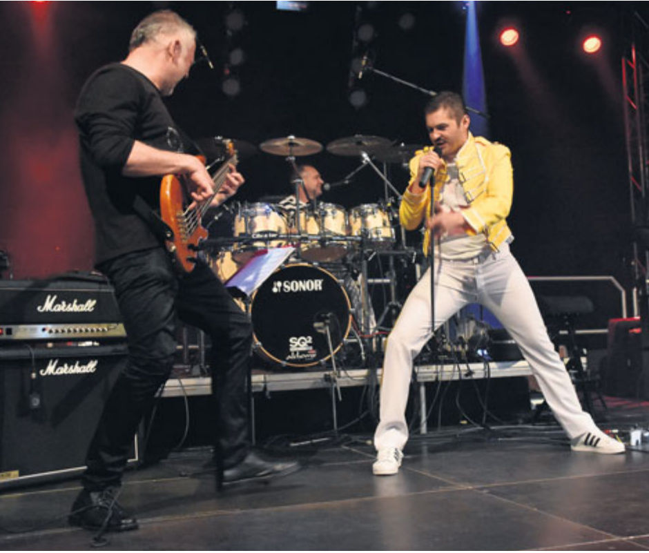
Téměř k nerozlišení od originálu: na Nováku vystoupí také skupina Prague Queen.