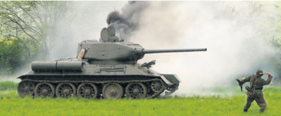
Ukázka bojů bývá nejatraktivnější součástí slivické připomínky.

Připomínka bitvy u Slivice se letos uskuteční 11. května. Na zájemce čeká historická i současná vojenská technika, ukázky bojů z konce 2. světové války i výstava techniky a vybavení armády nebo složek integrovaného záchranného systému.