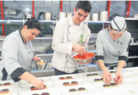
Práce příbramských cukrářů