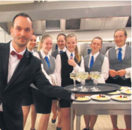
Studenti se pochlubili svým kulinářským umem.

Studenti a učitelé z Integrované střední školy hotelového provozu, obchodu a služeb Příbram se v pondělí 18. března vydali do partnerské hotelové školy Lycée Stanislas Polyvalent Regional Biotechnologies Hotellerie v Nancy.