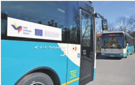
Do Pražské integrované dopravy budou začleněny nové linky na Příbramsku.

Od 29. června bude spuštěna I. etapa integrace veřejné dopravy na Příbramsku. Ta zahrnuje veškeré autobusové linky na trase Praha - Dobříš - Příbram, linku Hořovice - Příbram a dvě linky z Příbrami do oblasti Obecnice a Sádka. Systém PID, ve kterém lze na jednu jízdenku využívat vlaky, autobusy i městskou hromadnou dopravu, se rozšíří o šest autobusových linek, které nahradí částečně nebo zcela 17 stávajících linek SID. Na nových linkách bude platit tarif PID s možností využití přestupních jízdenek, časových kuponů včetně možnosti nákupu jednorázového jízdného platební kartou nebo pomocí mobilní aplikace PID Lítačka. Další informace zveřejníme v červnovém Kahanu.