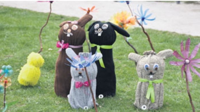
Před Velikonocemi připravili žáci škol venkovní dekorace pro náměstí T. G. Masaryka, 17. listopadu a J. A. Alise.