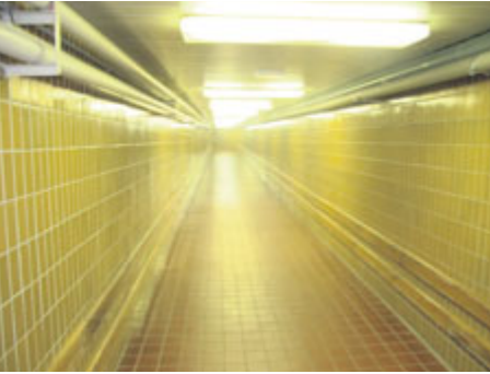
Podzemní koridor spojuje pavilon I se zbytkem příbramské nemocnice.

Rekonstrukce pavilonu D4 příbramské nemocnice znepřístupnila podzemní spojovací koridor. Ze stejného důvodu bylo nutné přesunout babybox, který se na původní místo vrátí během léta.