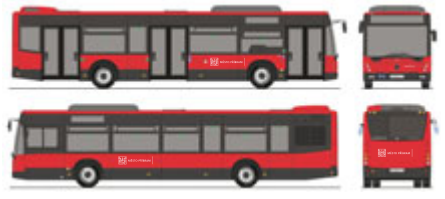
Takto by měly vypadat nové autobusy. Půjde o Mercedesy, které dostanou nový červeno-černý vzhled.

Nejde jen o pořízení samotných autobusů, ale také vybudování plnicí nebo dobíjecí infrastruktury.