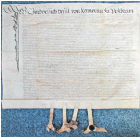
Listina Jindřicha Pešíka z Komárova, 8. srpen 1525, s pečeti.