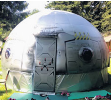
Velkým zážitkem pro děti je mobilní planetárium.

Program Novák Festu je rozdělen do několika sekcí. V zóně Sport pod vedením zkušených profesionálů si návštěvníci vyzkoušejí řadu sportovních disciplín, například fotbal, hokej, volejbal nebo judo. Víte, co je aerotrim?