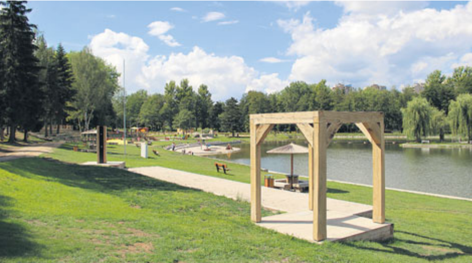
Po zimní přestávce ožívá odpočinkový areál Nový rybník...

Nové občerstvení v areálu Nový rybník se nachází v blízkosti skateparkového hřiště, otevřeno bylo na začátku dubna letošního roku. Provozují jej Sportovní zařízení města Příbram.