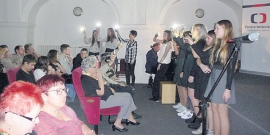
Žáci zazpívali skladby, které zněly na Václavském náměstí v Praze v roce 1989.

Příbramští školáci a pedagogové vystoupili na Mezinárodním festivalu Mene Tekel v Praze. Spolku Dcery 50. let byl vyhrazen 28. únor 2019 pro vytvoření programu pro školy a veřejnost s tématem Pronásledování rodin v době nesvobody.