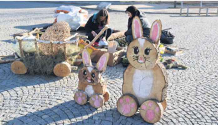
O velikonoční výzdobu na nám. T. G. Masaryka se postarala také ZUŠ Antonína Dvořáka ve spolupráci s Městskými lesy a Technickými službami.