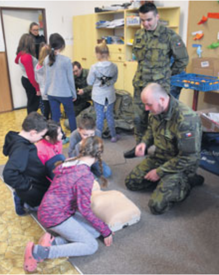
Na programu byla také ukázka resuscitace.