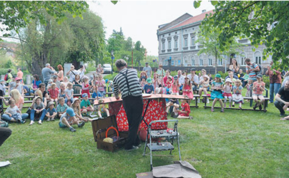
Korzo je celodenní přehlídkou a pohodou pro velké i malé.

Korzo Obora letos vstupuje do svého jubilejního desátého ročníku. Celodenní hudební a divadelní festival, který pořádá Spolek ve čtvrtek na Dvořákově nábřeží v Příbrami už tradičně poslední květnovou sobotu, nabízí program všem návštěvníkům opět zcela zdarma. Na co se tedy můžete 25. května těšit?