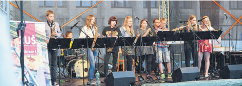
V Příbrami se představí hned několik uměleckých škol.

Základní umělecké školy na Příbramsku se připojují k jednodennímu happeningu ZUŠ Open a představí se koncem května na náměstí T. G. Masaryka v Příbrami.