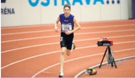
i osobní rekordy.