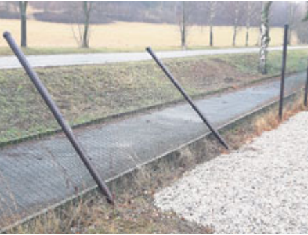
Vandalové poškodili plot u nového minigolfu...

Několik patrně frustrovaných jednotlivců v poslední době demoluje zeleň a mobiliář města. Po projevech vandalismu na cyklostezce do Bohutína přišel „na řadu“ opět Nový rybník.