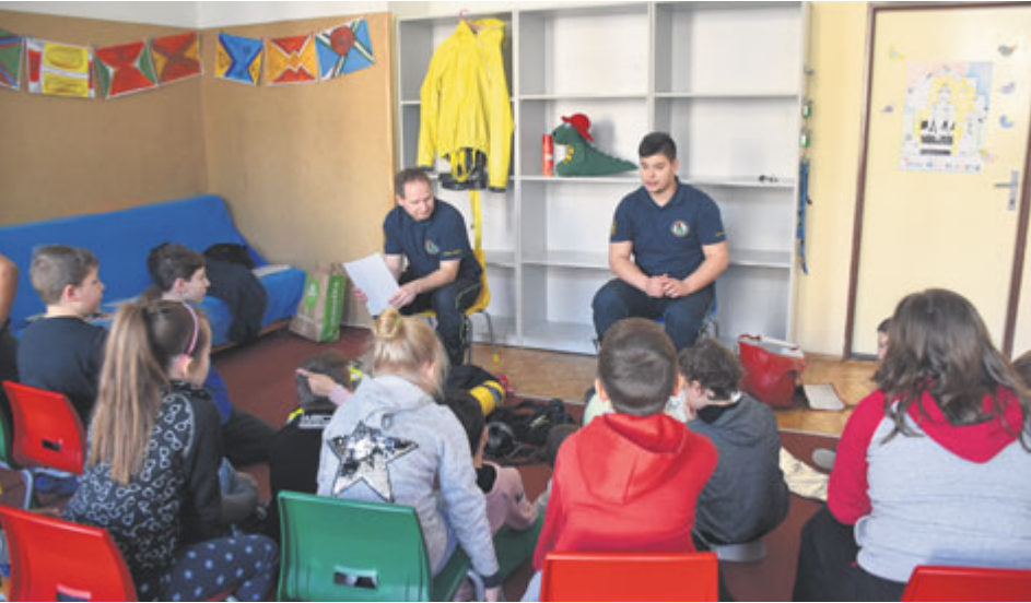
Preventisté měli za úkol navštívit všechny příbramské školy.

Za žáky příbramských základních škol se vydali vojáci, policisté, hasiči, lékaři nebo záchranáři. Cílem akcí byla prevence kriminality a zvýšení povědomí dětí o tom, jak se chovat v dopravě nebo v krizových situacích.