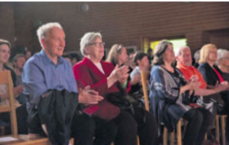
Pamětníci na závěrečné prezentaci v Příbrami.

Celkem deset týmů ze zapojených základních a středních škol (Waldorfská škola, ZŠ