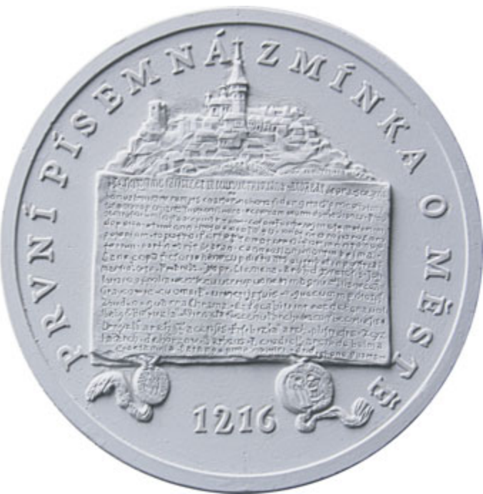
Sádrový model pamětní medaile.

Pamětní medaile o průměru 40 milimetrů a rylosti 925/1000, které jsou vydávány při příležitosti letošního 800. výročí, jsou vyraženy v omezeném počtu 350 kusů. Očekává se, že medaile v prodejní ceně 1780 korun budou vzhledem k pozdější sběratelské hodnotě zanedlouho rozebrány.