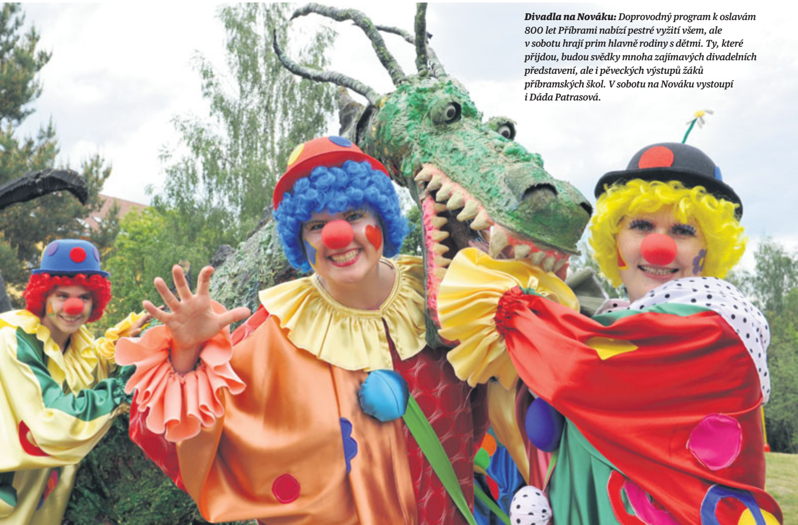
Divadla na Nováku: Doprovodný program k oslavám 800 let Příbrami nabízí pestré vyžití všem, ale v sobotu hrají prim hlavně rodiny s dětmi. Ty, které přijdou, budou svědky mnoha zajímavých divadelních představení, ale i pěveckých výstupů žáků příbramských škol. V sobotu na Nováku vystoupí i Dáda Patrasová.