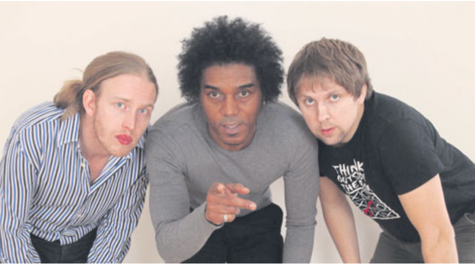
Hlavní hvězdou zahajovacího koncertu Příbramského kulturního léta bude Dani Robinson Band.

I v letošním roce oslav výročí našeho města přicházejí kulturní, letopisecká a památková komise a odbor školství, kultury a sportu s nabídkou koncertů v rámci Příbramského kulturního léta. A oproti loňsku došlo k několika příznivým změnám.