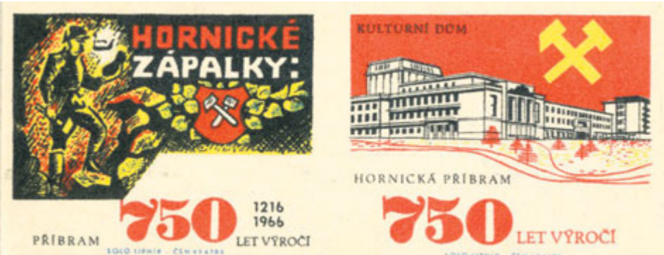
Před 50 lety byly vydány nálepky na zápalkové krabičky, odznaky města s letopočtem 1216-1966 a se stylizovaným znakem města Příbram a poštovní razítko.

Příbramští úředníci byli žádáni, aby zakročili proti „vlasatcům“, kteří v Příbrami svým vulgárním chováním a neupraveností oblečení a dlouhými vlasy budili pohoršení.