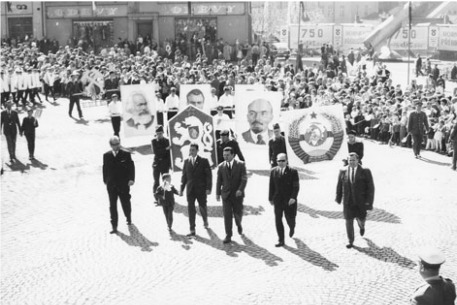
Z oslav 1. máje 1966 v Příbrami. V pozadí lze vidět tabule informující o 750. výročí i část neslavně proslulé příbramské rakety.

Přišel rok 1966, který byl podle Městské kroniky „jubilejním rokem 750. výročí zalo- žení (!) horního města Příbramě, rokem XIII. sjezdu Komunistické strany Československa a také rokem zahájení zdokonalené hospodář- ské soustavy a rokem zahájení 4. pětiletky.“ V Příbrami žilo kolem 32 000 obyvatel. Rada města v únoru schválila socialistický závazek, v němž bylo i odpracování 90 000 brigádnic- kých hodin na zvelebení města. Město bylo vyzdobeno květinami, před Domem kultury byla plocha osázená květinami, v jejichž stře- du vynikala vysázená skupina číslic 750.