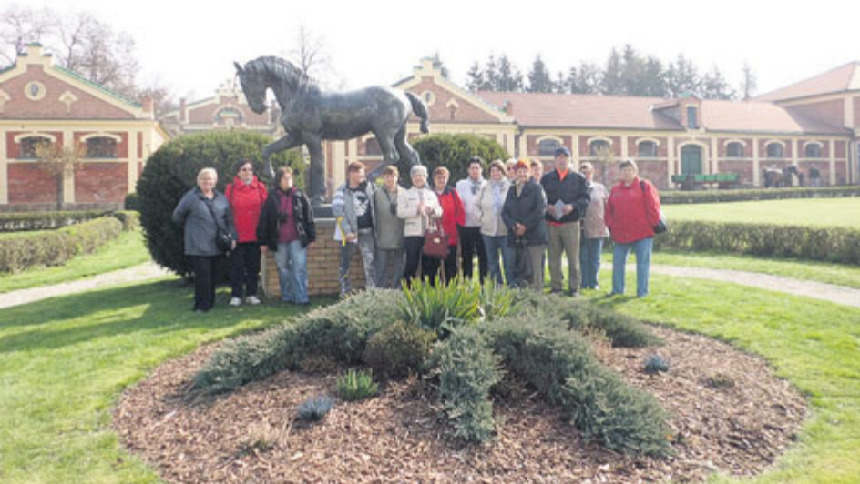
Z nedávného výletu příbramského Senior Pointu do Písku.

Příbramský Senior Point přichází s takzvanou Identifikační kartou seniora města Příbram, která svého držitele opravňuje k čerpání slev a výhod partnerských subjektů. Požádat o ni lze v Senior Pointu v Žežické ulici.