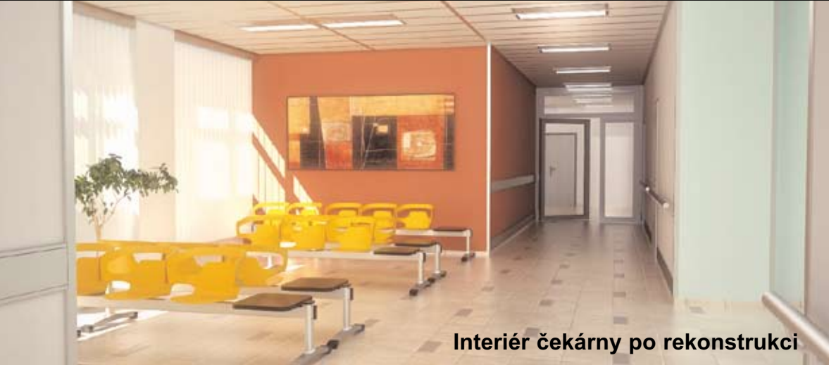
Interiér čekárny po rekonstrukci