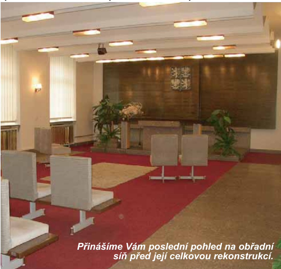
Přinášíme Vám poslední pohled na obřadní síň před její celkovou rekonstrukcí.

● Lhůta výběrového řízení na dodavatele stavby rekonstrukce autobuso-