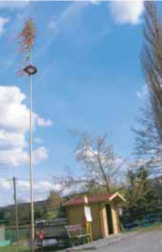
Krásně ozdobená májka Vás vítá při vjezdu do Jerusalema.