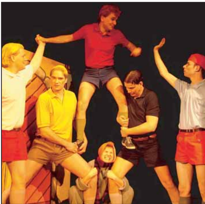
Další premiérou v Divadle Příbram byly Rychlé šipy od Jaroslava Foglara. Určitě si toto představení nenechte ujít.