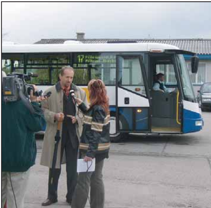
V úterý 2. 5. byl slavnostně zahájen provoz nové linky MHD č. 17. Linka pojedje přes sídliště, Březové Hory do Jiráskových sadů.