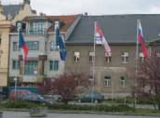
Na náměstí T. G. Masaryka jsou vyvěšené nové vlajky. Zleva: vlajka ČR, EU, Středočeského kraje, města Příbram.

V rámci výstavy Příbram 2006 předvedou hasiči v pátek 12. 5. tzv. Barevnou vodní fontánu . Přijďte na Nový rybník, produkce bude zahájena po setmění. Srdečně Vás zveme.