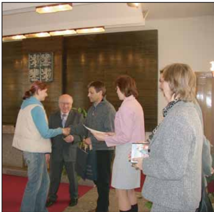
V obřadní síni byli vyhodnoceni studenti, kteří zvítězili v dějepisné soutěži. Jejimi pořadateli byli učitelé dějepisu Obchodní akademie a Vyšší odborné školy Příbram.