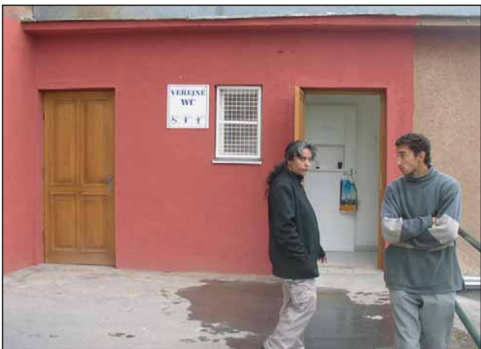
Na náměstí 17. listopadu byly zrekonstruované veřejné záchodky. Starají se o ně Technické služby Příbram. Otevřeno je v pondělí - pátek od 9 do 17,30 hod., v sobotu od 9 do 12 hod.