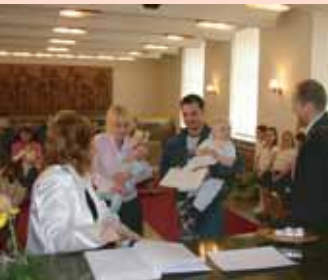
O vítání občánků je velký zájem. Po rekonstrukci obřadní síně v Zámečku - Ernestinu bude tato tradice opět pokračovat.