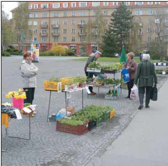
Na náměstí 17. listopadu už prodávají trhovci zemědělské výpěstky. Je to další neklamné znamení, že jaro opravdu začalo.