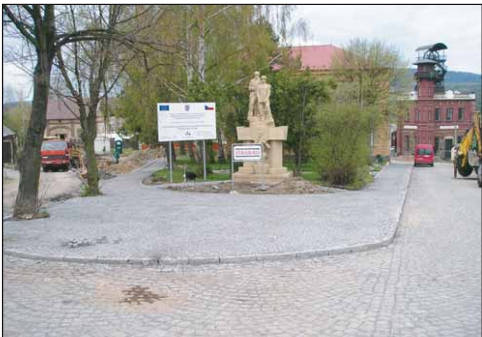
Přístupová cesta k Hornickému muzeu je již částečně zrekonstruovaná. Akci zajišťuje město a obdrželo na ni grant z Evropské unie z programu PHARE. Celá akce bude dokončena v červnu letošního roku.