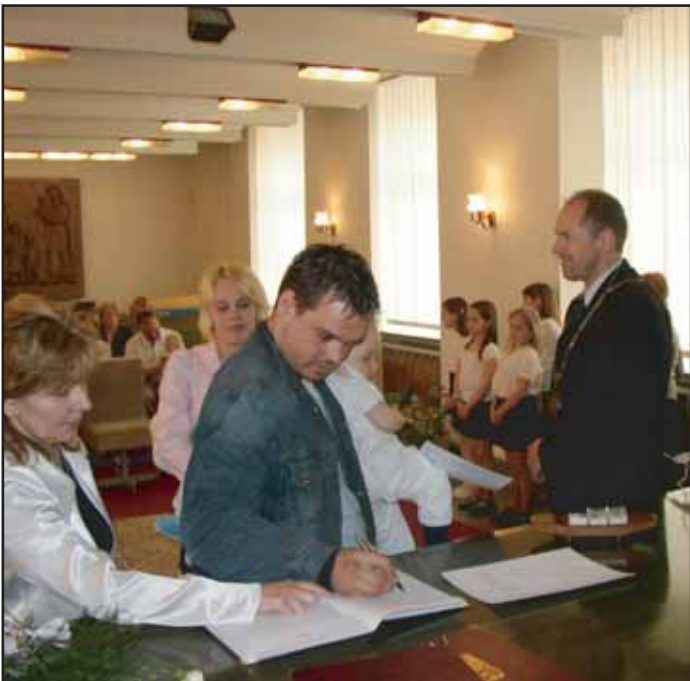
Ve čtvrtek 27. 4. se konalo v obřadní síni v Zámečku - Ernestinu poslední vítání občánků před plánovanou rekonstrukcí této slavnostní místnosti. V těchto dnech je již rekonstrukce v plném proudu.