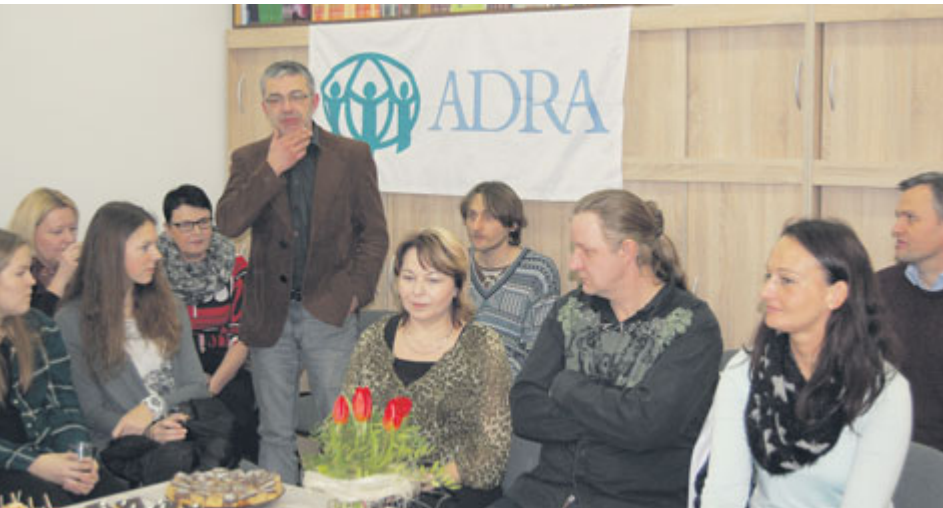
Program pod názvem Kamarád hledá kamaráda zahájila Adra ve spolupráci s Oddělením sociálně-právní ochrany dětí Městského úřadu Příbram.

V Příbrami dostávají další příležitost všichni, kteří chápou, že volný čas, energie a zájem věnovaný druhému jsou společenskou investicí, již peníze nevyváží.