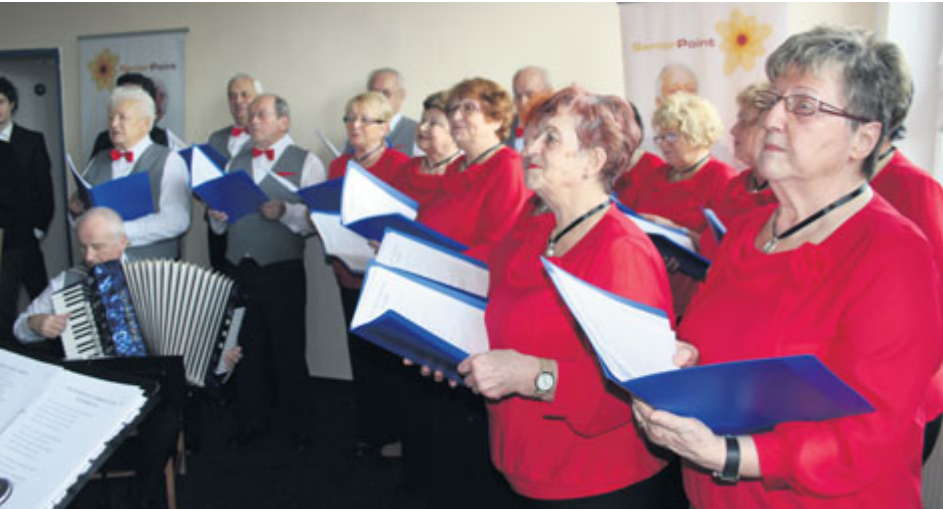
Z letošního otevření Senior Pointu v Příbrami

Výlet na Šumavu, do Průhonic nebo Čeliny, přednáška o bezpečnosti, návštěva příbramského archivu, taneční odpoledne nebo promítání filmu s Alenou Mihulovou a Bolkem Polívkou. To jsou lákadla příbramského Senior Pointu pro následující dny a týdny.