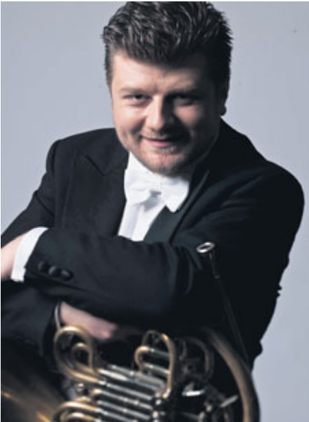
Famózní hornista Radek Baborák otevře pomyslnou bránu tohoto ročníku festivalu.

fiční koncert pro vilu Rusalka ve Vysoké u Pří-bramě. Pozvání na festival přijali umělci světo-vého renomé v čele s operním pěvcem Štefanem Margitou či hornistou Radkem Baborákem, jehož koncert celý festival otevře.