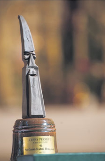
Ocenění Český permon.

KOSTEL SV. VOJTĚCHA 18.00-19.30: Předávání cen Český permon