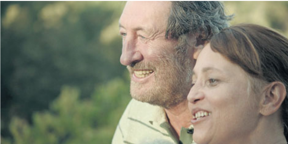
V dubnu čeká návštěvníky Senior Pointu promítání filmu Domácí péče