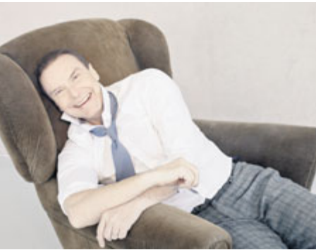
Koncert Štefana Margity připomene životní jubileum světově uznávaného tenoristy a zároveň uzavře 48. ročník festivalu.